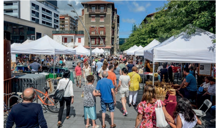
Okendo plazaren itxura, igande eguerdian.

Azken urteetan omenaldia izan da arretagune nagusia. Aurten erabaki dute inor ez omentzea, sukaldariak erakartzea "zaila" delako. Erabaki horrek ez die artisautza postuetara hurbiltzeko gogoia kendu herritarrei, eta, arestian esan bezala, egun osoan zehar altua izan da salerosketa erritmoa. Merezitako atsedena hartuko dute antolatzaileek orain, 35. edizioa prestatzen hasi aurretik.