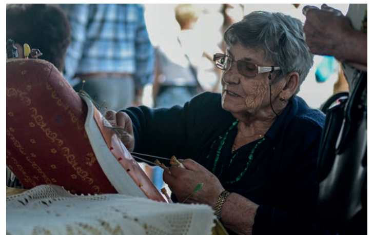
Urtero bezala, ehoziri-lanak egin ditu Lasarte-Oriako taldeak. TXINTXARRI