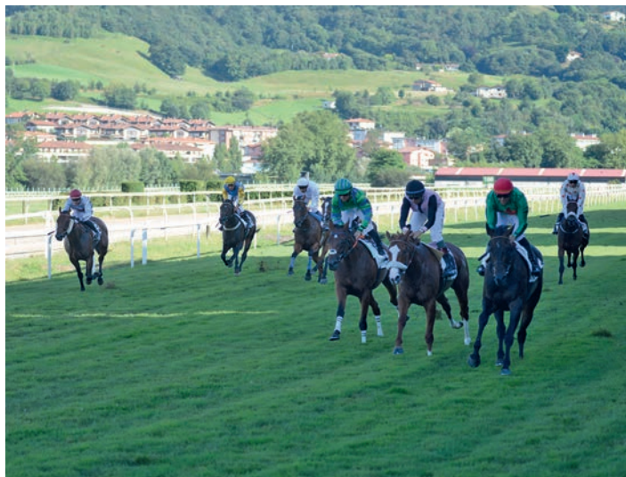
Bruneta zaldia gailendu zen Yeguada Torredueiro sarian. TXINTXARRI

Urrezko Koparako bi prestaketa proba jokatu ziren igandean. Le Rafale irabazi zuen horietako bat, eta Red Onion ingelesak bestea. Aditu eta zaleen artean zeresan handia sortu du azken egunotan. Joan den urtean Poule proba entzutetsurako prestaketan parte hartzeraz iritsi zen zaldia, baina orduz geroztik asko jaitsi zuen maila. Hori ikusita, bere aurreko jabeek saldu egin zuten aurtengo otsailean, eta, gaur egungo prestatzaileen eskutik, maila onena ari da berreskuratzen