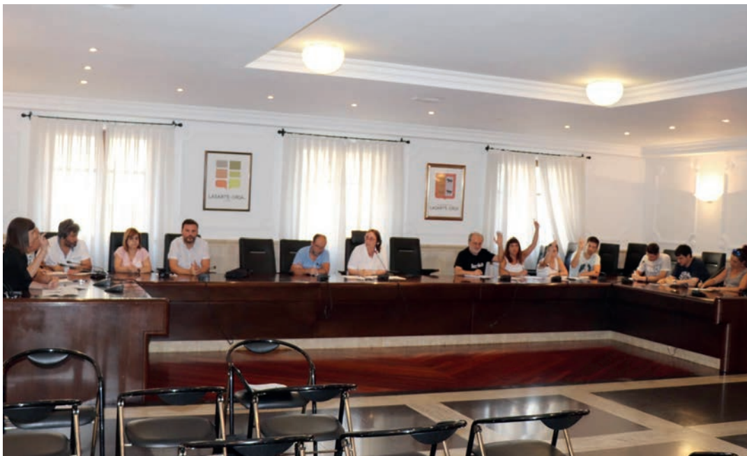
Zinegotziak ez ohiko udalbatzarrean, joan den asteartean. TXEMA VALLES