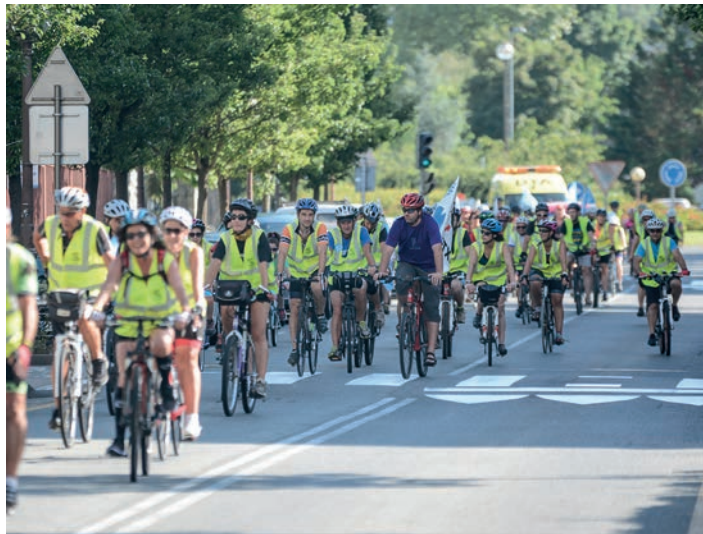
Atsobakarreko biribilgunean bat egin zuten herritarrek martxarekin. TXINTXARRI

Esan bezala, Atsobakarreko biribilgunean egin zuten bat herriko txirrindulariek tropelarekin. Tajamar aldera