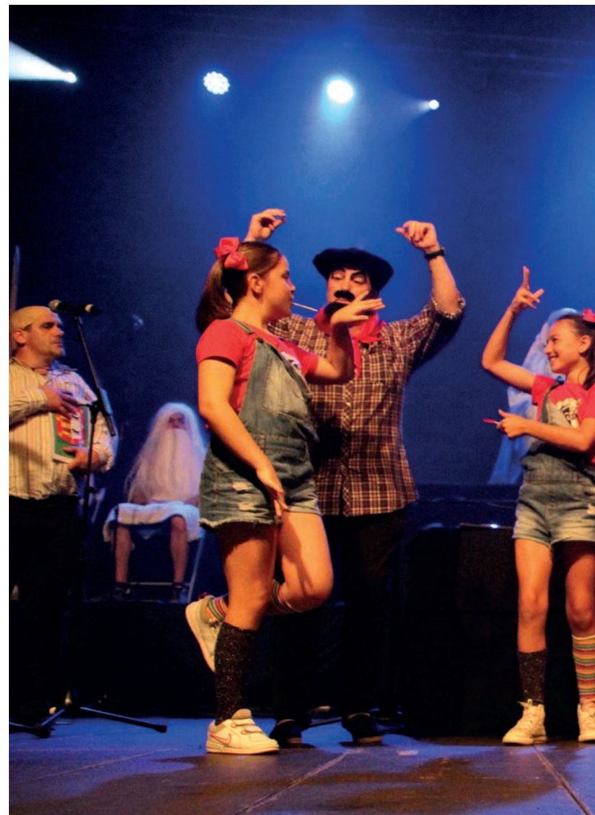
Musika, dantza eta umorea. Ezaugarri horiek ongi ezkondu dituzte parodian. TXINTXARRI