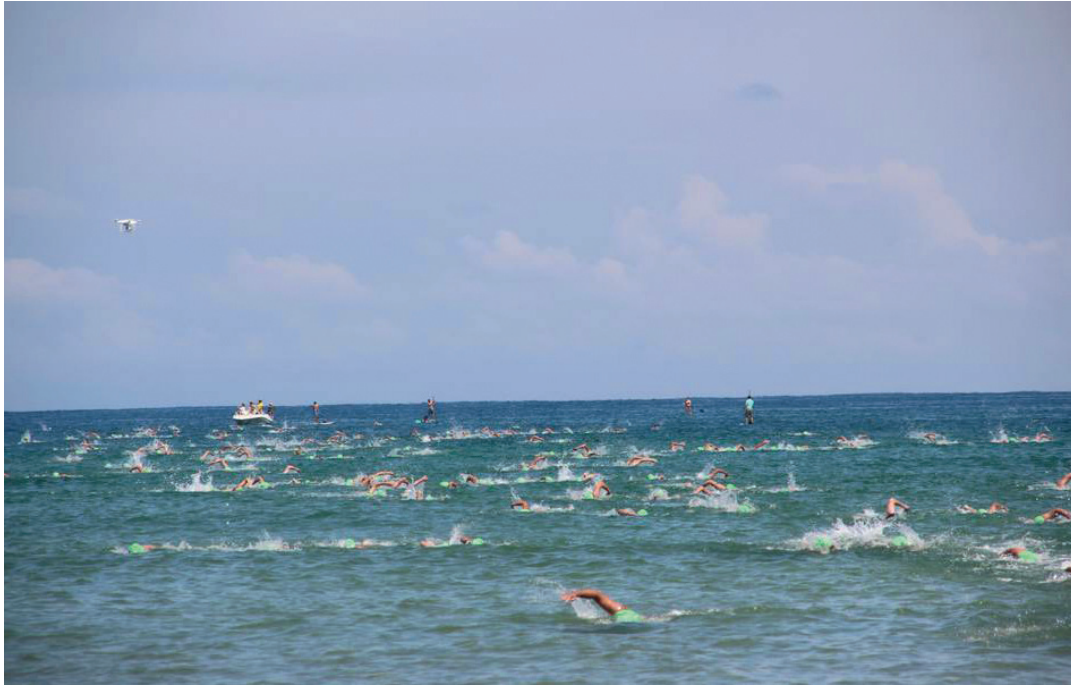
Talde berdeko igerilariak, Zarautzera iristear daudela. ZARAUZKO HITZA