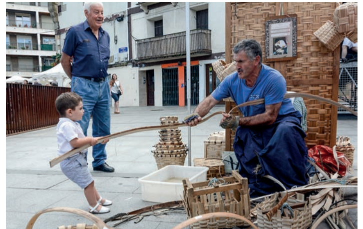
Gaztetxo honek laguntza ederra eman zion otargileari. TXINTXARRI