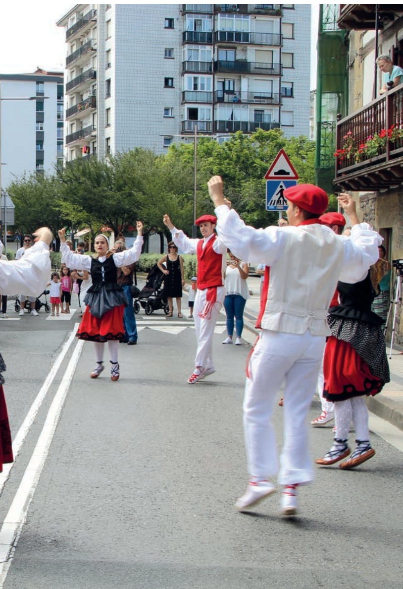
ur bildu dira dantzariak ikustera. TXINTXARRI