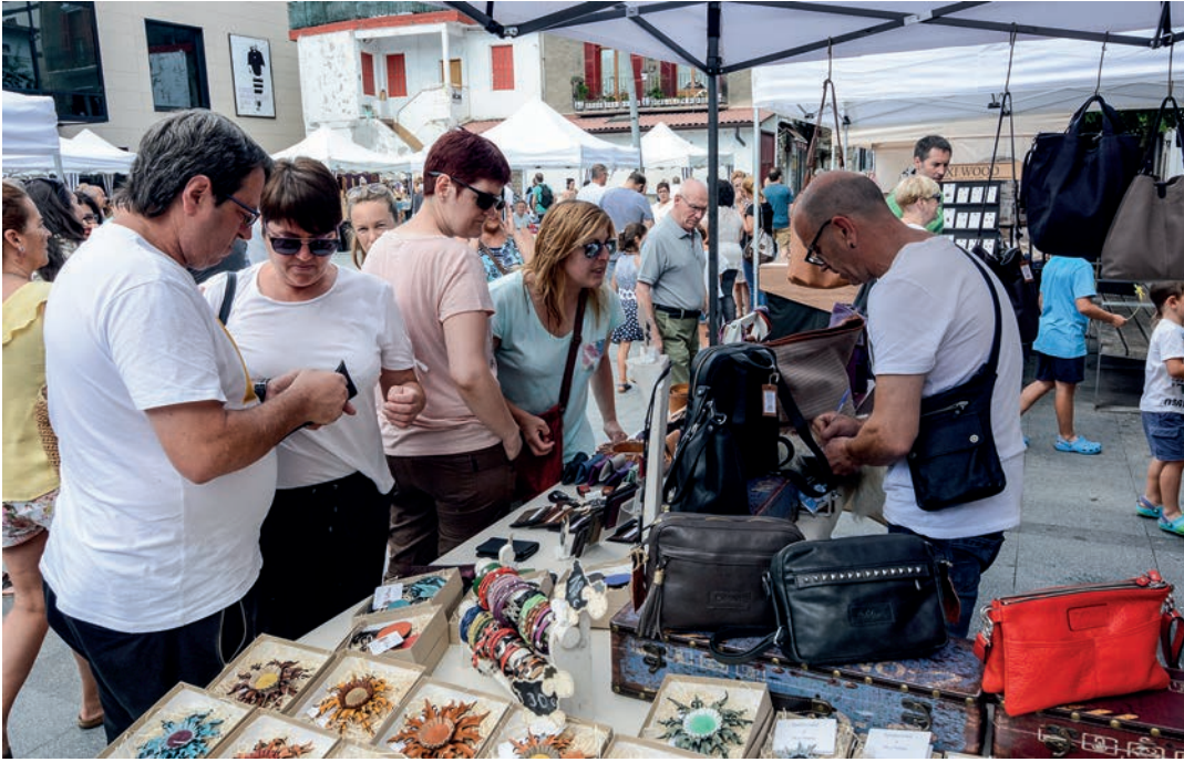
Igande osoan ibili dira herritarrek azokako postuetako produktuak ikusten eta erosten. TXINTXARRI