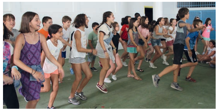
Gazte zinemaldiko lanak ikusi ostean, ederki egin zuten dantza. TXINTXARRI