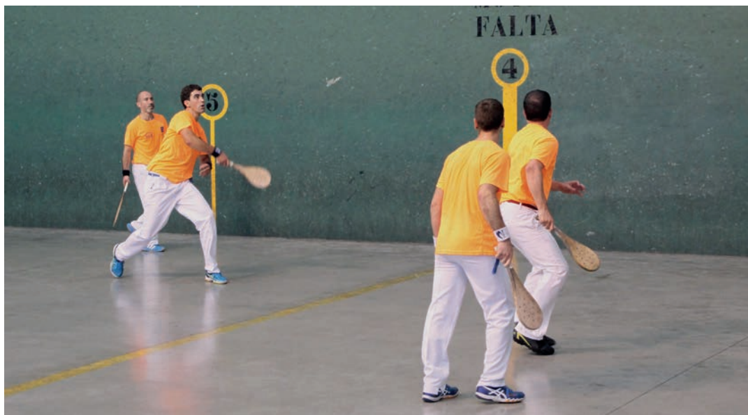
Finalean huts gutxi egin ditu Arteaga atzelariak.