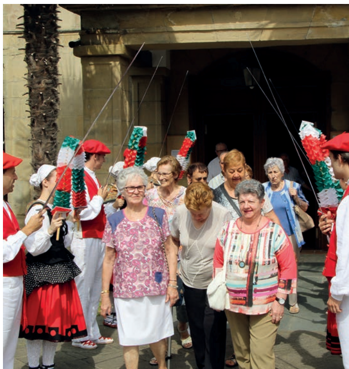
Hainbat herritar izan dira mezan. Irudian, Erketzeko kideak arkuak jartzen.