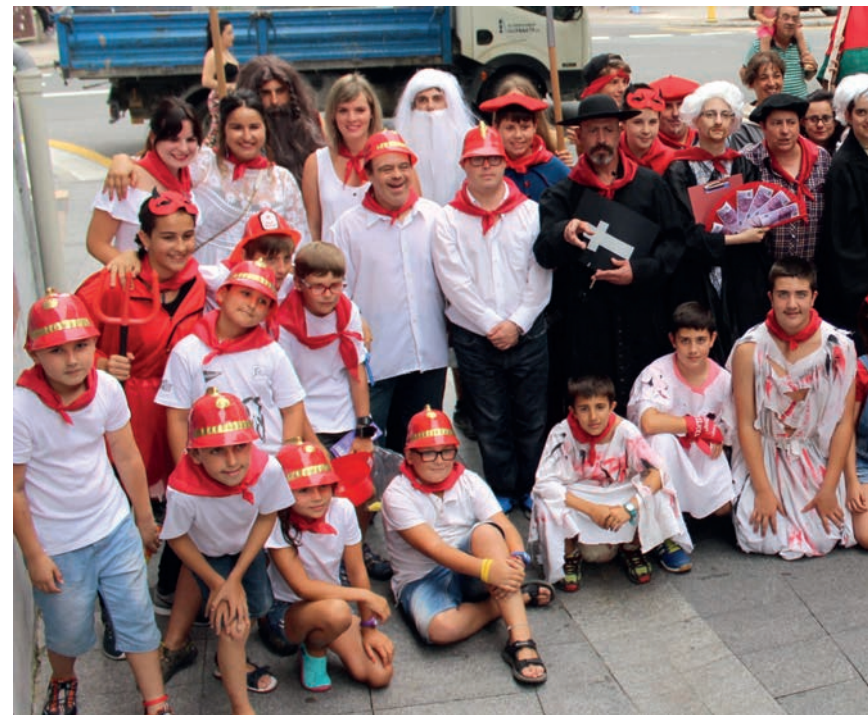
Taldeko argazkia, arratsaldean, benetako ordua iritsi aurretik.