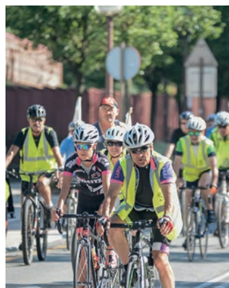
Lasarte-Oriatik pasa zen. TXINTXARRI

Aipatutako bi espetxeak modu sinbolikoan lotzeaz gain, bizikleta itzuliaren beste helburuetako bat ere bada salbuespen egoera salatzea eta harekin amaitzeko eskatzea.