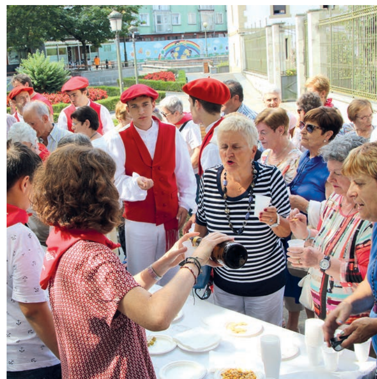
Hamaiketakoa dastatu dute Brigitarren komentura hurbildu diren herritarrek. TXINTXARRI