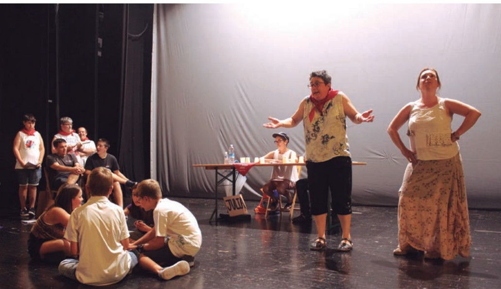
Parodiako aktoreak ostegun arratsaldeko azken entseguan.