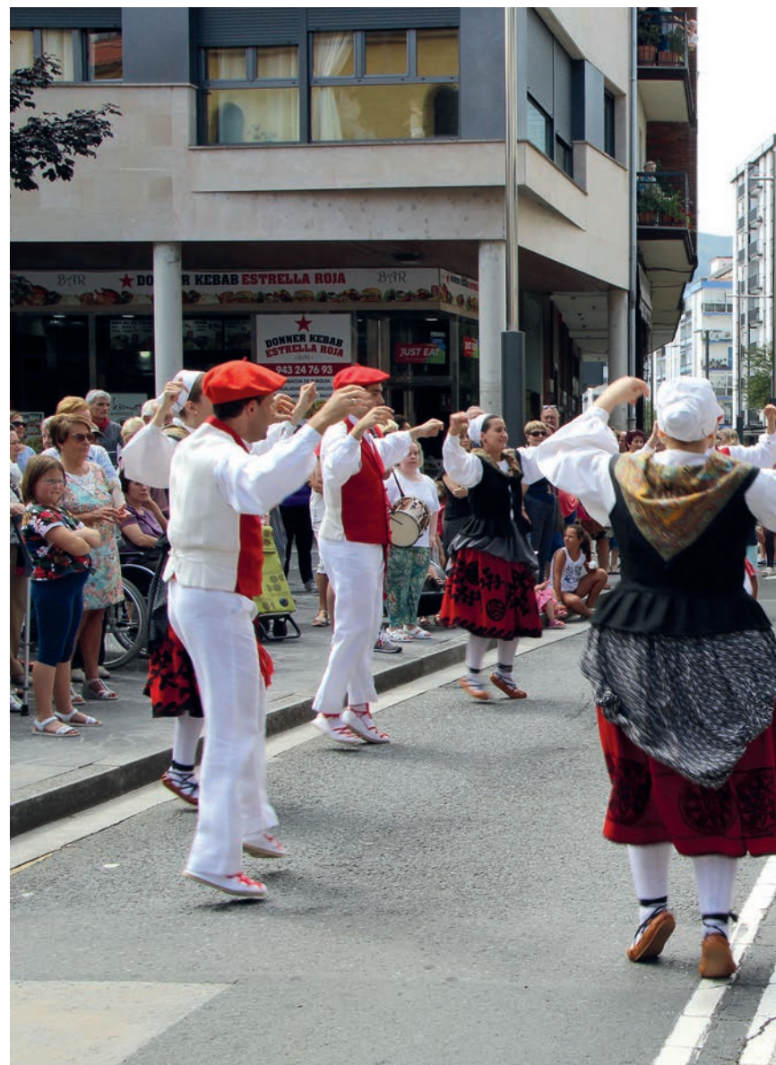
Erketz EDTko lagunek mezan eta Santa Ana karkaban agurra dantzatu dute. Karkabara herritar ugari h