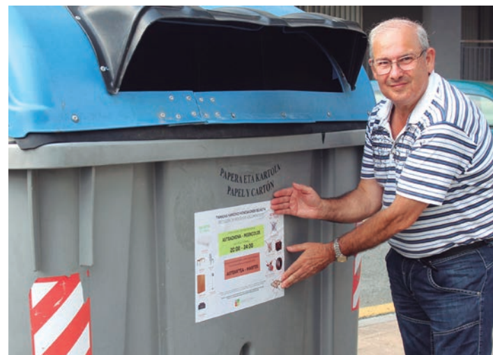
Sasoeta ibilbidean, Buruntzaldea kalean, pilatzen da zabor gehien. TXINTXARRI

Obra hondakinak, komun ontziak, bateriak, margo hondakinak, gurpilak eta paletak ateratzea debekatuta dago. Koltxoiak, mahaia, aulkiak, armairuak, lanparak eta besaulkiak dira atera daitezkeenak.