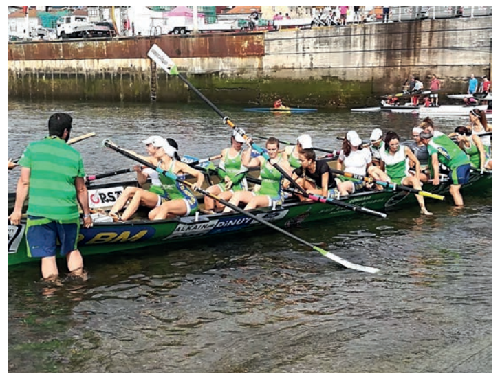
Hondarribiko trainerua, itsasoratzean. HONDARRIBIA ARRAUN ELKARTEA

Aurten emakumezkoen traineruetan bi liga sortu dituzte. Goi mailakoan, Euskotren Ligan, lau taldek lehiatzen dute (Orio, Hondarribia, San Juan eta Gu-Arraun). Liga ETEn bederatzita talde daude, tartean Donostiarra, Fernandezek talde ohia.