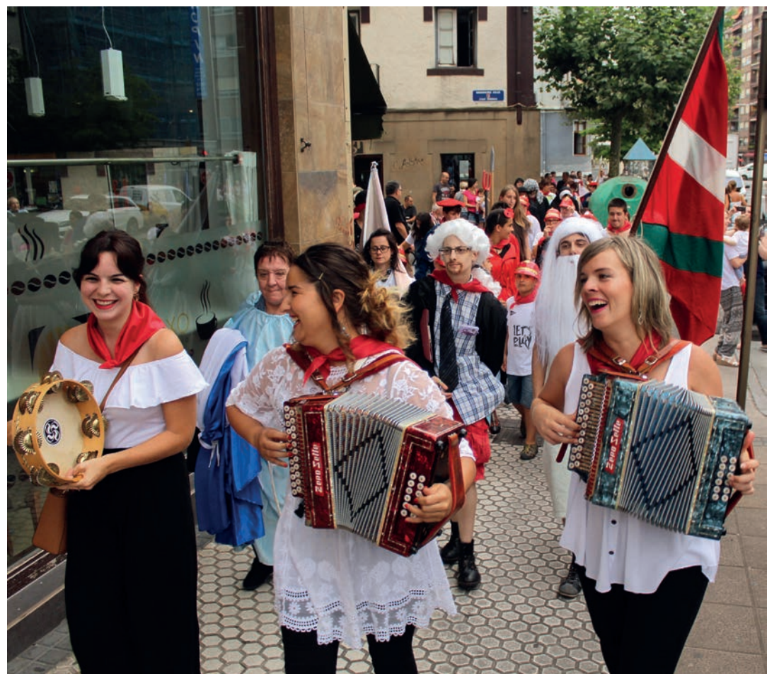
Afaltzera joan aurretik desfilea egin dute, trikitilariak lagunduta.