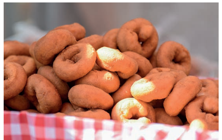
Erroskila goxoak, beti tentagarri. TXINTXARRI