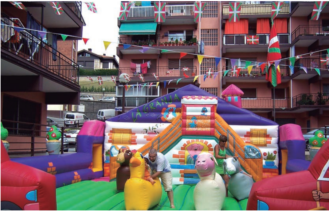
Basaundi Bailarako festen artxiboko irudi bat.