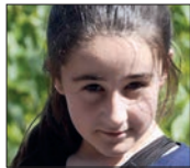
Mirari Eneeee...Ta bat-batean 13!!! Zorionak matraka, asko maite zaitugu!!!! Izan zoriontsu!!!