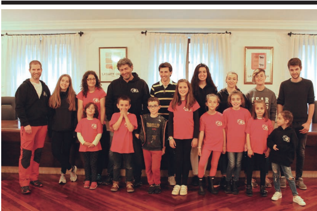
Gaztetoenak arduratuko dira haurren txupinazoaz, eta helduak arratsaldekoaz. TXINTXARRI