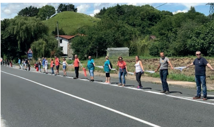
Lasarte-Oriako bi kilometroetako hainbat irudi. GURE ESKU DAGO