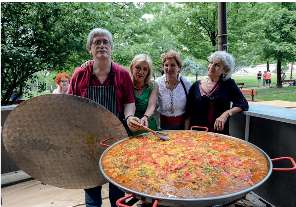
300 lagun inguruk paella goxoa jan zuten. Semblante Andaluzeko sukaldari taldeak prestatu zuen. TXINTXARRI