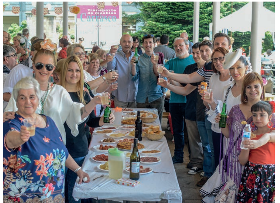
Udal ordezkariak, artista gonbidatuak eta Semblante Andaluzeko kideak, topa egiten. TXINTXARRI