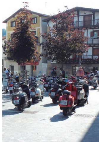
Motorren erakusketa. TXINTXARRI

Egitarau zabala osatu dute. Ibilbidea egiteaz gain, kontzertuak, erakustaldiak eta sari banaketa ere izango dira. Jatekoa eta edateko ere ez dira faltako.