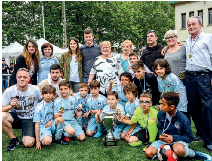
Martija familiak talde argazkia atera du Antiguoko KEko jokalariekin.

Goizeko bederatzietan ireki ditu ateak Michelinek. Antolatzaileek 09:30erako hasi nahi zuten norgehiagokekin, eta jo eta su egin dute lan minutu bakar batez ere ez atzeratzeko. Baita lortu ere. Zelaia zozkatu eta gero, erdiko sakeak egin dituzte aurreneko taldeek. Goiz osoan zehar aritu dira aurtengo