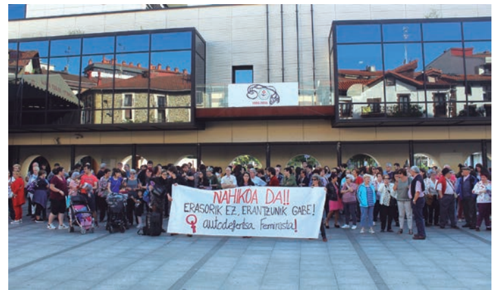
Lasarteoriatarrek Okendo plazan salatu dituzte erasoak. TXINTXARRI

Galdera eta erreguen orduan herritarrek hitza baliatu dute. Lasarte-Oriako Talde Aktibistak denda txikien eta lan duinaren aldeko manifestua irakurri du. Hain zuzen, ordu berean elkarretaratzea deitua zuten udaletxe parean, saltoki handien hedapena salatzeo.