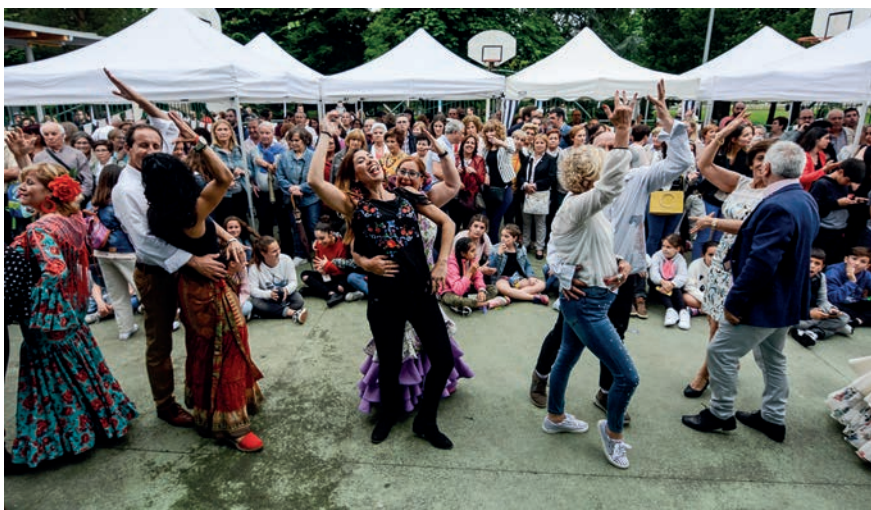
Larunbatean sekulako giroa egon zen Atsobakarren. Bertaratutakoek nekatu arte dantzatu zuten.