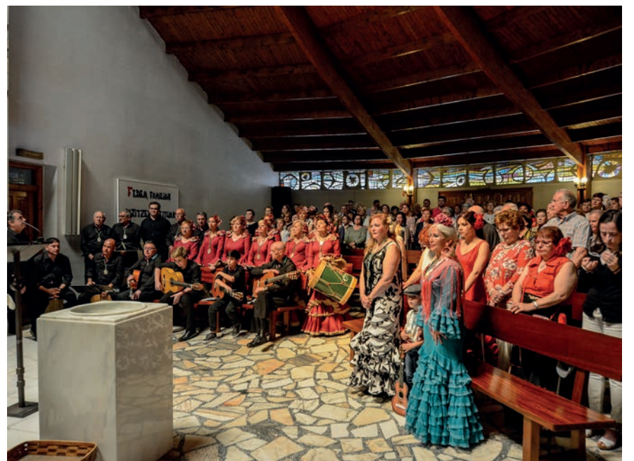
Lepo bete zen Arantzazuko Ama eliza igandean, meza rozieroan. TXINTXARRI