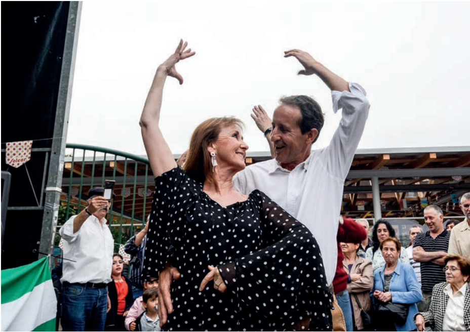
Indarrak agortu arte dantzatu eta kantatu dute herritarrek Rocioko erromerian.