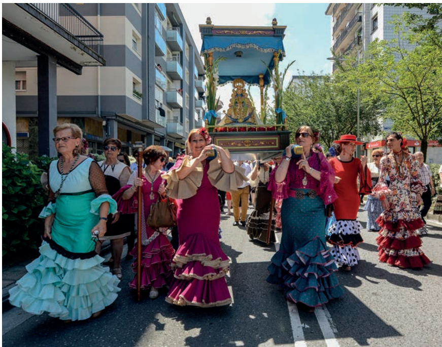
Meza rozieroa eta gero, sorbaldan hartuta eraman dute Rocioko ama birjina Atsobakarrera. TXINTXARRI