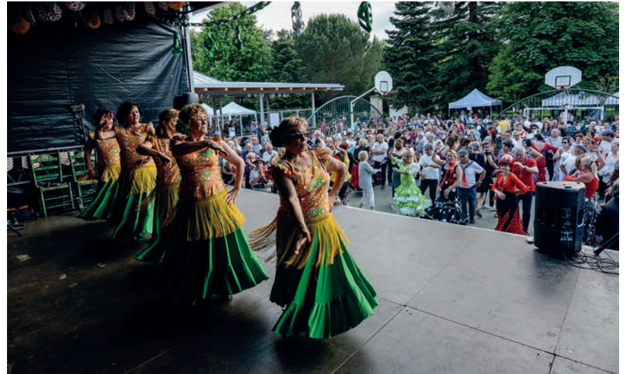
Erretereriako Concha Rociera taldeak emanaldi ederra eskaini zuen igande arratsaldean.

Rocioko erromeria ospatu du asteburuan Semblante Andaluzek