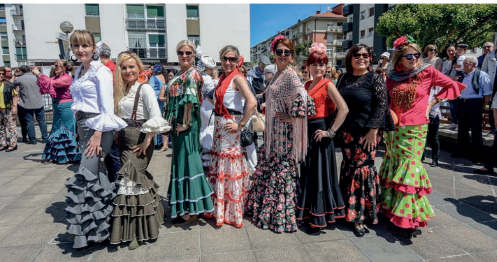
Herritarrek euren jantzi dotoreenekin atera ziren kalera igandean. TXINTXARRI

Rocioko erromeria bukatu eta hurrengo eguna astelehena zelako, eta errutinara bueltatu behar zutelako. Igandean ere ezkutatu egin zelako eguzkia, eta apenas ikusten zelako ezer. Bestela, ziur aski, kantuan eta dantzan jarraituko lukete Semblante Andaluzeko kide eta lagunak, indarrak agortu arte. Asteburu osoa pasa zuten ospakizunetan, Atsobakar parkean. Goibel hasi zen larunbata, euritsu, baina, zorionez, gutxi iraun zuen, eta arratsalde partean giro ederra egon zen karpan eta eszenatoki inguruan. Igandean egun bikaina egin zuen, eta primeran aprobetxatu zuten.