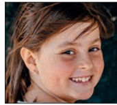
Garazi Zorionak bihotza!!! Ondo pasa zure 10. urtebetetzean eta egin beti irribarre! Maite zaitugu.