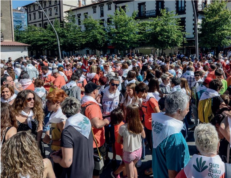
Etorbizuna erabakitzearen aldeko zapi, kamixetak... Lasarte-Oriako herritarrek Okendo plazan bildu dira.