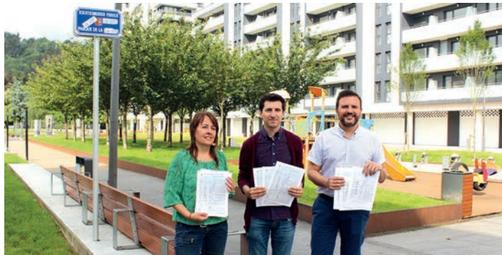
Udal ordezkariak, prozesua aurrera eramango duen Emun enpresakoekin.

Idea guztiak aztertu, eta bideragarriak aurrera eramango dira. Horretarako, berrurbanizazio proiektu bat diseinatu beharko da.