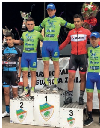
Bazpiko kadeteak, Oñatiko podiumean.