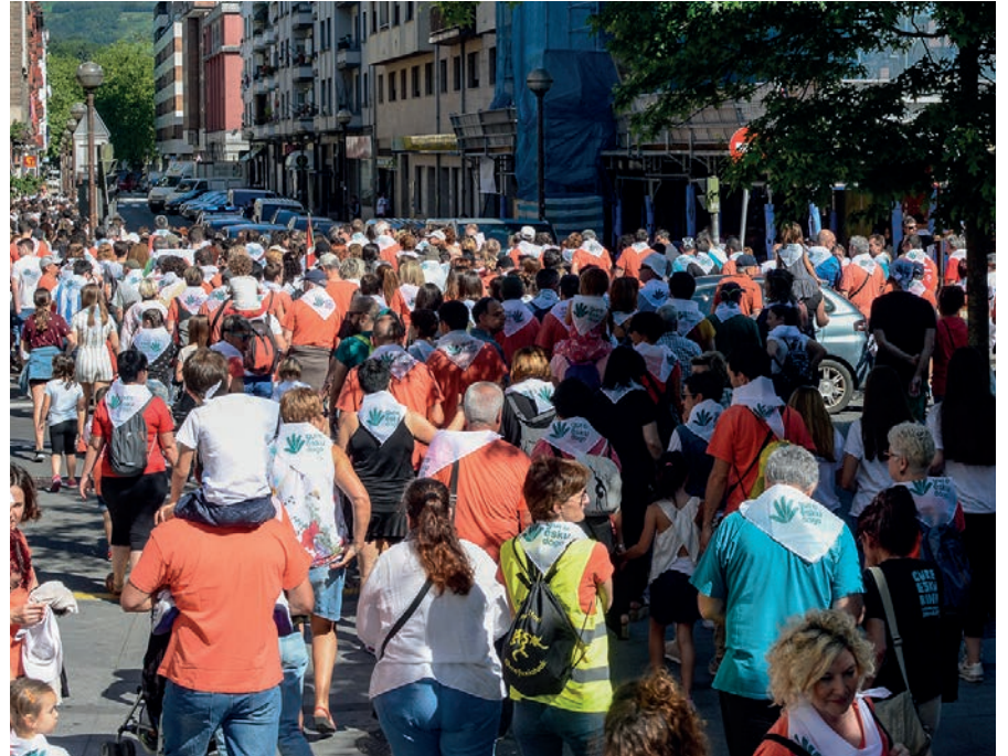
Guztiak batera Belartza eta Ugaldea arteko kilometroetara joan dira oinez. TXINTXARRI