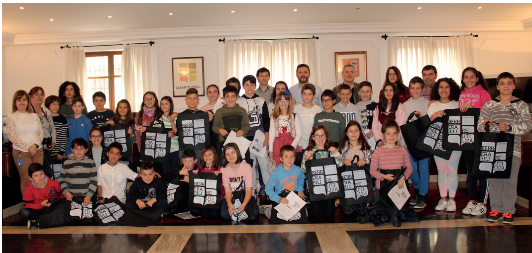
Aenda 21eko batzar berezia amaitzean taldea argazkia atera zuten gaztetxo, irakasle eta udal ordezkariak.