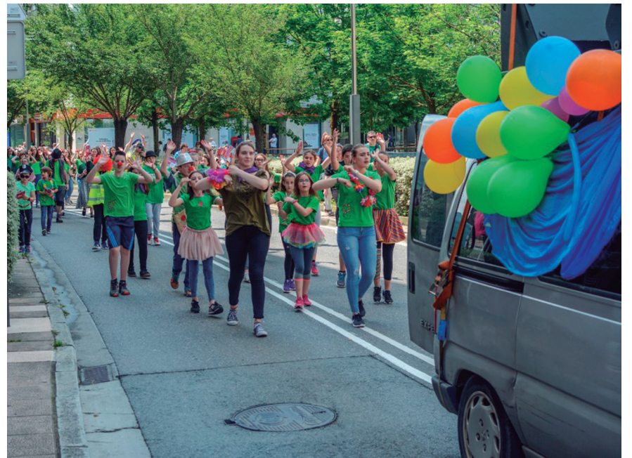
Dantzari gazte talde bat, gorputza mugitzen hasteko irrikitan. TXINTXARRI