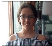
Naiara Zorionak Printzesa!!! Hamar muxu handi maitia!!! Amatxo eta aitaxoaren partetik!!!