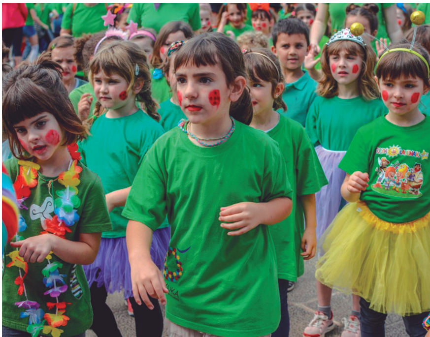
Urtero moduan, Zabaleta auzoan eman dio hasiera Kukukak hamabostaldiari. TXINTXARRI