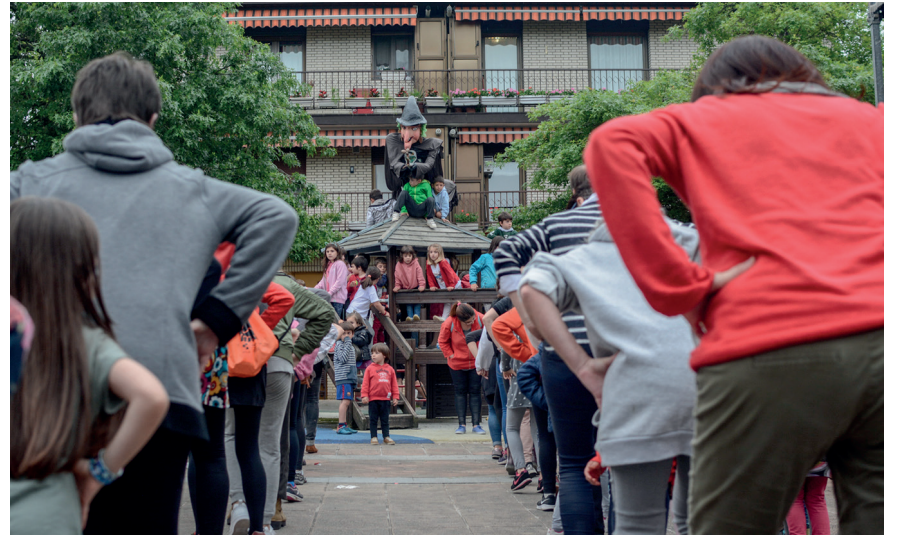
Sorgin-dantza ere ez zen falta izan. Urteroko ohitura bilakatu da. TXINTXARRI

Zabaletako Jaiez gozatu dute lasarteoriatarrek asteburuan zehar