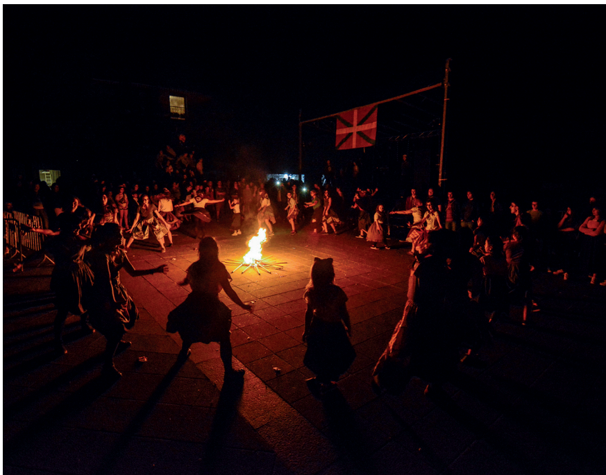
Akelarre ikusgarria plazaratu zuten Zabaletako hainbat auzotarrek, larunbat gauean. TXINTXARRI