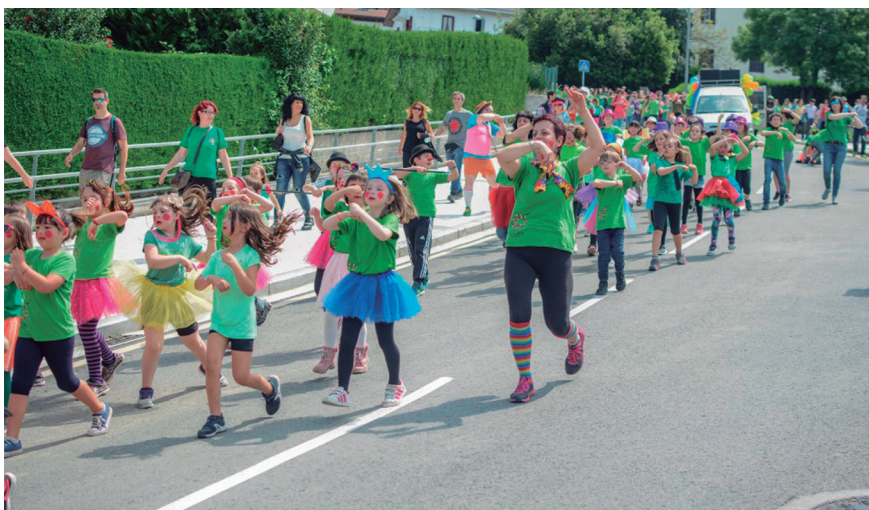
Buenos Aires aldapan behera Okendo plazarainoko ibilbidea egin dute taldeko kideek. TXINTXARRI