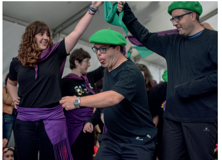
Jalguneko lagunek emanaldi ederra eskaini zuten, plaza alboko karpan. TXINTXARRI