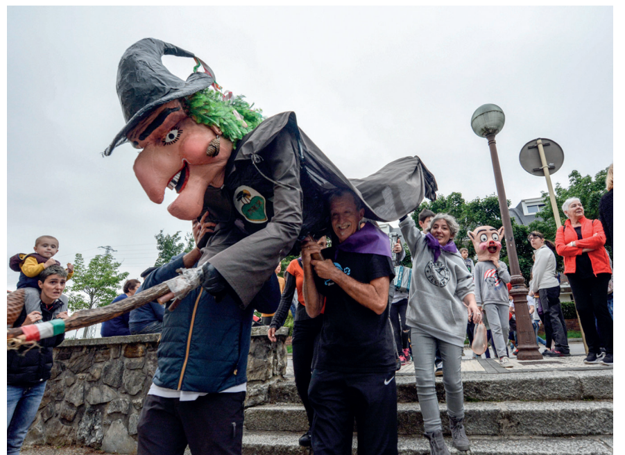
Teresa Sorginaren jaitsierarekin lehertu zen festa, ostiral arratsaldean.