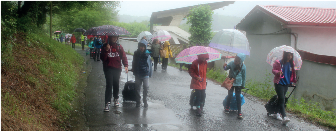
Irakasle eta gurasoen laguntzaz, ikastetxeetako gaztetxoek eskolarako bidea oinez egin zuten asteartean.