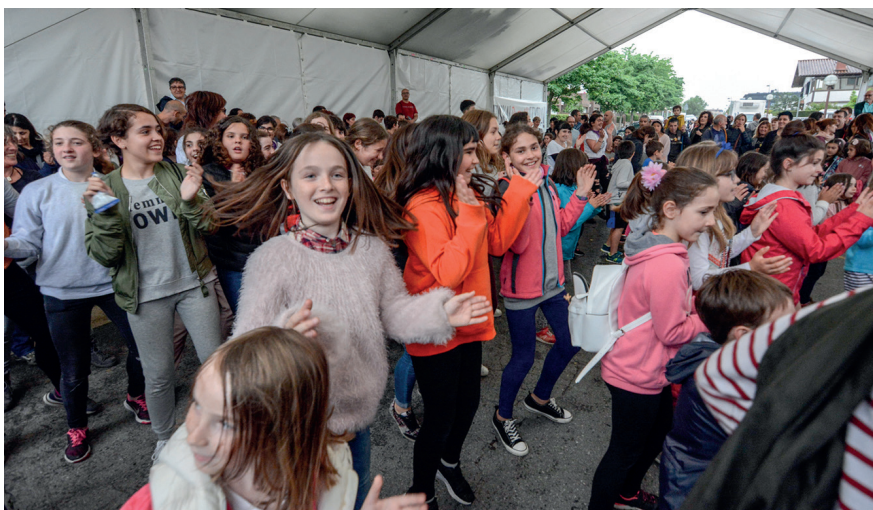
Irribarreak, jauziak, txaloak... Behin eta berriro ikusi dira dibertsio aurpegiak Zabaletan. TXINTXARRI