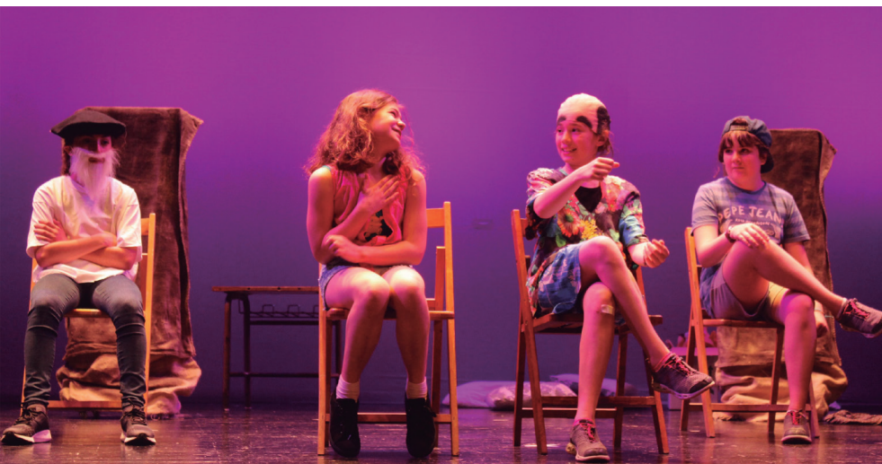
Asteazkeneko saioen artean Aupa Etxebeste filma taularatu dute.

Urtero moduan, Zabaleta auzoko festetan eman diote hasiera hamabostaldiari Kukuka Antzerki eta Dantza Eskolako kideek. Larunbat eguerdian, Antonio Blas plazatik irten, Buenos Aireseko aldapan behera abiatu, eta Okendon amaitu zuten ibilbidea.