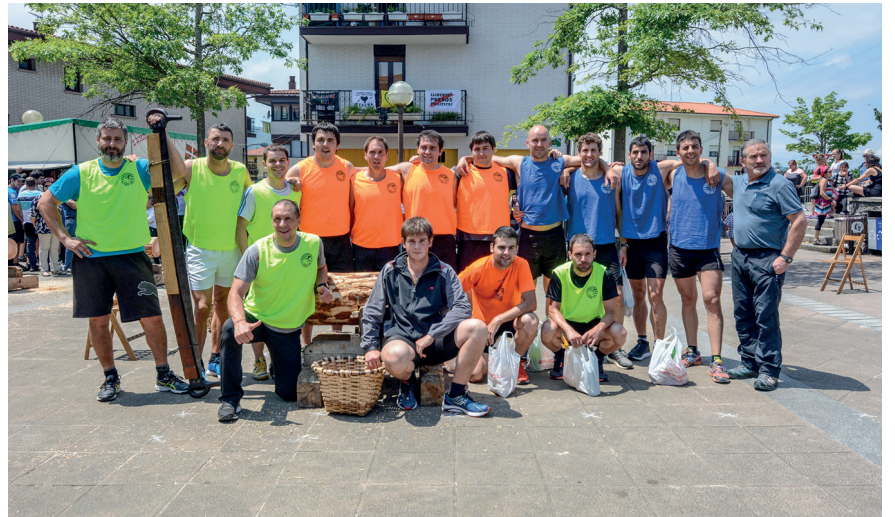
Proba mistoan parte hartu zuten kirolariak, lanak bukatu eta gero.