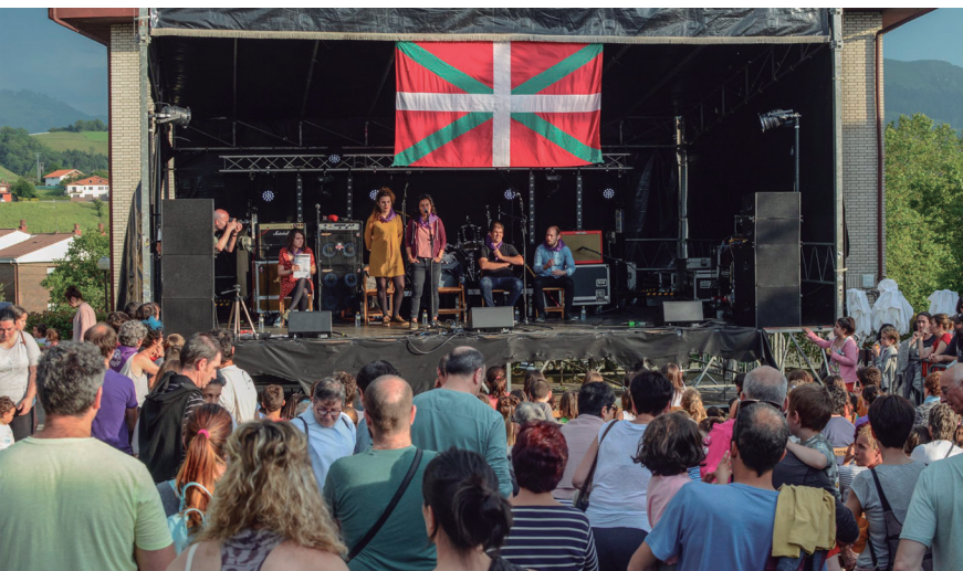
Jendetza elkartu zen plazan larunbat arratsaldean, bertsolarien emanaldia ikusteko. TXINTXARRI

Ikusi, entzun, usaindu, dastatu. Eta dibertitu. Eta gozatu. Lasarteoriatarren zentzumen guztiak dantzan jarri zituzten Zabaletako auzotarrek joan den astean zehar. Ekintzaz betetako auzoko festak antolatuta dituzte aurten ere (kanta berri eta guzti), herritarren gozamenerako. Konturatzera, bukatu zen asteburua, eta baita jaiak ere. Dena den, akelarreko sua ez da itzali oraindik, eta egun batzuez iraungo du zabaletarren sorginkeriak.