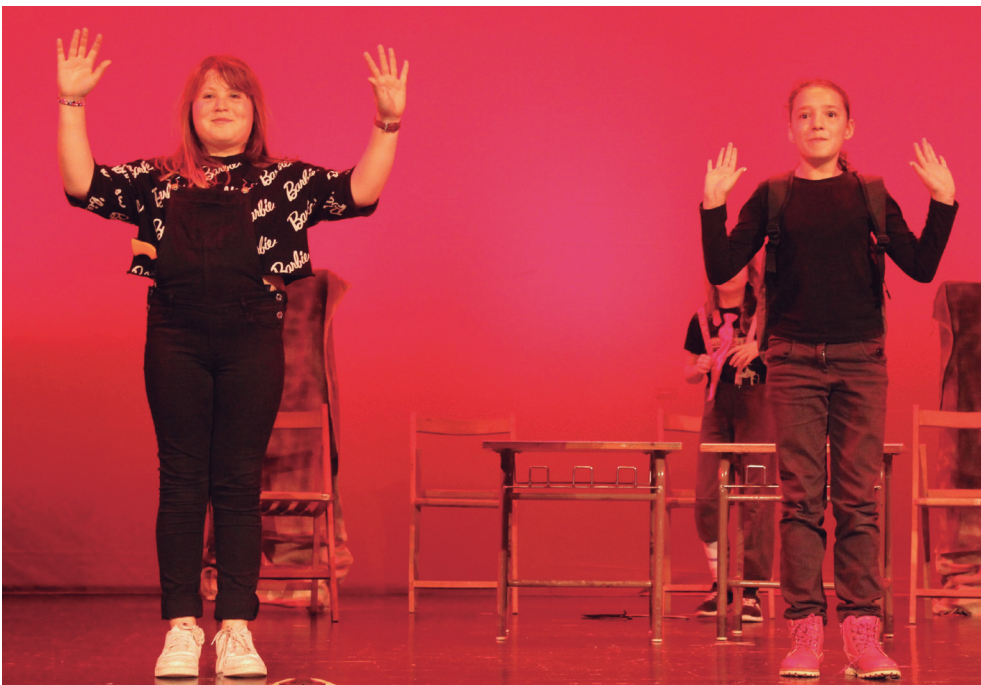
Sasoetako ikasleak Mafia antzezlanean. TXINTXARRI