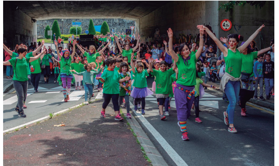
Koloretako jantziak soinean, doinu alaiak dantzatzuz jaitsi dira Zabaletatik kaxkora. TXINTXARRI

Kukuka Antzerki eta Dantza Eskolaren emanaldi koloretsuak