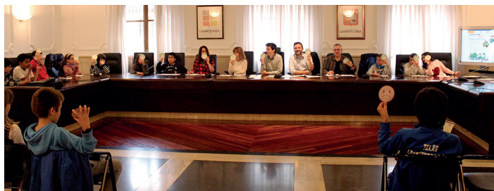
Idatzitako dekalogoko puntuak aurrera emateko konpromisoa hartu zuten gehienek. TXINTXARRI

Herri mailako diagnostikoa ere egin dute. Semaforoko koloreak oinarri hartuta berdez