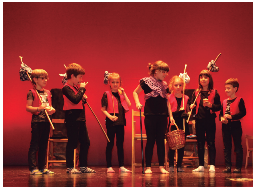
Obren erakustaldia egiten ari dira Kukukako kideak egunotan.