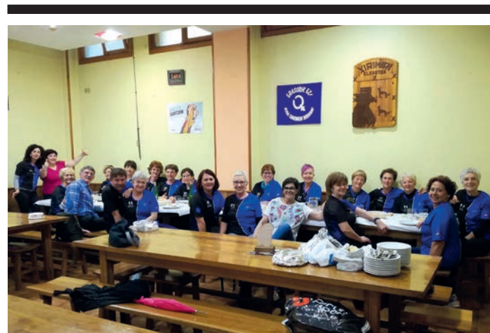
OSTADAR IPAR MARTXA