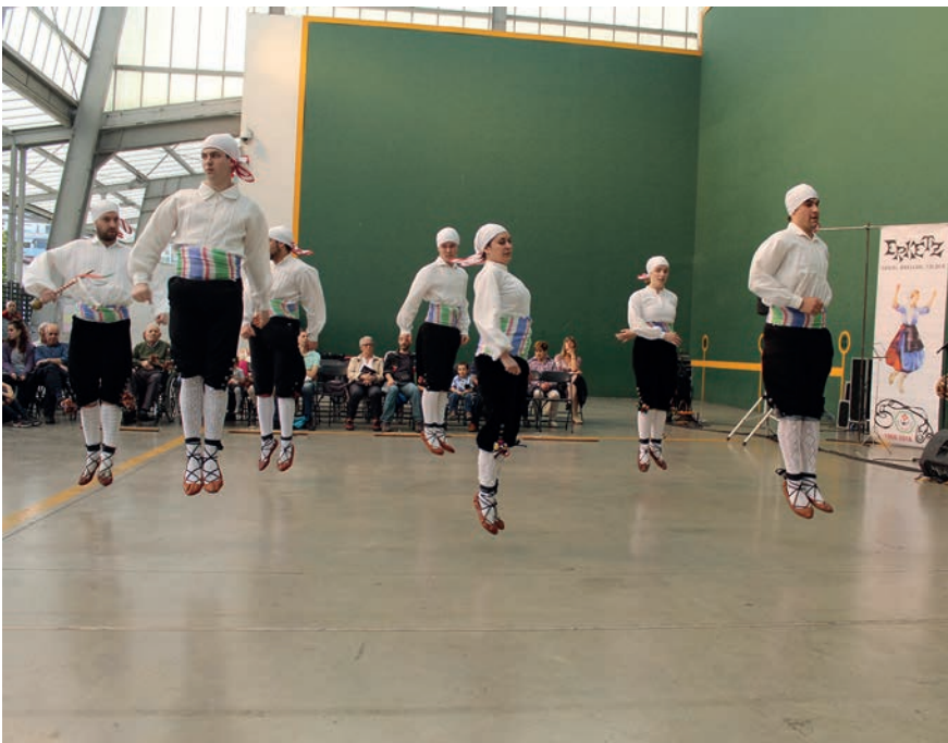
Euskal Herriko dantza ezberdinak ikusteko aukera izan zen Loidi Barren pilotalekuan. TXINTXARRI