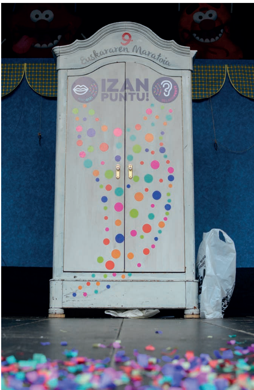
Duela bi urteko Euskararen Maratoian ospetsu egin zen armairu zuria. Are politago dago orain. TXINTXARRI