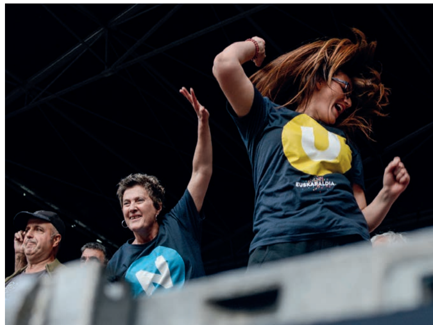
Kantuan eta dantzan egiteko astirik eduki zuten hamaikakoteko kideek, eta baita herritarrek ere. TXINTXARRI