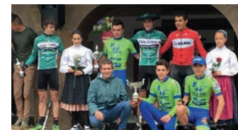
Kadeteak Lazkaoko podiumean.

Larunbatean, maiatzaren 26an, Lazkaon Asier Pozok bigarren postua eskuratu du, Beñat