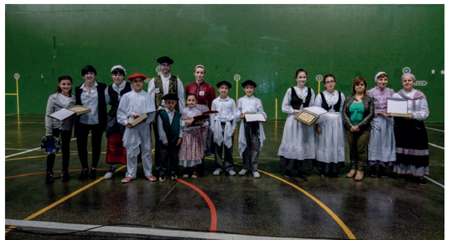
Dantzari Txiki egunean parte hartu zuten taldeek origarri bana jaso zuten, kultur zinegotziaren eskutik. TXINTXARRI

Mende erdi bete du aurten herriko dantza taldeak, eta ospakizunetan murgilduta dabil. Ekainaren 16an, larunbatarekin, San Pedro jaien aurreko emanaldi berezia eskainiko du, Okendo plazan. Erketzeko kideek aurreratu dute herriko hainbat taldek hartuko dutela parte ikuskizun horretan. Makina bat ekitaldi egin dituzte 2018an, eta beste hainbeste geratzen zaizkie oraindik.