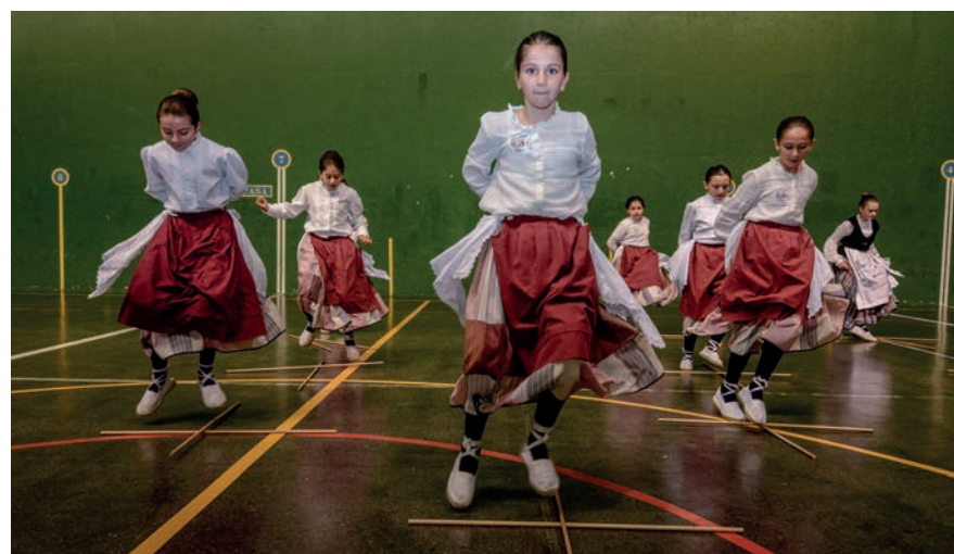
Makil-dantzaz gozatu zuten Michelinera joandako ikus-entzuleek. TXINTXARRI