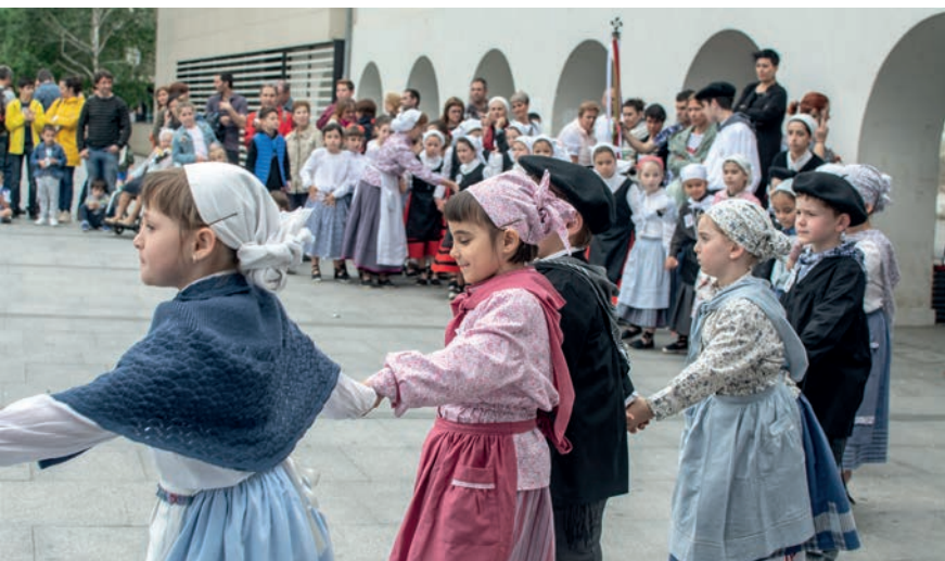
Arratsaldeko emanaldi nagusiaren aurretik, herriko kaleetan dantzatu zuten gaztetxoek.

Gogotik saiatu da, baina ez du lortu. Eguraldi txarrak ez du festa zapuztu, eta gogotik gozatu dute herritarrek asteburuan. Dantzari eta Dantzari Txiki eguna ospatu ditu Erketz EDTk, Euskal Herri osotik etorritako beste hainbat talderekin: Goizaldi (Donostia), Indarra (Gasteiz), Urki (Andoain), Makaia (Faltzes), Ereintza (Errenteria) eta Lurra (Urretxu). Gure herria Kukukak eta Erketzek berak ordezkatu dute emanaldietan. Okendo plazan ziren egitekoak hasieran, baina eguraldia kili-kolo ibili denez, Loidi Barrengo eta Michelingo pilotalekuetan plazaratu dituzte emanaldiak talde parte-hartzaileek.