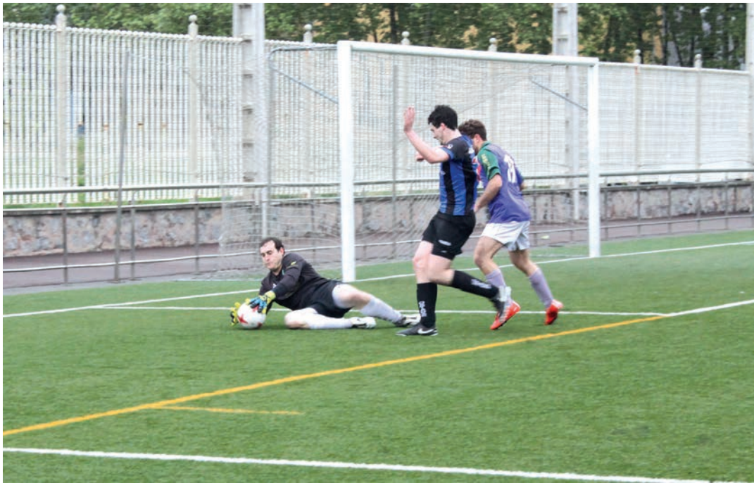
Ostadar SKT, denboraldi amaierako ligako partidan, Mundaroren aurka. TXINTXARRI