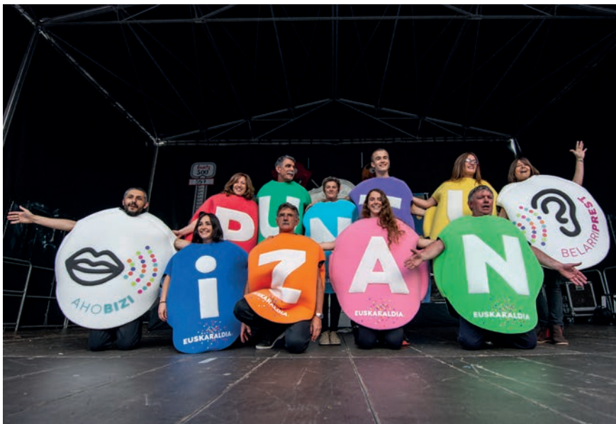
Gogoz eta ilusioz gainezka hartu du hamaikakoteak Euskaraldiaren erronka. TXINTXARRI