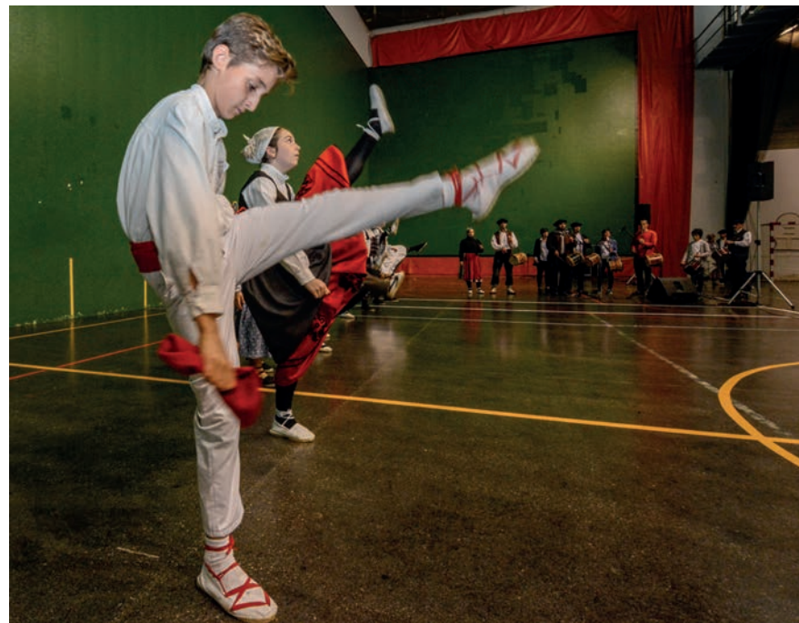
Igandeko Dantzari Txiki egunean sei taldek hartu zuten parte. TXINTXARRI