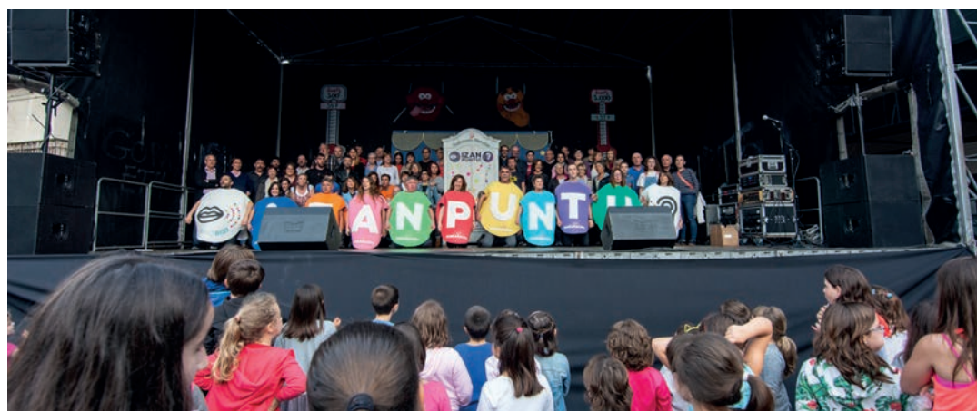
Hamaikakoteko kideek eta herriko eragile eta elkarteek familia argazki erraldoia atera zuten, oholta gainean. TXINTXARRI