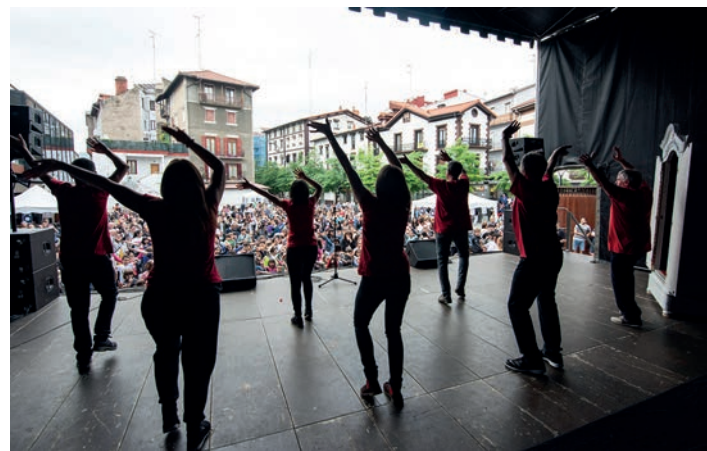
Ahoa bizi, belarriak prest abestiaz gogoratzen dira lasarteoriatarrek. TXINTXARRI