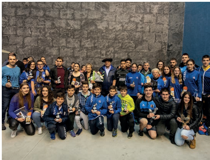
Saritu guztiek talde argazkia atera zuten ekitaldia bukatu aurretik.