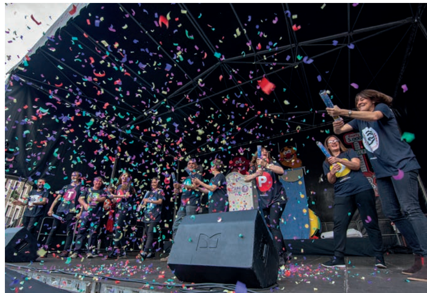
Aurkezpen ekitaldi koloretsua eta alaia izan zen joan den asteko ostiral arratsaldekoa. TXINTXARRI