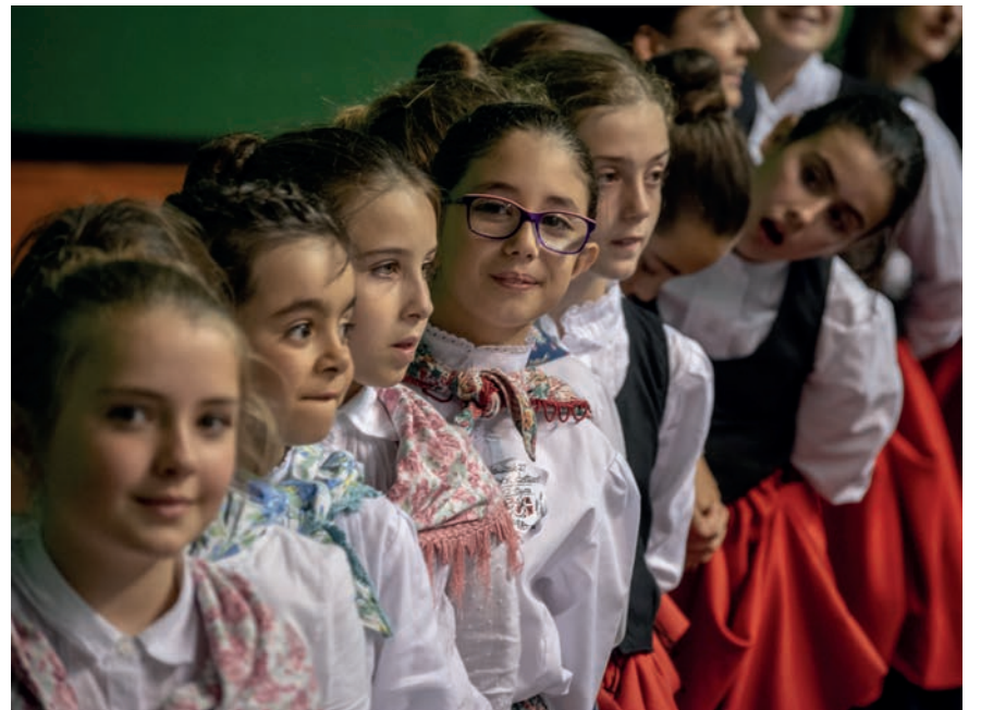
Dantzari gazte talde bat, gorputza mugitzen hasteko irrikitan. TXINTXARRI