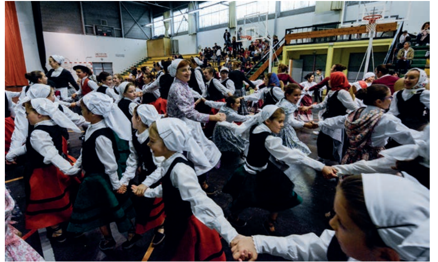
Kalejira erraldoi batekin bukatu zuten igandeko Dantzari Txiki eguna. TXINTXARRI

Dantzari eta Dantzari Txiki egunak ospatu ditu Erketz dantza taldeak