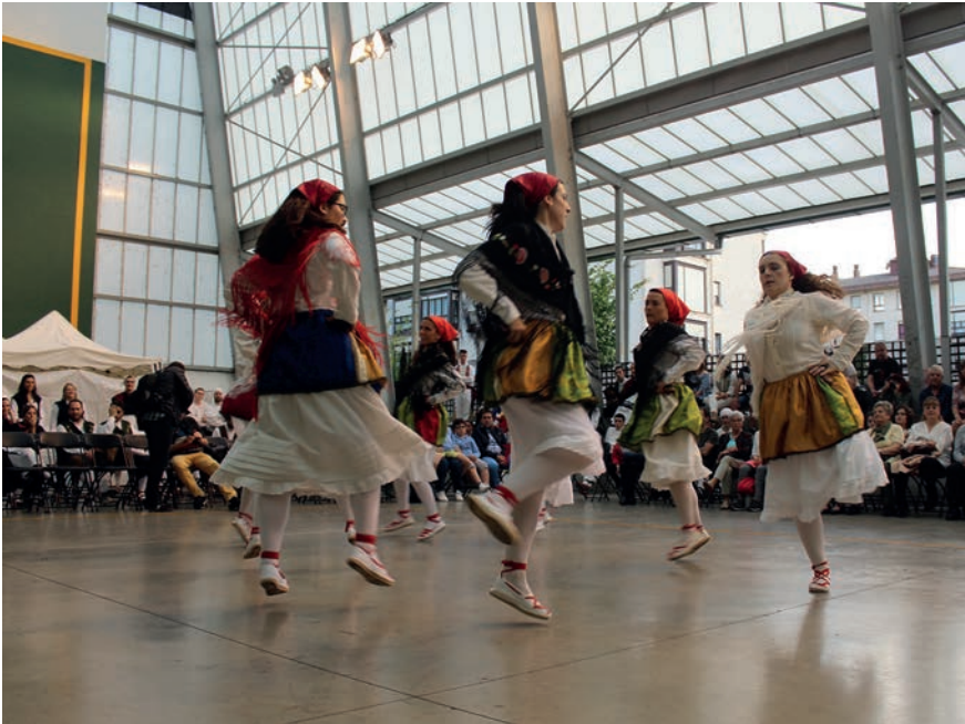
Donostiako Goizaldi eta Gasteizko Indarra taldeak izan ziren aurten Dantzari egunean, Erketzekin batera. TXINTXARRI