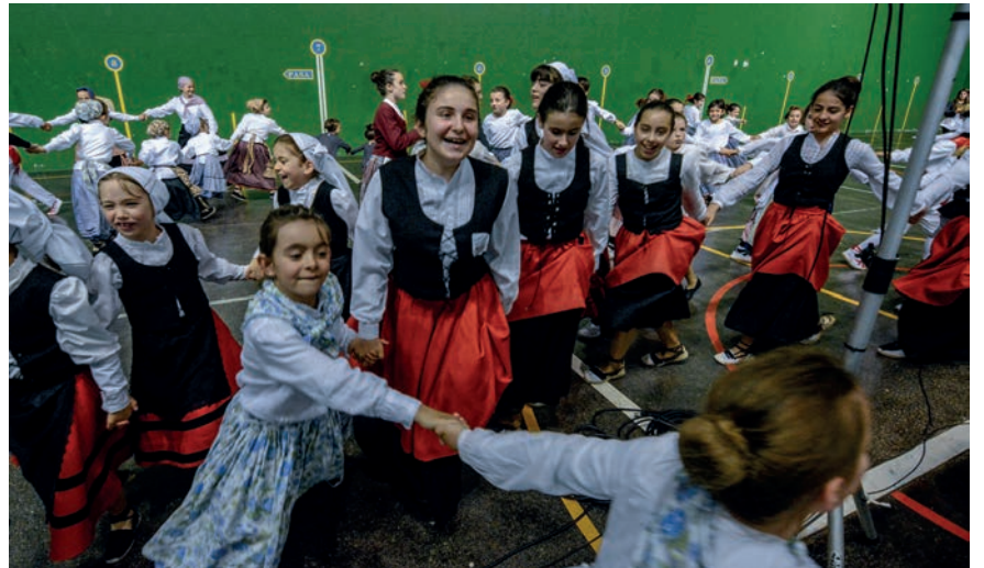
Igande arratsaldeko kalejira erraldoieko uneetako bat.