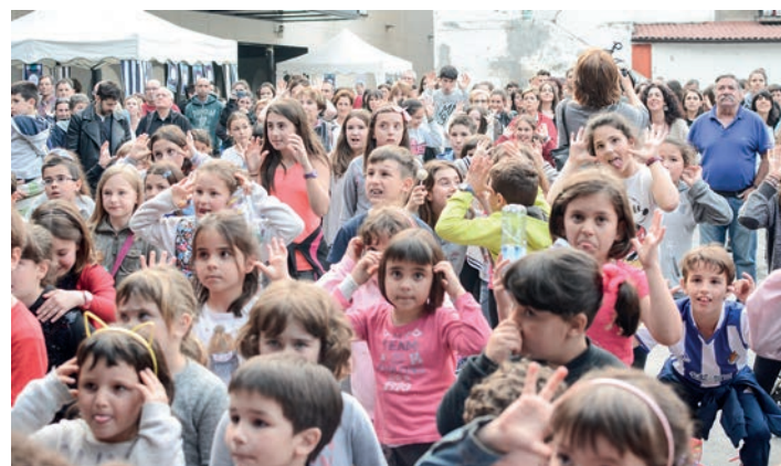
Primeran pasa zuten gaztetxoek Euskaraldiaren aurkezpenean. TXINTXARRI