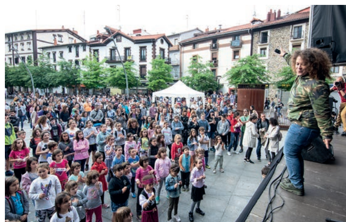
La Basu abeslari bizkaitarrak dantzan jarri zituen ikus-entzuleak. TXINTXARRI