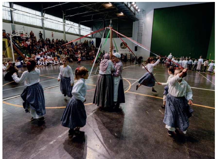
Kukukako gaztetxoek zinta-dantza ikusgarria eskaini zuten. TXINTXARRI