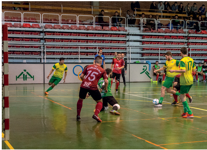
Eguzki Antonio Aroztegia taldeak maila mantendu du. TXINTXARRI

Trumoi Taberna Eguzki taldea Gipuzkoako Lehenengo Mailan izango da. Azpimarratzekoa da