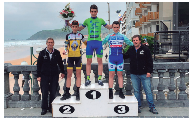
BURUNTZAPI TXIRRINDULARITZA ESKOLAX