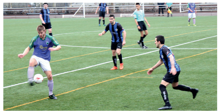
Mundaroren aurka garaipena erdietsi zuen Ostadarrek orain bi aste. TXINTXARRI

Areto-futboleko taldeek, beraz, haien etorkizuna argi dute, eta azken jardunaldi honetan lasai izango dira. Horrek ez du esan nahi lehian guztia emango ez dutenik.