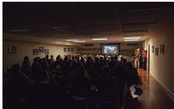
Elkartearen historia argazkietan errepasatu zuten. TXINTXARRI