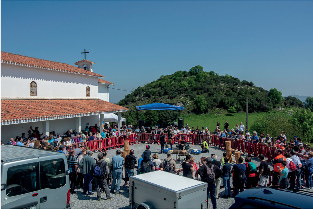
Eguraldi aparta lagun, hainbat herritar igo ziren Azkortera igande goizean. TXINTXARRI