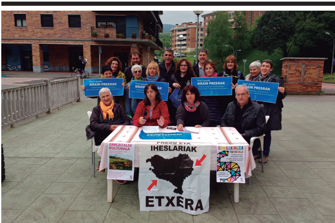
Sare Herritarraren kideak, Urnietan egin zuten prentsaurrekoan.