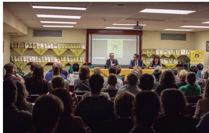
Manuel Lekuonako hitzaldi aretoa bete zen aurkezpen ekitaldian. TXINTXARRI

Eskerrak emateko baliatu du ekitaldia Aterpeak. Urteurreneko ekitaldien nondik norakoak eman ondoren, herriko eragileak deitu ditu, oroigarri bat emateko eskertza moduan; ferra bat, elkartearen ikurra. Tartean Ttakun Kultur Elkarteak eta TXINTXARRI ere jaso dute. "Kirol eta kultur ekintza gehien dituen Gipuzkoako herria da. Horrek ematen dio bizitzari".