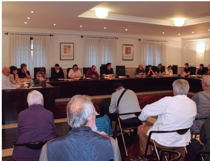
Pentsionista ugari bildu dira astearteko udalbatzarrean. TXINTXARRI

Lasarte-Oriako arau subsidiarioetan A.33 Teresategi eremuari eta Donostiako AÑ.10 Errekalde eremuari Hiri Antolamenduaren Plan Orokorrari dagokionez, bi