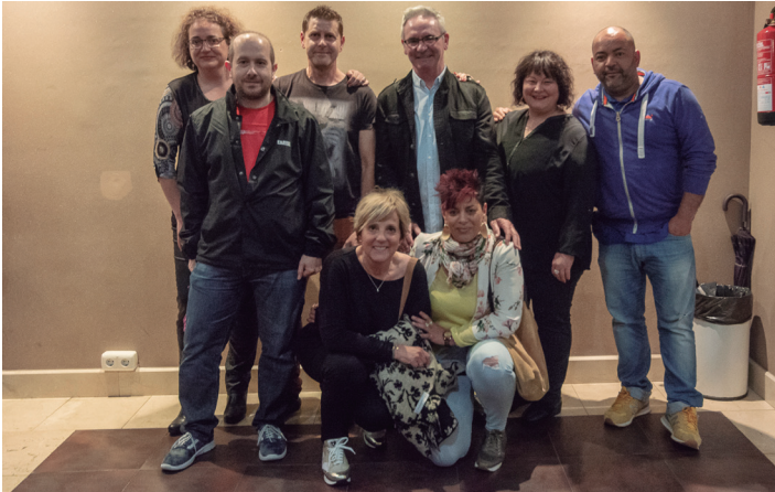
Aterpeako egungo zuzendaritza taldeko kideak. TXINTXARRI