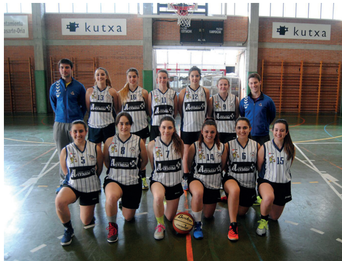
Lauko Finala hatz puntekin ukitzen dute Ostadar Saskibaloiko seniorrek.

Alde polita ekarri dute bueltan Lasarte-Oriara, baina itzuliko neurketa jokatu behar dute oraindik. Igandean neurtuko dituzte indarrak berriro bi taldeek, Maialen Chourraut kiroldegiko kantxan, 11:00etatik aurrera. Taldeko kideek herritarrak animatu dituzte harmailetara joatera, Ostadar animatzera. Denboraldi bikaina egiten ari da senior