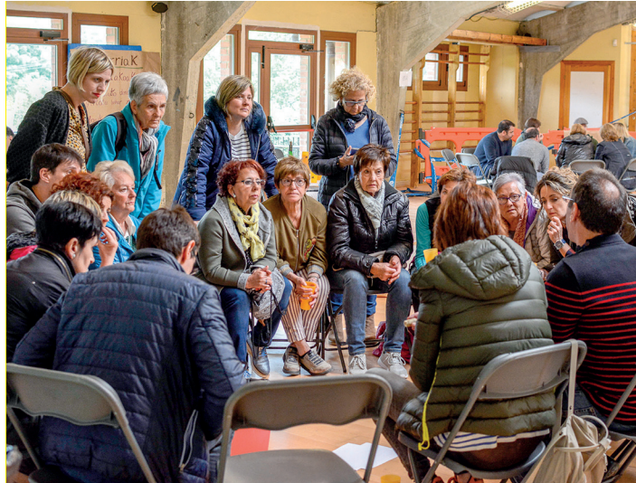
Ehundik gora herritarrek hartu dute parte Landaberri Ikastolako Gune Irekian. TXINTXARRI

Goizean goiz hasi dira antolatzaileak dena prestatzen. 10:30ean egin diete harrera Lasarte-Oriako eta inguruko herritarrei. Agenda prestatzeari ekin diote gero, denek batera. Ideien merkatu moduko bat egin dute, buruan zeuzkaten ideia eta galderak paperera eramanez: "Nola ulertarazi gizarteari hondakinen arazoa guk sortzen dugula, eta guk eman behar diogula irtenbidea?"; "nola landu hondakinen gaia, hezkuntzatik?"; "politikariek zergatik ez dituzte entzuten gure ardurak eta kezak?". Horiek izan dira planteatutako galderak, besteak beste. Galdera eta gai horiek hartu dituzte eztabaidagaitzat, eta hainbat taldetan banatu dira, lasai eta gustura hausnartzeko: Igeldo, Andatza, Lasarte, Zubieta, Santuenea, Oria, Usurbil eta Buruntza . Helduak izan dira