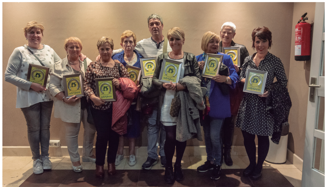
Aterpearen lehenengo zuzendaritza taldeko kideak.