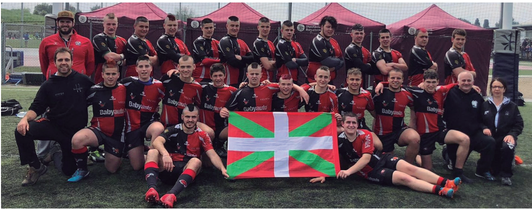
Babyauto Zarautz-Beltzak RT-k Sant Cugat de Vallesen jokatu du Espainiako txapelketa. ZRT