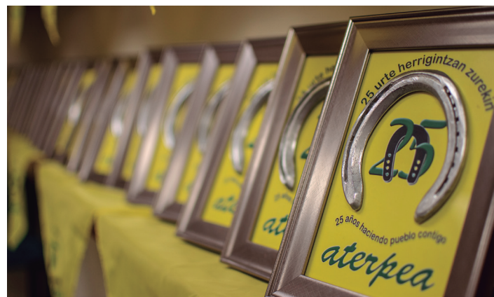
Herriko eragileei oparitutako oroigarria. TXINTXARRI