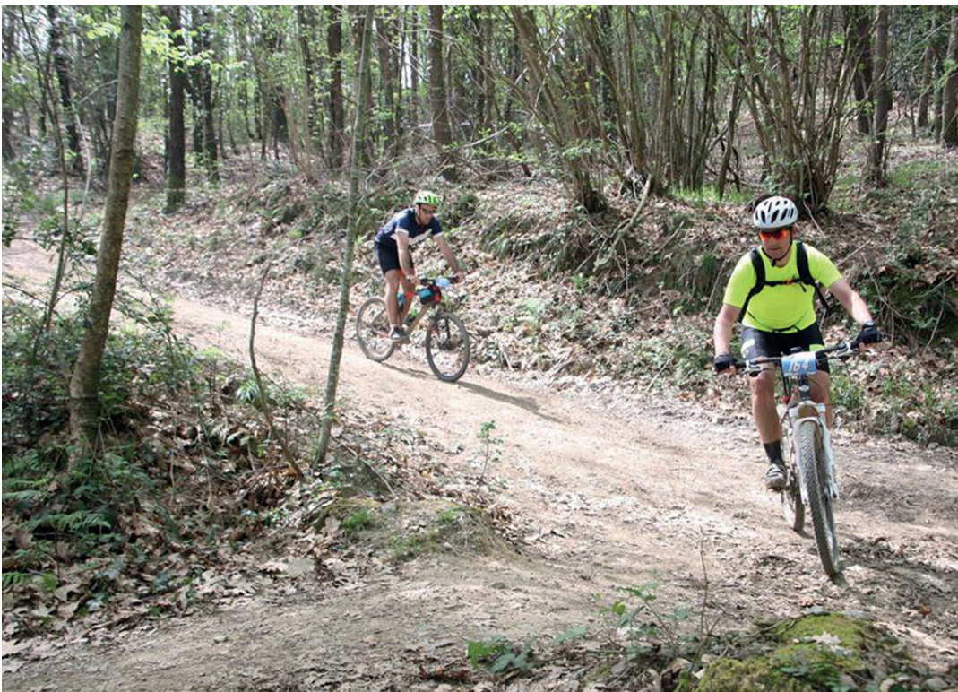
Andatzako bideetan barrena ibili ziren parte hartzaileak.