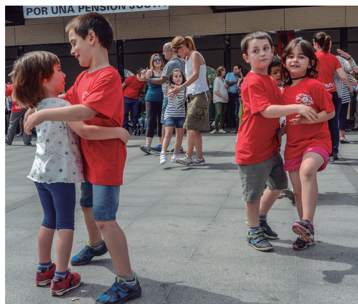
Adin guztietako dantzariak bete dute Okendo plaza. TXINTXARRI