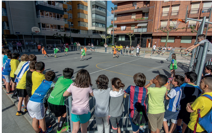
Baloiak ez dio mugitzeari utzi arratsalde osoan.