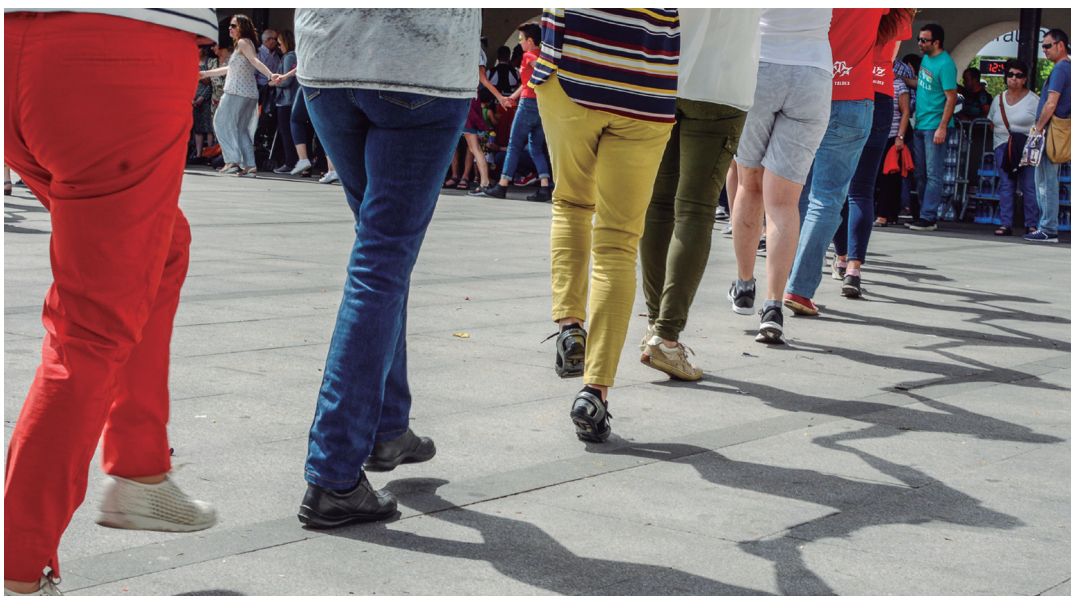
Askotariko doinu ezagunak dantzatzuz igaro dute igandea Erketz EDTko kideek.