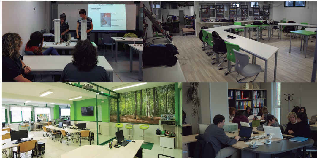
Maiatza amaiera aldera irekiko dute matrikulazio epea Lanbide Heziketan. USURBILGO LANBIDE ESKOLA.

Horrek noski, lanketa handia eskatzen du, baliabideen ikuspuntutik. Azpimarratzekoa da zentzu honetan, Laneki proiektuak Lanbide Heziketan ikasmateriale didaktikoak euskaratzen egiten