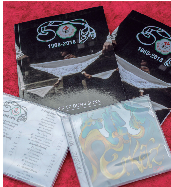
Erketz EDTk 50 urteetako bizipenak liburu batean bildu ditu. TXINTXARRI