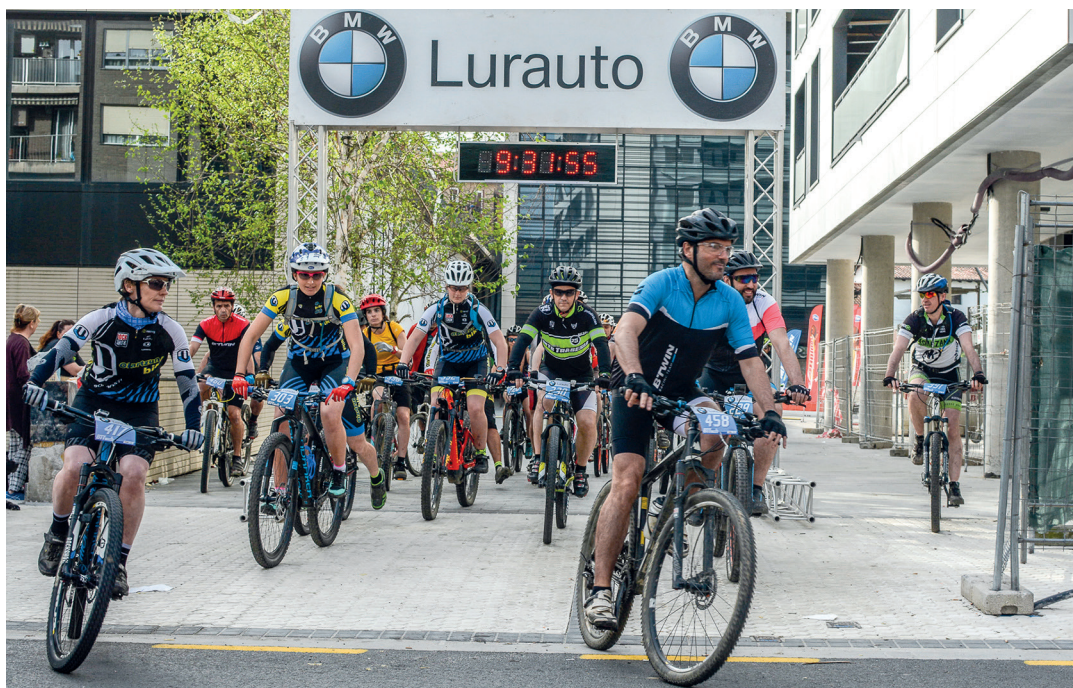
Indar betean ekin diote lasterketari txirrundulariek. TXINTXARRI