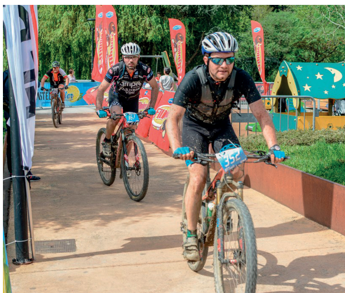
Aurreko edizioetan baino lokatz gutxiago aurkitu dute parte hartzaileek. TXINTXARRI