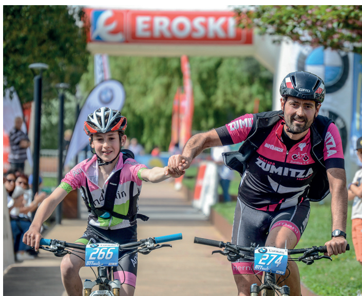
BTT Lasarte-Oria, oraineko eta etorkizuneko kirol proba. TXINTXARRI