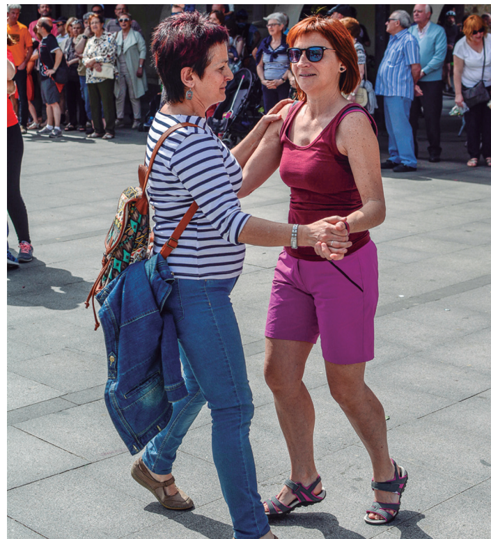
Lasarteoriatar ugari parte hartu dute igandeko erromerian. TXINTXARRI

Aurtengoa urte berezia da Erketzentzat. 50 kandela ez dira urterotz itzaltzen, eta, behar bezala ospatzeko, ekitaldi ugari prestatu ditu 2019a iritsi bitarte. Ekainaren 16an, larunbatarekin, San Pedro jaien aurreko emanaldi berezia eskainiko dute, Okendon bertan. Aurtengo ikuskizuna "oso berezia" eta "ikusgarria" dela iragarri dute taldeko kideek. Herriko hainbat elkarterek ere hartuko dute parte.