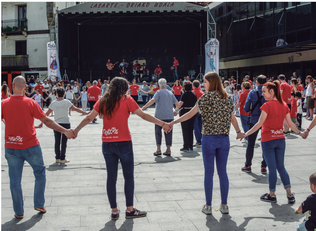
Erromeria erraldoiarekin dantzan jarri dituzte Okendora bertaratutako herritar guztiak. TXINTXARRI