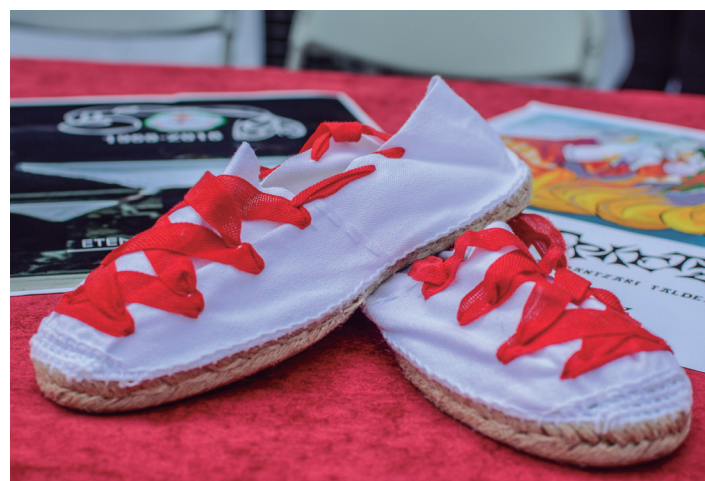
Dantzarako osagarriek ere beren lekua izan dute ekitaldian. TXINTXARRI