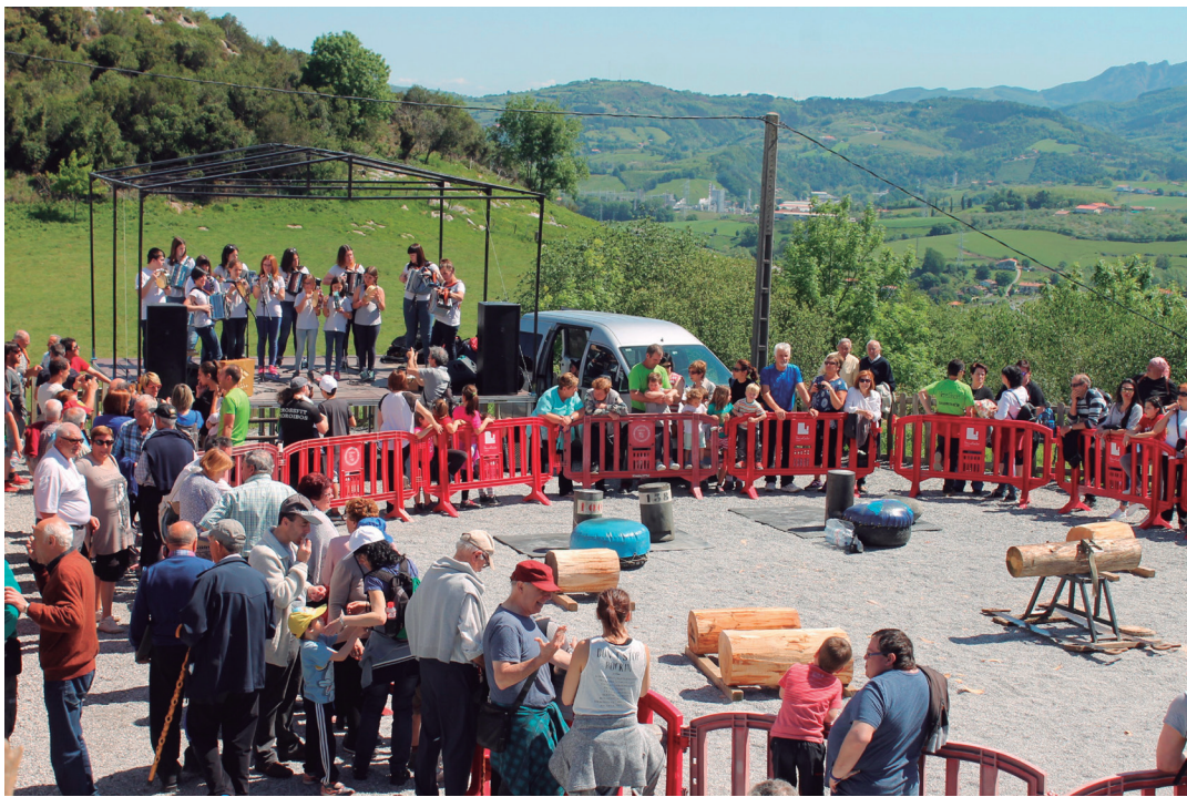
Eguraldi ona giltzarri izango da erromeriarentzat. laz giro eguzkitsua lagundu zuen. TXINTXARRI