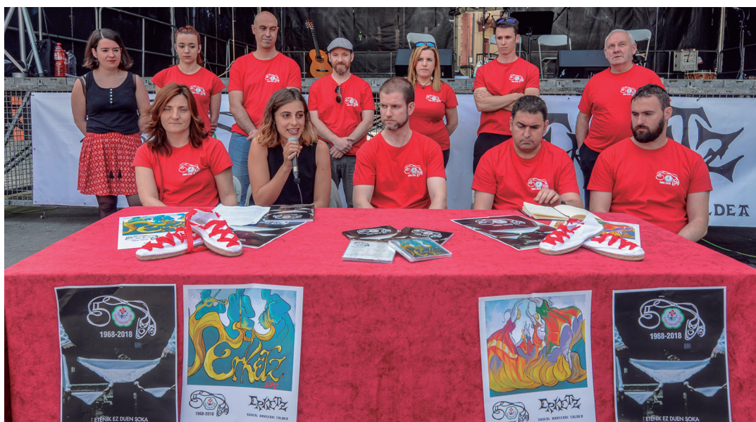
Sokak ez du etenik izenburua eman diote Erketz EDTren liburuari. TXINTXARRI