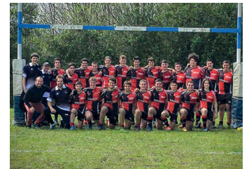
18 urtez azpiko taldea. ZARAUZ/BELTZAK

"Durangok Ordiziaren aurka erakutsi zuen talde trinkoa dela. Partida ederra egin zuen finalerdian", aipatu dute Beltzakeko arduradunek. Beltzek, beraz, ez dute lan erraza izango Euskal Ligako garaikurra eskuratzeko.