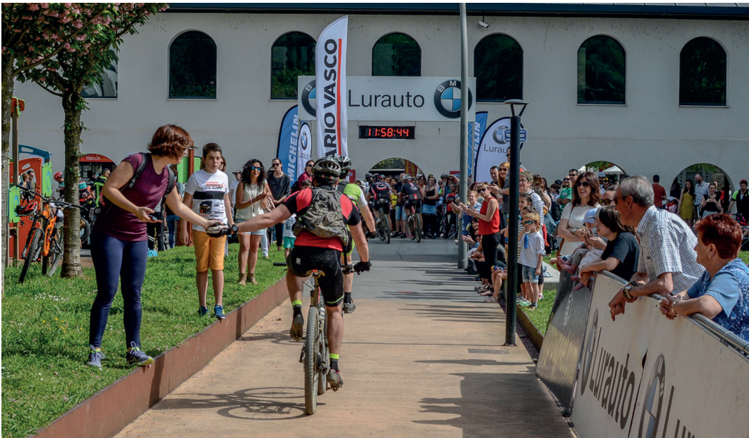
Herritar ugari bildu zen Askatasun parke eta Mercero plaza inguruetan parte hartzaileei animoak emateko. TXINTXARRI