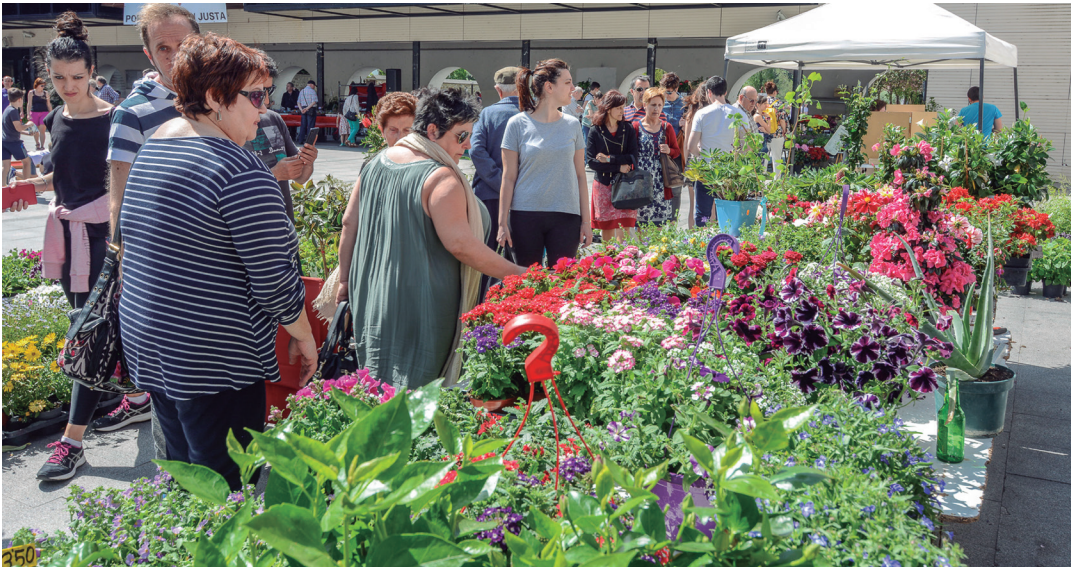
Lore eta landare eskaintza zabala izan da aurtengo Lore eta Landare Azokan. TXINTXARRI