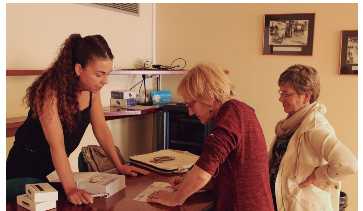
Oihana estetika zentroa irratia frekuentzia bidezko tratamenduaz aritu da. TXINTXARRI

Autobus zerbitzua 09:00etan hasiko da, Biyak Bat erretiratuen egoitza aurreko geltokian. Jaitsiera ere autobusez egin ahalko da. Erromeria amaitu artean egongo dira autobusak erabilgarri.