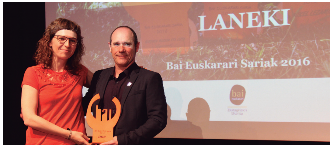
Lanbide Heziketako ikasmateriala euskalduntzen dihardu Laneki proiektuak. Bai Euskarari saria jaso zuen 2016an, egiten duten lanketaren errekonozimendu gisa. BAI EUSKARARI

Euskalduntzen segitzeko lanketan Erreportajearen zehar argi geratu den moduan, bada euskarazko eskaintza Lanbide Heziketan Buruntzaldean. Euskara ikastea ezinbestekoa da, lan merkatuan ate gehiago zabaltzeko. Baina oraindik bada zer eginga Lanbide Heziketa guztiz euskalduna izateko bide horretan. Eta horretan dihardute bai ikastetxeek, baita Buruntzaldeko tokiko erakundeek. Andoain, Astigarraga, Hernani, Lasarte-Oria, Urnieta eta Usurbilgo Udaletako euskara batzordeek urteak daramatzate, Lanbide