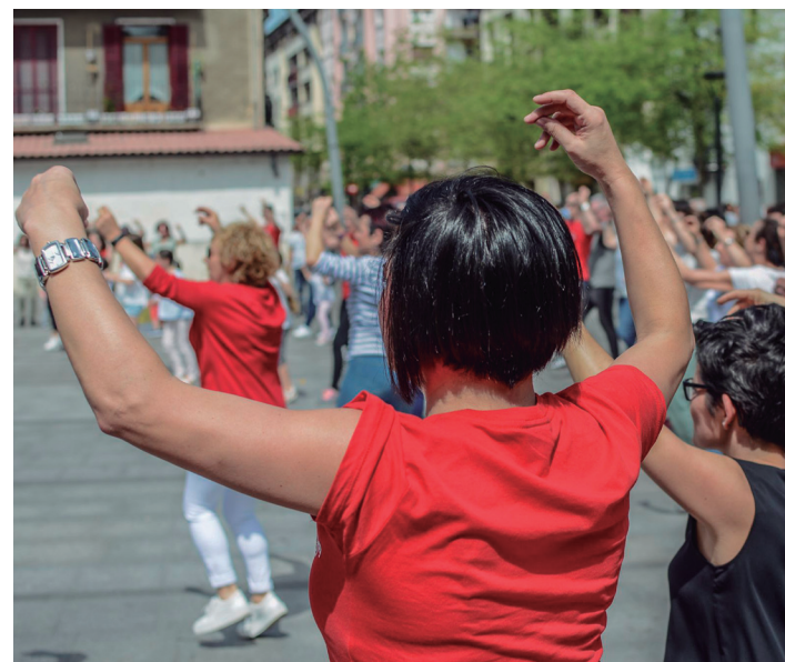
Euskal doinu ugari dantzatu dituzte plazan, igandean. TXINTXARRI