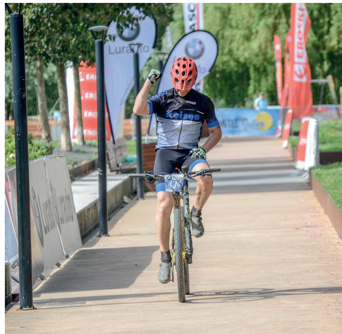
Satisfazio keinu ugari ikusi dira helmugan. TXINTXARRI