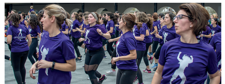
Zumba maratoiak herritar ugari bildu zituen Okendo plazan.

Datu horiek onak dira udalarentzat, baina "gutxiegi-kotzat" jotzen ditu, eta horregatik lanean jarraituko du herriko hondakin birziklatze-maila hobetzeko ahaleginean. Alde horretatik, eta jasotako bio-hondakinaren tasa hobetzeko, kanpaina bat egiteko asmoa du, bio-hondakinak bereizita biltzeko zerbitzuarekin herritar gehiagok bat egin dezaten.