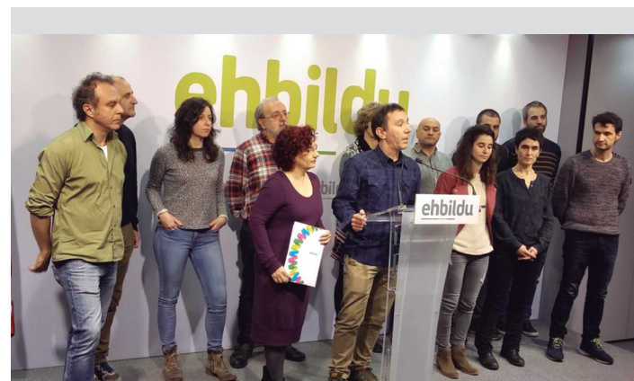
EH Bilduko ordezkariak merkataritza gune handiekin kezka agertu dute. TXINTXARRI

Horiekin batera, Urnieta bideko nekazariak ere haserre eta kezkaturik agertu dira batzarrera; Zatarain A 36ko urbanizazio lanek zenbait kalte eragin dizkietela salatu dute. Zonaldearen urbanizazio lanen diseinua egin eta aurkeztu zutenean, San Frantzisko kaleak bi norabide izango zituela adostu zen, eta horrela jakinarazi zieten bizilagunei. Baina orain norabide bakarrekoa bihurtu dute errepidea. Aldaketa hori "inori jakinarazi gabe" egin dutela salatu dute bizilagunek, eta suertatzen dizkieten arazoak jakinarazi dizkiete udal ordezkariari. Bizilagun asko nekazaritza lanetan aritzen dira, eta traktoreak erabiltzen dituzte eguneroko jardunean. Errepidearen norabide