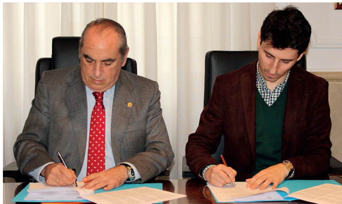
Arriola eta Zaballos hitzarmena sinatzen. TXINTXARRI

Herriarren beharrei aurre egiteko Eusko Jaurlaritzak