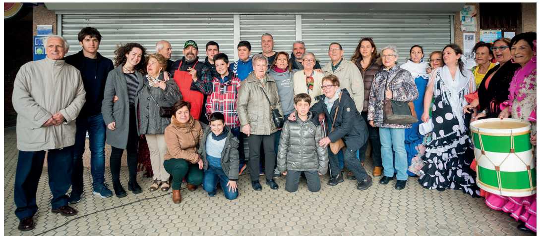
Orain 47 urte ireki zituen atea Sasoeta auzoko Bagri liburu dendak.

Halabaina, auzotarrak izan ziren haien maitasuna eta laguntasuna