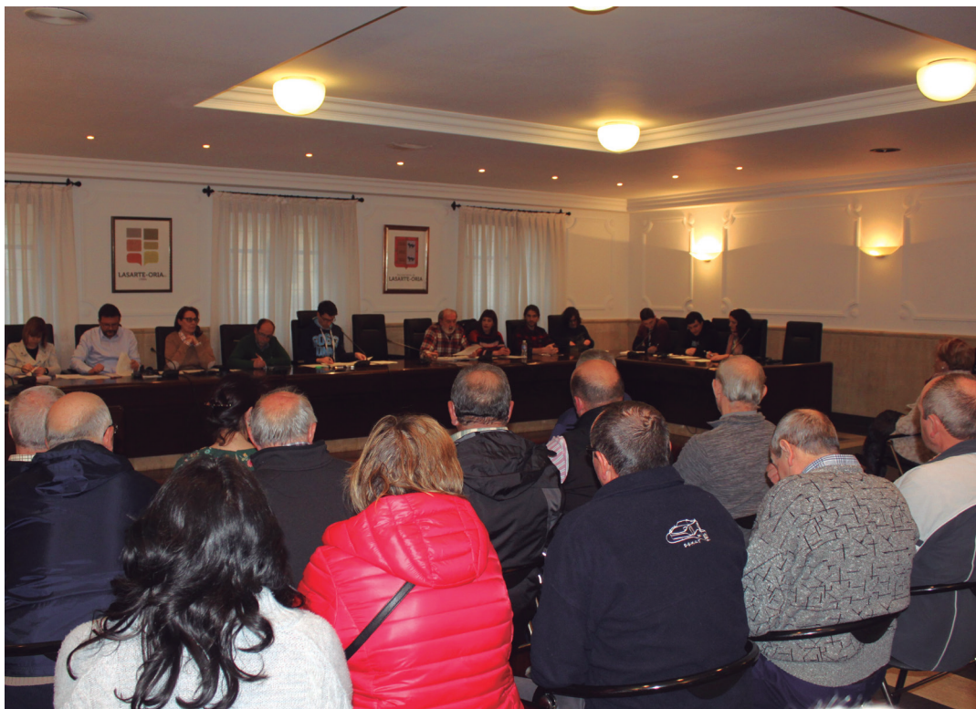
Lasarte-Oriako herritarrez lepo bete da astearteko ohiko udalbatzarra. TXINTXARRI