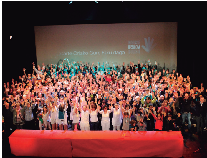
Lasarte-Oriako Gure Esku Dagok 2014an irakurritako adierazpena. TXINTXARRI

Nolanahi ere, posible da herritarrek haien eskubidea erabiltzea. Horrela erakusten