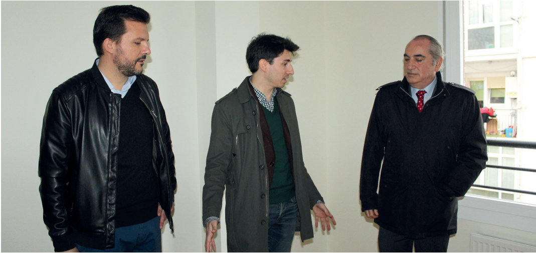
Lagako den etxebizitzetako bat bisitatu dute akordioa sinatu ostean. TXINTXARRI