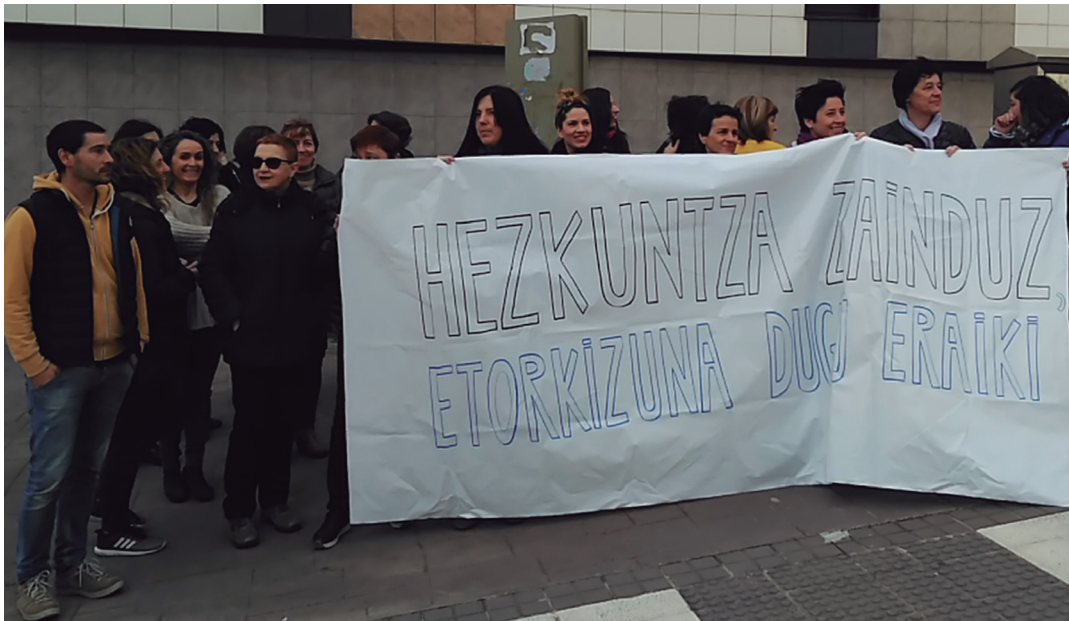
Sasoeta-Zumaburu Ikastetxeko irakasleek kontzentrazioak egin dituzte, goizero, klaseak hasi aurretik, ikastetxe atarian. TXINTXARRI

Bi eguneko lanuztera deitu dituzte izan dira EAEko ikastetxeak, eta deialdiarekin bat eginda, Lasarte-Oriako ikastetxeek ere greba egin dute asteartean eta asteazkenean. Hiriburuetan egin dituzte mobilizazioetan kalitatezko hezkuntza publikoa aldarrikatu dute