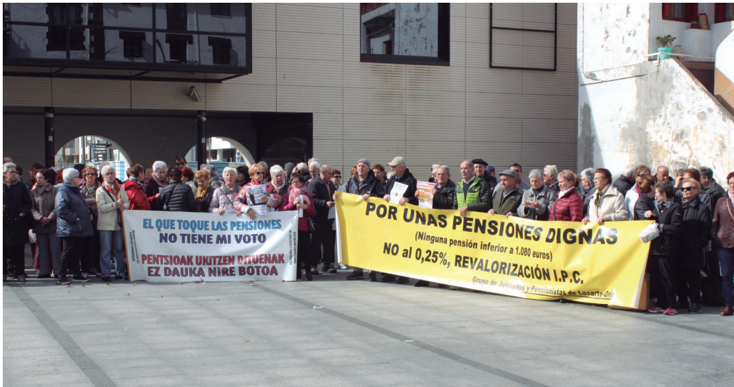
Martxoaren 5eko elkarretaratzean lehen aldiz 200 bat pertsona bildu ziren. TXINTXARRI

Haiek ez digute jaramonik egin orain arte", dio Herrero.