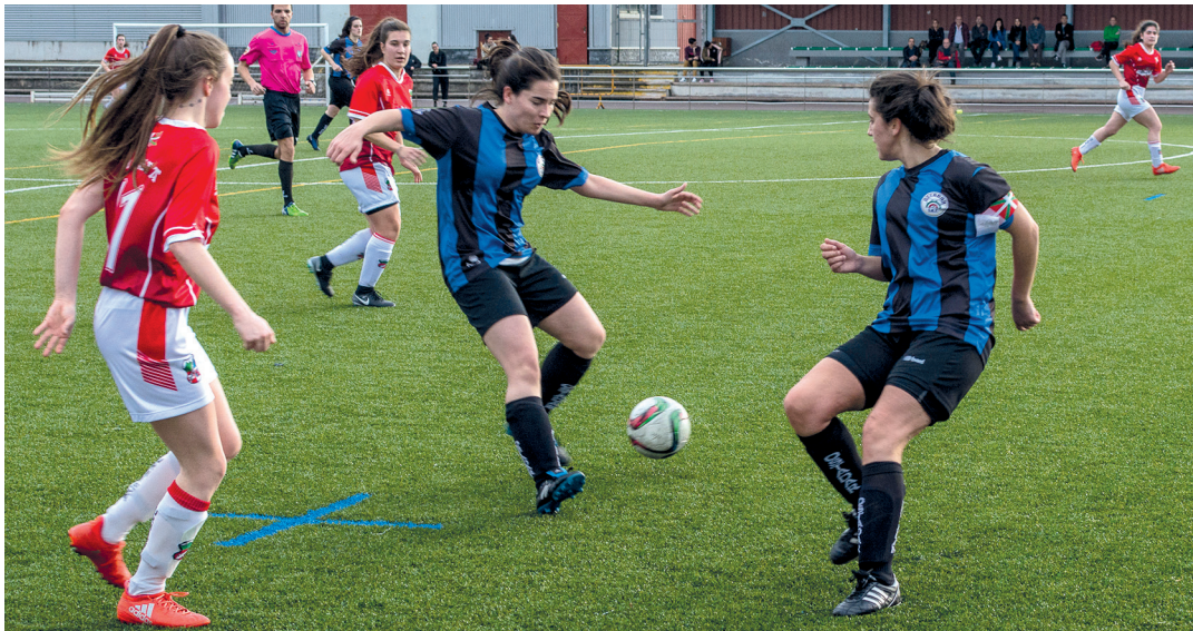
Ostadar erregionaleko jokalariek ez dute amore eman, baina Urnieta ederki baliatu da urdin-beltzen akatsez.