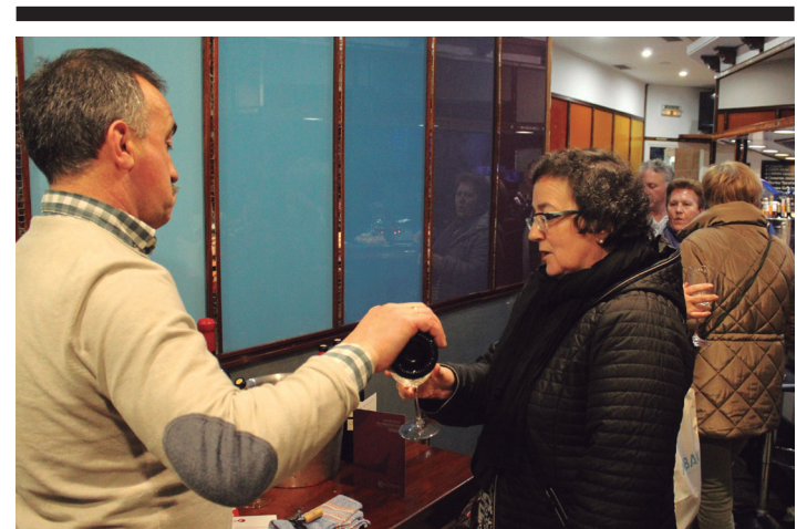
Eguzki tabernan herritarrek ardoa dastatzen.