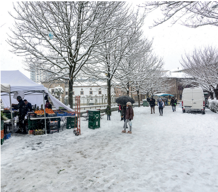
Elurteak azoka zapuztu du, saltzaileek ez dute Lasarte-Oriara iristerik izan.