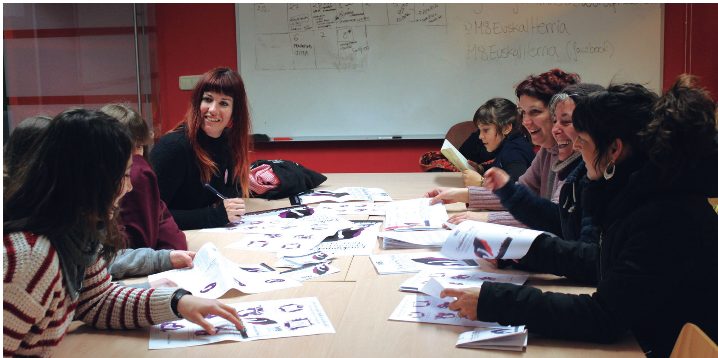
Lasarte-Oriako Mugimendu Feministako hainbat kide Martxoak 8rako antolatzen.