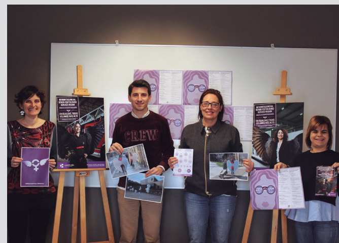
Udal ordezkariak Martxoaren 8ko egitarauaren aurkezpenean. TXINTXARRI