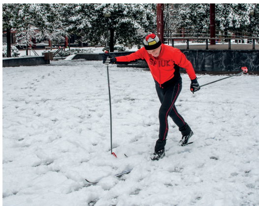
Eskiak ere atera dituzte batzuk herrian edo inguruetan ibiltzeko. TXINTXARRI