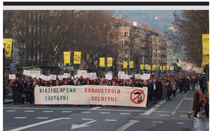
Donostian eginiko manifestazioaren irudia. NOAUA!

Hartu denbora bat hausnarketarako. Denbora bakoitzarena da eta guztiona aldi berean. Unibertsala eta pertsonala. Zurea eta nirea. Idazki xume hau izan dadila zure eta nire denbora txoko honetan konpartitzeko bide, eta bide batez, gogoeta baten hastapen.