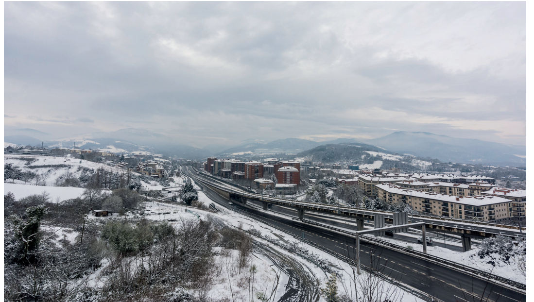
Lasarte-Oria eta bere inguruen panoramika ikusgarria. N-1 errepeidea itxita egon da denbora luzez. TXINTXARRI