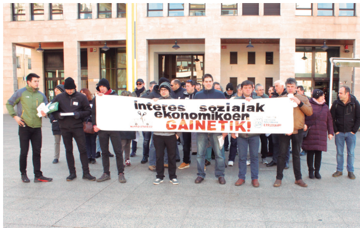
Langileak eta erabiltzaileak protesta egiten, asteartean.

Haatik, langileek eta erabiltzaile askok salatu dutenez, zerbitzu publikoaren "murrizketa itzela" ekarriko du. Eta Lasarte-Oriari