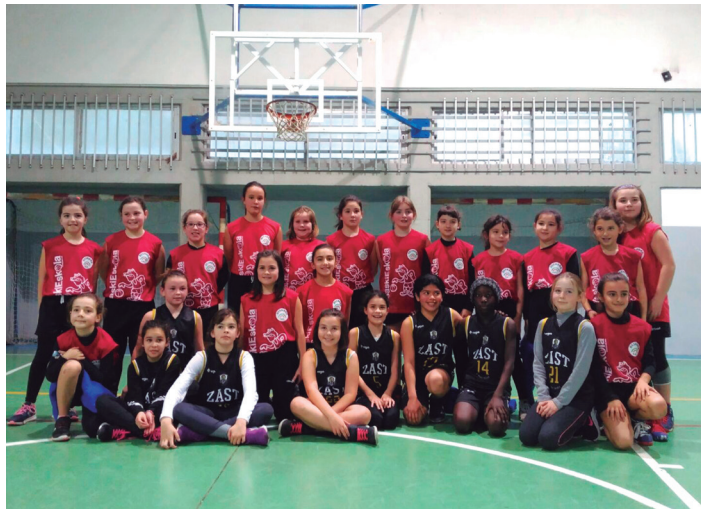
Saskibaloi Eskolakoak, asteburuko topaketan. OSTADAR SKT SASKIBALOIA

Bestalde, 1. mailako seniorrek La Salle Mundarro menderatu