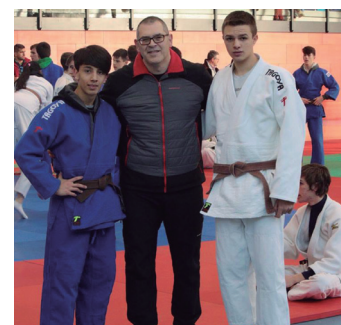
Bi kadeteak, Burgoseko kopan. ARISTEGI