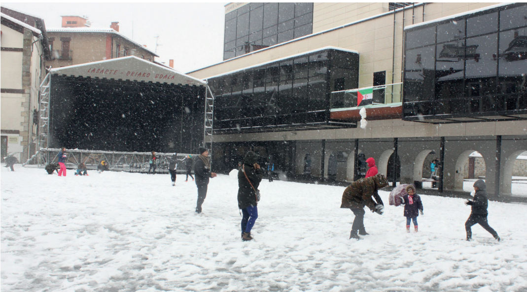
Okendo plazan jolasean ibili dira herritarrak. Elur-panpinak ere egin dituzte. TXINTXARRI