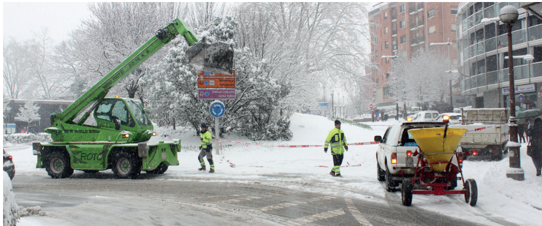
Udal langileak errepide eta kaleetan lanean egon dira guztia garbi egoteko. Tajamar biribigunea itxi behar izan dute ordu erdiz. TXINTXARRI