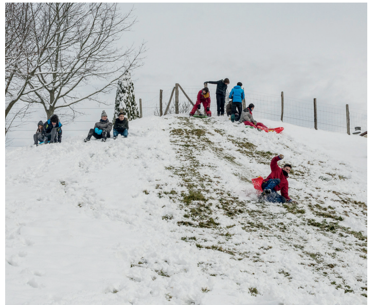
Ikastolarik ez dute izan eta ederki gozatu dute gazteek aldapan behera. TXINTXARRI