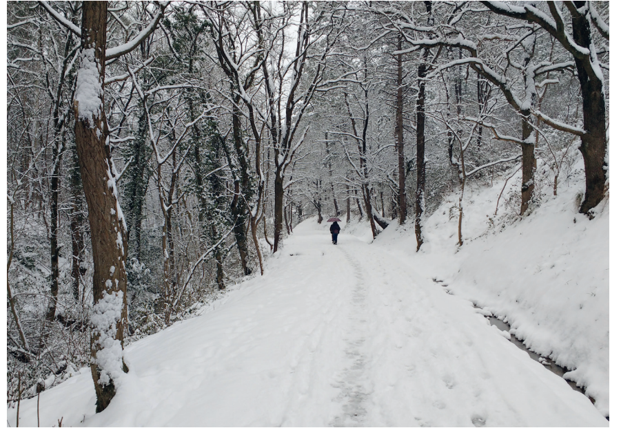
Urnietatik Lasarte-Oriarako Plazaolako bidea ere erabat zuritu zuen elurak.