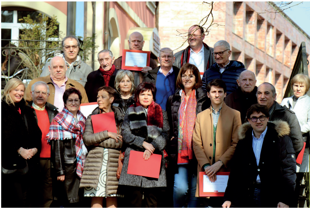
Omendu zituzten alkateek eta zinegotziek talde argazkia atera zuten, oroigarria jaso ostean. T.VALLÉS