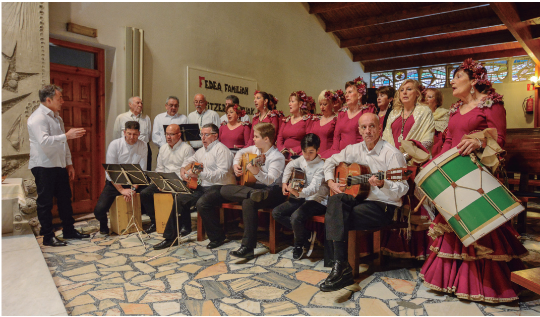
Semblante Rociero kantuan, igandeko mezan. TXINTXARRI