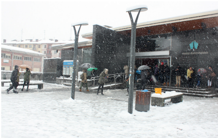
Tren geltokia jendez gainezka egon da goizean. Trenak tarteka ibili dira. TXINTXARRI