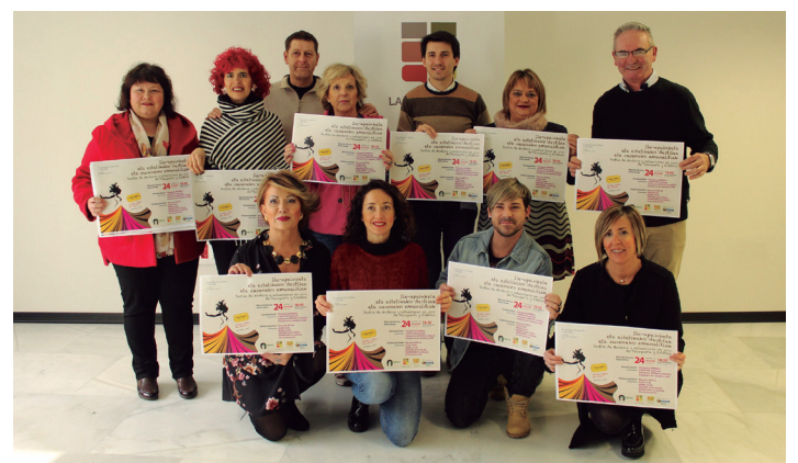
Aterpeko kideak, jardunaldiaren aurkezpen agerraldian. TXINTXARRI

Hogeita bost urteko ibilbidea du merkatarien elkarteak, eta urte horietan guztietan herrigintzan lanean aritu dira. Hogeita bost urte herrigintzan zurekin leloa erabili dute orain arte egindakoa definitzeko: "Herriarekin egin dugu lan