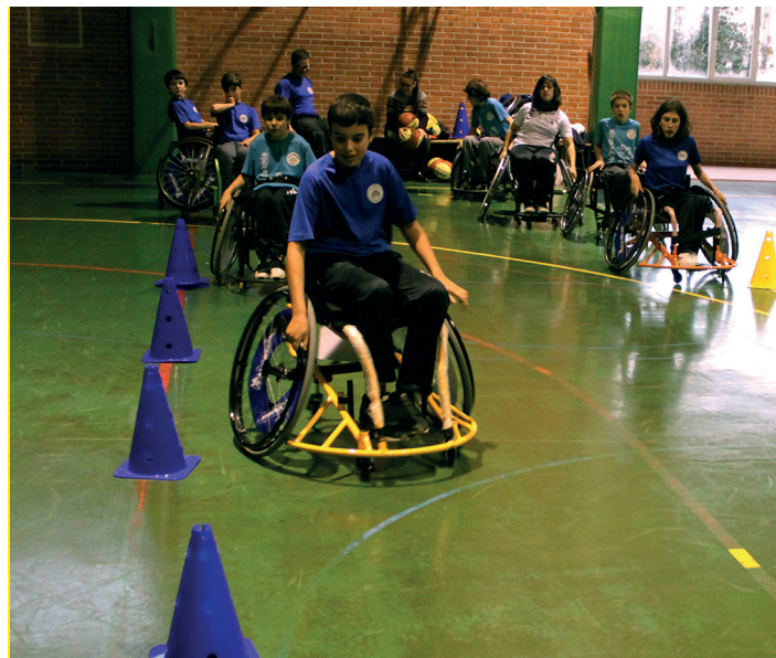
Eslaloma urritasuna duten pertsonen zuzendutako kirola da. TXINTXARRI

Eslaloma zirkuitu bat da, parte hartzaileek gurpil-aulkia erabili