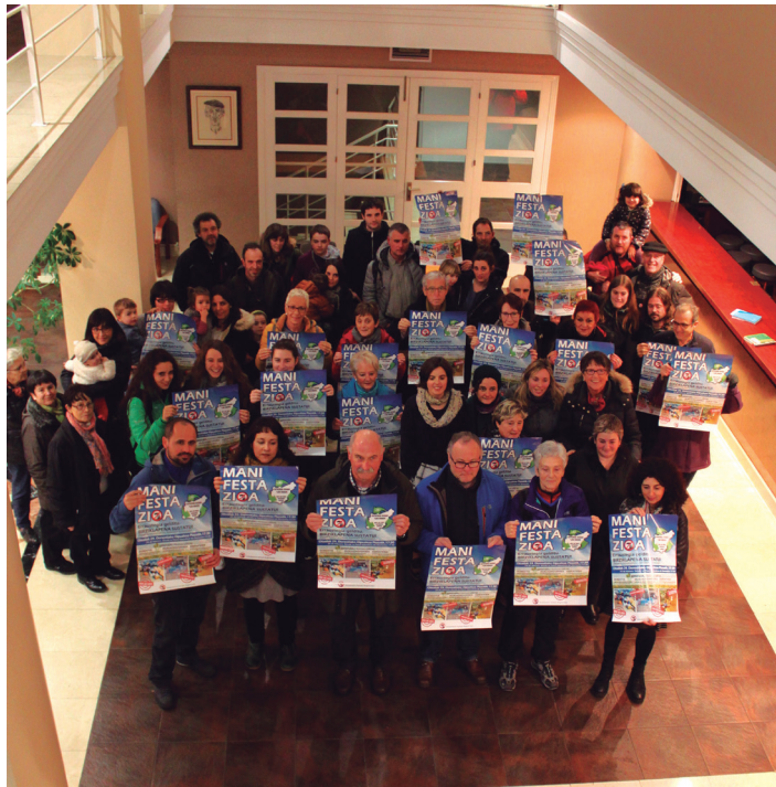
Manifestazioarekin afixarekin argazkia atera zuten asteazkenean.

Lasarte-Oria da erraustegiaren eraginak sufrituko dituen herrietako bat, azpiegitura herri ondoan bertan eraikitzen hasi dira eta, Zubietan. Halere, San Marko Mankomunitatearen datuen arabera, gutxien birziklatzen duen herrietako bat da. "Donostiarekin batera, gutxien birziklatu zuen herria da. Eta kontuan izan behar da San Marko dela Gipuzkoan gutxien birziklatzen duen mankomunitatea". 2017. urtean %44,8 birziklatu zen, aurreko urtean baino hamar puntu gehiago. %60ko tasa edukitzea