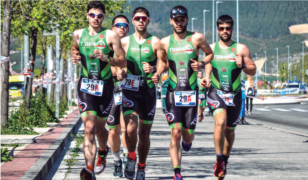
Trinkoko taldekideak Egueseko Duatloian, iaz. FOTOTRI