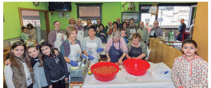
Berrogei urte bete ditu Lasarte-Oriako Extremadura etxeak. TXINTXARRI

Horregatik, sistema aldatzeko eskaera egin du Aire Garbiak. "Epe laburrera begira aldatu behar da sistema. Udalerri askok dagoeneko egin dute. Gainera, hori lortzeko eredu bakarra ez dago. Hainbat daude, herri bakoitzaren berezitasunera egokitu daitezke, gainera".