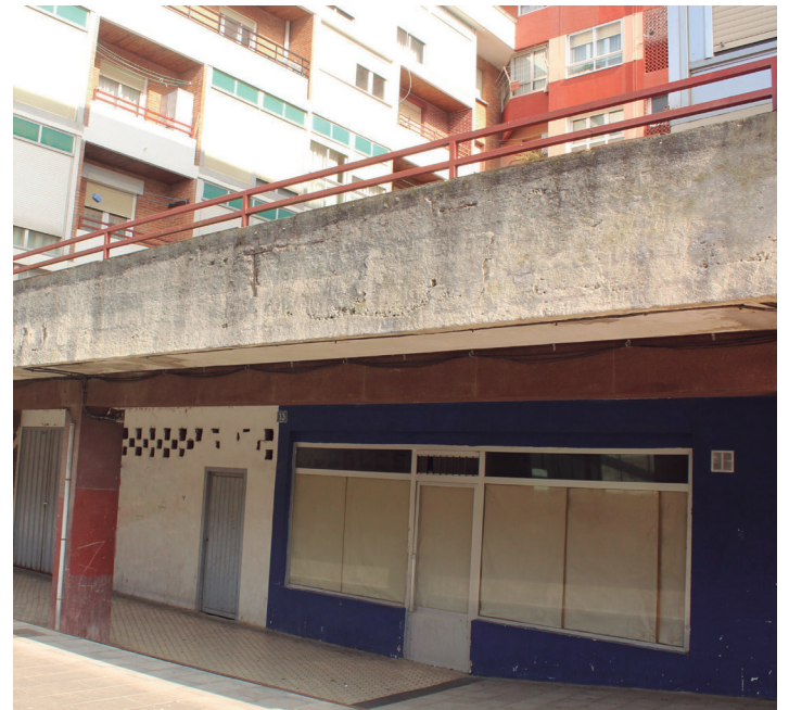
Eraitsi behar duten lokaletako bat. TXINTXARRI

Alabaina, 15B partzelan, Joredoren biltegia eta Gabirondo altzarrien erakusleihoaren