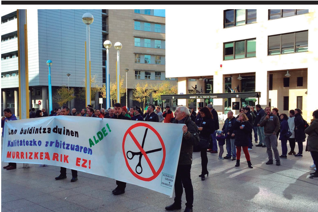
Gipuzkoako Foru Aldundiko Lurralde Antolaketeta sailaren aurrean azaroan eginiko protesta. AUTOBUSEAN MURRIZKETARIK EZ PLATAFORMA