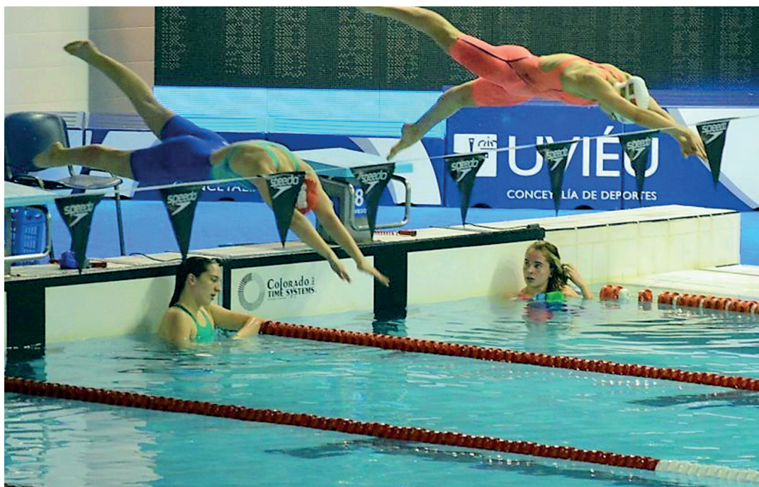
Sevillano eta Martin ahizpek Euskadirekin banakako probatan eta erreleboetan parte hartu dute. BURUNTZALDEA IKT