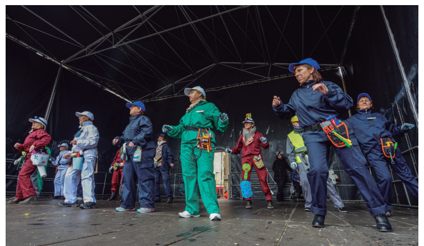
Emakumeen Zentro Zibikoak dantza erakustaldia egin zuen Okendoko oholtzan.

"Handiek ongi pasatzen dugu, baina hurrek oraindik hobeto"