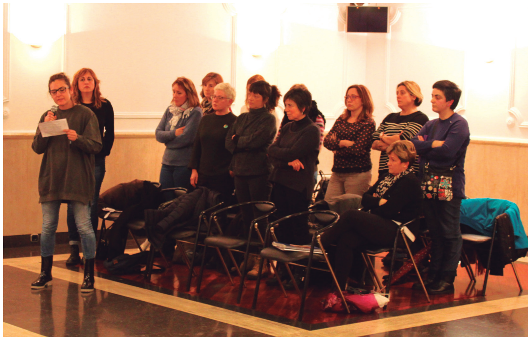
Atsobakarreko langielak, astearteko udalbatzarrean.