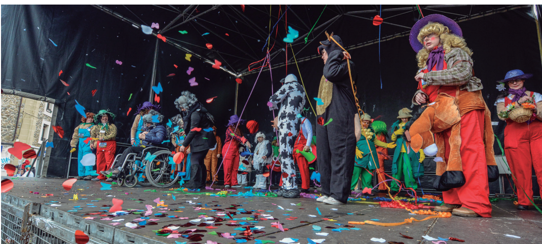
Jalgune elkarteak ere ikuskizun koloretsu eta animatua eskaini zuen Okendo plazan. TXINTXARRI