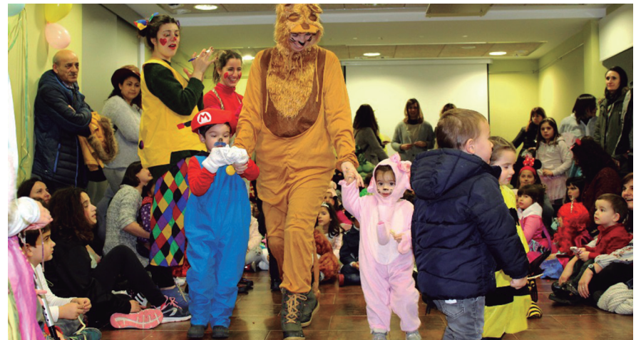
Mozorroak soinean, desfilean aritu ziren bertaratutako parte hartzaileak. TXINTXARRI