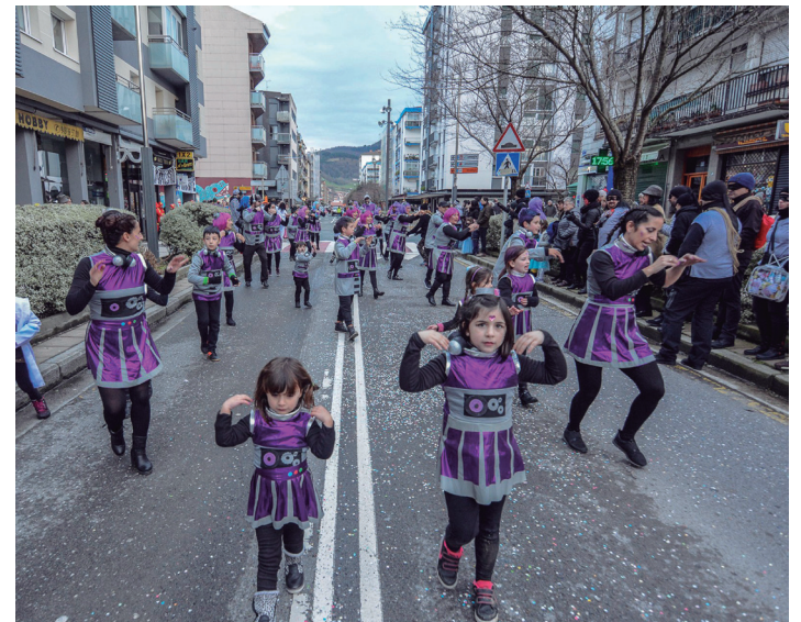
Sasoeta Sasoianeko kideak, desfilean.

Aurten hiru sari zeuden. Oholtza gainean egindako lanaren ondoren, bat irabazteko konfiantza geneukan. Iaz izan zen gure lehen urtea konpartsa bezala, eta asko hobetu dugula pentsatzen dugu. Pozik gaude sariarekin.