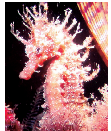
Itsas zaldia. TXINTXARRI

Ireki ditu atea Itsaspeko Zinemaren Nazioarteko Zikloak. Astelehen iluntzean eman zuten, Manuel Lekuona kultur etxean, lehen ikus-entzuzkoa. Horretan, itsaspeko bizitza ezagutzeko aukera izan zuten gerturatu ziren herritarrek, eta itsaspeko zaldien, olagarroen eta beste zenbait animalien bizitzaren berri jaso zuten ikus-entzuleek.