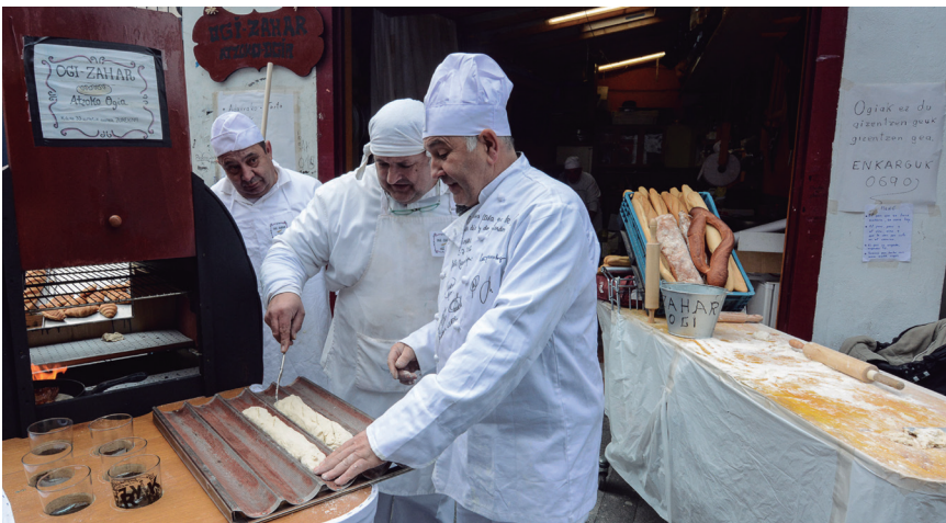
Ogia egin eta labean egosten aritu ziren okinez mozorrotutako zenbait lasarteoriatar. TXINTXARRI