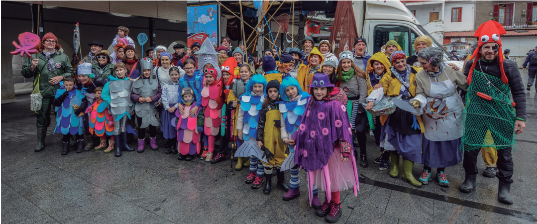
Zabaleta Auzolan elkarteko lagunek arrantzalez eta itsasoko animaliez mozorrotuta osatu dute aurtengo konpartsa. TXINTXARRI