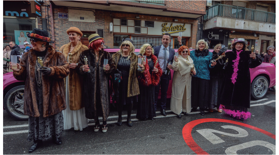
Limusina arrosa batean agertu ziren ATCKo lagunak, Kale Nagusira. TXINTXARRI