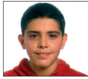
Hodei Zorionak familia guztiaren partetik, eta muxu handi bat!