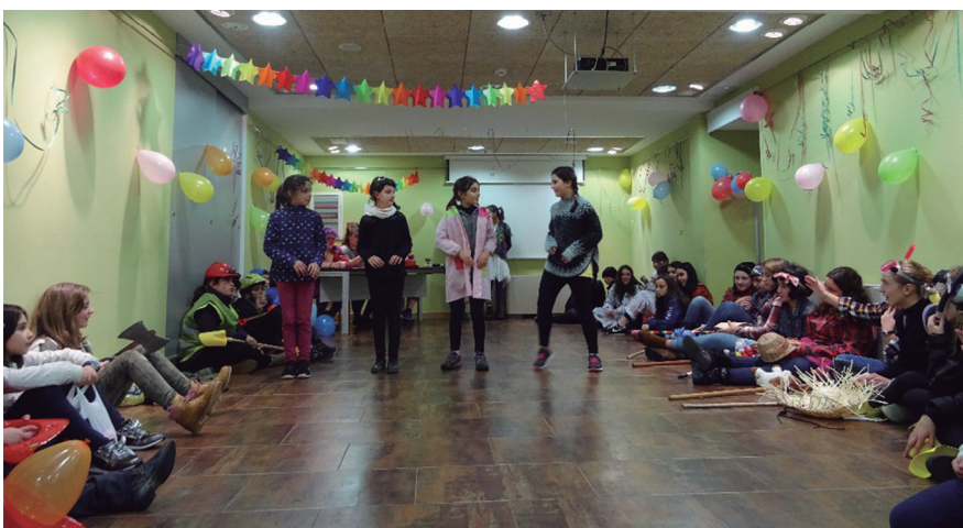
Festa koloretsuan eta animatuan aritu ziren herriko gazteak. TXINTXARRI