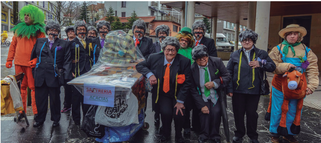
Jostunak ere herriko kaleetan barrena ibili ziren, jostundegi eta gutzi. TXINTXARRI