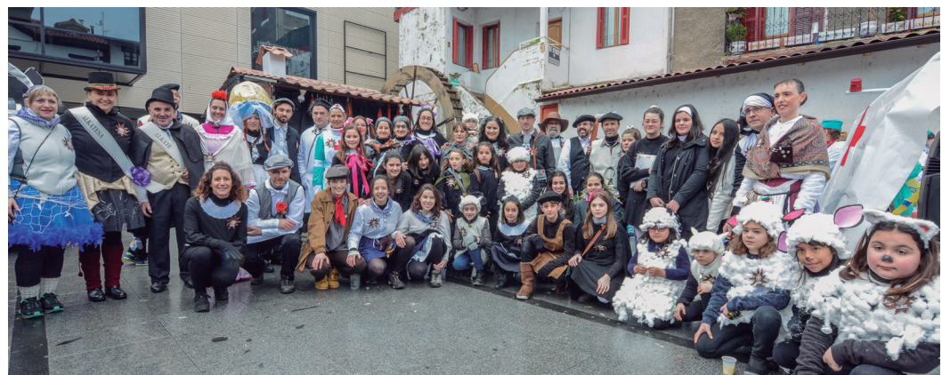
XIX. mendeko lanbideak ekarri zituzten Lasarte-Oriara Erketz EDT-ko lagunek. TXINTXARRI