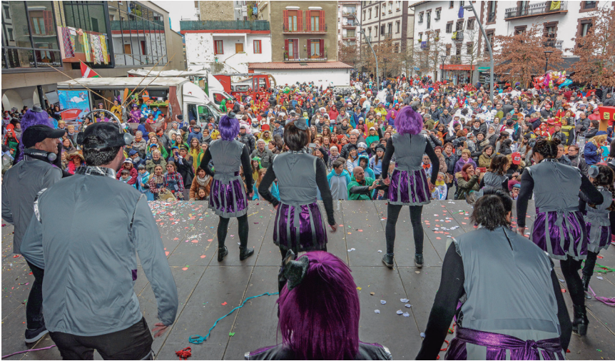
Sasoetako DJek dantzan jarri zituzten Okendon bildutako herritarrak. TXINTXARRI