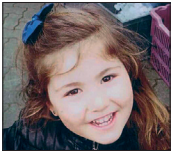
Aiara Zorionak printzesa! 6 muxu potolo familiaren partetik, asko maite zaitugu.