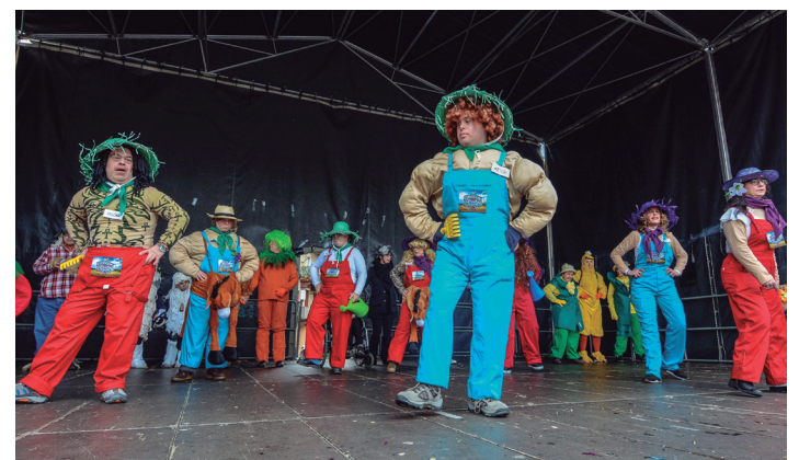
Jalguneko kideak, dantzan.

Dena egin dugu Jalgunen. Klubean genituen jantzi batzuk hartu genituen; begiraleek ere bagenituen batzuk. Urtero jantzietan egiten dugun inbertsioa txikia da.