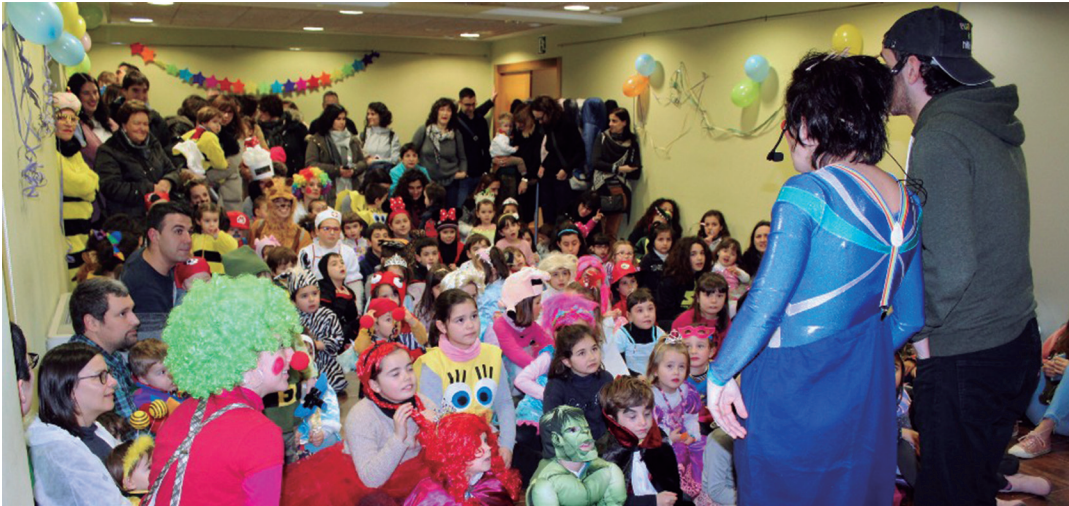
Plaza Irrintzika haurrentzako berbena egin zuten astelehen arratsaldean, Villa Mirentxun. TXINTXARRI