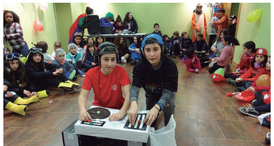
Mozorro ugari prestatu zituzten Gazte Klubeko eta Kuadrillategiko gazteek. TXINTXARRI