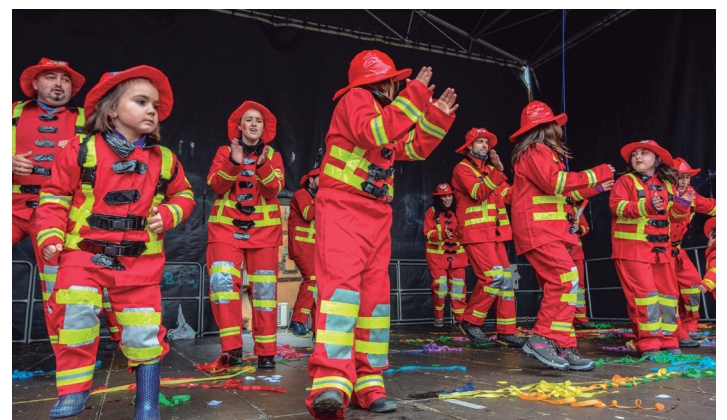
Intzak Parrandakoak, oholtza gainean. TXINTXARRI

Bai, beti joaten gara sari bila. Bost urtetan atera gara. Aurten eta bigarren urtean irabazi genuen. Karrozari garrantzia handia ematen diogu; hor jartzen ditugu indarrak.