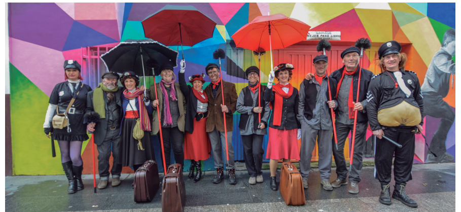
Herritar kuadrilla bat, Mary Poppins eta Bert pertsonaiez mozorrotuta.