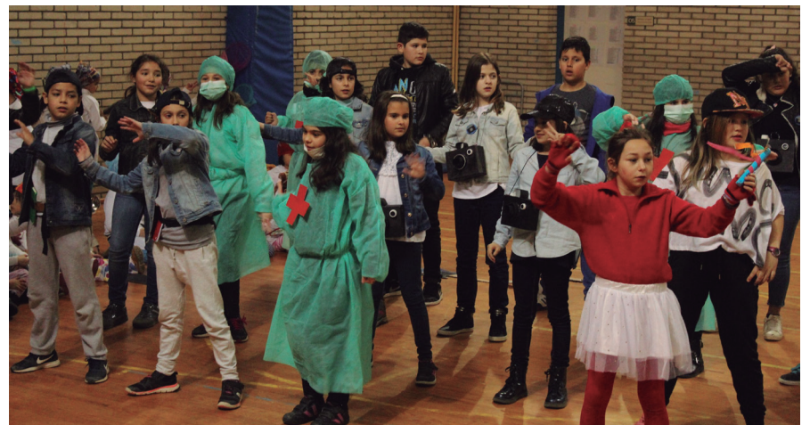
Sasoeta-Zumaburu ikastetxeko ikasleek ere gogoz dantzatu zuten ostiraleko jaialdian. TXINTXARRI