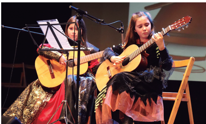
Musika Eskolako ikasleek Inauteritako Kontzertu Bufoa eskaini zuten. TXEMA VALLES