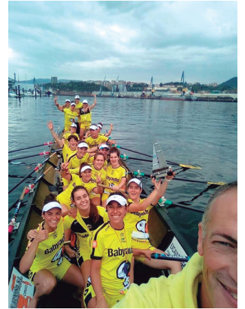
Oriako eskifaia. ORIOKO ARRAUN ELKARTEA