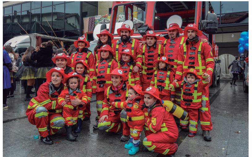
Intzak Parrandako kideek konpartsa onenaren lehen saria jaso zuten. TXINTXARRI

Larunbateko Inauterien jaialdia, irudietan