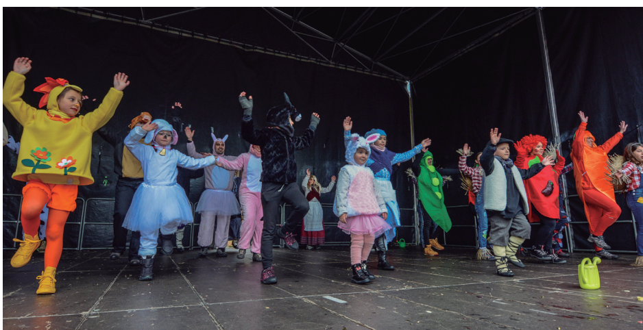
Animaliaz, barazkiz eta txorimaloz osatu zuen Larramendi baserria Larramendizalez konpartsak. TXINTXARRI