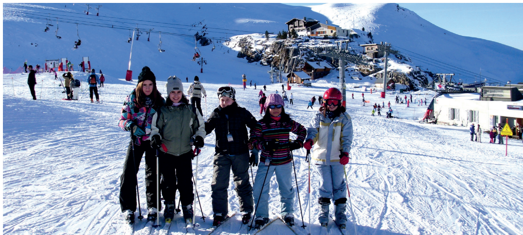
Ederki gozatuko dute Kuadrillategiko gazteek Valdezcarayko eski estazioan. KUADRILLATEGI