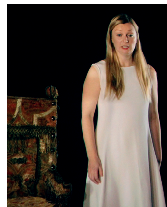
Rigoletto operaren momentu bat.

Manuel Lekuonan berritua opera denboraldia hasi da. Asteazkenean Giuseppe Verdi musikagile handiaren Rigoletto operaren proiektio digitalaz gozatu zuten areto nagusian bildu ziren herritarrek. Royal Opera Houseko abeslari eta musikarien lan honen hasieran, operari buruzko azalpen batzuk eskaini dituzte, ikusleek opera hobeto uler dezaten.