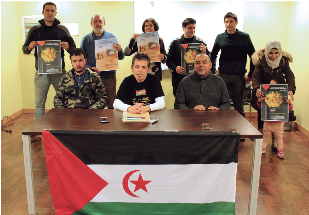
Euskal Herriko Lagunak Mendebaldeko Saharakoekin Bat taldeko kideak, asteazkeneko agerraldian. TXINTXARRI