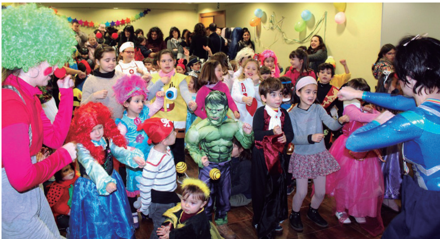
Euskarazko zenbait abesti kantatu eta dantzatu zituzten gaztetxoek eta gurasoek. TXINTXARRI

Argazki eta bideo galeria ikusteko, ikus txintxarri.eus ataria.