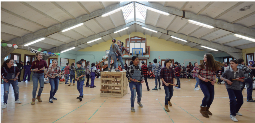
Landaberriko ikasleak inauteri festaz gozatu zuten ostiralean. TXINTXARRI