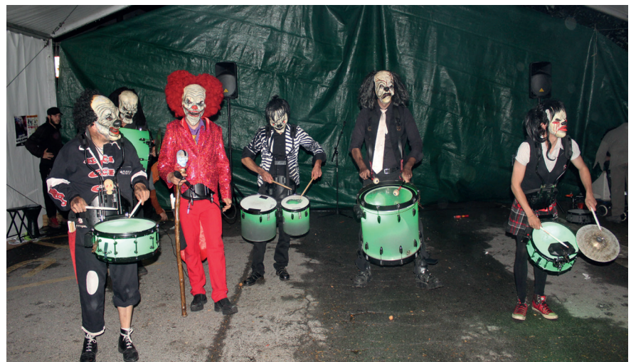
Ikusgarria izan zen ZoZongo taldearen Psycho-Clown emanaldia. TXINTXARRI