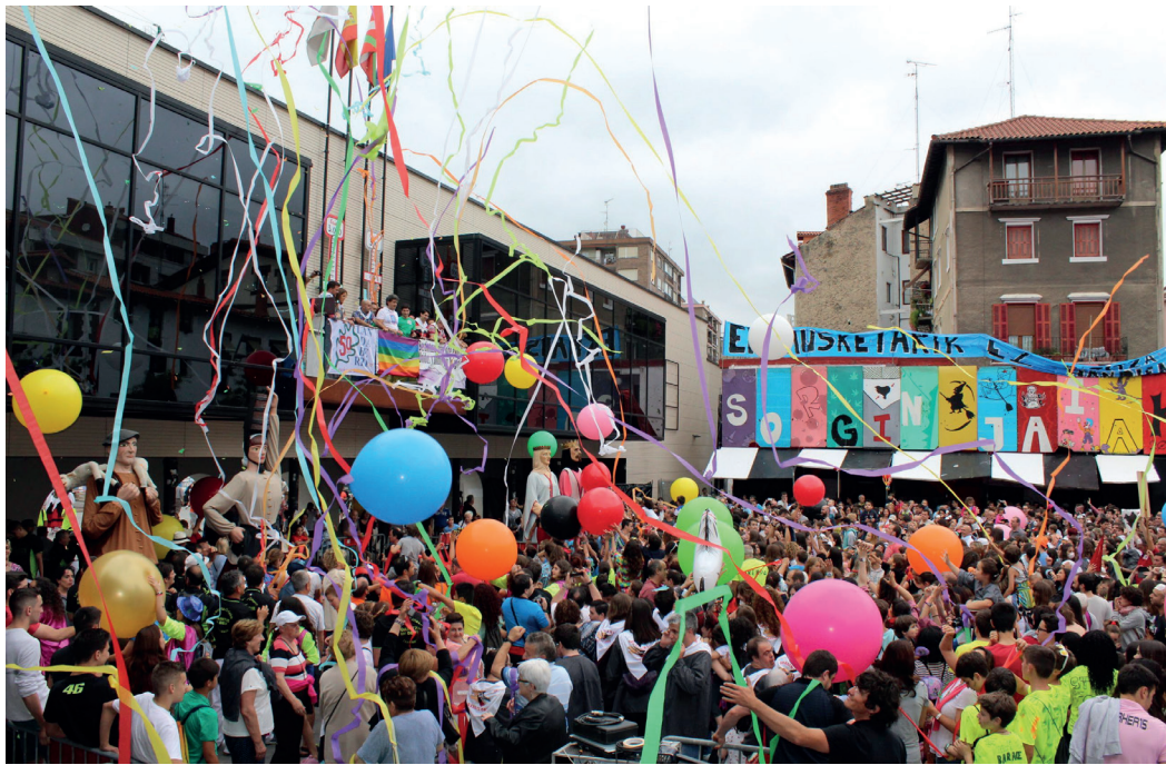
Ekainaren 28an izango da herriko festen txupinazioa. TXINTXARRI