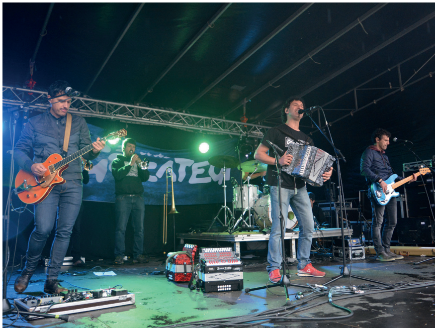
Gozategiren doinuek alaitu zuten igande arratsalde goibela. TXINTXARRI