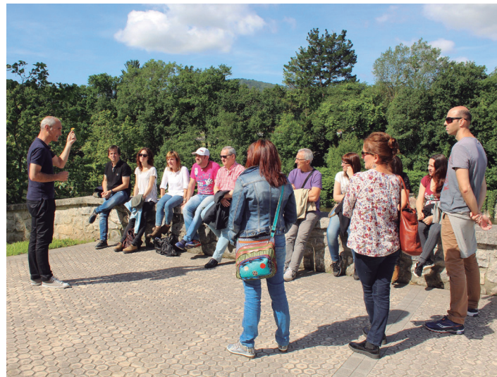
Herrian barrena ibilaldi gidatuan parte hartu zuten lasarteoriarrek. TXINTXARRI

Lehen atsedenaldiaren ostean, Zumaburu auzoko Isla plazara heldu, eta, bertako leku izenaren jatorria azaldu zuen Zalduak. Zumaburu, zumea (erdarazko mimbrea) eta buru hitzek osatua izan dela aipatu zuen; "zume asko dagoen lekua" esan nahi du Zumaburuk. "Garai batean,