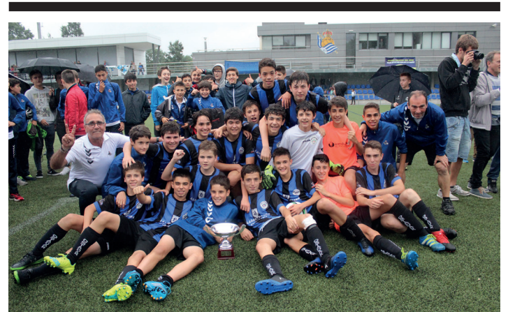
Ostadar SKTko jokalariei eta entrenatzaileak, garaipena ospatzen.