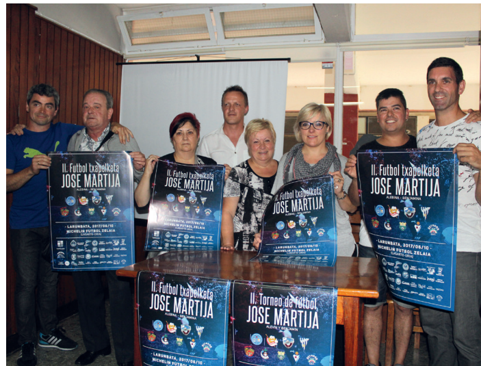
Antolatzaileak Martijatarrekin. TXINTXARRI

16:30ean berriro ekingo diote txapelketari, bigarren fasea hasiz. Talde bakoitzeko bi talde onenak finalerdietara sailkatuko dira, eta beste biak kontsolazio fasera.