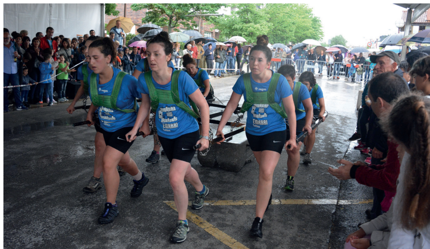
Emarri taldeko kideek 51 plaza t'erdi egin zituzten hogei minutuan, 550 kiloko harriarekin. TXINTXARRI

"Egun on, hau egun ederra, euria ari du, baina ederra da, plazetan; putzutik putzura, saltoka doazen ero batzuk gara". Horrela dio Gozategi taldearen Egunon abestiak. Igande arratsaldean eskaini zuen emanaldia Orioko taldeak, eta nahita aukeratu zuen kanta hori. Euria egin badu ere, ederra izan da asteburua Zabaletan. Hainbat ekintza egin zituzten.