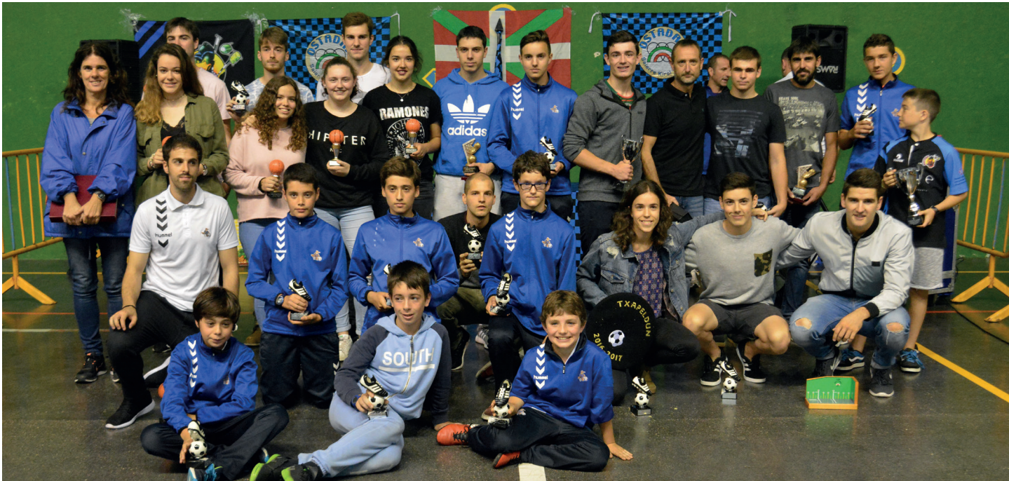
Joan den larunbateko festan saritutakoek talde argazkia atera zuten ekitaldi bukaeran. TXINTXARRI