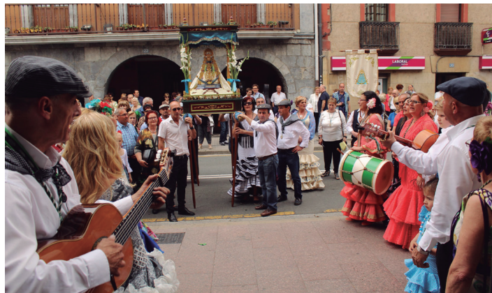
Bi eguneko festa antolatu du Semblante Andaluzek astebururako. TXINTXARRI

Aurreko urteen antzera, asteburu osoko festa izango da Rocioko erromeria; goiz eta arratsalde askotariko ekintzak izango dira herritarren gozamenarako, eta, Lasarte-Oriako taldeekin batera, eskualdeko beste haibat ere izango dira gurean.