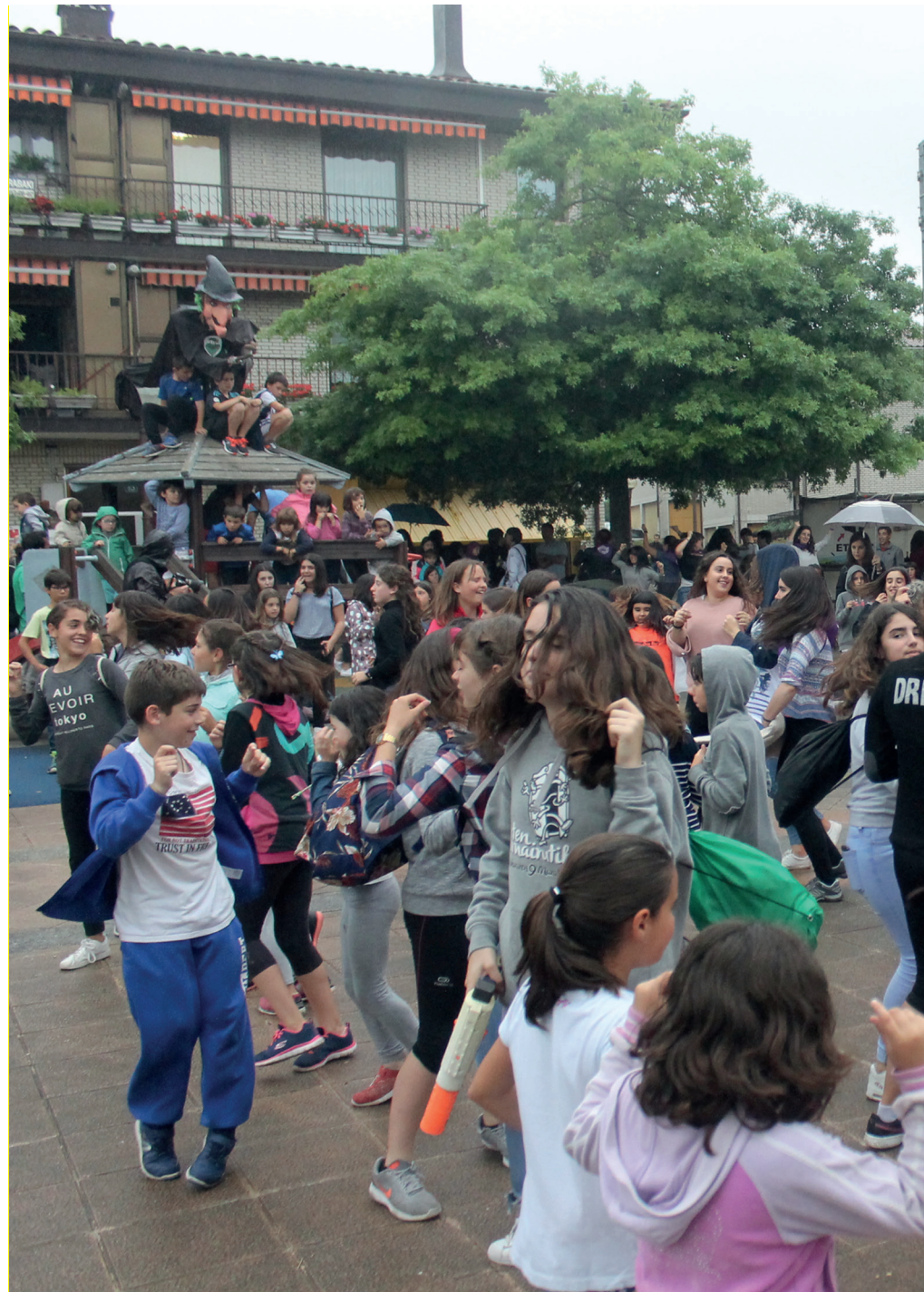
Igandeko Dantzari Txiki Eguna bikain bukatu zuten parte hartzaile guztiek. Ttiriki-Ttarrakako kideen doinuek laguntzarekin.