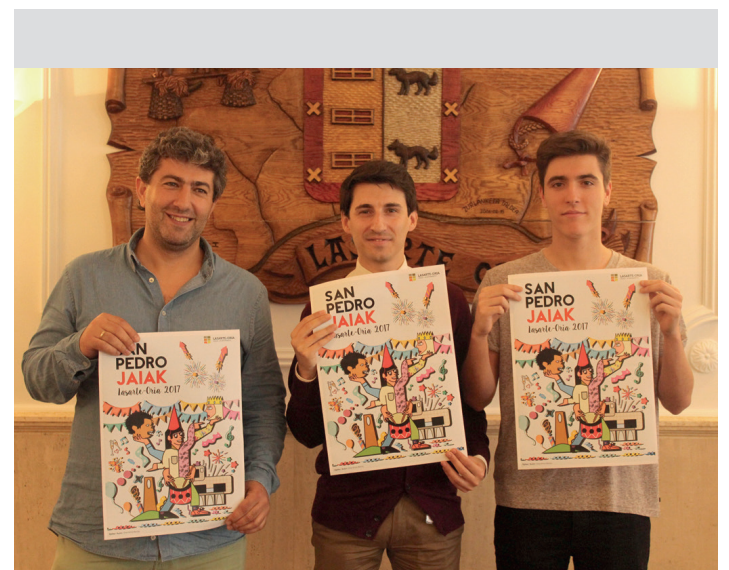
Udaletxean izan zen kartelaren aurkezpena.