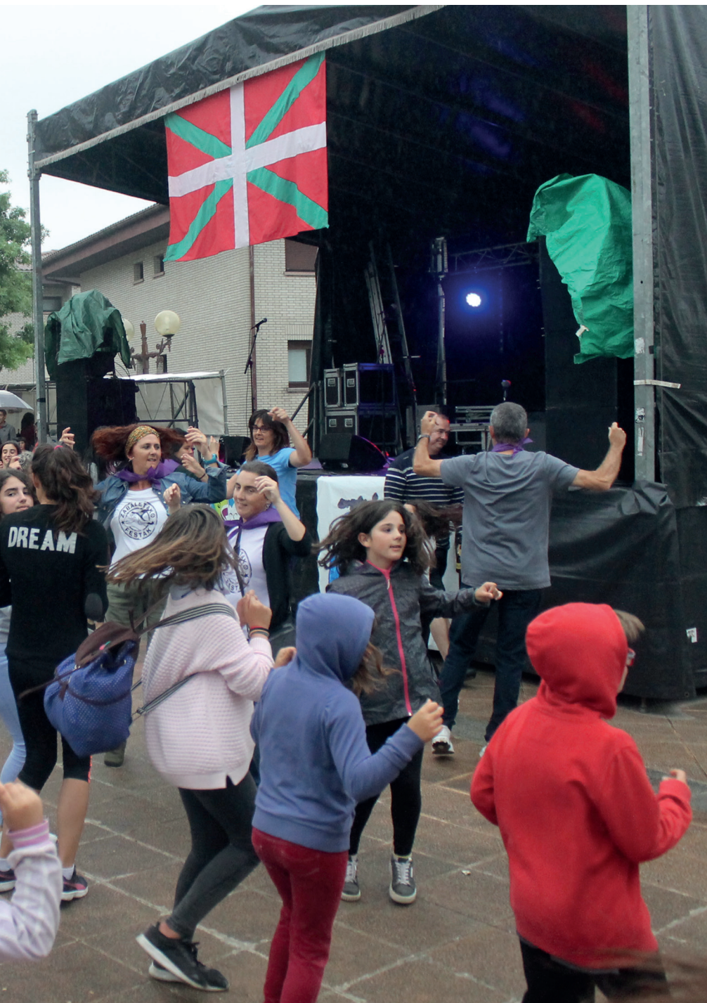
tzarekin, arin-arina eta fandangoa dantzatu zituzten, eta kalejira erraldoia egin. TXINTXARRI