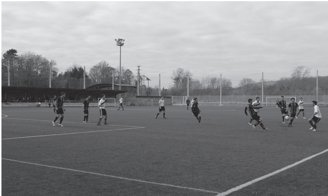
Ohorezko erregionalak 5-1 irabazi zuen Martutene KEaren aurka, igandean, etxean.

Partida ona egin ez bazuten ere, garaipen garrantzitsua eskuratzeko lortu zuten etxeok mutilek.