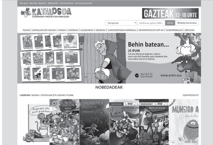
Katalogoa.eus helbidean dago katalogo birtuala urte osoan zehar martxan.

Urteko garai honetan seme-alabei edo ingurukoei euskarazko liburuak, musika edota jokoak erosi eta oparitzeko aukera paregabea izaten dela kontuan hartuz, Euskarazko Produktuen Katalogoaren edizio berria osatu dute Euskal Herriko 140 bat udal eta mankomunitatetako euskara batzordek, tartean Lasarte-Oriakoak.