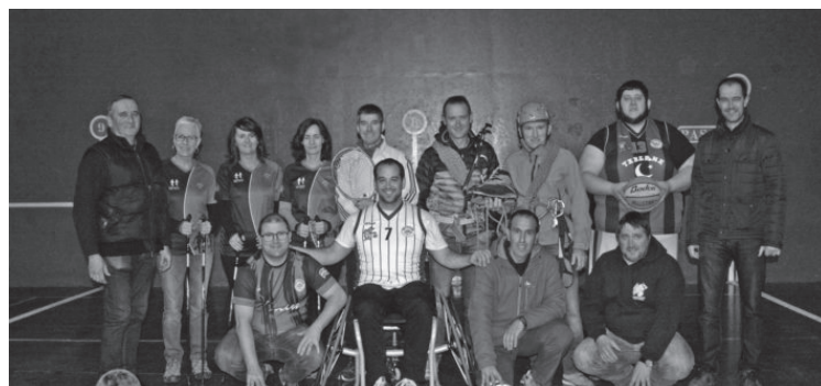
Irudian, Ostadar SKTko alor desberdinetako arduradunak. OSTADAR SKT

Bestalde, iazko denboraldian zehar Ostadar SKTk eskainitako alor guztietan kirola egin zuten herritarren datuak eman ditu elkarteak. "8 eta 75 urte bitarteko 980 pertsonak egin zuten kirola Ostadarren bitartez, alor hauetan: saskibaloia, futbola, areto-futbola, tenisa, mendia, txirrindularitza, ipar martxa, atletismoa eta boloak eta toka".