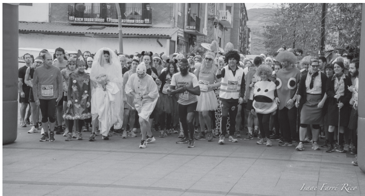
Aurten ere herritar asko animatuko dira San Silvestre lasterketa egitera.

Egun horretarako apuntatu ez direnek badauzkate aukera gehiago ere. Hilaren 29an eta 30ean Manuel Lekuona kultur