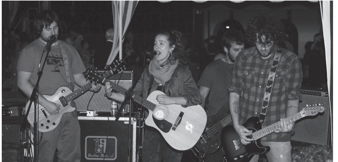
Jaialdiak iaz izandako arrakasta kontuan izanda, aurten ere larunbatean egin zuten Kalera Fest ekimena, herrian.

Batetik "arratsaldeko kontzertuak ez dira tabernen kanpoaldean izango. Aurten