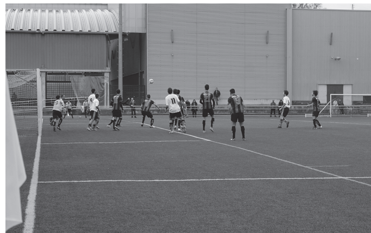
Jokoa kanpoko taldea izan zen nagusi, baina etxeok izan ziren garaile.

Aurkari gogorra izango dute datorren norgehiagokan, Ohorezko erregionalek. Hernani CDren aurka jokatuko dute datorren igandean.