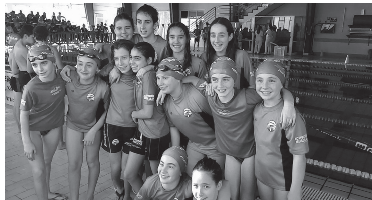
Alebinen ligako 3. jardunaldia jokatu zuten. BURUNTZALDEA IKT

Astebete lehenago, Gipuzkoako Kluben Kopa jokatu zuten kategoria horietako igerilariak Ordizian, emaitza paregabeak erdietsiz: infantil neskek txapelkunorde izan ziren erreleboetan adibidez, eta taldekideek 25 marka pertsonal erdietsi zituzten.