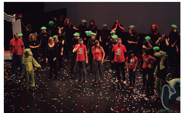
Euskararen Maratoiko kideak, emanaldian parte hartu zuten, protagonistekin batera.