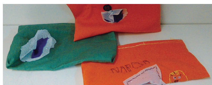
Ederki egin dute lan gaztetxoek eta estutxe batzuk josi dituzte,