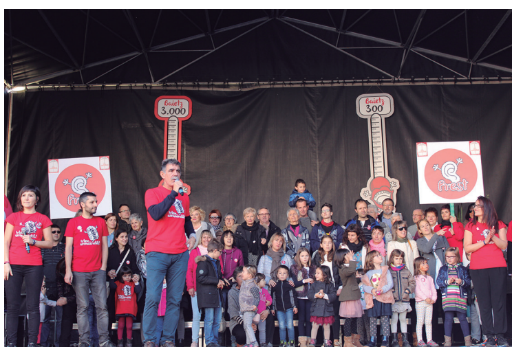
Ekitaldian zehar, Belarriprest eta Ahobiziak igo ziren plazako oholtzara.