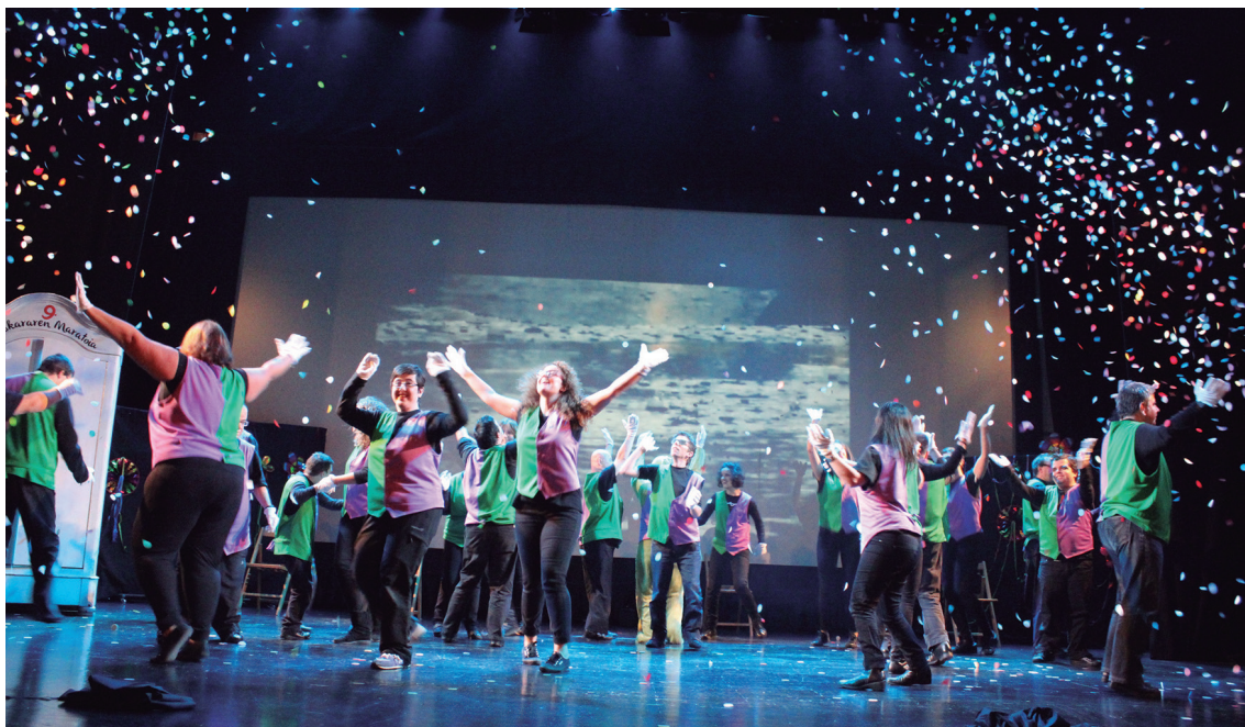
Emanaldi koloretsu bezain alai eskaini zuten Jalguneko kideek. Askotariko abestia ezagunak abestu eta dantzatu zituzten.