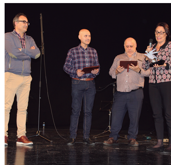
Jaialdia amaitu aurretik, oroigarri bana jaso zuten Semblante Andaluzeko, Casa Extremeñako eta Udaleko ordezkariak.