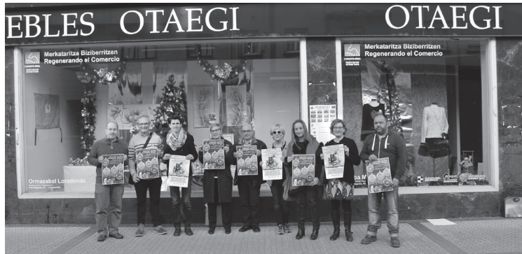
Aterpeko eta Udaleko ordezkariak jardunaldien aurkezpenan.

Gabonetako festak gero eta gertuago daude. Horren harira, Lasarte-Oriako Udalak eta Aterpea herriko merkatarien elkarteak 'Gabonak zurekin prestatzen ditugu!' egitasmoa prestatu dute. Hurrengo astelehenetik ostiralera bitarte, ekintzaz jositako egitaraua osatu dute.