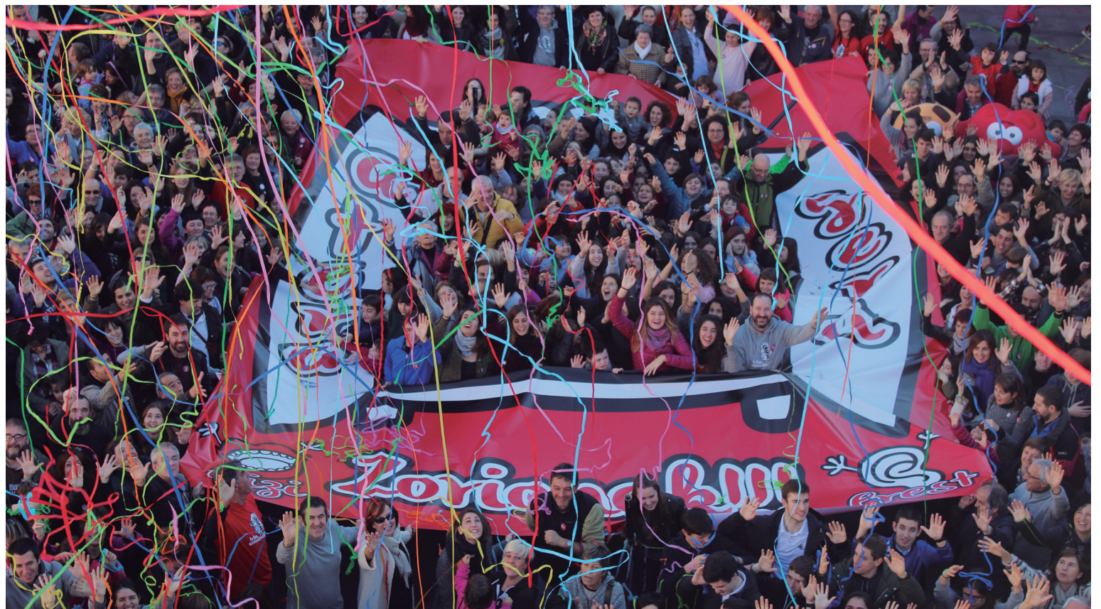
Armairutik irten direla irudikatzen, argazki erraldoia atera zuten Okendo plazan bildutako Ahobizi, Belarriprest eta herritar guztiek.

Hurrengo TXINTXARRI-a abenduaren 12an argitaratuko dugu. Herriko informazio guztia txintxarri.eus atarian