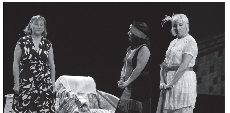
'La eterna juventud' antzezlan eskaini zuten ostiralean. TXEMA VALLES

Bestalde, Baketikek eta Lasarte-Oriako elkarkidetzak taldeak sustatuta, 'Emakumeak eta bake prozesuak: Euskadi eta