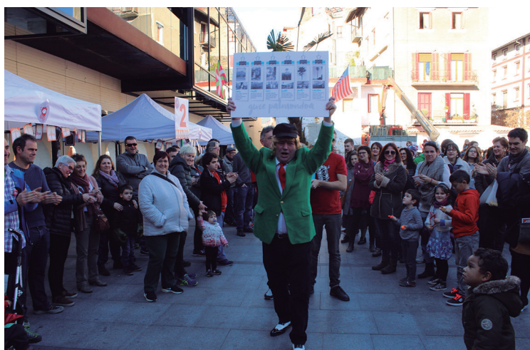
Ez zen falta izan palmondoari aldarri egiteko tarterik ere.