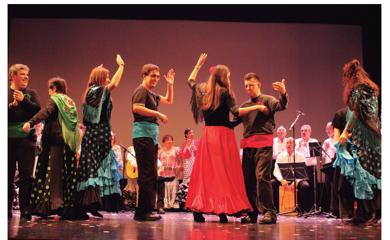
Semblante Rociera abesbatzak Jalguneri egindako abestia entzun ahal izan zen.