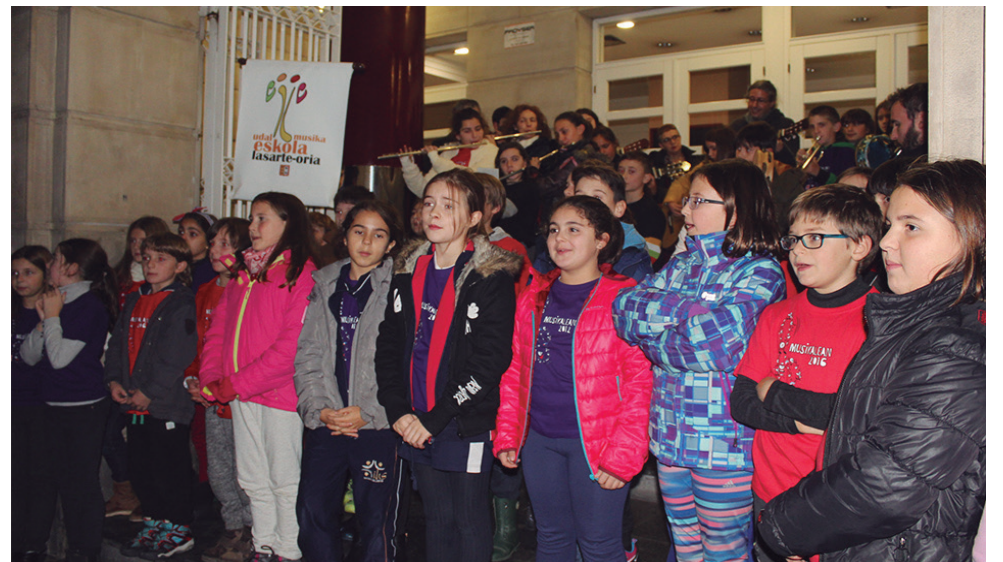
Udal Musika eskolako kideek asteazkenean emanaldi txikia egin zuten Manuel Lekuonan.