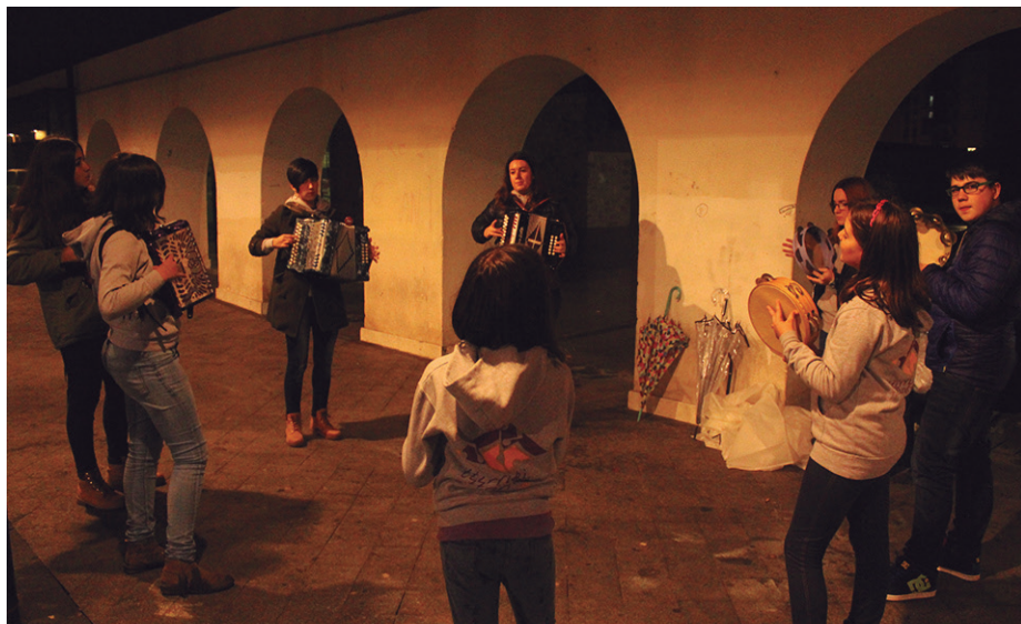
Ttiriki Tarraka eskolako kideek eguraldiari aurre eginez Santa Zezilia ospatu zuten asteartean.