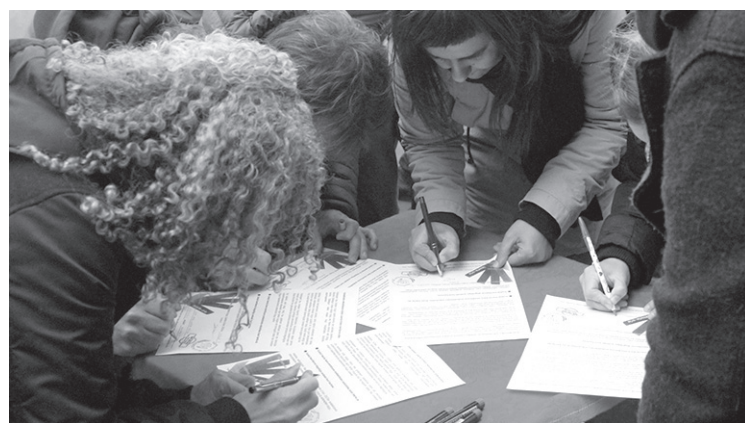
Urte hasieran galdeketa egiteko sinadura bilketa egin zen. Orain galdeketa eguna igorriko da.

Egun honetako ekimena, 12:00ak aldera hasiko da. Horretan, bi herritar zutabe aterako dira Atsobakar eta Zumaburu auzoetatik herriko erdialderantz.