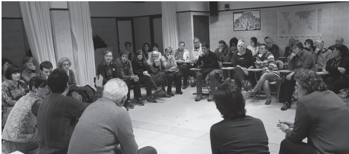
Herritarrek adi jarraitu zituzten hizlarien azalpenak, eta euren iritzi, kezka eta galderak ere plazaratu zituzten mahai-inguruan.

Manifestaziora deitu du GuraSOsek bihar Donostian, 17:00etan