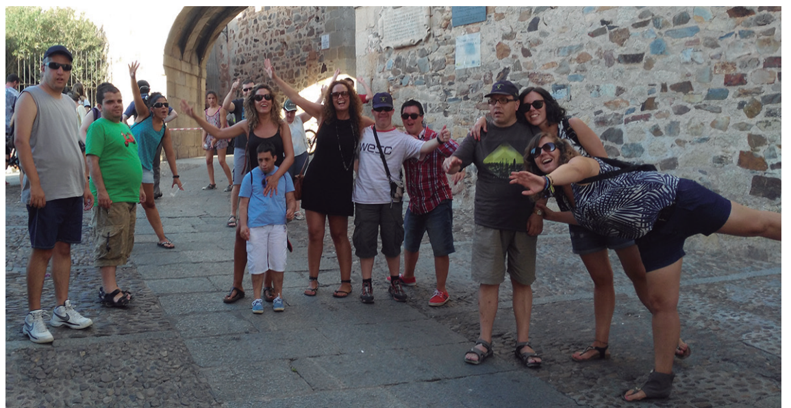
Hamaika ekintzez gozatzeko aukera izan zuten begirale zein gazteek.

Jalguneraren hasierako urteetan astebeteko bidaiak egiten zituzten. Salbuespen modura, egitasmo hori errekuperatzea pentsatu zuten egungo begirale eta kideek. "Gazteen proposamenak