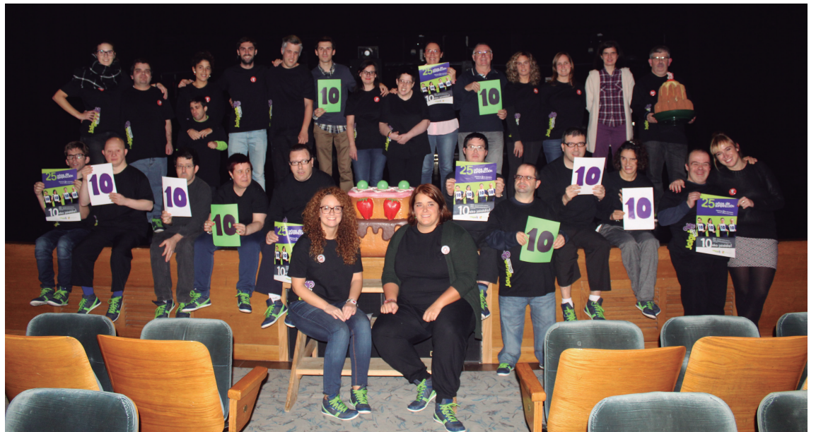
Jalguneren hamargarren jaialdia izango da aurtengoa. Era berean, elkarteak 25 urte bete ditu.

“Ibilbide honetan mota askotako esperientziak ezagutu ditugu: atseginagoak batzuk, zailak, pozgarriak eta emozioz betetakoak besteak. Hauek guztiak hala ere, guretzako aberasgarriak izan dira, guztietatik ikasi dugulako eta argi dago ez direla perfektuak izan”, adierazi zuten Jalguneko begirale eta erabiltzaileek.