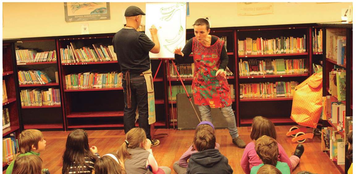
Kontu Kantoiko kideek esate baterako, herensuge baten istorioa kontatu zieten etxeak gaztetxoak.