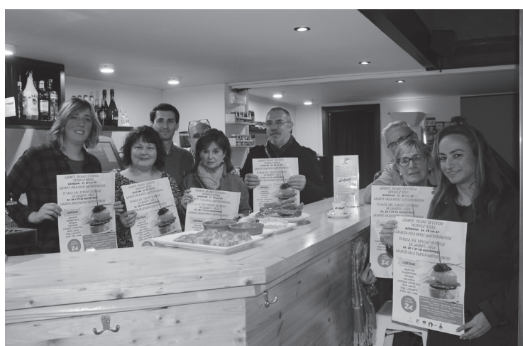
Pintxo Ibilbidearen IV. edizioa izango da aurtengoa. Asteburu honetan egingo da.

Ordutegiak hauek dira: ostiralean, 19:00etatik 21:00etara; larunbatean, eguerdian zehar eta 19:00etatik 21:00etara; eta igandean, eguerdian zehar. Taberna eta jatetxeetako pintxoak dastatzen joan ahala,