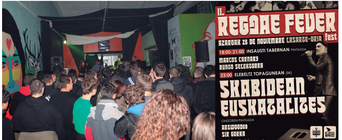
Lehenengo 'Reggae Fever Fest' jaialdiko kontzertuetako irudia eta aurtengo edizioko kartela.

Amaitzean, jaia Elebeltz Topagunera lekuz aldatuko da