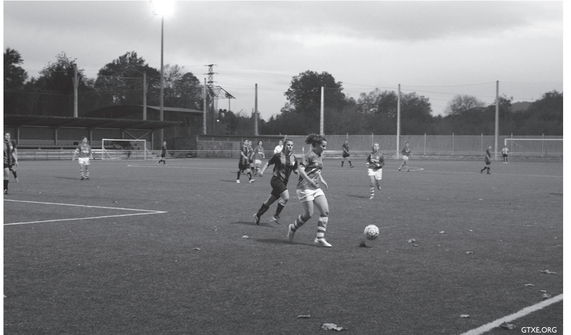
Jokoan nagusi izan ziren herriko neskek larunbatean, etxean jokaturako norgehiagokan.

Guztira, bederatzita norgehiagoka jokatu dituzte erregional mailako Ostadar SKT emakumezkoen taldeak eta hiru garaipen lortu dituzte horietatik. Itzuliko partidua jokatzeko hasiko dira orain.