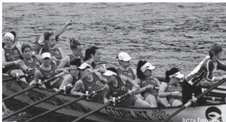
Getaria-Zarautzek ez du emakumezkoen trainerua aterako aurten.

Talde horrek aurten aterako du estreinakoz emakumeen trainerua. Gazteak dira arraunlari denak, eta, Intzak kontatu digunez, bera izango da beterranoena (20 urte ditu herritarrek): "Hasiberri asko daude, ni naiz esperientzia gehien daukana; asko balora-