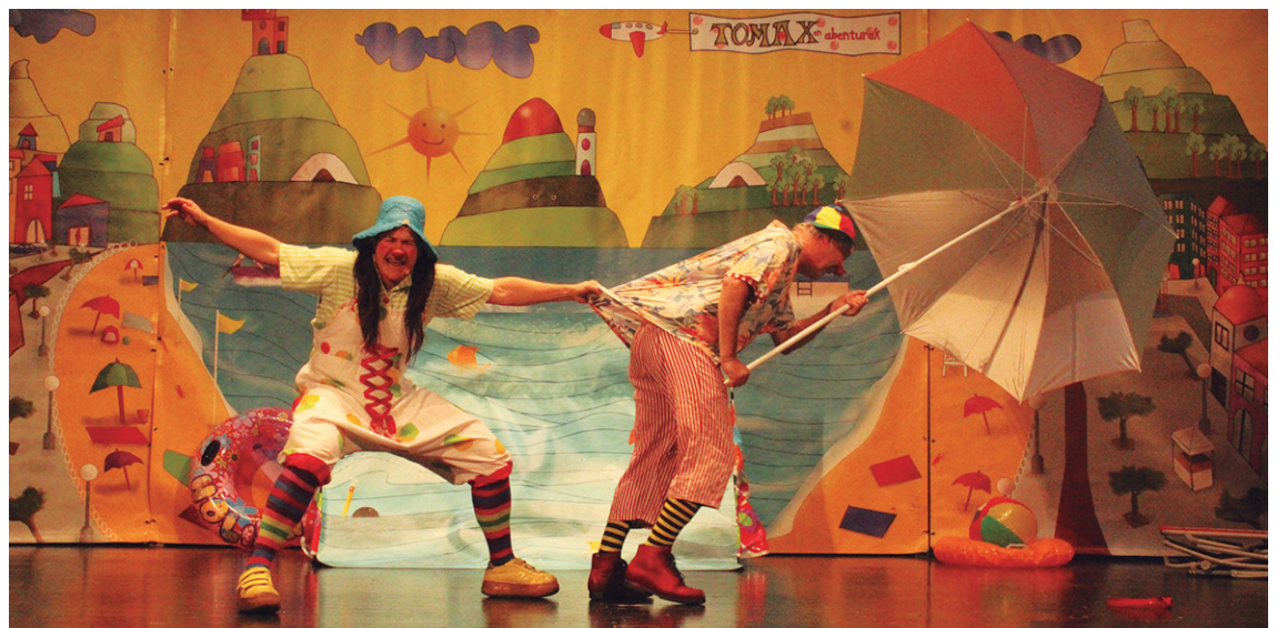
Larunbat arratsaldean, etxeko txikienei zuzendutako 'Tomaxen abenturak' antzerki obra eskaini zuten.