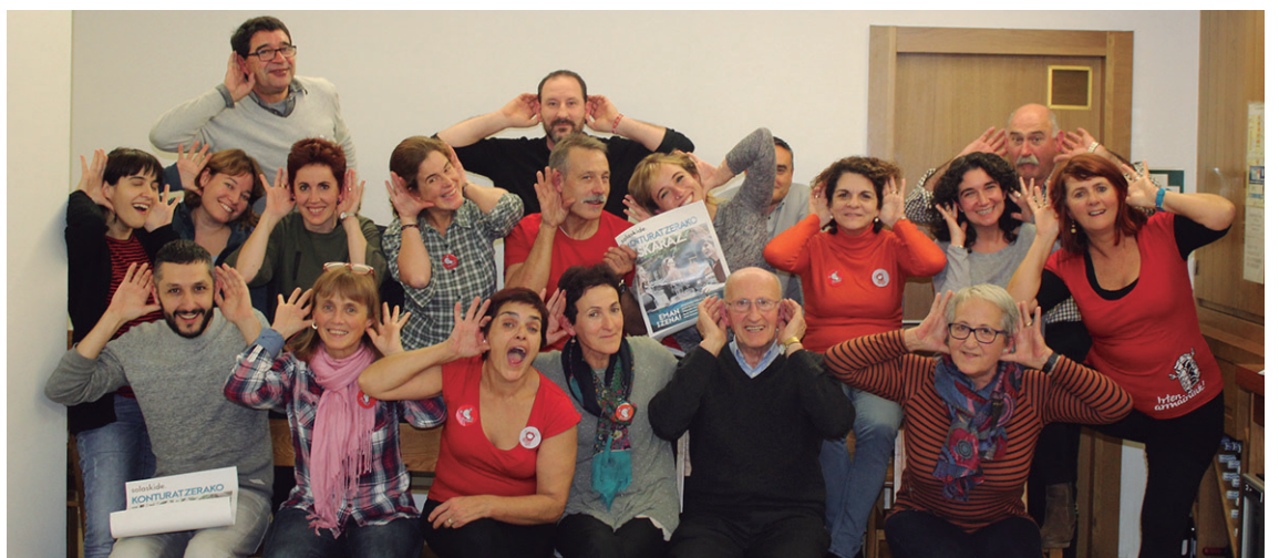
Solaskideek ederki pasa zuten ikasturte hasierako afari berezian.

Euskaldun berrien eskaerari erantzun egokia eman ahal izateko, euskaldun zaharrak