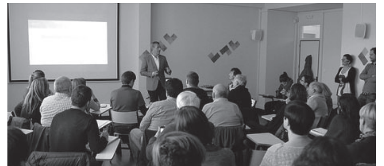
Olanok aurreko asteko topaketan..

Diputatu nagusiak gogoratu zuenez, Gipuzkoak lurralde aurreratu, jasangarri eta integratzailea izaterainoko bidea egin du azken bi hamarkadetan, baina krisi ekonomikoak sistemaren indargune eta ahuleziak agerian utzi ditu. Jasotako ekarpenek eta programa honetan identifikatutako aurrerakuntzek indarrean dagoen Kudeaketa Plan Estrategikoa eguneratuko dute.