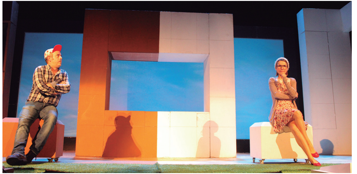
'Ondoko hilobiko tipoa' antzezlanak ikusi ahal izan zen ostiral gauean, Manuel Lekuona Kultur Etxean.

Haurrek aldiz, Tomax eta Muxugorriekin batera, hondartzan ibiltzeko tartea izan zuten larunbatean. Itsasoa, bertako animalia eta izaki-bizidunak gertuagotik ezagutzeko aukera izan zuten etxeko txikiek. Horrekin batera, dantzan ere aritu ziren haur eta gurasoak; Eva Mirentxu abesti ezaguna dantzatuaz eman zioten hasiera antzezlanari.