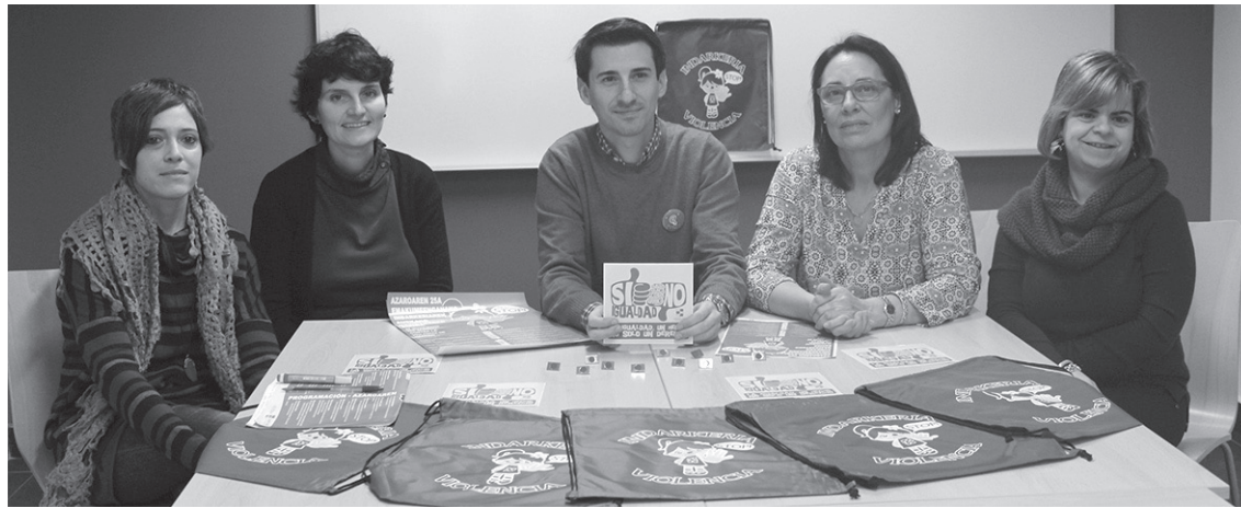
Udal ordezkariak eta teknikariak genero indarkeriaren aurkako astearen aurkezpenean.

Azaroaren 25ean, Genero indarkeriaren aurkako eguna da. Honen harira Lasarte-Oriako Udalak, Emakumeen Zentro eta beste eragilerekin batera hainbat ekintza antolatu ditu. Aurten sentsi-bilizazioan jarri dute indarra.