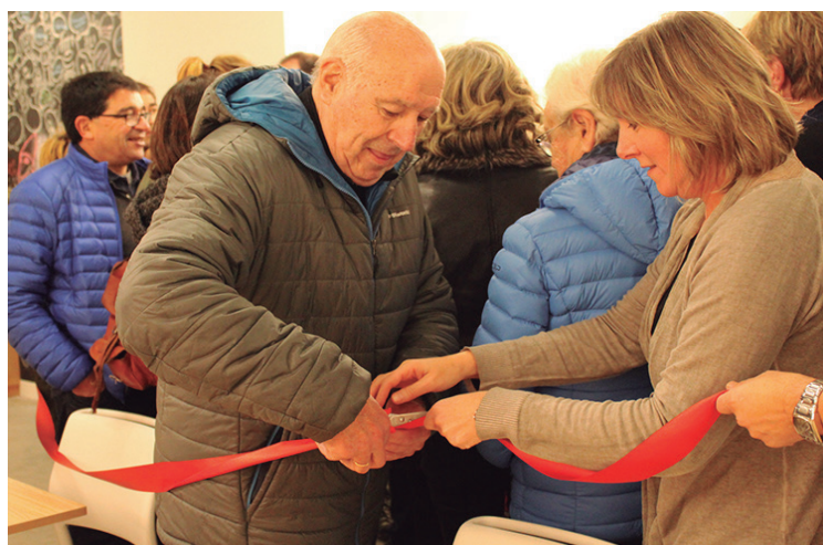
Ttakunenea lokalaren inaugurazio eta zinta mozketa berezia egin zen.