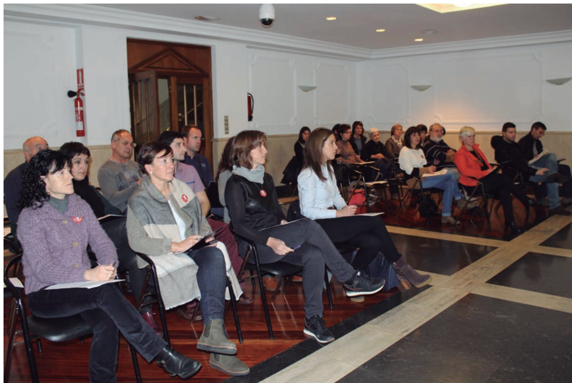
Udaletxeko kideek, zinegotzi zein langilek, erronkarekin bat egin dute 5. txandan.

Udaletxeko langile eta politikariak, berriz, 63 Ahobizi eta 22 Belarriprest, atzo bildu ziren, batzar aretoan erronka 5. astean gauzatzeko eta bertan izan zen ikerketa zuzentzen ari