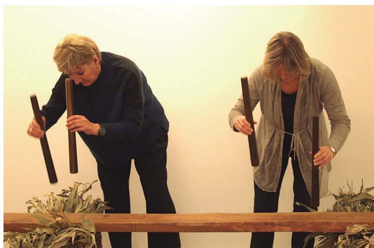
Txalaparta doinuek eman zioten hasiera ekitaldiari.