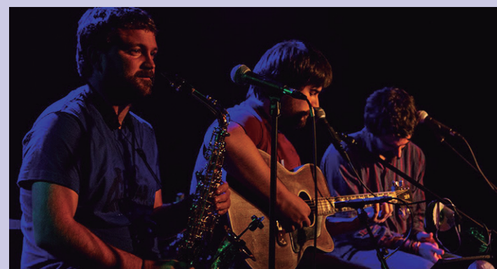
'Bi Zaldi' zaldibiko taldearen kontzertua izango da bihar. BI ZALDI

Antzokian, Ttakunek 25 urte hauetan egin duen ibilbideari buruzko erakusketa izango da ikusgai.