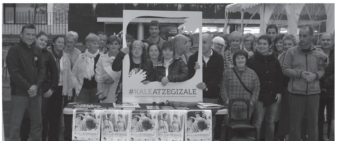
Atzegiko kideak, familiak eta Atzegizaleak Hernanin egin zen aurkezpenean.

Kanpaina urte osoan zehar bizirik mantendu eta poliki poliki Gipuzkoako kale guztietan Atzegiko kideen bizitza hobetzen duten pertsona horiek ezagutzera emateko asmoarekin #KaleAtzegizale-en argazkiak jaso nahi ditu