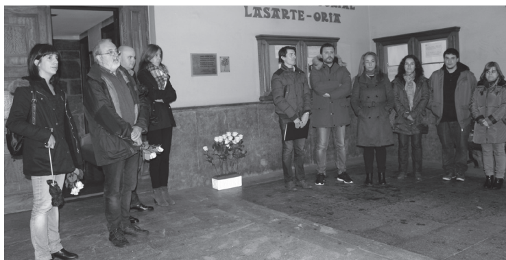
Aurten Udaletxeko arkupeetan egin zen ekitaldia eguraldi txarra medio.

Lore eskaintza egin zen Udaletxeko arkupeetan baina EHBilduko bi kideek loreak Askatasunaren parkean uztea erabaki zuten, "azken urteetan guneak lortu duen inklusi-