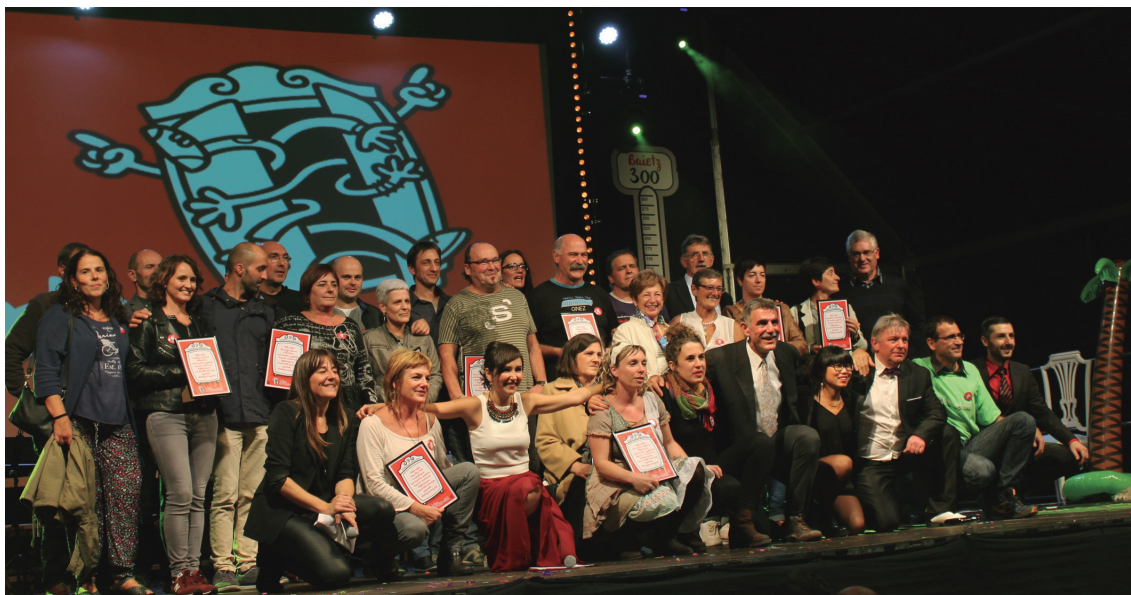
Euskararen 9. Maratoian Euskoskar saria jaso zuten herriko euskalgintzako eragileek, tartean Ttakunek.

Larunbatean, azaroak 19, 20:00etan, 'Bi zaldi' taldearen kontzertuaz gozatu ahal izango da Jalgi kafe Antzokian, sarrera doan. Ttakunek herritarrak ekintzetan parte hartze- ra animatzen ditu.