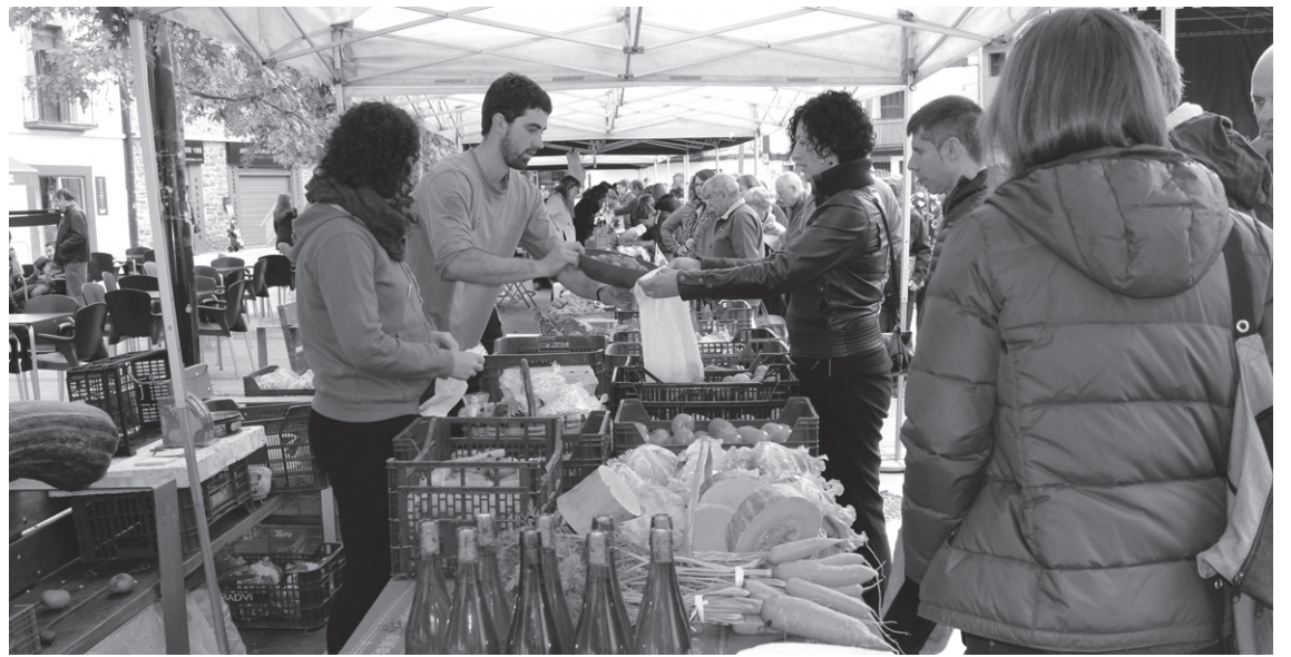
Askotariko produktuak erosteko aukera izan zen azokan. Irudian, Telleri baserriko herritarrek barazkiak saltzen.