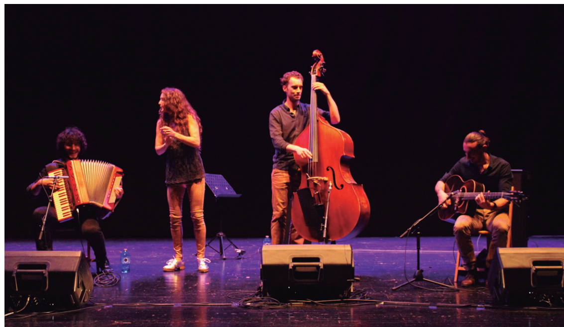
Musika emanaldi ikusgarria izan zen 'Clak'Tek' taldearena. Dantza eta musika uztartu zituzten taldekideek emanaldian.