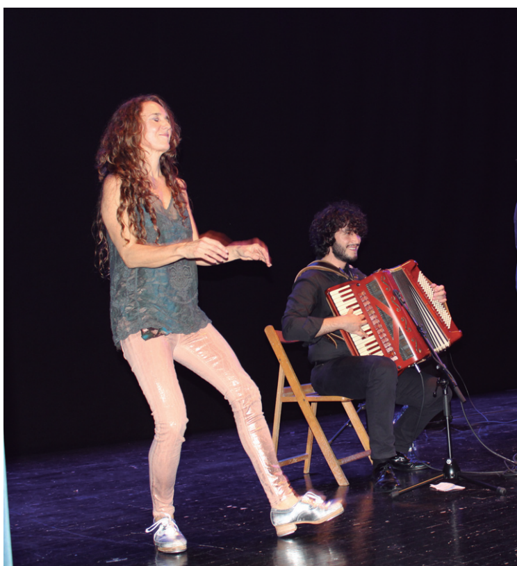
Musika doinuen erritmora, bizi-bizi, mugitzen zituen Sagari Ur dantzariak hankak.