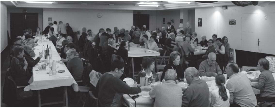
Argazkian, Cadizen lan egiten duen 'Tierra de Todos' fundazioaren alde egindako afari solidarioaren une bat.