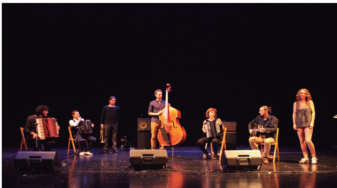
Jaialdiaren amaieran, elkarrekin jo zuten emanaldian parte hartu zuten musikariek eta dantzariak.