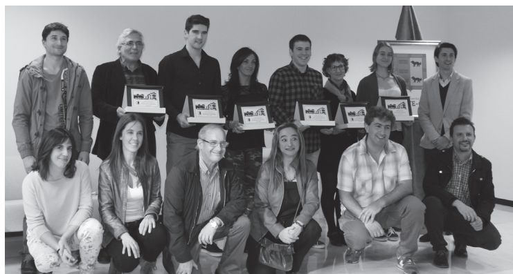
Sei kirolari saritu zituen iaz Lasarte-Oriako Udalak.

Hiru kategoriatan emango ditu sariak udalak: emakumezko kirolariaren 2016ko