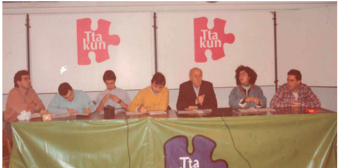
1992. urtean egin zen Gizartetxean elkartearen lehenengo batzarra.

Haurren eta gazteen ekintzak antolatzen zituzten elkarte eta erakunde asko gaztelaniaz aritzen ziren, eta