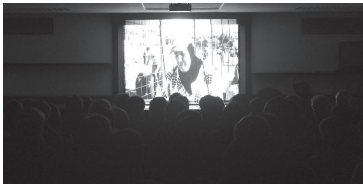
Herritar ugari bildu zen 'Las lágrimas de África' dokumentala ikustera.

Etorkinen eta errefuxiatuen egoera gogora ekartzeko Topaketa asteak burutu dira gure herrian. Asteburuko bi ekintzetan Afrikatik datozen etorkinak izan dira protagonistak. Bihar arte, 'Somos migrantes' erakusketa izango da ikusgai Antonio Mercero aretoan.