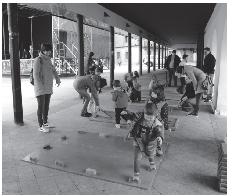
Haurrentzako jolas ezberdinak izan ziren Udaletxeko arkupeetan.