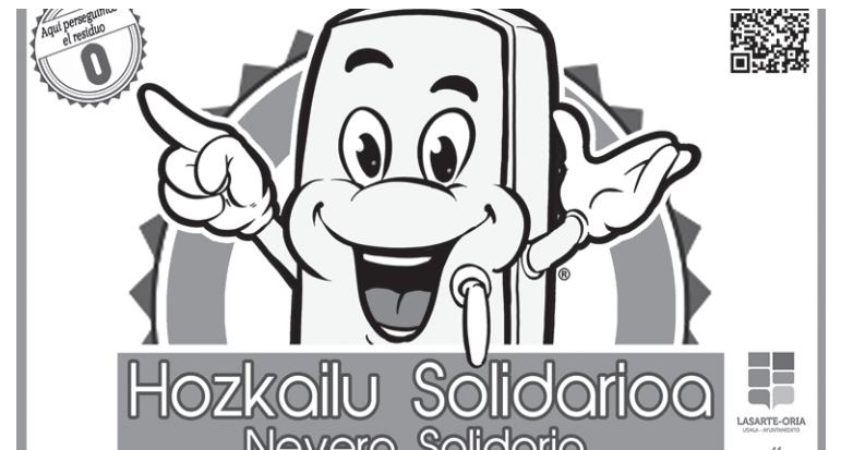
Pegatina hau jarriko dute establezimenduek haien atean.

Janari zarrastelkeria hori ekidin daiteke 'Hozkailu Solidarioa' proiektuari esker.