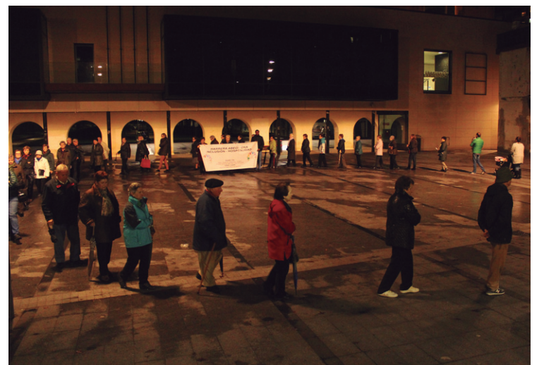
Ekintza isila egin zuten atzo etorkin eta errefuxiatuei elkartasuna adierazteko.

Azkenik, Topaketa asteko antolakuntzako kideek gogorarazten duten moduan, 'Somos migrantes' erakusketa egongo da Antonio Mercero aretoan. Azaroaren 15ean itxiko ditu bere ateak eta honekin batera, amaituko da Topaketa astea.