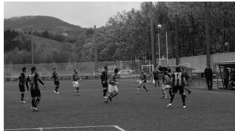
Ohorezko erregionalak 2-1 irabazi zuen Beti Gazteren aurka.

Denboraldiko lehen partidu irabazi zuen Ohorezko erregionalak, Beti Gazteri 2-1 irabazita, bederatzigarren jardunaldian. Bestalde, Ohorezko jubenilek 0-2 hartu zuten mendean Hernani, eta multzoko liderrak izaten jarraitzen dute, 21 puntu poltsikoratuta.