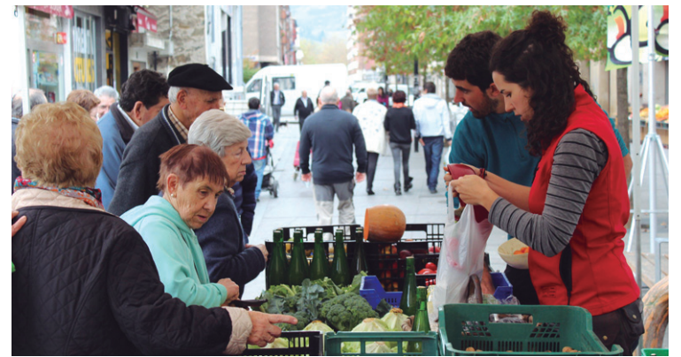
Telleri baserriko kideak aurten ere izango dira Baserri azokan.

Berrikuntza modura, Irungo behi haragi produktuak ekarriko dituen postua nabarmendu zuen, "Pirinioetako eta Terreña arrazako behiak hazten dituzte. Orain Eskoziako