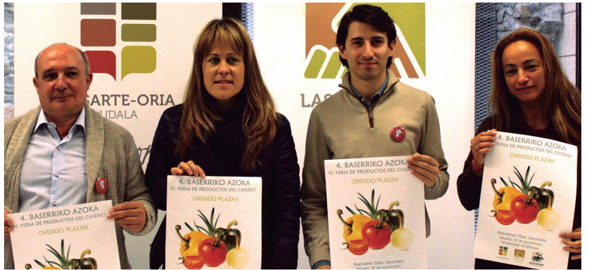
Udal ordezkariak eta Behemendiko ordezkaria 4. Baserri azokaren aurkezpenean.

Larunbata goizean hamabi ekoizle izango dira Okendo plazan