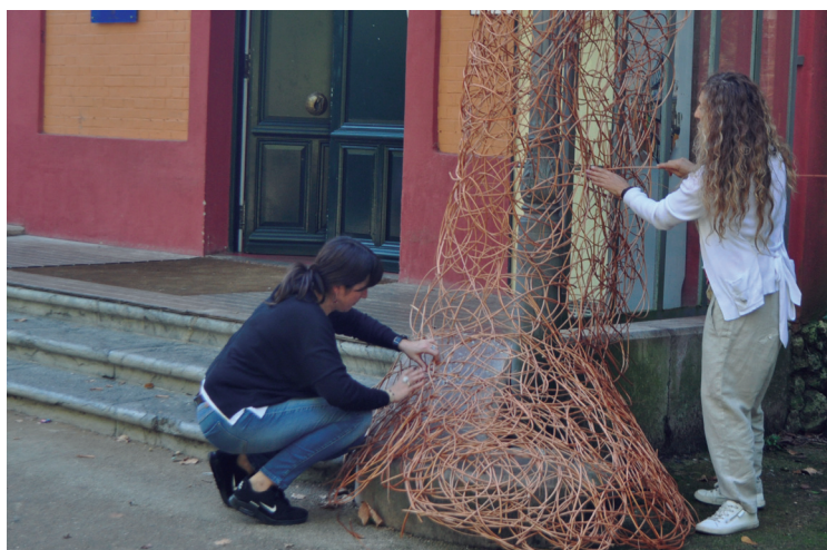
Ikastaroan burututako bi eskultura handiak Idoiak berak jarri zituen eta oraindik ikusgai daude.

Honetan 'habia-teknika' erabiliz, zumezko bi eskultura handi egin ahal izan zituzten parte hartzaileek. "Naturan eta txoriek beren habiak egiten dituzten moduan oinarrituta".