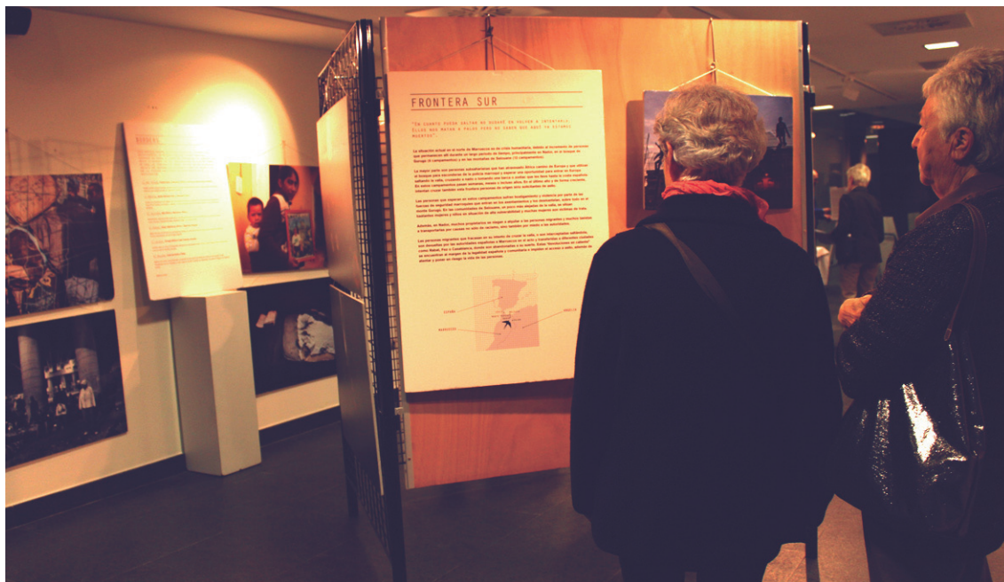
Hainbat herritar hurbildu dira aste honetan 'Somos migrantes' erakusketa ikustera.

Honela jarraitzen du, "2016 urtean orban handiak ditugu, hala nola, gudak, gosea, aberatsek esplotazioa sustatzen dute...Honek 65 milioi pertsonen haien etxeak uztea ekarri du. Gehienak errefuxiatu kanpamentuetan bizi dira. egunen batean bertatik ateratzeko esperantzarekin, bizi ahalko diren lur baten bila; batzuk pausoa ematera ausartzen dira, saia-