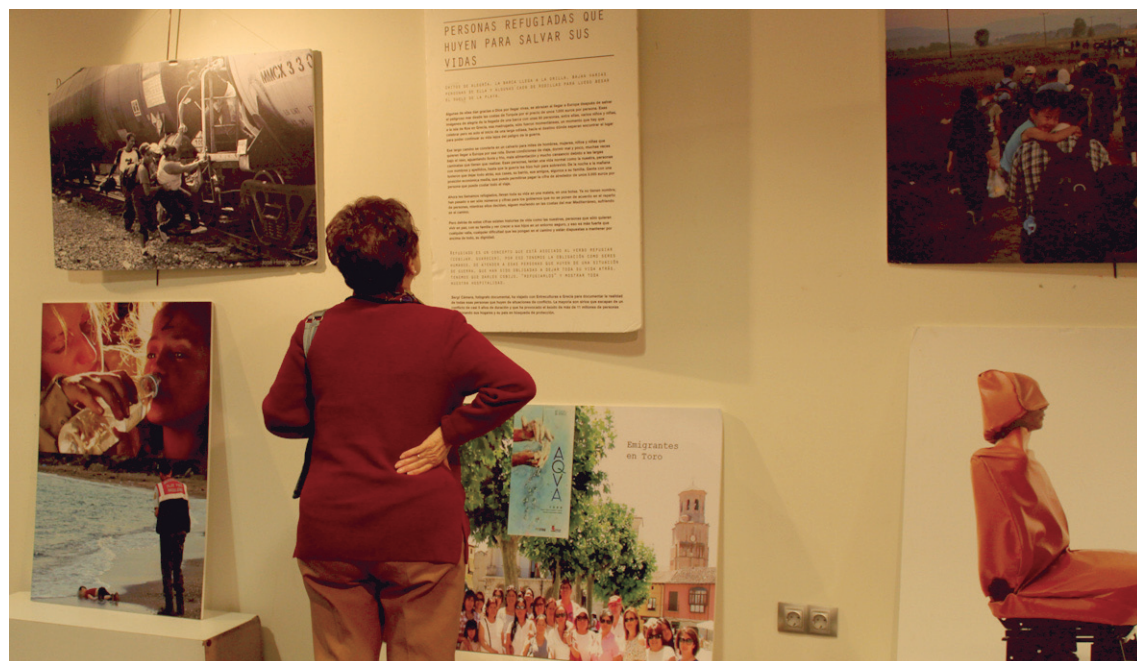
Etorkinen egoera aurkezten duten argazki eta panelak daude ikusgai erakusketan.

Antolatzaileek herritarrek gonbidatzen dituzte Topaketa aste-ko ekimenetan parte hartzea.