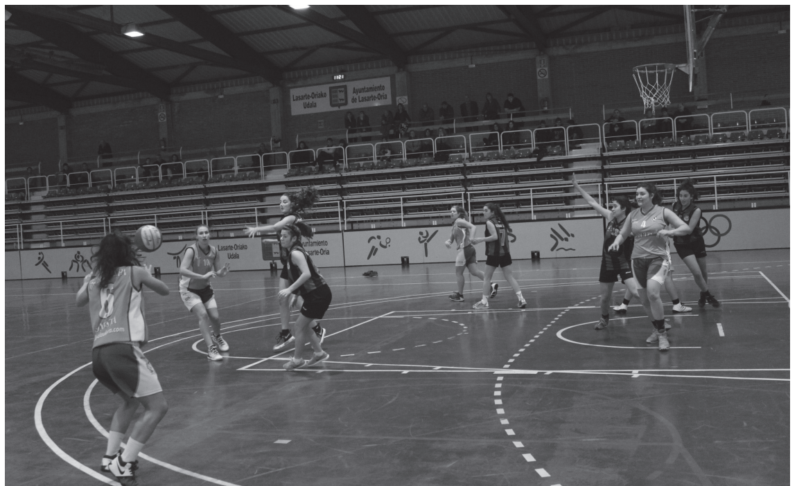
Ostadar SKT Probintzialeko Senior nesken taldeak Bera-Bera izan zuen aurkari, igandean, Udal Kiroldegian.

Laugarren laurdenean, ordura arteko jokoa mantenduta, aurkariak bi hiruko saskiratze egin eta aurretik jarri zen Bera-Bera. Minutu baten faltan, beste hiruko saskiratze bat eginda, 65 eta 59 markagailuan atzetik ziren Ostadar