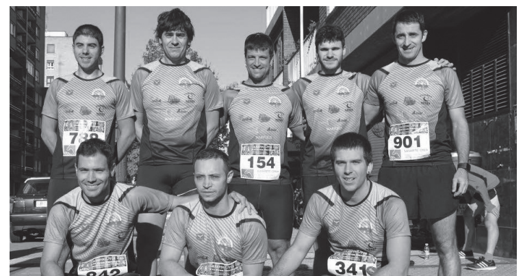
Herriko krosetan hainbat taldekideek hartu zuten parte.

Taldeak kirol-materiala ere atera du aurten. Proba desberdinetan oso presente egon dira berde eta beltz koloreak. 2017ra begira, beste eskaera bat egin behar dute. Hori dela eta, interesa eduki dezaketen pertsonak taldekideekin jarri behar dute harremanetan, aurrez aipatutako bide horiek erabiliz. Behin hori eginda, Trinkoko kideek materialari buruzko aukeren berri eman gero diete interesatuei.