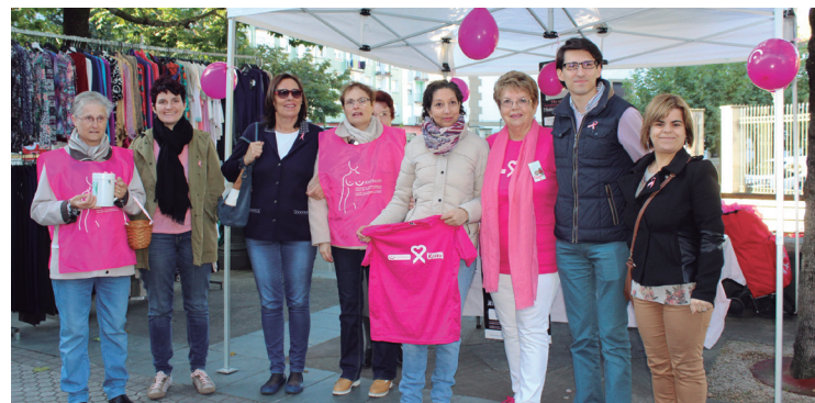
Karpan Katxalinekoek informazioa eman eta lazoak banatu zituzten.

Bestalde, borrokaren ikur bilakatu den lazo arrosa jarri zen Udaletxeko balkoiko buru egun honetan. "Borroka horretan pertsona eta instituzio guztiok inplikatu beharra daukagula gogorarazteko. Kontzientziatzea, prebentzioa, ikerketa dira borroka horretarako giltzarriak".