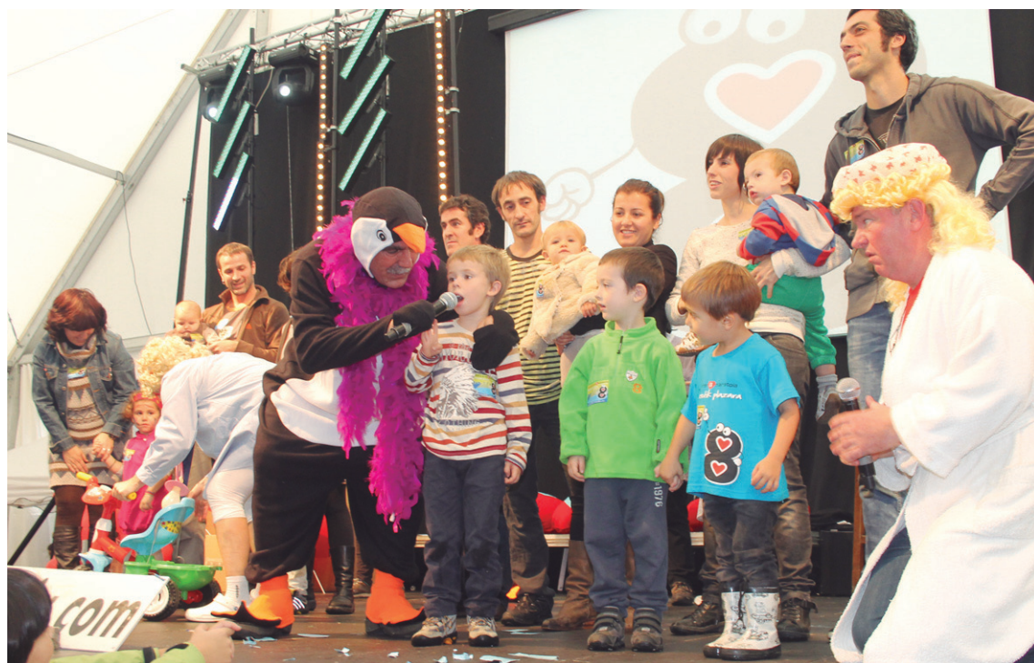
8. Maratoian lehenengoz, maratoien artean jaiotako haurrei ongi etorria egin zitzaizen. Aurten ere, igande arratsaldean izango da tartea.

Eta astelehenean Euskararen 9. Maratoiko errepasoa eginenez zenbaki berezia izango da lasarteoriarren postontzietan.