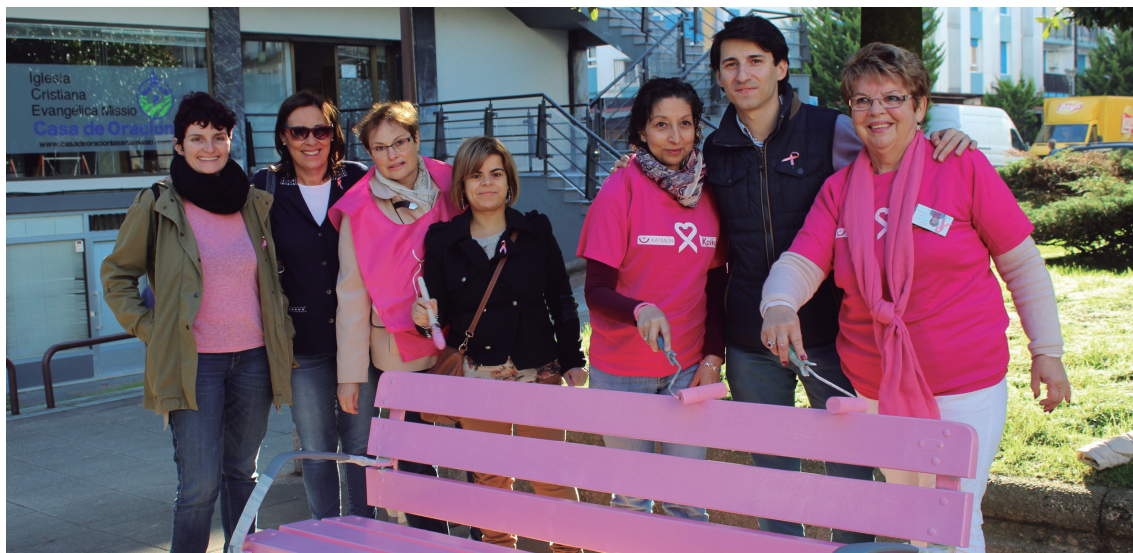
Ganbo kalean margotu da bankua urte osoan zehar borroka honen adierazle izan dadin.

Alkateak adierazi zuen gune hori hainbat borrokari buruz kontzientziatzeko leku bihurtzea nahi duela: genero bortizkeria, HIESaren kontrako borroka edo gay, lesbiana, transexual, bisexual eta intersexualen eskubideen aldeko borroka. Horiek izango dira gune horretako ban-