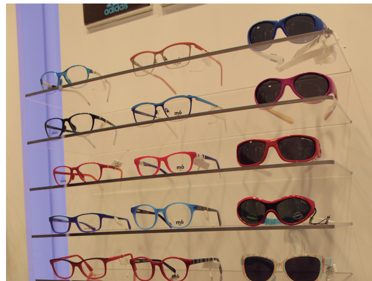
Haurrentzako betaurreko bilduma dotorea dago.

"Etor zaitez Kale Nagusiko Multiópticas-era eta inolako konpromisorik gabe egingo dugu azterketa!".