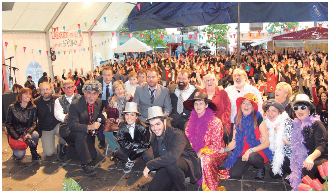
Duela lau urteko Maratoian ezkontza berezia izan zen. Aurten Kultura hiriburutza izendapena eta EuskOskar gaua izango dira.

Zortzikoteak Lasarte-Orian euskararen alde egindako lanarengatik hainbat elkarte