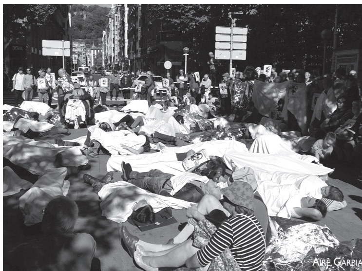
Santander Bankuaren egoitzan ekintza burutu zuen Erraustegiaren aurkako mugimenduak.

Erraustegiaren kontrako Mugimenduak Ekintza honen bidez, bankuek eta enpresa handiek errauste plantaren eraikuntzarekin irabaziak izango dituztela salatu nahi izan zuten. "Irabazle bakarrik beraiek izango dira. Gaur egun Banco Santander