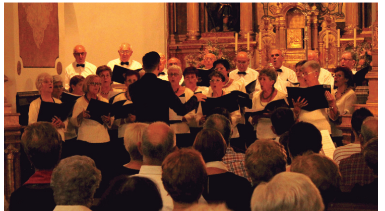
Gimnastika erakustaldiaz Kontu Kantoi bikotearen ipuin kontaketa umoretsuaz eta Lezoko, zein Biyak Bat elkarteko abesbatzen emanaldiez gozatu dute herriko nagusiek.