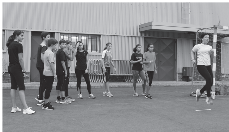
Eskolartekoak urriaren 20an hasiko dira konpetitzen, pista estalian.