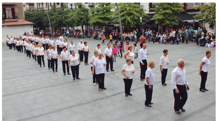
Biyak Bat elkarteko taldeek dantzan jarri zuten atzo Okendo plaza.