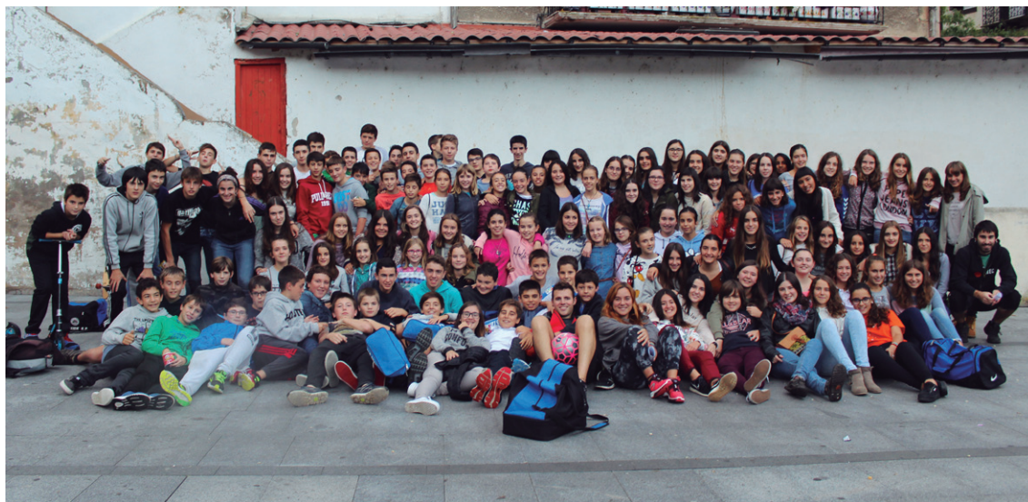
140 gaztetxo izan ziren Kuadrillategi egitasmoaren ekintzetan parte hartu zutenak.

DBH1-4 mailako gazteek ere ostiralero hamaika ekin-