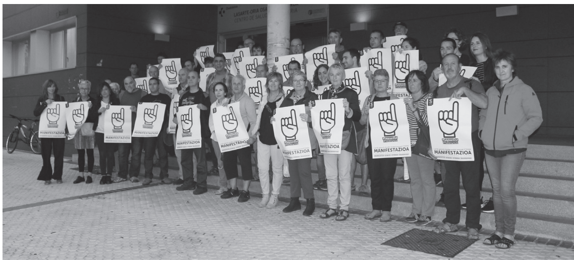
Hainbat herritarrek egin dute bat Sarek urriaren 15erako egindako deialdiarekin.