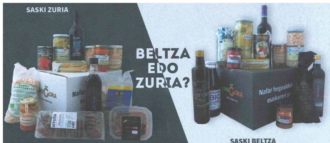
Aurten Errigorak Nafarroa hegoaldeko ekoizleen bi saski eskaintzen ditu

Errigora ekimeneko kideek azken urteetan legez, kanpaina honetan Nafarroa hegoaldeko bertako produktuak eskaintzen dizkiete Euskal Herriko herritarrei.