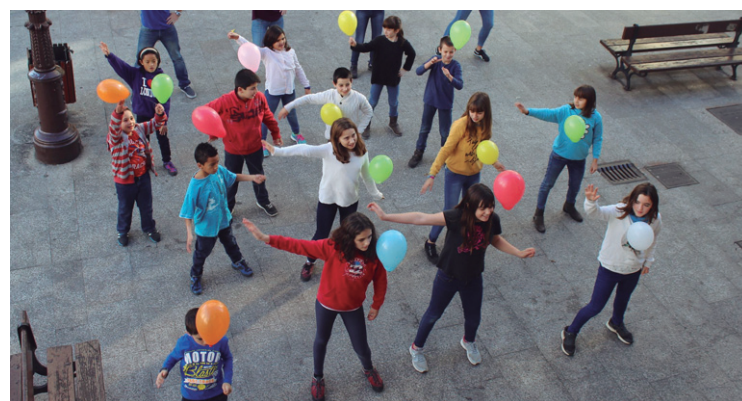
Flash-moba, irteerak, lehiaketak... Gazteklubean erritmo ederra dute.

beste saio guztietan bakoitzak bere espazioa izango du. "Taldeetako kideen kopuruen arabera zehaztuko da non izango diren saioak".