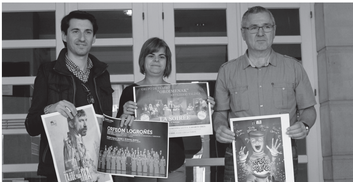
Udal ordezkariak eta Manuel Lekuona kultur etxeko kudeatzaileak urriko egitaraua azaldu zuten.