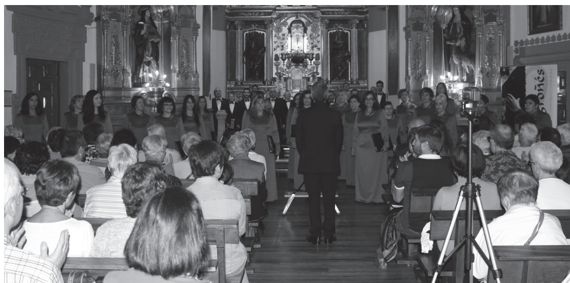
Alboka abesbatzak gonbidatuta, Brigitarren Komentuan eskaini zuen musika emanaldia Logroñoeko abesbatzak.

Gaur egungo gipuzkoar musikagileei keinu eginez, Javier Bustoren 'Kanta Cantemus' doinua ere entzun zen kaperan.