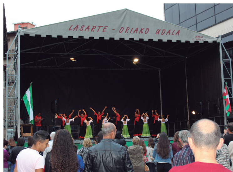
'Gitanillas y Duendes' taldek eskainitako emanaldiaren une bat.