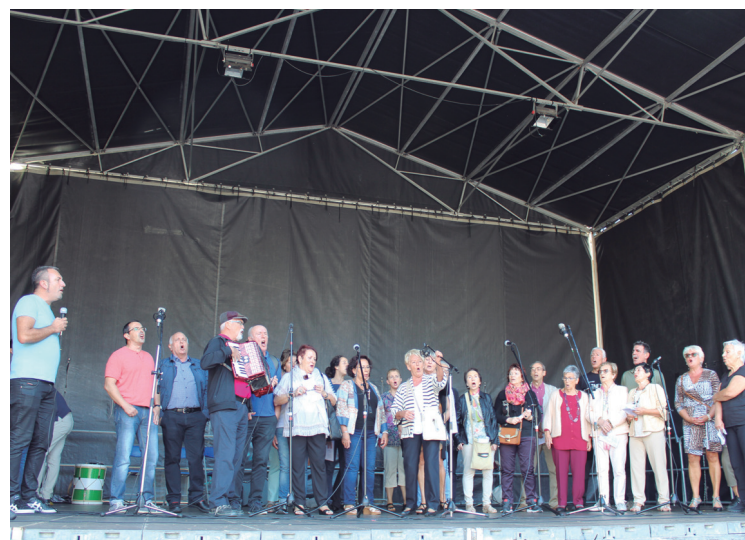
Xumela abesbatzak, emanaldia eskaini zuen Semblante Andaluzen kultur astean.