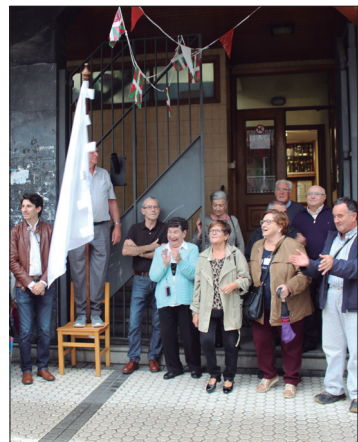
Landaberri Ikastolako ikasle ohi talde batek, sorrerako urteak eta bizipenak ekarri zituen gogora, larunbateko antzerkian.