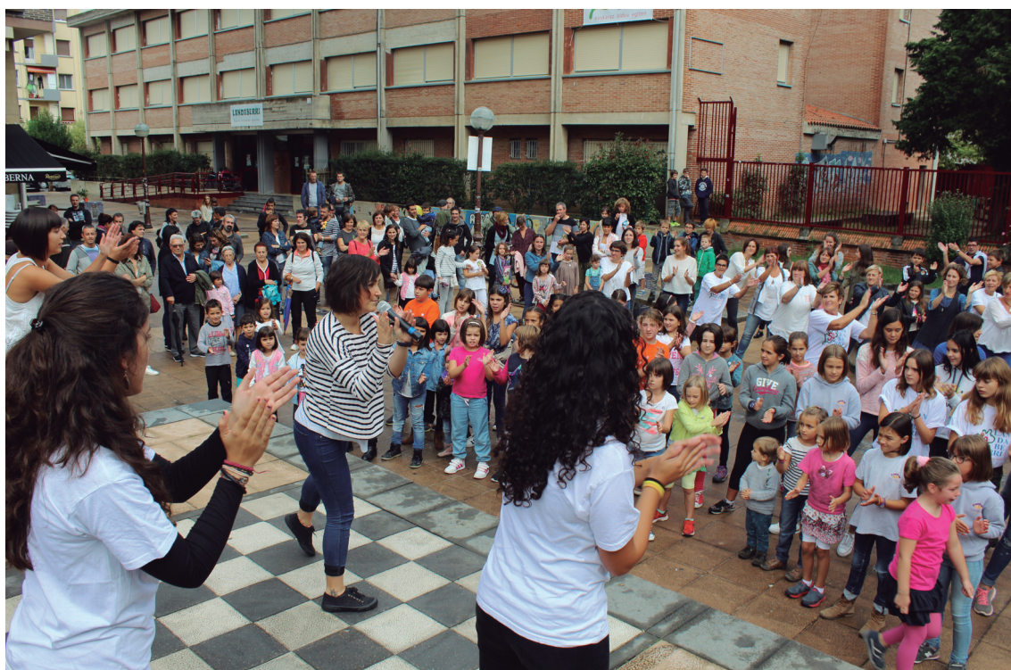
Larunbat eguerdian, urteurreneko abestiaren bideoklipa grabatu zuten Landaberri BHI eraikin kanpoan.