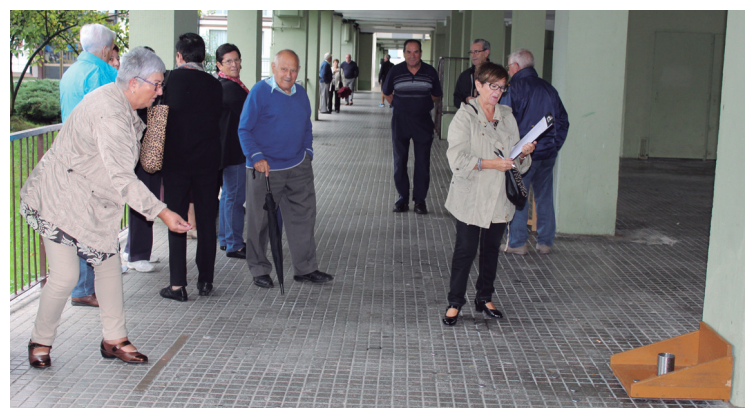
Bote-johan, token eta igel-jokoan aritu ziren Isla Plazako etxe azpietan.