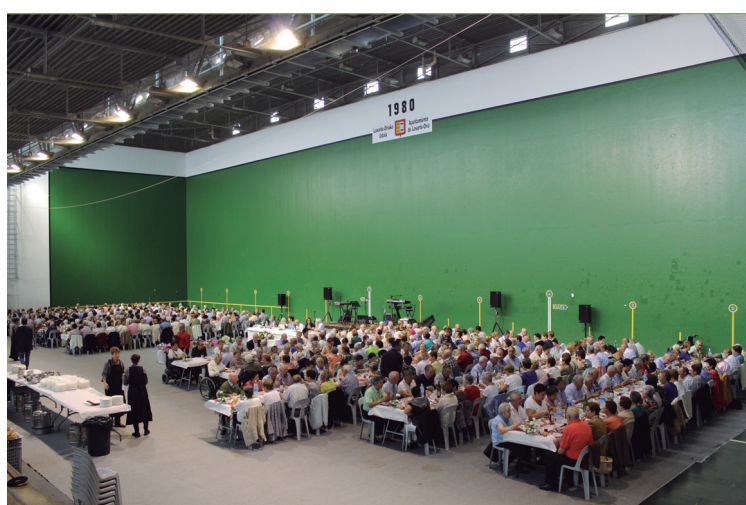
Udal ordezkariekin batera, bazkari herrikoa egin zuten Mitxelingo kirol gunean.