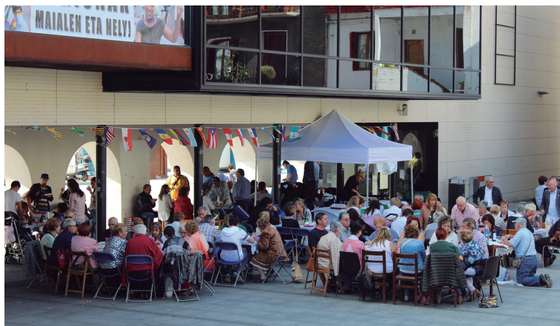
Eguraldia lagun, jende ugari gerturatu zen igandean egin zuten bazkari herrikoia.