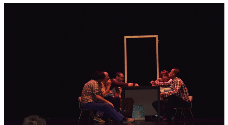
Hamabi antzezle aritu ziren, oholza gainean Landaberriko bizipenak antzeztzen.

ko lanak, esfortzuak, kezka eta bizipenak azaldu zizkieten ikusleei. Guzti honekin batera, hasierako urte gogorrak ere gogora ekarri zituzten. Frankismo garaian ikastola sortzeko lanetan izandako oztopoak eta zailtasunak agerian geratu ziren, baita metodologia berriak euskaraz erabiliko zituen ikastola berri baten alde lan egindako guraso eta bolondres 'ausartek' egindako