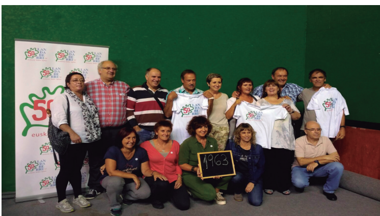
Belaunaldi ezberdinetako ikasleek argazkiak atera zituzten, Mitxelinen.