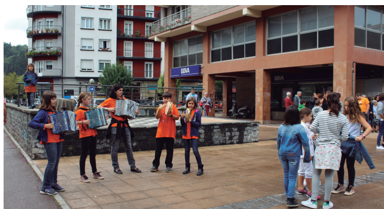
Larunbat goizean, musika eskolako trikitilariak ibili ziren herrian barrena.