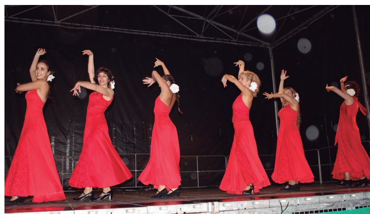
'Zambra Zambra' taldeak, dantza ikuskizuna eskaini zuen larunbat iluntzean.