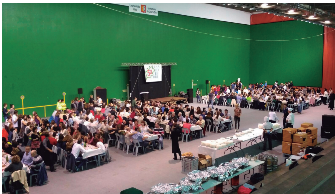
Landaberriko belaunaldi ezberdinetako jende ugari elkartu zen, larunbatean, Mitxelingo kirol gunean egindako bazkarian.

nahiean. Eguerdian, Mitxelingo kirol gunean eman zioten jarraipena festa egunari. Sorreraz geroztik, ikastolan ibilitako belaunaldi ezberdinetako kideek bazkari eder bat egin zuten bertan. Indarrak hartu ostean, sorpresaz beteriko ekitaldi berezi bat izan zen arratsaldean. Belarriprest eta ahobizi oholtza gainera igo eta zortzikoteak lagunduta, euskararen maratoiko dantza eskaini zieten bertaratutakoei. Honekin batera, guraso taldeko zenbait kide ere dantza ikusi ahal izan ziren ondoren eta azkenik, Ttiriki Tarraka taldeko trikitilarien doinuen laguntzaz, zenbait euskal dantzan aritu ziren guraso, ikasle, irakasle eta kide ohi. Eguraldiak asko lagundu ez arren, giro ezin hobea sumatu zen.