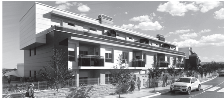
Goiegi Ibarrean egingo diren etxebizitzaren irudia.

Urriaren 6an lista horri buruzko alegazioak egin ahalko dira. Behin betiko lista 2016ko urriaren 10ean argitaratuko da.