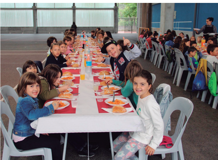
Ikastolako txikiak ere Mitxelinen izan ziren ospakizune egunean bazkaltzen.