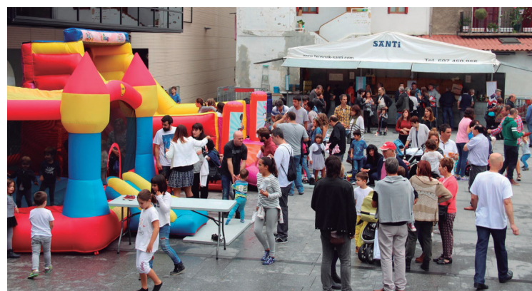
Haurrentzako puzgarriak izan ziren larunbat goizean.