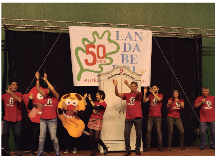
Belarriprest eta Ahobizi dantzan aritu zen zortzikotearekin batera,.