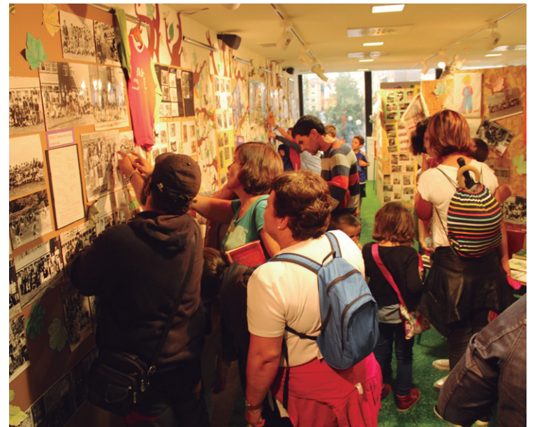
Hainbat herritar eta gaztetxo hurbildu dira 'Landaberri, oroimenaren basoa' erakusketara.

Bestalde, aurreko zenbakiko huts egitea zuzenduz, urriaren 1ean, Michelingo Kirol gunean bazkaria egingo da. Txartelak eskuragarri daude Landaberri ikastolako eraikinetan. Helduen menuak 25 euro balio ditu; haurrentzako, berriz, 13 euro. Salgai egongo dira osteguna 29ra arte.