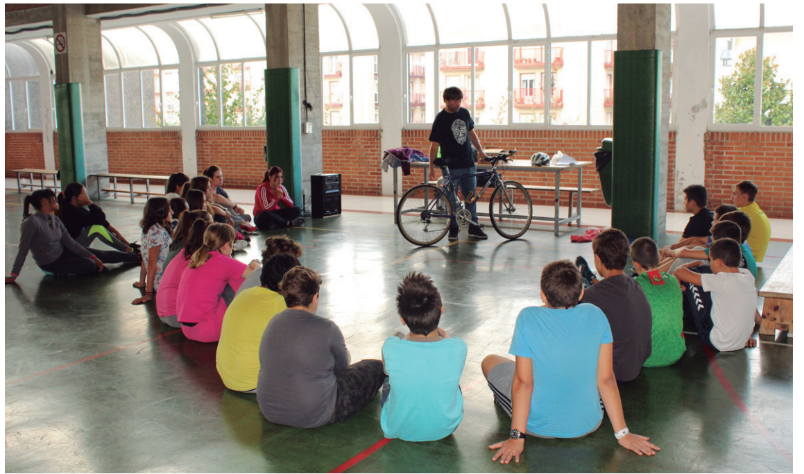
Astearte eta asteazkenean, DBHko ikasleek adi jarraitu zituzten bizikleta ikastaroko azalpenak.

Herritarrek bizikletak eta honekin zer ikusia duten objektuak saldu eta erosi ditzakete. Hauek azoka ireki baino ordu t'erdia lehenago utzi beharko dira plazan.