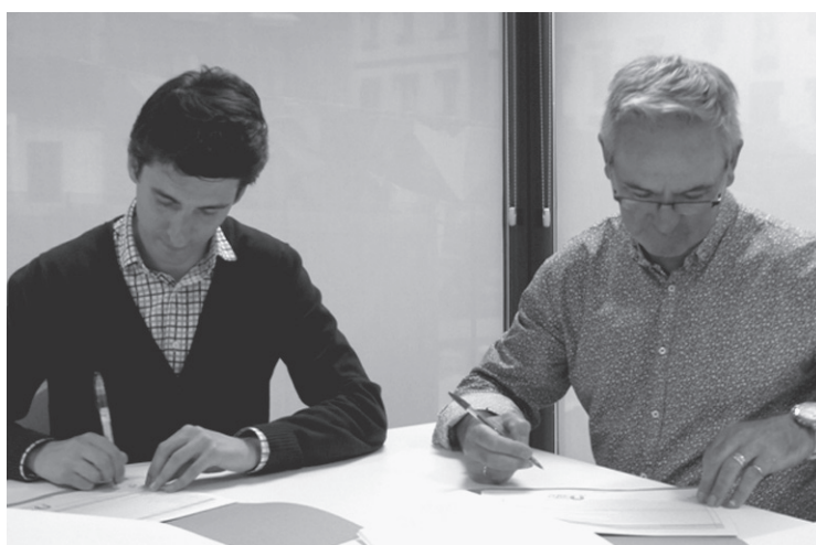
Alkatea eta Aterpeko lehendakaria hitzarmena sinatzen. L-O UDALA

koa hitzartu du: Aterpearen protagonismoa indartzea; Teknologia berrietan eta komunikazioaren talde formatzeko plana prestatzea; Marketineko aholkulari baten bitartez, banakako aholkularitza eskaintzea; Aterpeko era-