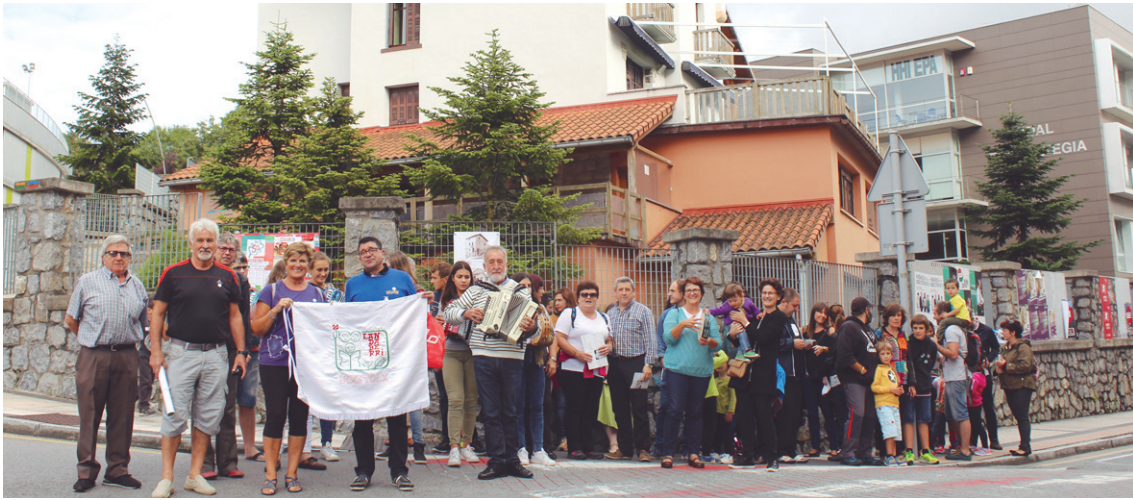
Haur, guraso eta irakasleak bildu ziren astelehenean ikastolako ikasgelen kokaleku ezberdinak bisitatzera.