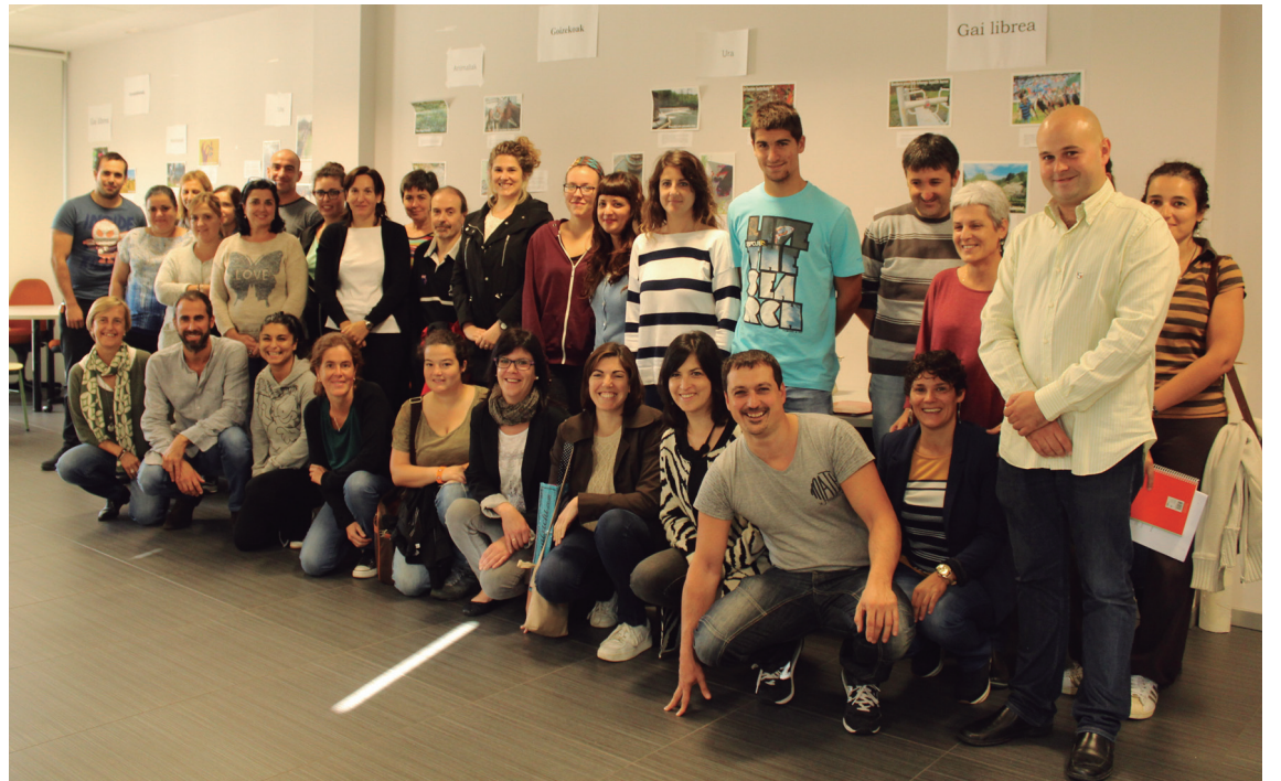
Euskaltegian egin zen asteartean ikasturtearen aurkezpena.

Hasierako mailako taldeak daude eta EGA prestatzeko mailaren inguruan daudenak dira gehiago. Aukera egotekotan, autoikaskuntza sistema-