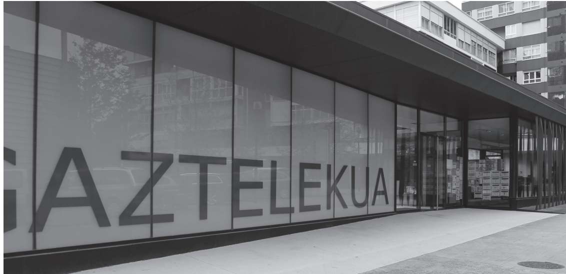
Herriko gazteentzako zerbitzu eskaintza zabala egin nahi du Gaztelekua.

Gaztelekuan sexu informazio eta aholkularitza zerbitzua martxan da. Ostegunero 18:00etatik 20:00etara aukera izango dute gazteek sexualitatearen inguruan dituzten zalantzak edo kezka argitzeko. Aurreko ikasturtean 159 erabiltzaile izan zituen bulego honek eta egindako hiru ikastaroetan parte hartzaile kopurua ona izan zen.