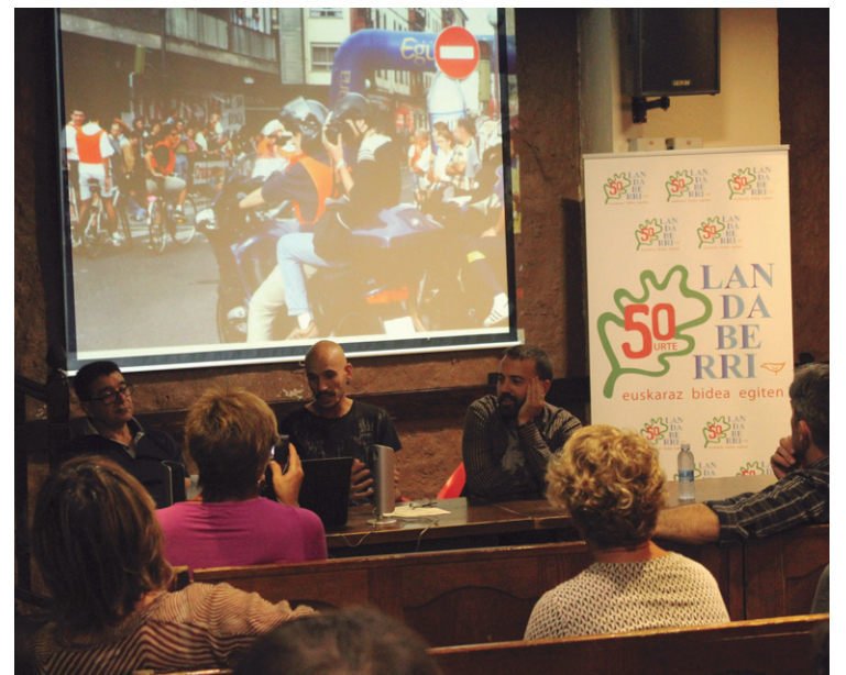
Sei ikasle ohiak haien bizitza edo ibilbide profesionala azaldu zuten.