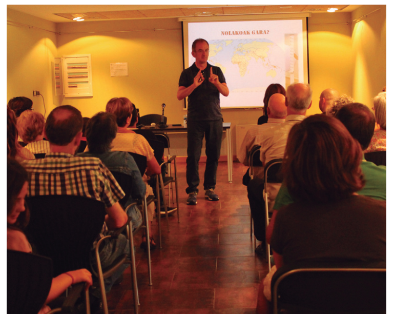
Kike Amonarrirek euskararen egoeraz eta Lasarte-Oriako kasuaz mintzatu zen atzo.