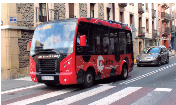
Manttagorri hiribuseko zerbitzua doakoa izan zen atzo, 'Nire autorik gabeko egunean'.