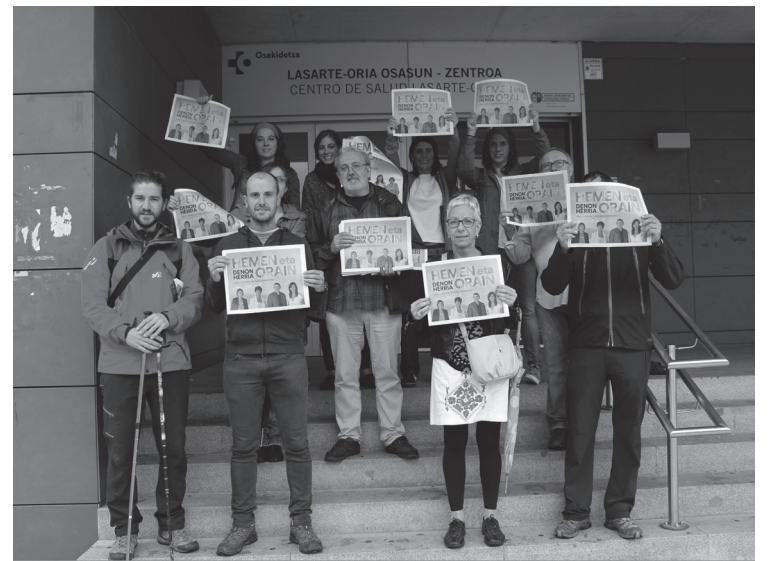
EH Bilduko kideak, ipar-martxa ibildierako zuten geldiuneetako batean.

Bestalde, asteazkenean, azokan izango dira hainbat alderdi, hala nola, PP.