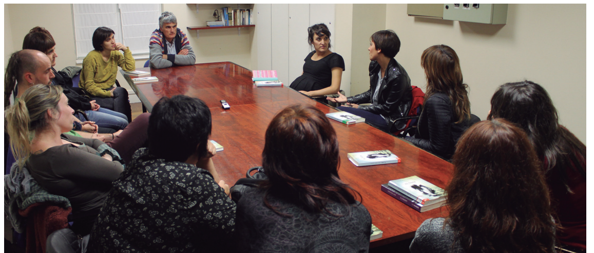
Orain arte Kultur Etxea izan da Txokoaren bilgune, aurten zehazteke dago baina garaiz adieraziko dutela agindu dute taldeak.