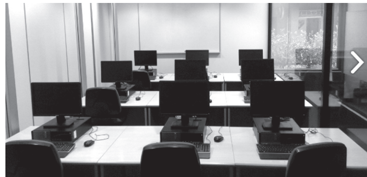
KZgunean maila ezberdinetako ikastaroak eskaintzen dituzte.

Sare Sozialekin lotuta, 'Facebook' sarea ezagutzeko ikastaroa izango da eta irailan eskaintako 'Skype: Munduko edozein tokitara doan deitu' ikastaroa errepikatuko da. 'Facebook' ikastaroa