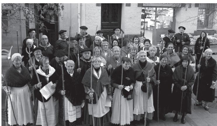
Urtean zehar hainbat ekintza egiten ditu koruak, hala nola, Santa Eskea.

Hilabete honetan, irailaren 24an, Landaberri ikastolako 50. urteurrenako ospakizunetan parte hartuko dute eta Euskararen 9. Maratoian ere izango dira noski.