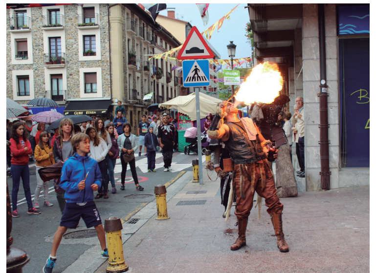
Herritarrak izutu nahian ibili ziren kale animazioan parte hartutako pertsoniak.