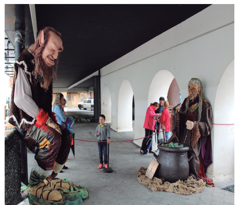
Udaletxe azpiko arkupeetan, euskal mitologuako zenbait pertsonaia ikus zitezkeen.