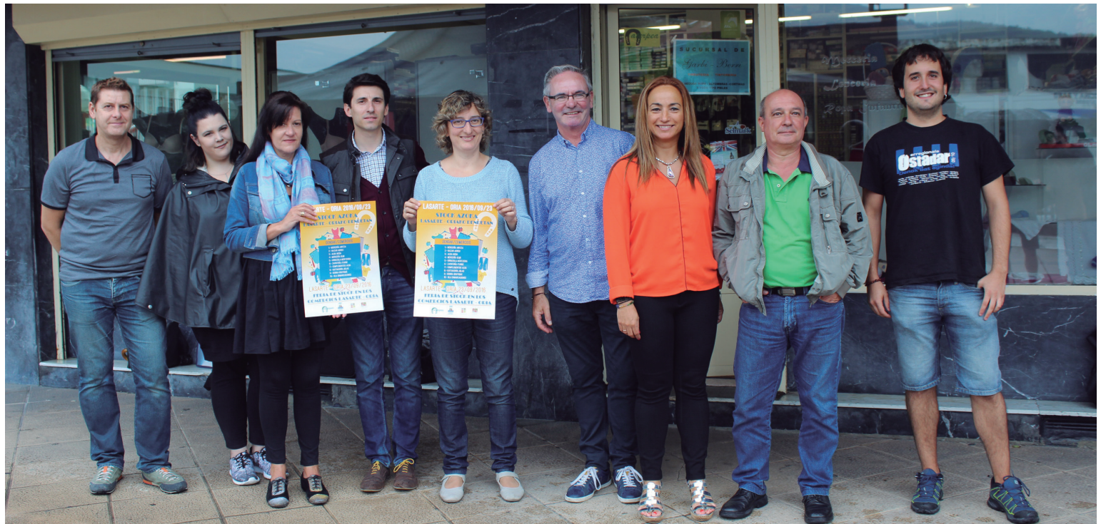
Ostiral eguerdian aurkeztu zuten aurtengo Stock azoka Udaleko eta Aterpeko ordezkarien zein herriko hainbat merkatarik.