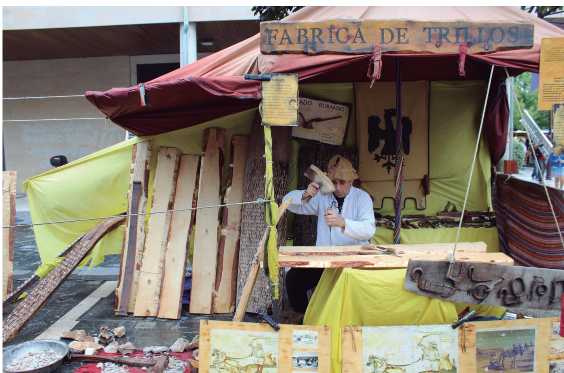
Artisauak zuzenean aritu ziren euren produktuak nola landu jendeari erakusten.