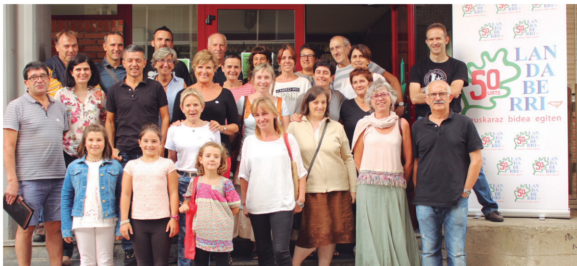
Urteurreneko ospakizunen aurkezpenean ikastolako komunitateko kideak zein egitarauko parte hartzaileak izan ziren.

Aurretik 17:00etan, ekintza berezia egingo da ikasle eta gurasoekin. Ikastolako