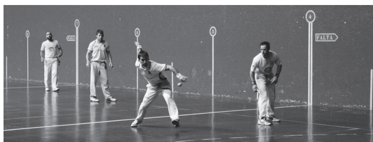
Intza KEko seniorrek irabaziz egin dute debuta Igo mailan.

3. mailako seniorrek Oñatin jokatu zuten ostiralean, Aloña Mendiren aurka; Aritz