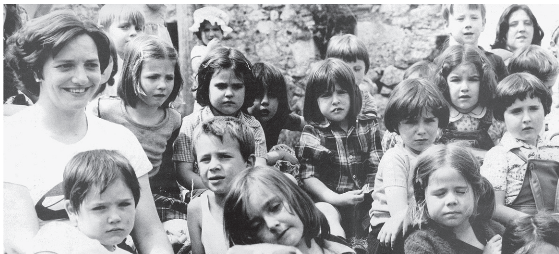
Landaberriko ikasleak 1978an egindako irteera bateko irudian.

Azkenik, Landaberri 50. urteurreneko lantaldeak Landaberri ikastolako ikasle, irakasle eta guraso izandako herritarrei, zein gaur egungoei ekintzetan parte hartzera gonbidatu zituzten.