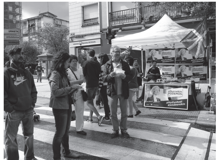
Elkarrekin Ahal Duguk, Kale Nagusian jarri zuen karpa informatiboa.