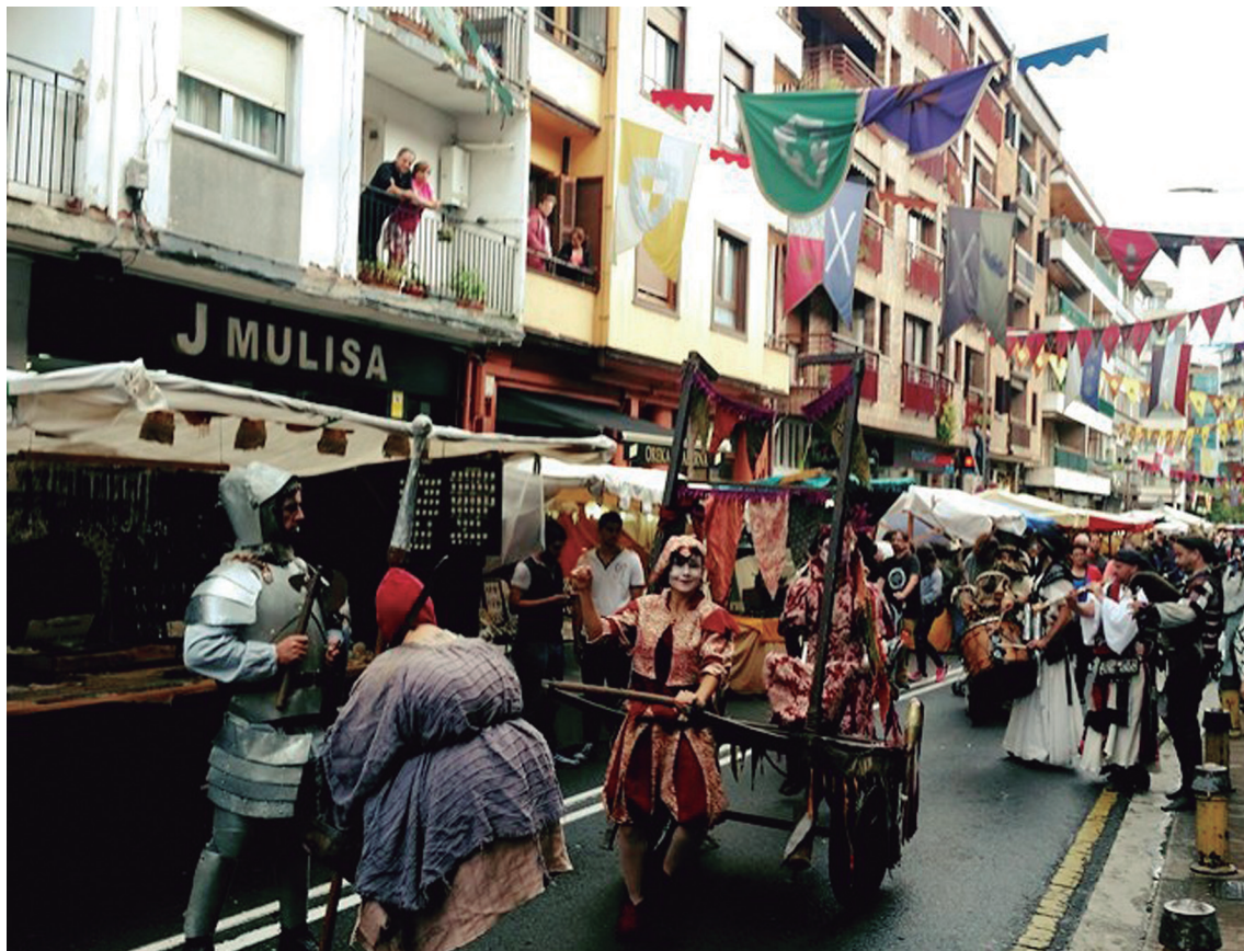
Askotariko kale animazio ekintzak ikusi ahal izan ziren asteburu osoan zehar.