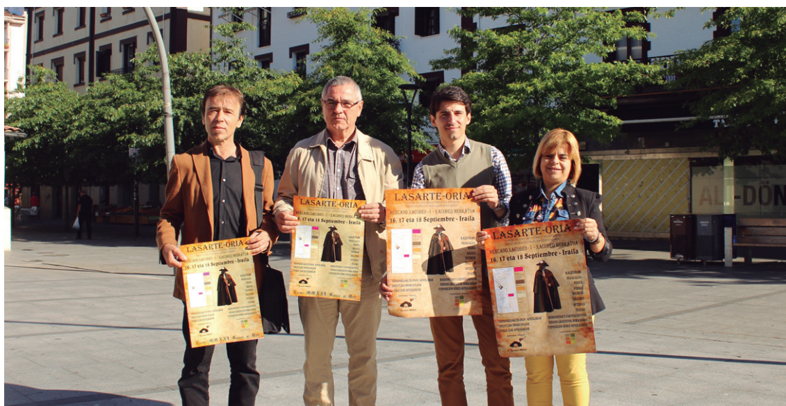
Udal ordezkariak eta Xacobeo azokako antolatzaileak aurkezpenean.