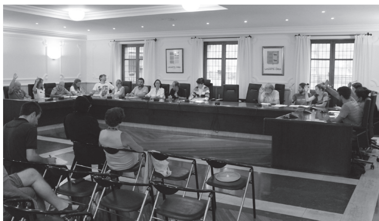
Astearte arratsaldekoa izan zen ikasturte honetako lehenengo ohiko udalbatzarra.