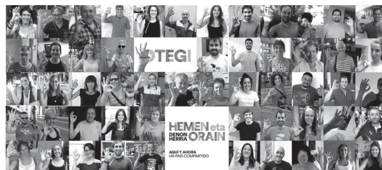
Hauteskunde kanpainen ekintza ezberdinak ari dira gauzatzen alderdiak.