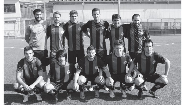
Larunbatean Ostadar SKTk atera zuen hasierako hamaikakoa.