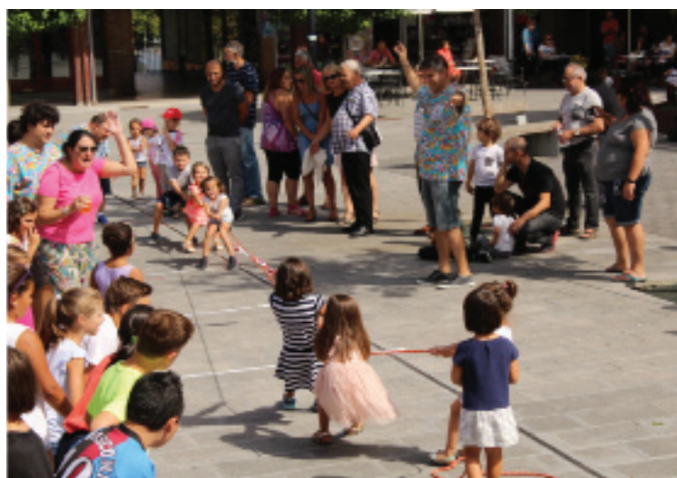
Goizetik hasi eta arratsaldera bitartean, haurrentzako jokoan izan ziren Jaizkibel Plazan