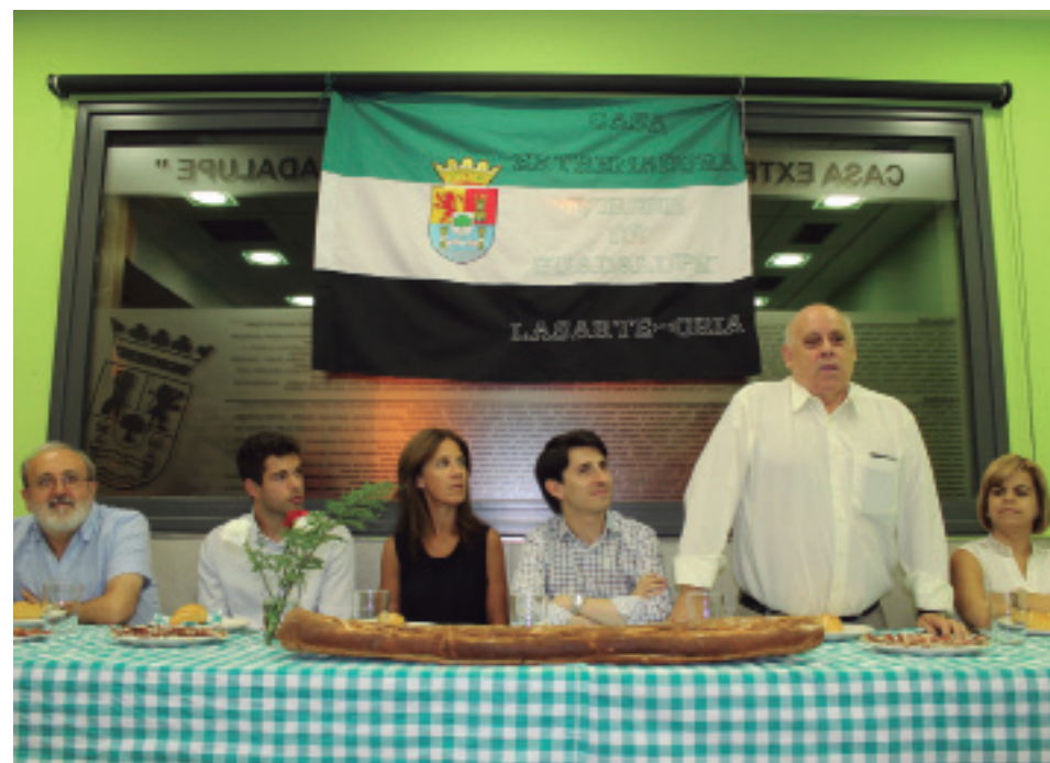
Udaleko ordezkariak, 'Virgen de Guadalupe' egoitzan, bazkideentzako antolatutako afarian izan ziren.