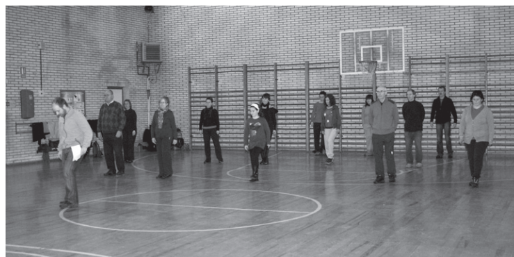
Muxiko edo plaza dantzetan trebatzeko aukera eskaintzen du Ttakun KEk.

Era berean, bileran ikaslearen proposamenak ere jasoko dituzte.