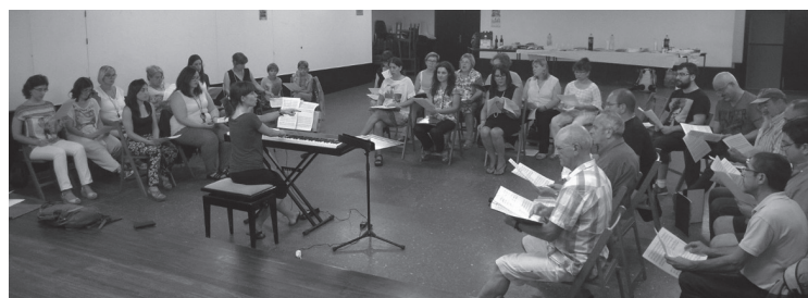
Albokako kideen ikasturteko lehenengo entseguaren irudia.

Honetaz gain, urrian Logroñoeko Orfeoien bisita jasoko du taldeak. Errioxako abesbatzak kontzertua eskainiko du urriaren batean, Ama