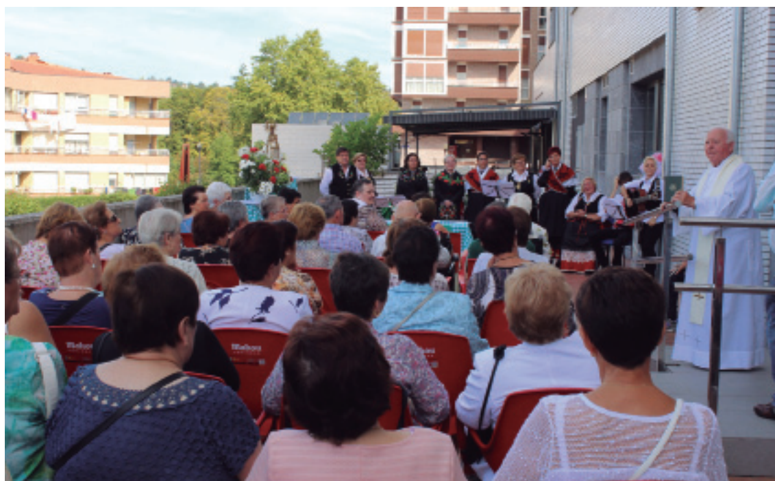
Larunbat eguerdian, Guadalupe Ama Birjinaren omenezko meza ospatu zen, 'Virgen de Guadalupe' egoitzan.