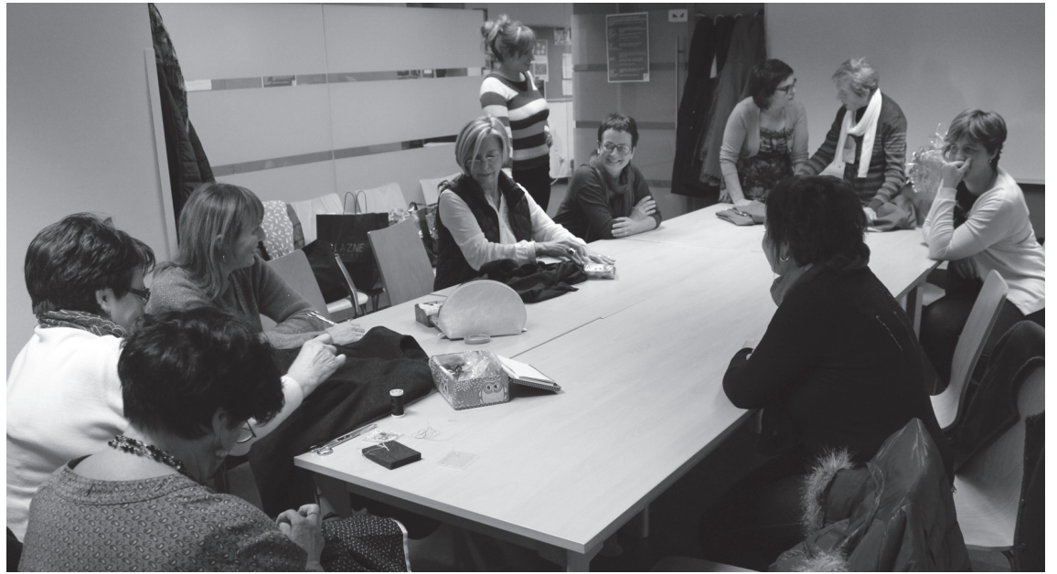
laz ikastaroa egin zuten kideak oso pozik agertu ziren egindako lanarekin.

Aipatu behar da ikasleek erabakitzen dutela zein jantzi egin "batzuek eurentzako jantzia egiten dute eta beste