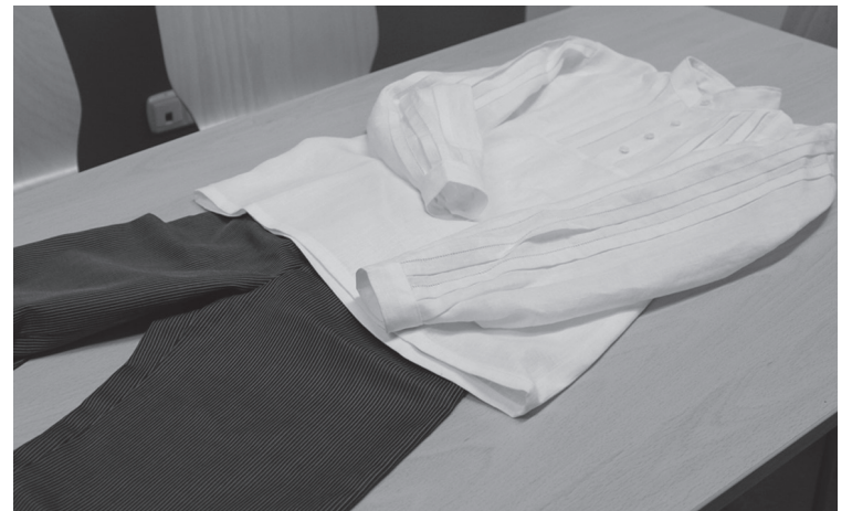
Taldean egindako lanetako bat da mutil jantzi hau.

Informazio gehiago eskuratu edota izena emateko, 943 371 448 zenbakira deituzte.