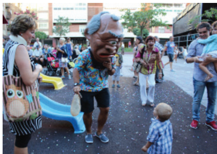
Haur eta gaztetxoek bizkarrak astindu zituzten buruhandiek.