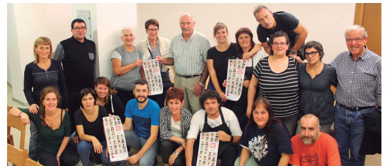
Ikasturteari hasiera emateko Solaskide programako kideek afari gozoa dastatzen dute

Ttakun Kultur elkarte arduradunek herritarrei bidelari edo bidelagun izatera gonbidatzen dituzte. "Ez galdu aukera euskaraz trebatzeko".