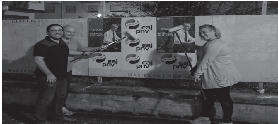
Alderdi politikoei ostiralean eman zioten hasiera hauteskunde kanpainari. Irudian, EAJ alderdiko kideak.