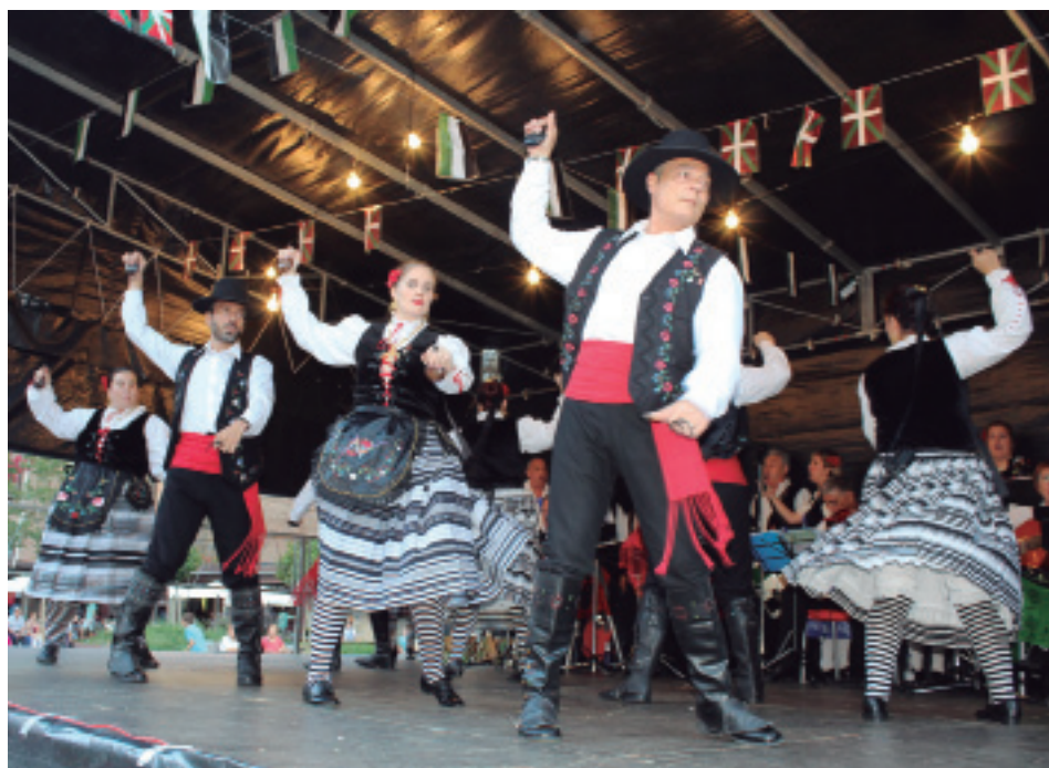
Iruñeako 'Raices y Brotes' taldeak, musika eta dantza emanaldia eskaini zuen larunbat iluntzean.