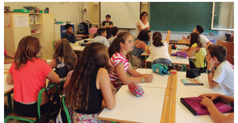
Sasoeta-Zumaburu ikastetxean hainbat jolas eta joko egin zituzten 5. mailakoek.

Lasarte-Oriako ikastetxeetan hainbat aldaketa egongo dira ikasturte hasieran