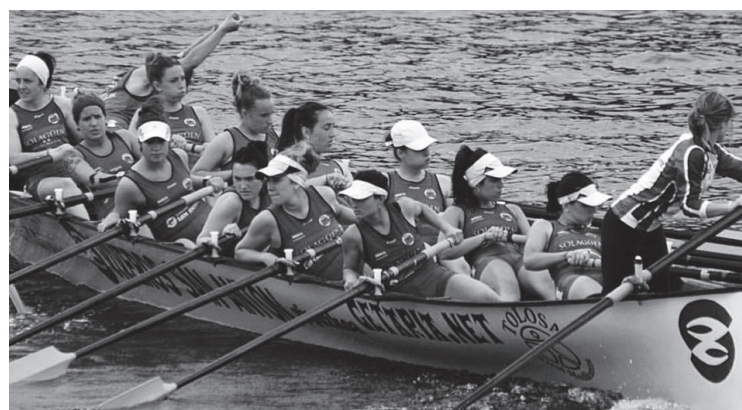
Getaria-Zarautz trainerua, aurtengo estropada batean.

Emakumeen arrauna gora egiten ari dela dio, baina desberdintasunak daudela ere bai: "Gehiago kobratzen dute, eta lehentasuna dute klubetan".