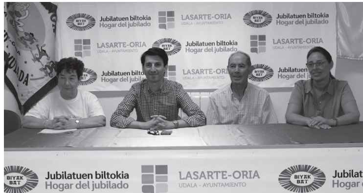
Biyak Bat elkarteko kideek udal ordezkariekin batera aurkeztu zuten egitaraua.