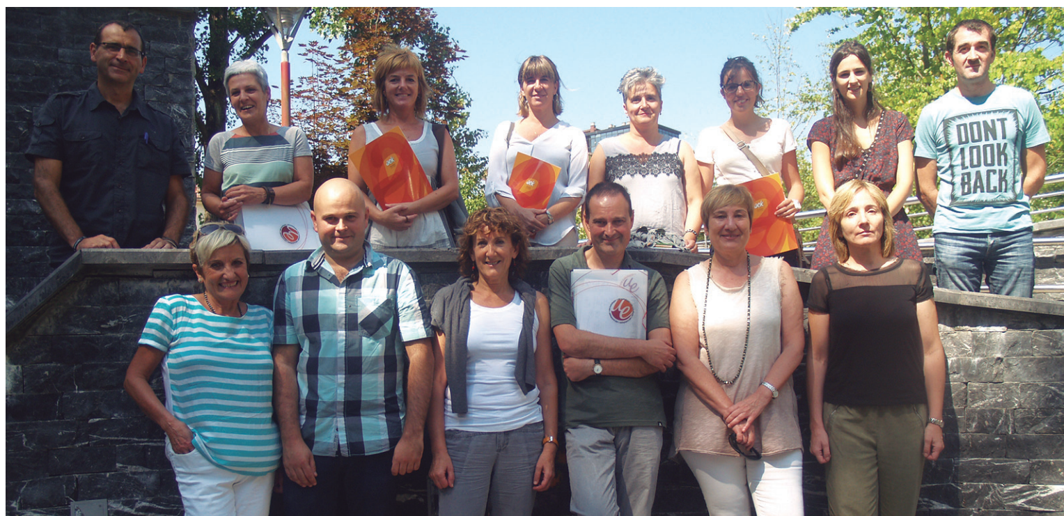
Eskura dituzten erraztasun guztiak eskaintzen dituzte Buruntzaldea eskualdeko euskaltegiek.