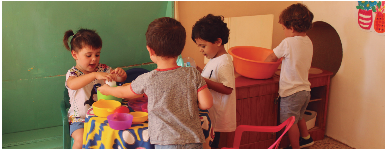
Landaberri-Garaikoetxeako geletan haurrek ederki eman zioten hasiera ikasturteari. Txikienek gurasoen laguntza izan zuten gelan, besteak jolas eta solas ibili ziren.

Urtero lez, Lasarte-Oriako Udalaren laguntzarekin, egitarau oparoa prestatu du Biyak Bat elkarteak Nagusien Omenezko Asterako: kalejira, dantzaldiak, jokoak, meza San Pedro Elizan, bazkaria, gimnasia erakustaldia... Urriaren 1etik 8ra bitartean iraungo dute ospakizunek. Antolatzaileek ohartarazi dute datorren asteko ostirala, hilak 16 izango dela urriaren 2ko bazkarian izena emateko azken eguna.