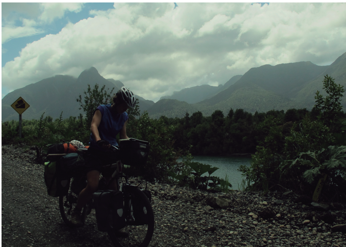
Bide australa. Natura basatia.

Bederatzi hilabeteetan asko izan dira bizitakoak eta gure blog-ean gehiago aurki ditzazkezu. Gustu baduzue: www.suarenbila.wordpress.com .