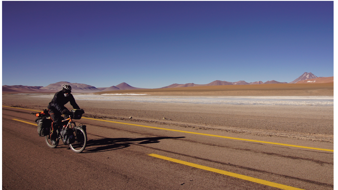
Jamako igarobidean, lau mila metrotik gora. Hotza eta haizea, baina ederra.

Abenturari denbora-mugarik ez jartzean altxor ederra