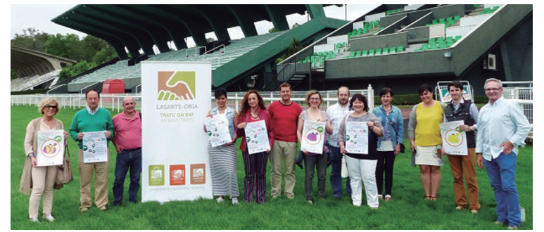
Asteazkenean aurkeztu zen ekimena Hipodromoan.

Uztailaren 30ean, 13:30ean, Lasarte Tabernan egingo da zozketa zuzen betetako txartelen artean. Sariak honakoak izango dira: 2 laguntzako afaria Martin Berasategin; 2 laguntzako 2