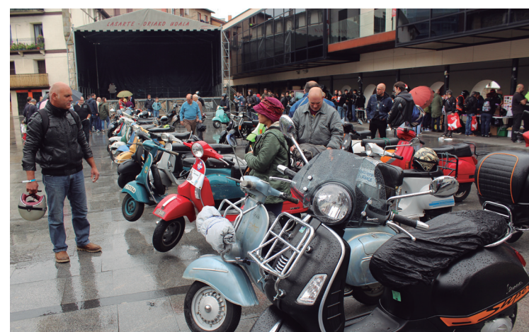
Larunbat goizean zehar Okendon ikusi ahal izan ziren vespa eta lambrettak.

Larunbat goizean Okendon erakutsi zituzten motorrak. Arratsaldean berriz, Andapa kalean. Gauean, kontzertuak berriro ere Buenetxean. Azkenik, atzo goizean zehar Golf plazan egin zuten erakusketa.