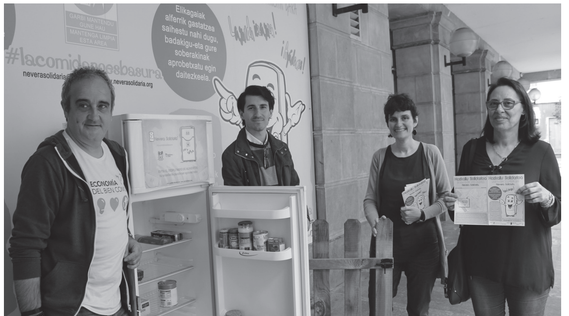
Aurkezpen egunean hainbat jaki utzi ziren hozkailuan halalik eta lasterren erabiltzen hasteko.

zuen hozkailua herrian jarriko zela berehala zabaldu eta hainbat taberna eta jatetxeetako jabeak harremanetan jarri zirela udalarekin bertan euren sobakinak uzteko asmoarekin. Udalak herriko ostalariekin bilera egitea aurreikusten du ekimena azaltzeko eta ez da bazter-