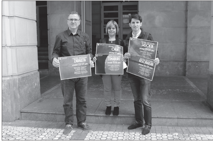
Udal ordezkariak, ostiral goizeko aurkezpenean.

Lasarte-Oriako Udalak 'Kultura Auzoetara' programa jarri du abian. Duela pare bat aste hasi zen, Orian. Asteburu honetatik aurrera hartuko du martxa berriro egitasmoak; Atsobakarren egingo du bigarren geldialdia, ostirala eta larunbata bitartean; ipuin kontalariak eta eskaiola maskaren tailleraz gozatuko dute. Ekain bukaera eta uztail osoan zehar, beraz, auzoz auzo ibiliko da herriko kultura.