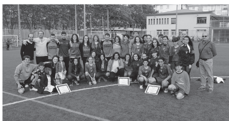
Herrian jokatu dira Buruntzaldeako 6. futbol topaketak.