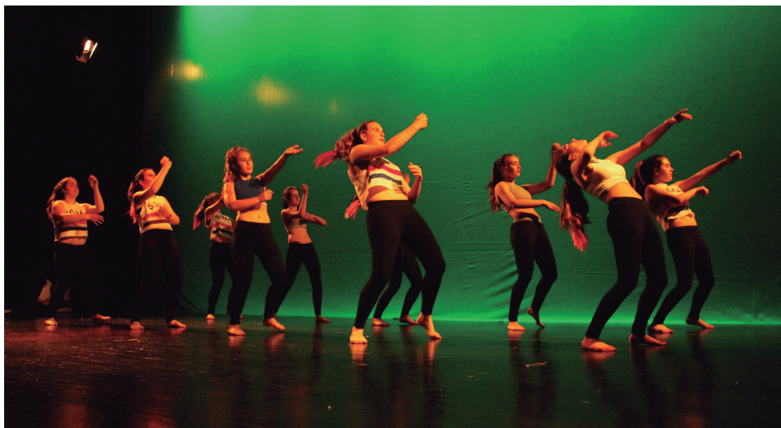
Dantza Garaikideko talde honek 'Uptown Funk' abesti ezaguna interpretatu zuen kultur etxean.

Ostiral arratsaldean berriz, helduen Antzerki taldeek 'Itxaroten' lana oholtzaratu zuten. EGA azterketa prestatzen ari zen ikasle talde batzuen idazlanetatik abiatuta, genero berdintasunaren gaia jorratzen du lanak. Ikusle ugari gerturatu ziren Manuel Lekuona kultur etxera, eta ez ziren inolaz ere damutu, ikasleek lan paregabea egin baitzuten oholtzaratu gainean. Horren ordainetan, txalo zaparrada luzea jaso zuten amaieran. Orain, hurrengo urtera arte itxaron behar.