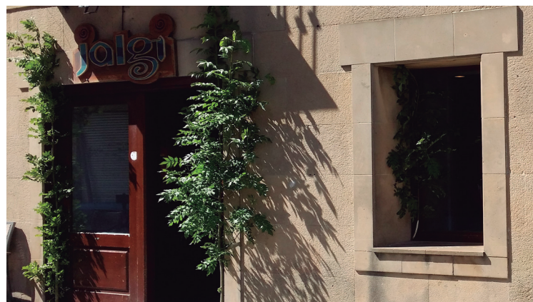
Ttakun eta Jalgiko ate eta leihoetan elorri zuria adarrak jarri izan ditu Kerejetak.