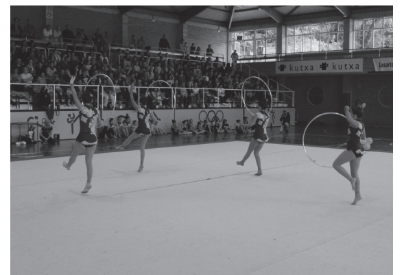
Judo eta gimnasia erritmikoko alorretako kideek erakustaldiak eskaini dituzte asteburuan, Udal Kiroldegian.