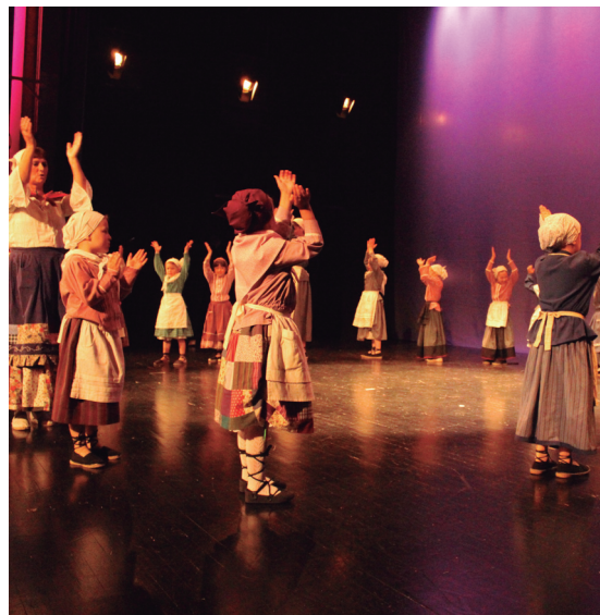
Euskal Dantzako ikasleak ederki aritu ziren atzo goizean; ostiral arratsaldean, berriz, helduen Antzerki taldekoen txanda izan zen.