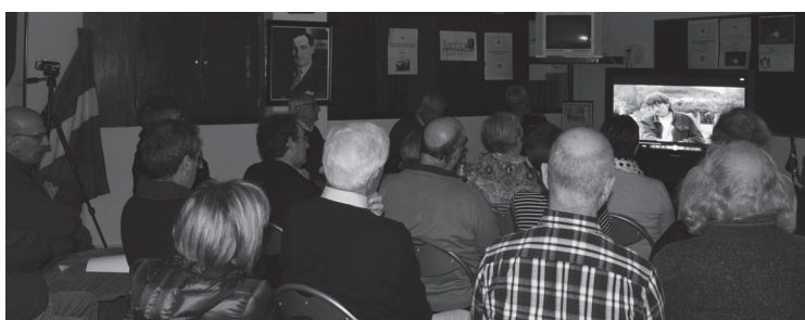
Azaroan Ganbo Iturriren egoitzan egin zen saioa.