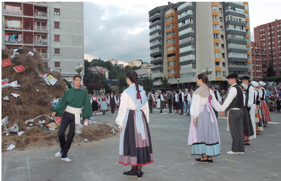
Iaz Erketzeko lagunekin korporazioko hainbat zinegotzik dantzatu zuten soka-dantza.

Ttakuneko lehenengo lehenakariak, herriko hainbat leketan jarri izan ditu elorri zuria adarrak. Danok Kide elkartearen egoitzan, Michelingo kooperatiban, Ttakune-