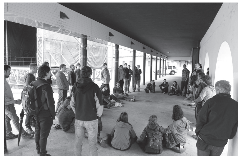
Ostegun arratsaldean egin zuen lehenengo asanblada Buruntzaldea Zutikek.

Gipuzkoa Zutikek kideek ere antolatu zituzten hainbat ekintza. Larunbat arratsaldean Zubietara joan ziren bizikletaz, eta arratsalde zein gauean hainbat ekitaldi jendetsu egin. Bestalde, atzo, Donostian asanblada egitear zirela, Ertzaintzako agenteek hainbat kide golpatu zituztela salatu zuten.