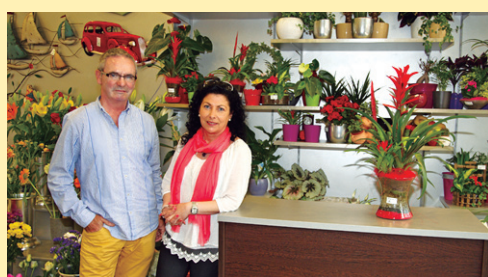
ORMAZABAL loradenda www.floristeriaormazabal.es