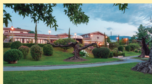
ARAETA sagardotegia www.araeta.com