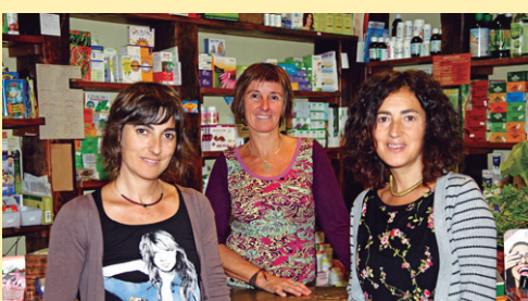
ORBELA ekodenda orbeladenda@gmail.com