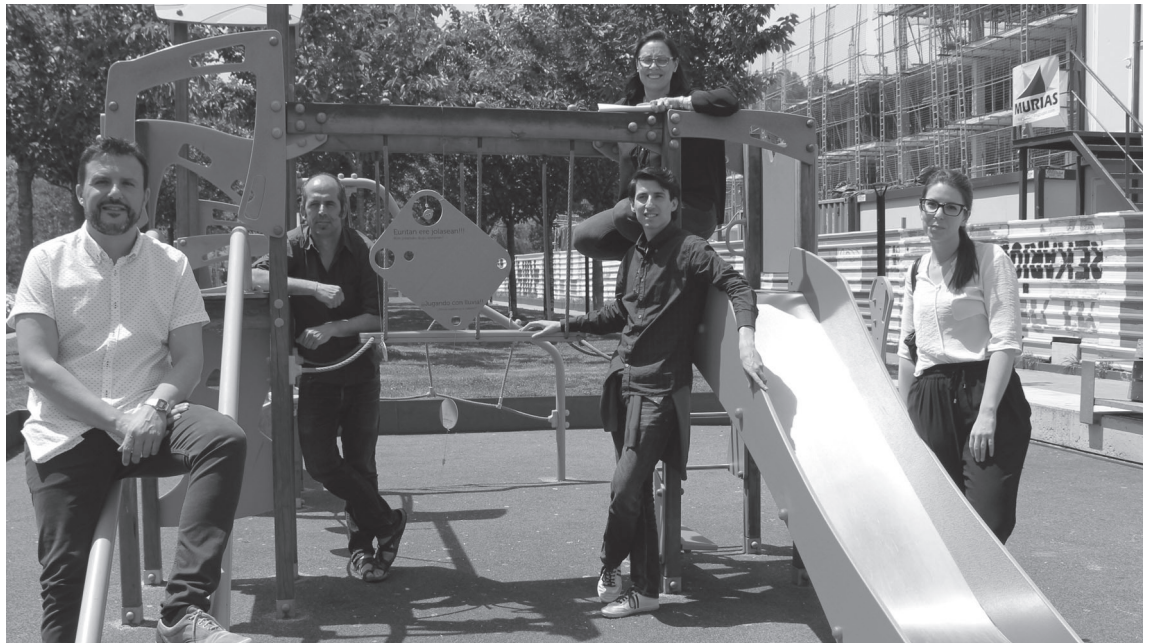
Aurkezpena ostegunean egin zuten udal ordezkariak Hiridunak estudioko lagunekin.

Uztailaren 4ean erakusketak jarriko dira herrian zehar beste herri eta hiri batzuetan estali diren jolas parke edota