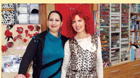
ARITZA mertzeria www.merceriaaritz.com