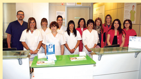
ALDATZ hortz klinika www.dentalaldaz.com