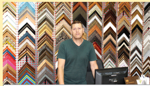
OLA enmarkazioak oladecoracion@gmail.com