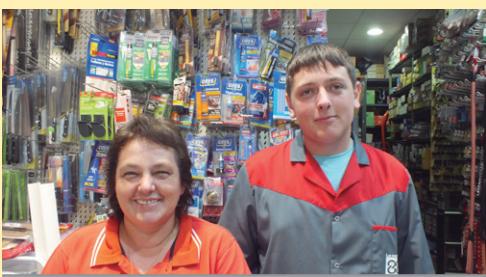
JOSEMA burdindegia cerrajeriajosema@hotmail.es