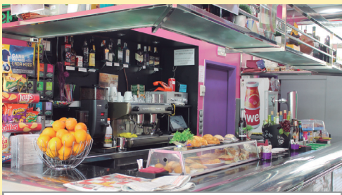
APALATEGI taberna cafeteriaapalategi@gmail.com