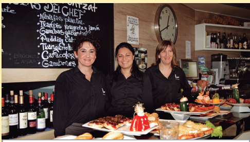
LASARTE taberna www.barlasarte.com