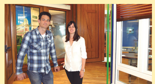
VENTANAS SAN MIGUEL www.ventanassanmiguel.com