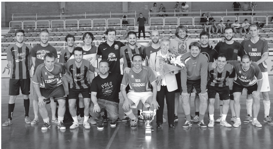
Txindoki eta Insaustiko kideak Mossoren alargunarekin batera atera zuten argazkia partida amaitzean.

Doakoak dira entrenamendu saio horiek; lau dira guztira. Asteazken eta ostiral