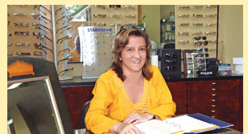
LIZARRI optika optikalizarri@hotmail.com