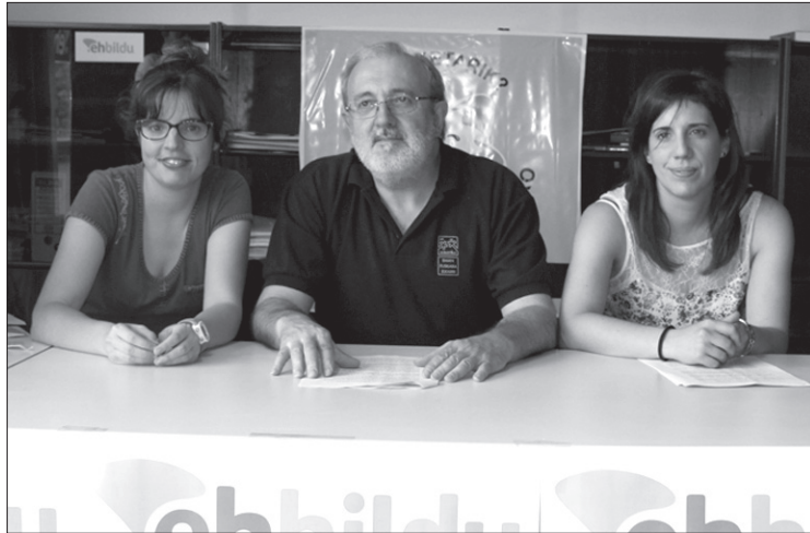
EH Bilduko zinegotziak agerraldian.

Aurtengo aurrekontuen zirriborroaren aurkezpena dela eta, agerraldia egin zuen EH Bilduk ostegunean. Udal Gobernuak prozesua "inoiz baino beranduago" egin duela salatu du, eta "ondo-riok" ekarri dituela zehaztu: "Aurrekontuen falta dela kausa, inbertsio ugari estankatuta daude, kiroldegi berriaren proiektua edota 5. edukiontzia ezarpena, besteak beste".