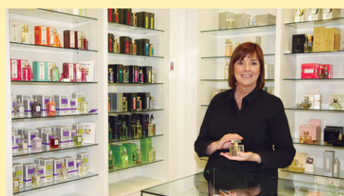
MAIANE perfumeria www.perfumeriamaiane.com