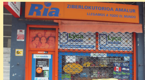
AMALUR ziberlokutorioa locutorioamalur@hotmail.com