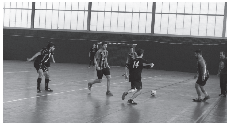
Ostiral arratsaldean hasi ziren Mossoren oroimenezko final laurdenak.

honetan egingo dituzte aurreneko biak; beste biak, hurrengo asteazken eta ostiralean. Konpromisorik gabeko hitzorduak direla jakinarazi dute antolatzaileek. Beste hitz batzuetan esanda, lan-saio horietan parte hartzen duten haurrek ez dute zertan areto-futboleant jokatu datorren denboraldian. Ostadar SKTko kideek gaztetxoak animatzen dituzte entrenamenduetan parte hartzera.