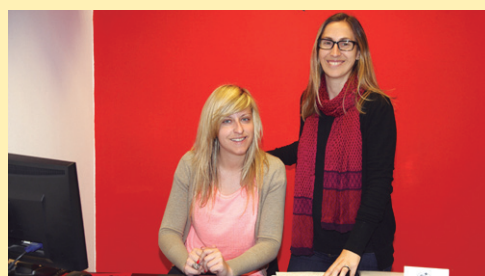
NOAOA bidaiak www.noaoabidaiak.clickviaja.com