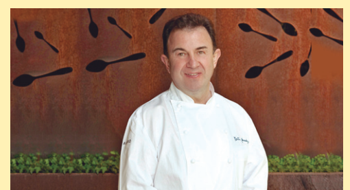
MARTIN BERSATEGUI jatetxea www.martinberasategui.com