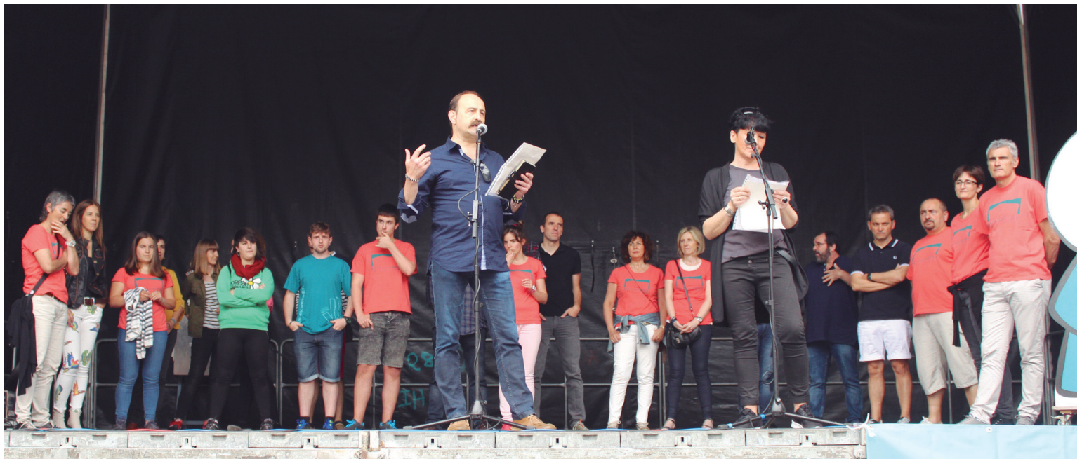
44 pertsonak osatuko dute oraingoz galdeketa- ren Batzorde eragilea. Pertsona kopuru hau handitzen joango dela aipatu zuten Gure Esku Dagoko kideek.

EH Bilduk Udal Gobernuak 2016 urteko aurrekontuen zirriborroa aste honetan aurkeztu duela salatu du eta PSE-EEK aurreko legealdian aurrekontuak berandu aurkeztea aurpegiatzen ziola gogoratu du. Atzerapen honek ondorioak dituela azpimarratu du. Izan ere, zenbait inbertsio geratuak baitaude, hala nola, kiroldegi berriaren proiektua edo 5. edukiontzia- ren ezarpena. Era berean, aurrera eramaten ari diren lanak aurreko legealdian lan- dutakoak direla ere adierazi du alderdi abertzaleak.