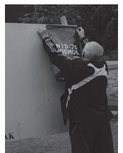
Alderdi ezberdinetako ordezkariak izan ziren ostiralean kartelak herrian zehar jartzen.