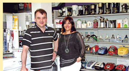
BIDEO LAGUNAK www.bideolagunak.com