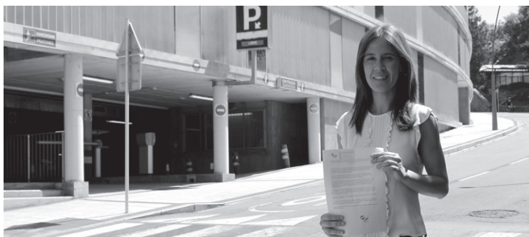
EAJko Estitxu Alkorta BM-ko aparkalekuaren aurrean mozioa eskutan duela.

Honen bitartez, "dendetako arduradunek gaur egungo BMko parkinean gehienez bi orduko aparkaldiko balioa izango luketen tiketak eskaini ahal