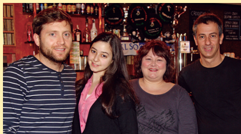
BUENETXEA kafetegia buenetxea@live.com