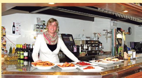
ARKUPE taberna facebook.com/ArkupeTaberna