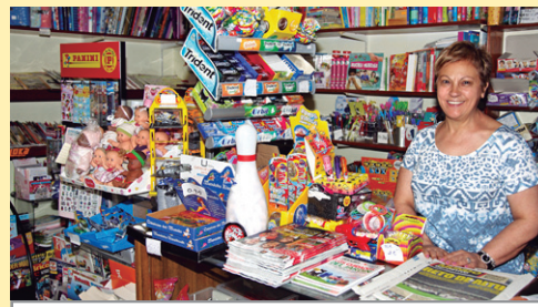
ZUMABURU liburudenda libreriazumaburu@hotmail.com