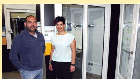
ALCAR leihoak www.ventanasalcar.com