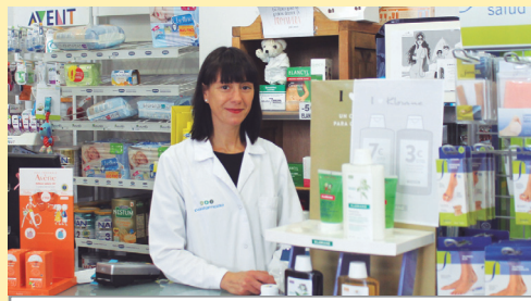
LASARTE parafarmazia parafarmazia.lasarte@gmail.com