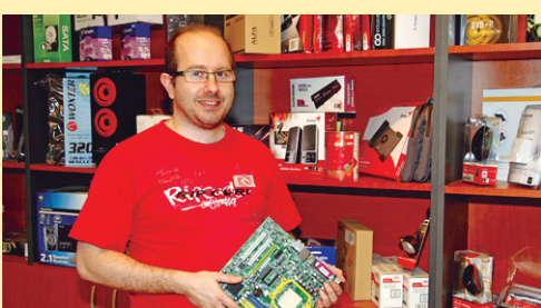
SANTANA informatika facebook.com/SantanaInformatika