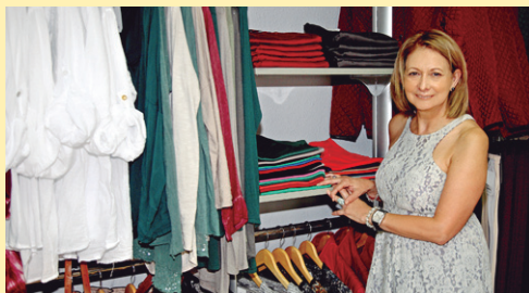
DONNA arropa denda