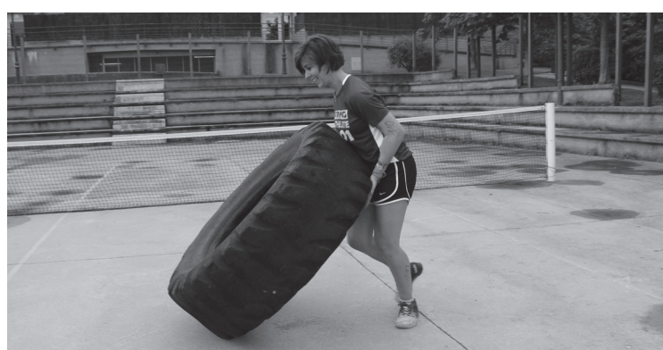
Irudietan, Koroibos Race lehiaketan egin behar zituzten probetako bi.