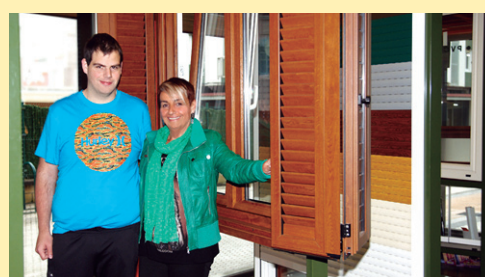
ISU leihoak ventanas_isu@hotmail.com