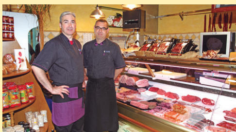
OKELA harategia okelaharategia@gmail.com