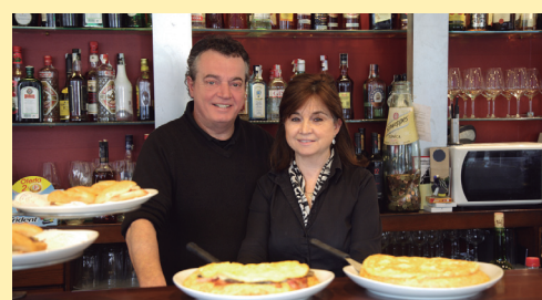
VIÑA DEL MAR taberna