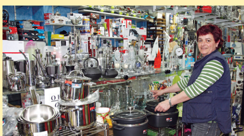
SUKOA burdindegia f.sukoa@hotmail.com