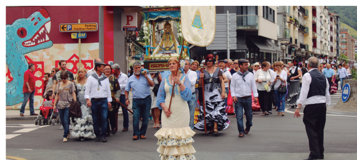
Emanaldi ugari izan ziren Atsobakarreko parkean. Erromesaldia ere izan zen atzo.