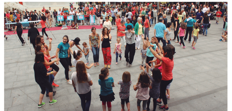
Plaza dantzako, ipar martxako eta zumbako lagunek Gure Esku Dagoren abestia dantzatu zuten.

Era berean, prozesuaren epeak ere azaldu zituzten Gure Esku Dagoko lagunek. Udazkenean bozkatzeko eguna aurkeztuko da, hau Burun- tzaldeko beste bi herrialde- kin adostuko da eta galdeketa aurrera eramango duen talde ere jakinaraziko da. Neguan galdera emango da jakitera