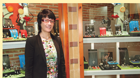
IZARRA bitxitegia izarrabitxitegia@hotmail.com