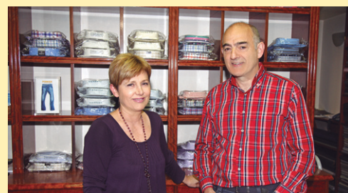
NOGUES jostudenda noguesmoda@gmail.com