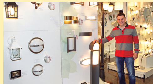
ARREGUI elektrizitatea www.electricidadarregui.com