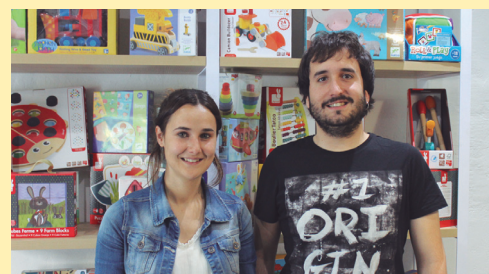
KATTAGORRI JOLAS kattagorrijolas@gmail.com