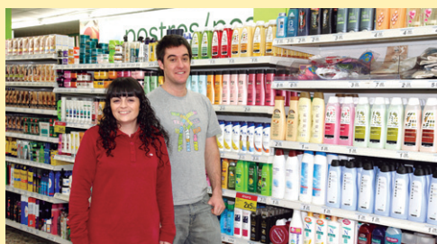
CARREFOUR EXPRESS www.carrefour.es