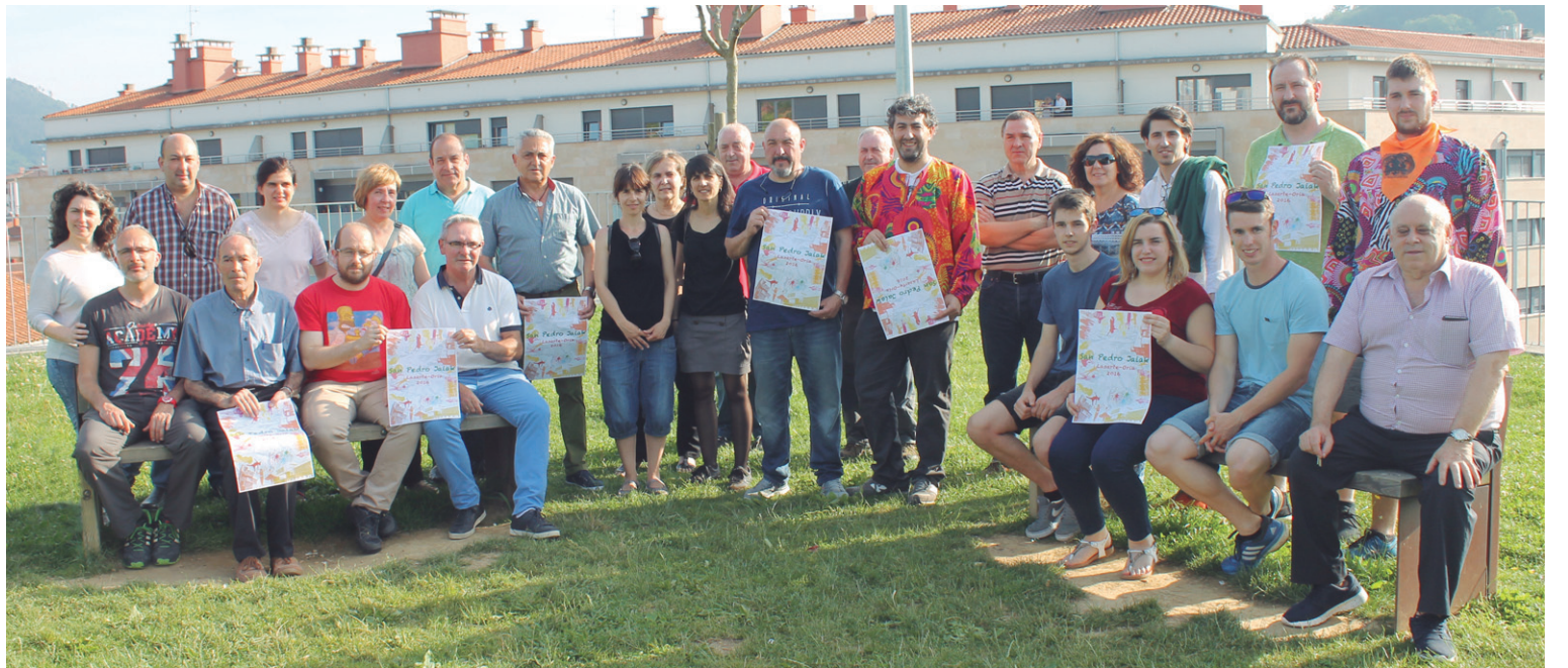
Udal ordezkariak eta herriko elkarte eta eragileak San Pedro Jaietako aurkezpen ekitaldian.

25 urte dira Ttakun kultur elkarteak Udako Txokoak antolatzen dituenetik eta hainbat berrikuntza daude aurtengoan. Egitaraua prestatzeko haur eta gurasoen laguntza izan dute arduradunek. Honetaz gain, jangela zerbitzua ere eskainiko du. Ekainaren 16ra arte dago izena ematea irekia. Bestalde, gazteek Kanpaldiak ere izango dituzte. Egitasmo hauetako bilerak aste honetan zehar eta hurrengoan egingo dira Manuel Lekuona kultur etxean.