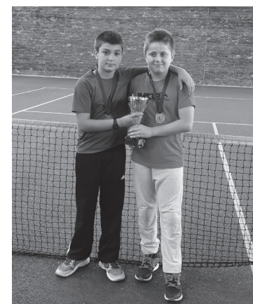
Landaberri 2. izan zen alebin mutiletan.