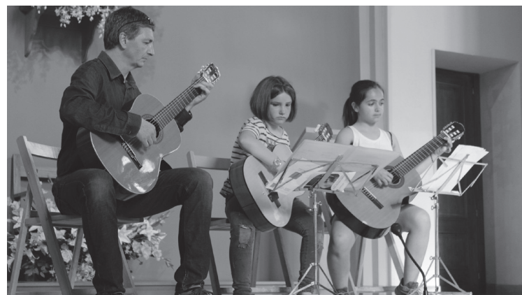
Udal Musika Eskolako kideek kontzertua eskaini zuten Karmengo Amaren kaperan.

Hiru eta zazpi urte bitarteko hamar bat umek entzun zituzten ipuinak, La Esperanza auzo-elkartean. Ondoren, Karmengo Amaren kaperara bertaratu ziren batzuk, musika emanaldia entzuterako.