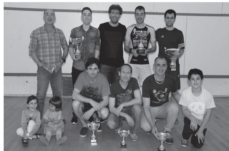
Argazkian, aurtengo squash txapelketako saridunak eta udal ordezkariak.

Erraketa eskuan hartuta jokatzaren diren hiru kirol desberdinen final handiak ikusi ahal izan zituzten herritarrek pasa den asteburuan. Squasha, padela eta tenisa eduki zituzten aukeran. Aurreneko biak Kiroldegian jokatu ziren; tenisekoa, berriz, Michelingo pistetan. Alde bate-tik bestera ibili ziren pilota eta jokalariek, larunbat osoan zehar.