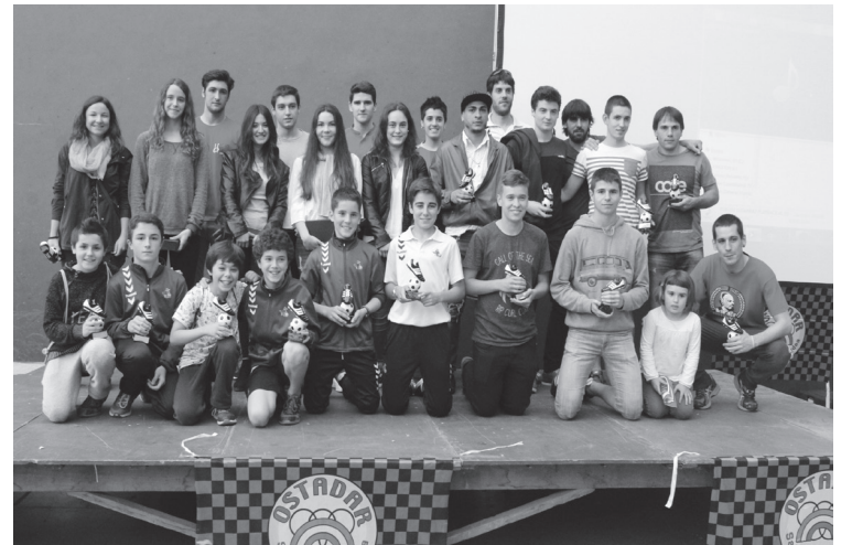
Areto-futbol, saskibalo eta futbol taldeetako jokari jatorrenak sarituak izan ziren.

Bukatu du 15/16 denboraldia Ostadar SKTk. Urtero lez, festa giroan; egun osoko ospakizuna izan zen iragan larunbatekoa. Goizean areto-futbol txapelketako finalak jokatu ziren Udal Kiroldegian. Arratsaldean, berriz, Loidi Barren pilotalekua izan zen klubeko arduradun, entrenatzaile eta jokalarien bilgune. Orain, oporrak hartzeko ordua da.