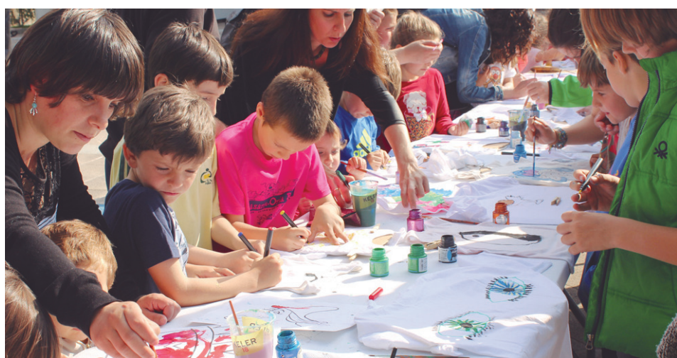
Kamisetak margotu, birziklatutako materialekin karterak... hainbat eskulan egin zituzten asteartean.

Batzarrari amaiera emateko, bertso bat bota zuten gaztetxoek bertaratutako irakasle eta gelakideen laguntzaz.