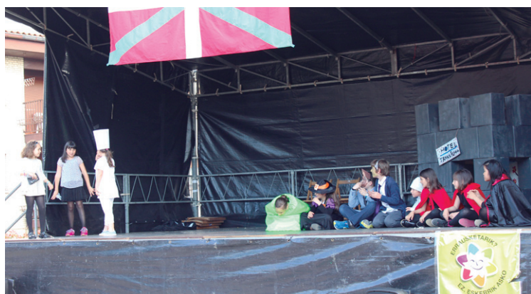
'Hotel Transilvania' eta 'Mimokeriak' antzerkiak ikusi ahal izan ziren Antonio Blas plazan.