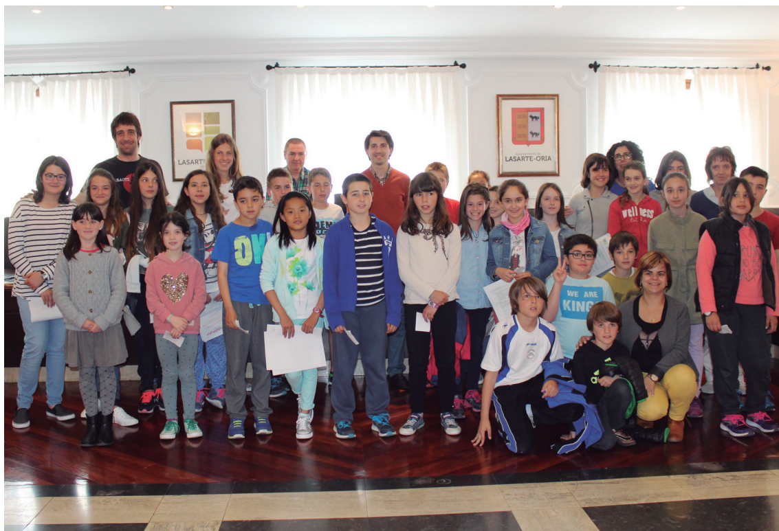
Familia argazkia egin zuten ezohiko plenoaren ondoren.

"Hala ere proiektua egon badago eta Udalak egin dezakeen bakarra da Aldundiari eskaera luzatu ahalik eta lasterren lanak has ditzan. Udalak, hala ere, Sasoearako bidea jarri beharko luke eta horretaz gain, hainbestetan eskatu zaizkigun bizikletak