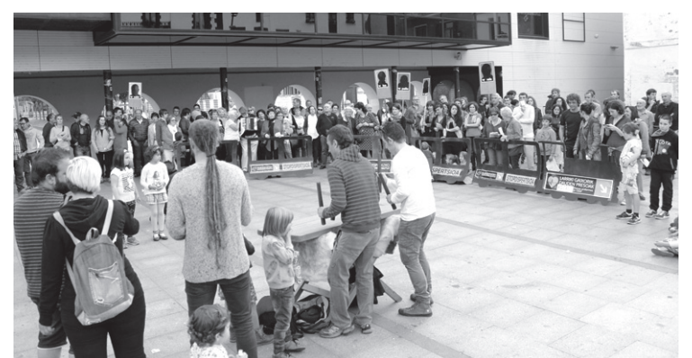
Lasarte-Oriako kultur eragile eta norbanakok eskaini zituzten emanaldiak.

Horrez gain, herriko kulturetzako eragile eta norbanakok ikuskizunak eskaini zituzten: dantzariak, Xumela abesbatza, abeslariak... denetik egon zen. Beno, egiaz zor, "persona garrantzitsu" bat falta zen,