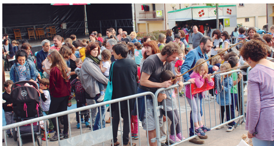
Asteazken arratsaldean, haur eta gazteek jokoetan opariak eskuratu ahal izan zituzten.