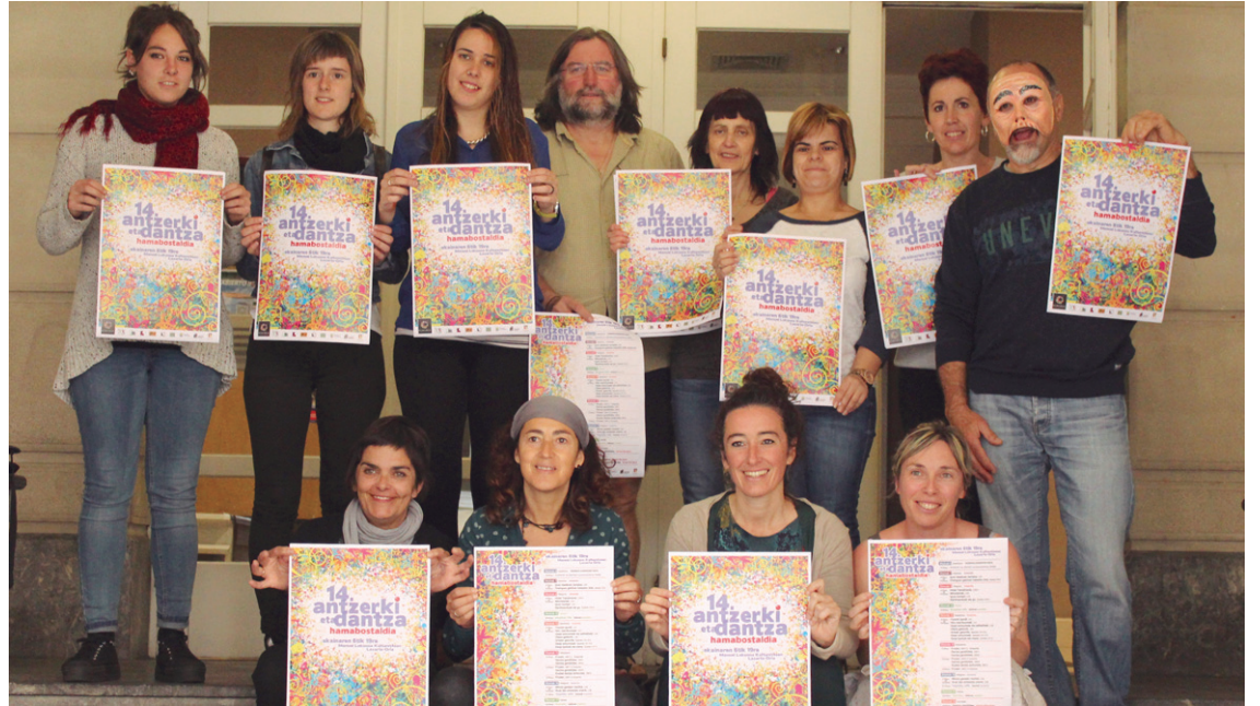
Kukuka Antzerki eta Dantza eskolako kideak eta Udal ordezkariak aurtengo edizioko aurkezpenean.

Ekainaren 7an, LH5 eta Sasoetako LH4 eta LH5 mailako gaztetxeen saioa izango da.