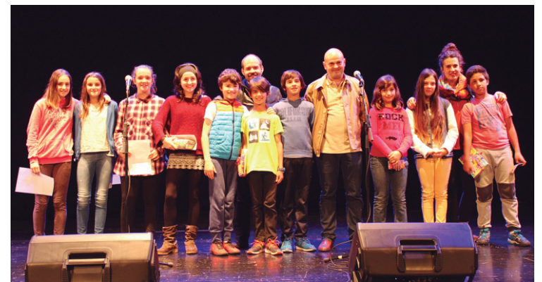
Bertso Paper Lehiaketako saridunak, 'The Shield' taldea falta da.

Aurten Landaberi LH eta DBH mailako ikasleek eta Sasoeta-Zumaburu ikastetxeko LH mailako gazteek hartu dute parte. Guztira 90 lan aurkeztu dira lehiaketara.