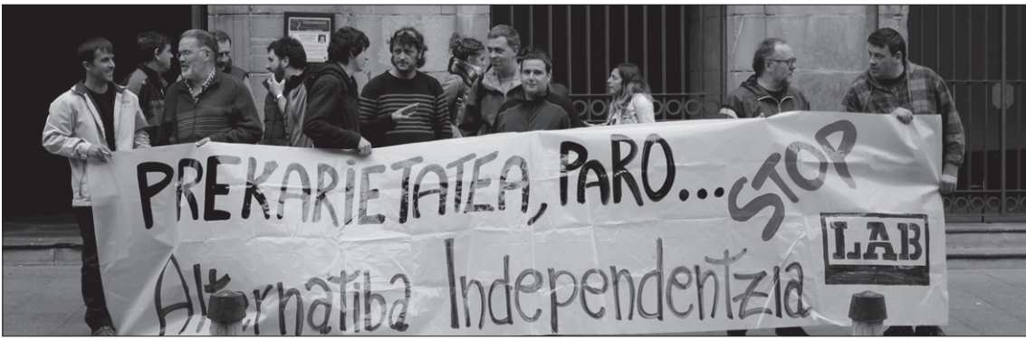
Astlehenean, Lasarte-Oriako udaletxe zahar aurrean bildu ziren LABeko lagunak. Gaur eskualdeko manifestazioa izango da.