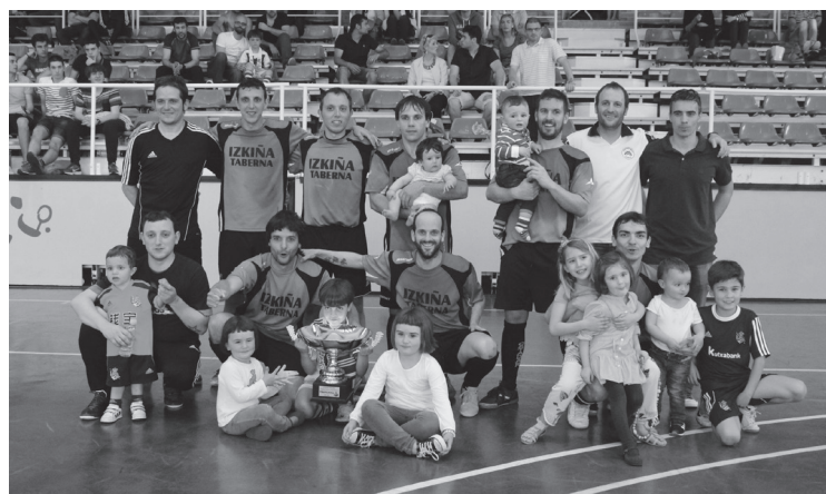
Izkiñak irabazi du herriko areto-futbol txapelketaren aurtengo edizioa.