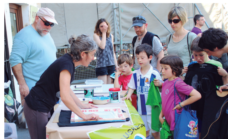
Aire Garbia plataformako lagunak kamixetatan logoa serigrafiazten zuten.