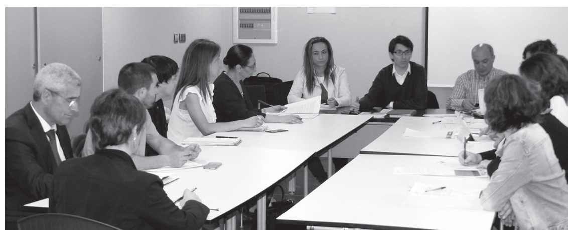
Lasarte-Oriako Enplegu-Mahaia sortu zen ostiralean. Eragile ezberdinak daude honetan,

Udalak ohar bidez azaltzen duenez, jaio den kontsulta-organo honek erreminta gisa balioko du. Honen bitartez, eragile publiko nahiz pri-