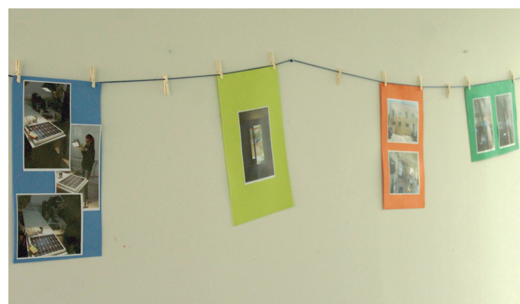
Landaberri DBH4ko ikasleen argazki erakusketa ere izan zen Antonio Mercero gunean.