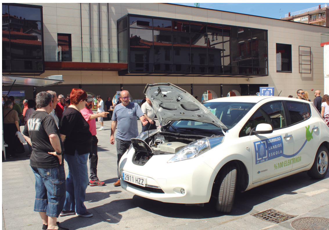
Hainbat proiektu izan ziren Energia azokan. Jakin-mina sortu zuten, besteak beste kotxe elektrikoak edo galdara sistemek.