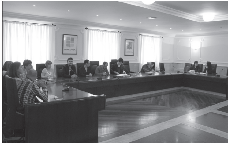
Abendurako obrak bukatua egon behar duenez, urgentziaz bildu ziren ordezkariak.

Buenos Aires aldapako espaloien zabaltzea eta Goikale-Kale Nagusia-Askorena guneko urbanizazioa martxan dira. Urgentziaz bildutako Udalbatzarrak bi obrak onartu zituen PSE-EEren, EAJren eta EH Bilduren botoekin. LOAD abstenitu egin zen, eta PPko ordezkaria ez zen azaldu.