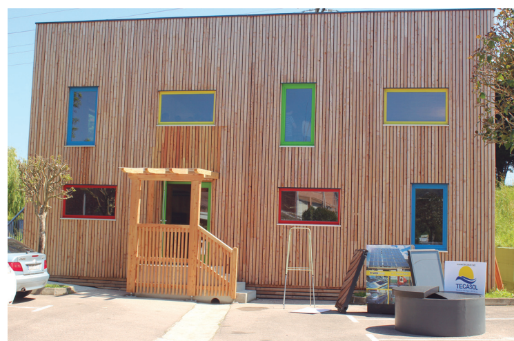
Usurbilgo Eskolak ostiralean Enegur eraikin berria aurkeztu zuen.