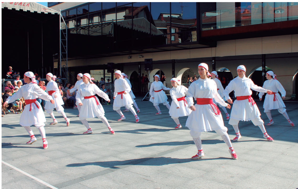
Aurtun ere, Okendo plaza euskal dantzez beteko da asteburuan. Larunbat arratsaldean II. Dantzari eguneko taldeak izango dira plazan.

Erketz dantza taldeko haur eta gazteen taldearekin batera, Nafarroa, Bizkaia eta Gipuzkoako 5 talde izango dira aurtun jaialdi honetan: Faltzesko Makaia taldea, Errenteriako Ereintza dantza taldea, Sestaoko Salleko taldea, Usurbilgo Orbeldi eta Lasarte-Oriako Kukuka Antzerki eta dantza eskolako taldea.