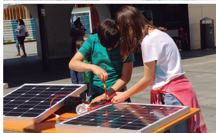
Proiektu ezberdinak ezagutu edo probatu ahal izan zituzten Usurbilgo eskolako kideen eskutik.