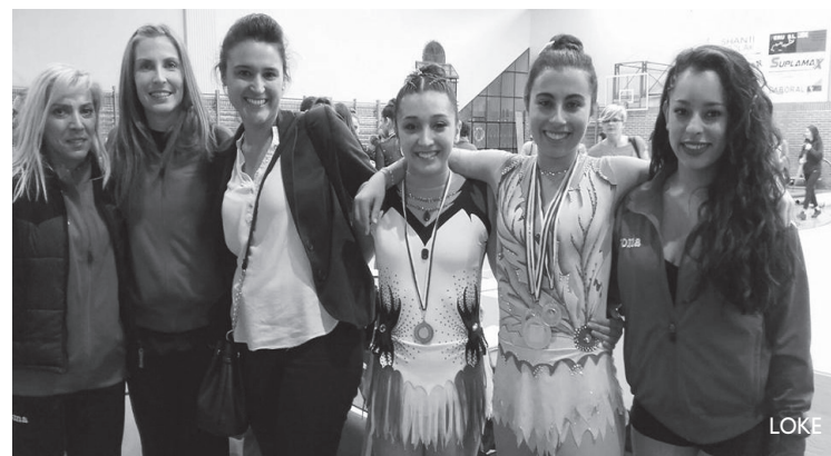
Gipuzkoako txapelketako emaitzak ezin hobekak izan dira LOKErentzat.