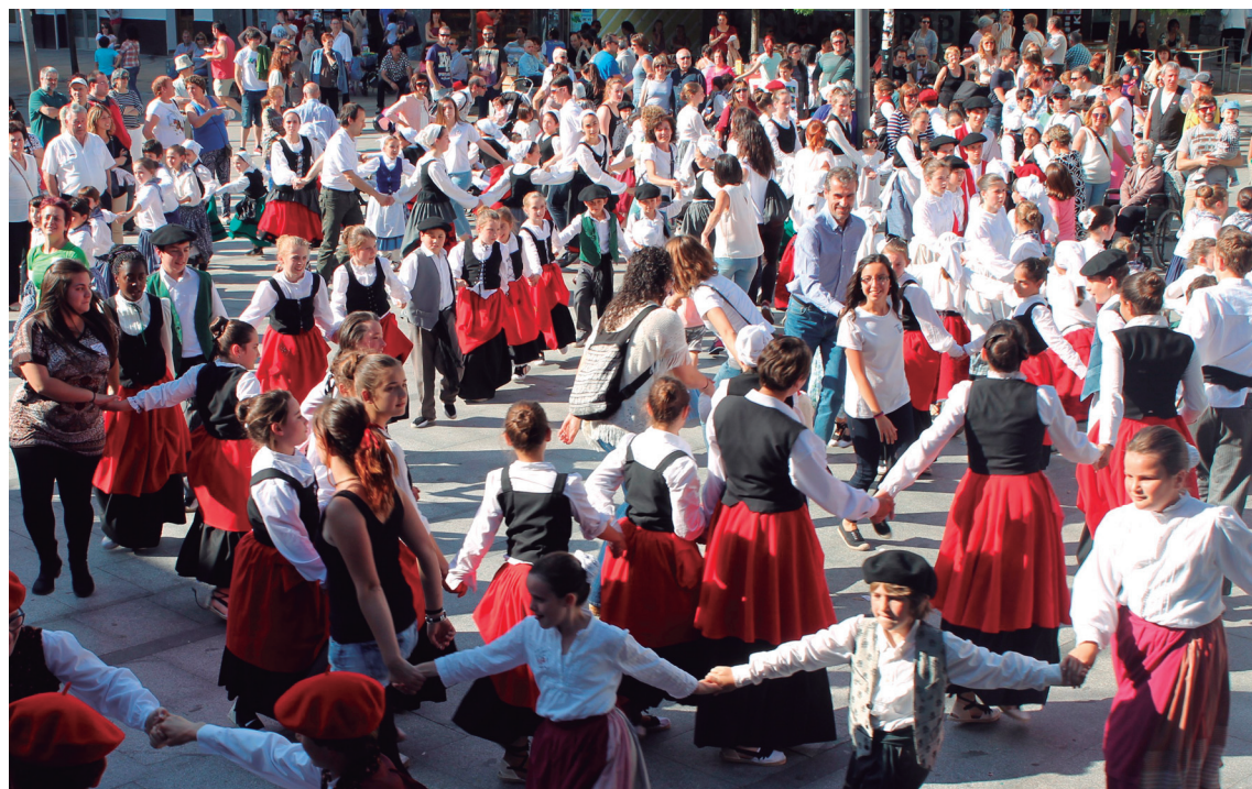
Igandean, berriz, dantzari txikiak herriko kaleak alaituko dituzte goizean eta arratsaldean, emanaldia izango da plazan.

Saio irekiak dira eta edonork parte hartu dezakeela azpimarratzen dute.