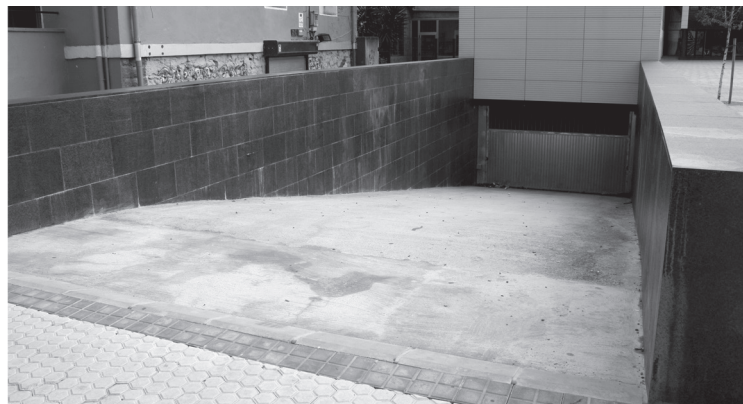
35 aparkaleku geratu dira libre Okendo plazan; 4 berriz, Donostia etorbidean.

Aparkaleku guztiak errentamendu erregimenekoak dira eta hilean 60 euroko kostua dute.