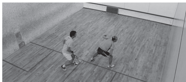
Asteleheneretik ostiralera jokatzeko partiduak, Udako Kiroldegian.

Kontsolazio faseko koadroa ere osatuta dago: zortzi