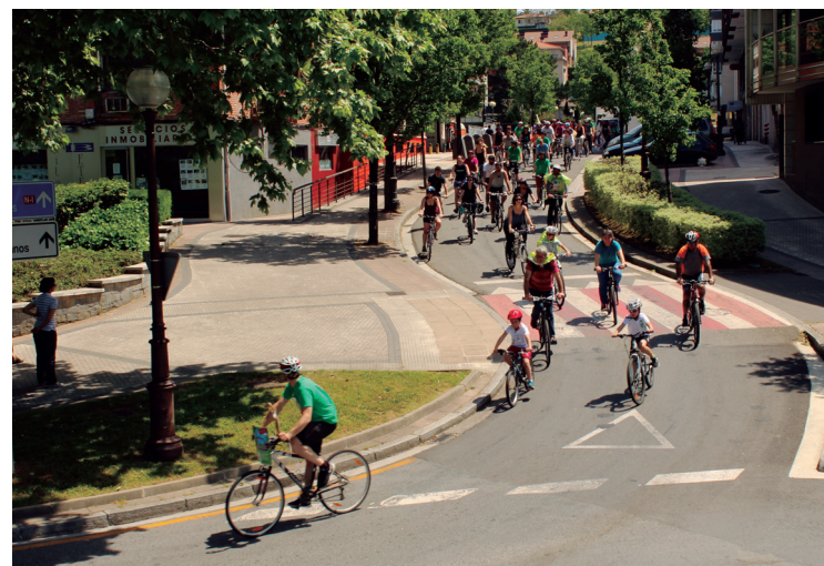
Usurbil, Zubieta eta Lasarte-Oriako lagunek erraustegiaren aurka egin zuten Txirrinkan.

Aire Garbikoek asteazkenean, hilak 25, egingo dute katea prestatzeko azken bilerara. Arratsaldeko 19:30ean izango da, kultura-etxean. "Laguntzeko prest dagoen edozein gonbidatuta dago, jakina".