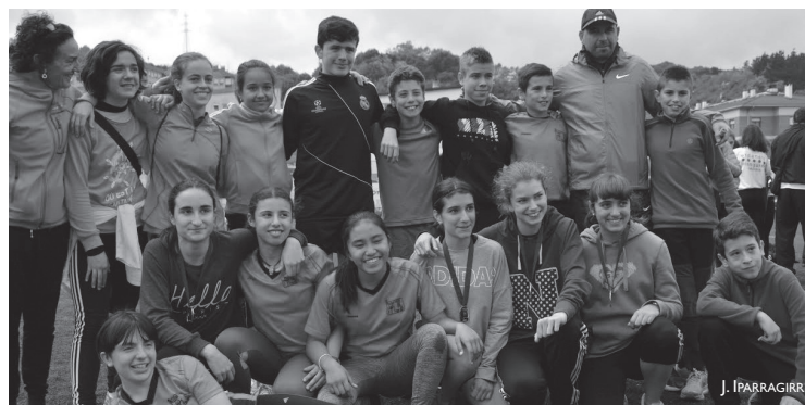
Atletismoak badu etorkizuna herrian; Landaberriko infantilak 2. izan ziren taldekakoan.