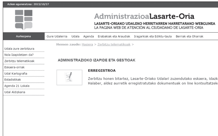
Lasarte-Oriako Udalaren webgunean ere egin ahalgo dira administrazio izapideak.

Lasarte-Oriako Udalak eta Eusko Jaurlaritzak lau urteko lankidetzaren hitzarmena sinatu dute. Honen bitartez, informazio, administrazio eta kudeaketa elektronikoko zerbitzuak elkarri eskainiko dizkiete.