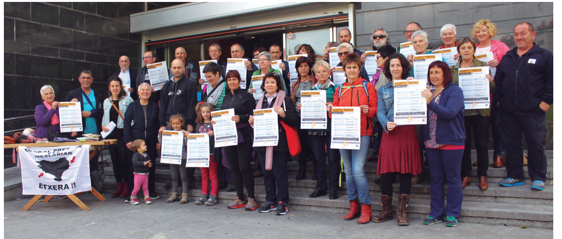
Asteleheneko aurkezpenean, Sareko kideak, ekimenean parte hartuko duten ordezkariak eta herritarrak bildu ziren.