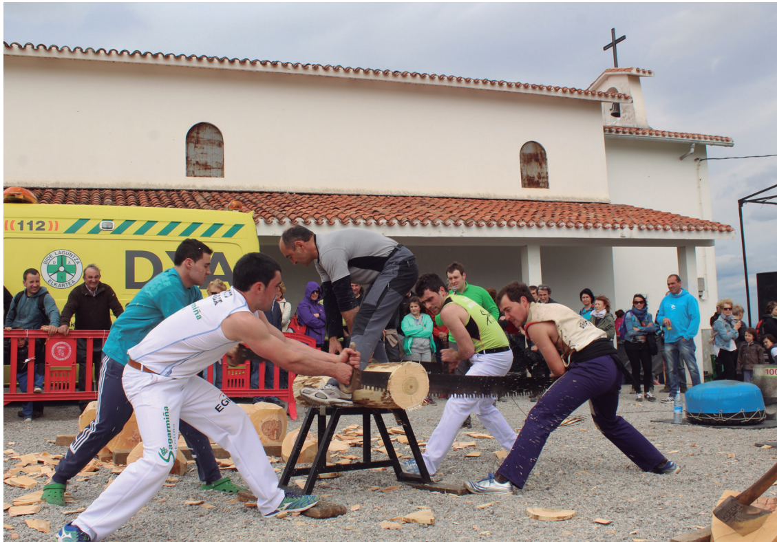
Telleria eta Mugertza anaien arteko desafioak ikusmira sortu zuen Azkorte bertaratutakoeren artean.