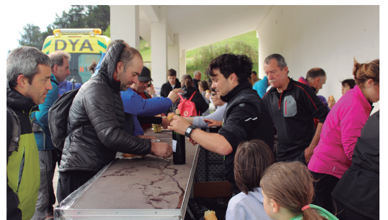
Erromerian dantza egin, eta, gero, tabernan indarrak hartzera pintxo eta edariekin.