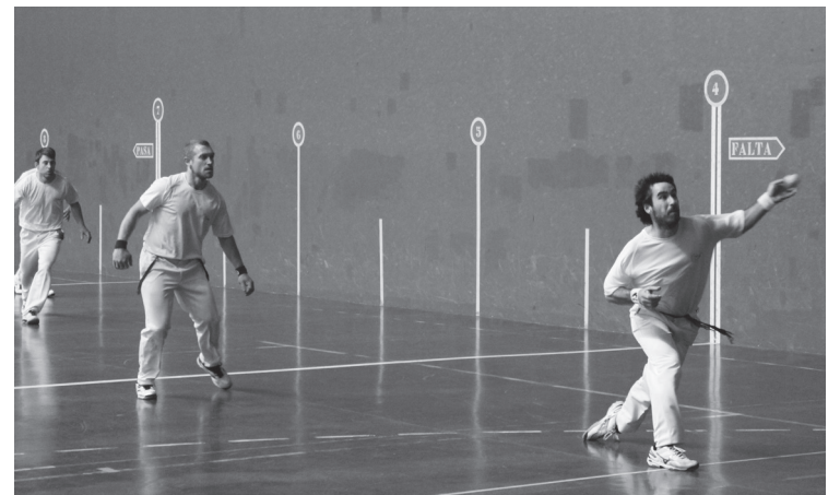
Bergara aurreratu da herriarteko txapelketako final hamaseirenetan.

Emaizta horiekin, bi aukera ditu Lasarte-Oriak final zortzirenetara sailkatzeko: hiru partiduetan irabaztea, edo bi gutxienez. Bi irabazita ere, 12 tantoko alde negatiboa irauli beharko lukete herriko pilotariek. Zaila, baina ez ezinezkoa.