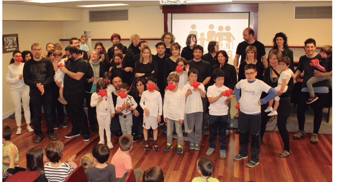
GuraSOS mugimenduko hainbat kidek talde argazkia atera zuten larunbateko aurkezpen ekitaldia amaitu eta berehala.

Olivaresek aipatu zuenez, Eusko Jaularitzak 30 kilometroko eragin-eremu bat onartu du, erraustegien kutsaduraren sakabanatze atmosferikoaren azterketari buruzko ikerketan. "200 hezkuntza zentro daude eremu horren barnean, gurea eta zuena barne, baita Donostiako ospitaleak eta Onkologikoa ere".