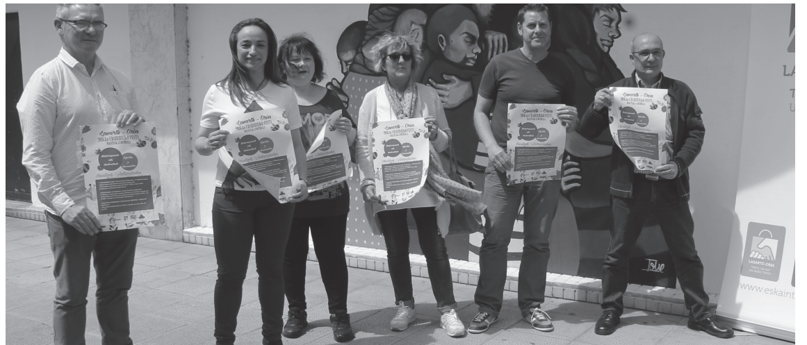
Aterpeko eta Udaleko ordezkariak, pasa den ostiraleko aurkezpen prentsurrekoan, Juan XXIII plazan.

Arratsaldeko seietatik bederatzietara, haurrek ederki pasa ahalko dute Juan XXIII eta Zumaburuko Eliza plazetan egongo diren puzgarriekin. Antolatzaileek jakinarazi dute Loidi Barren pilotalekura eramango liritekeela jolas horiek, euria egingo balu. Bien bitartean, Dinbi Banda batukada