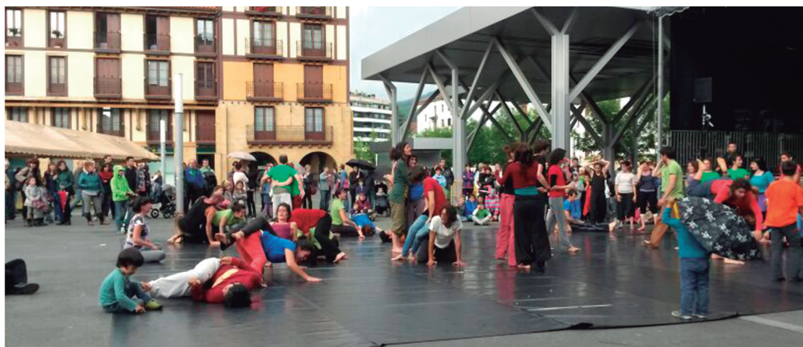
Igandean, dantza ezagutzera emateko, Kontakt Inpro teknikako performancea egingo da kalean.