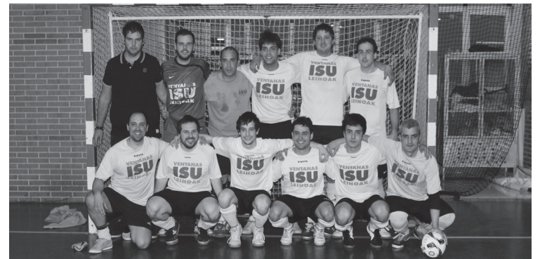
ISU Leihoak taldea, ostiraleko partiduari ekin aurretik.