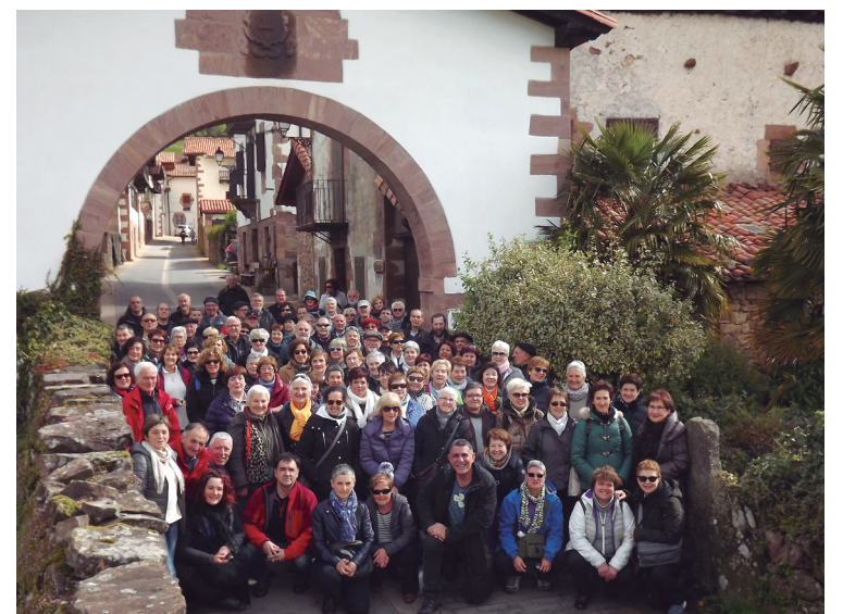
Korueta kideak Amaiurren ateratako argazkian.