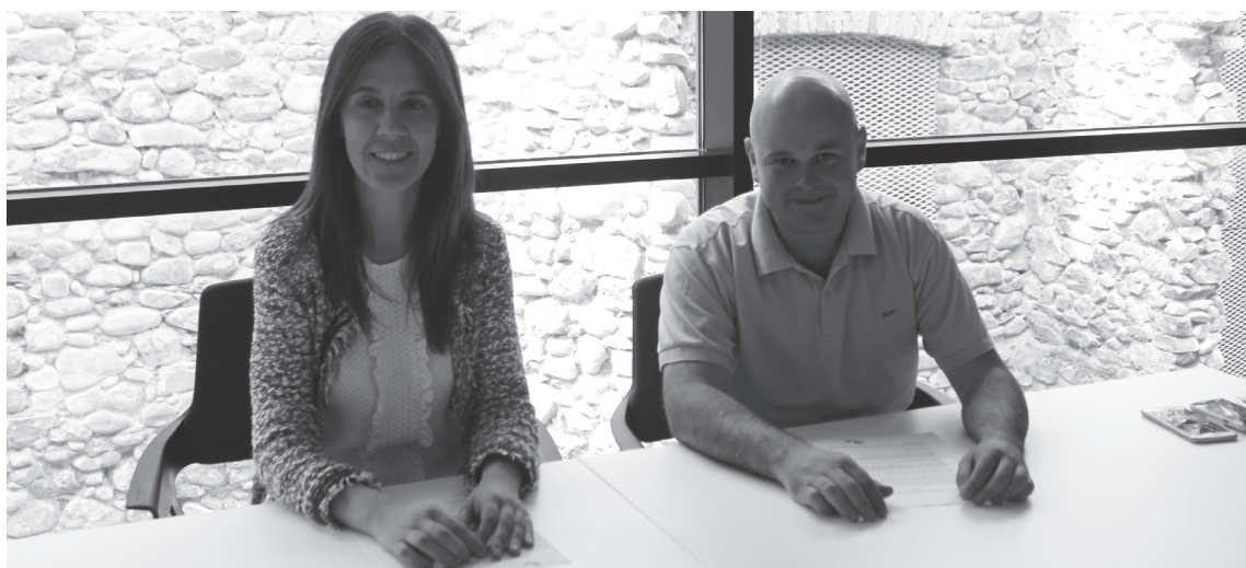
Udalari gimnasioekin eta hipikarekin akordio bat sinatzeko proposatuko dio EAJk bihar, "herriko kirol eskaintza areagotzeko".

Hitzarmena sinatzeaz gain beste eskaera batzuk egingo ditu alderdi jeltzaleak bihar: herriko kirol taldeek instalazio pribatu horiek erabili ahal izatea eta akordioa Buruntzaldea bailarara hedatu ahal izatea, besteak beste.