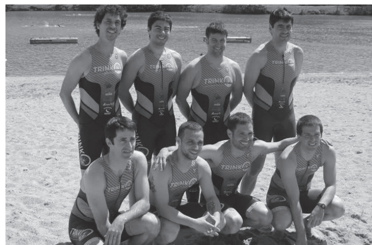
Senpereko taldekako triatloia osatu zuten Trinkoko zortzi kidek asteburuan. TRINKO

Uretan, bizikleta gainean zein lasterka dena emateko prest daude Trinko Lasarte-Oriako triatloi taldeko kideak. Denboraldia bihar hasiko dute ofizialki, Bermeon. Zita hori baino lehen, Senperekoan hartu zuten parte batzuek, iragan asteburuan, gorputzean kilometroak pilatu eta talde giroa sortzeko helburuz.