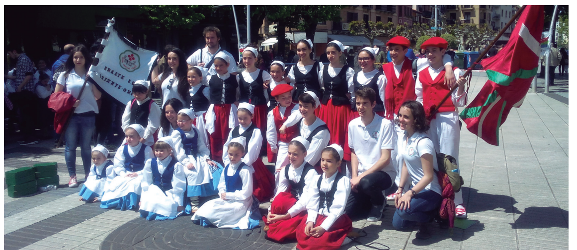
Erketz Txikiko dantzariak, begiraleak eta txistularia Erreteriko Dantzari Txiki Egunean izan ziren lehengo igandean.

Hauetaz gain, San Juan bezperako ohiturari eutsiaz