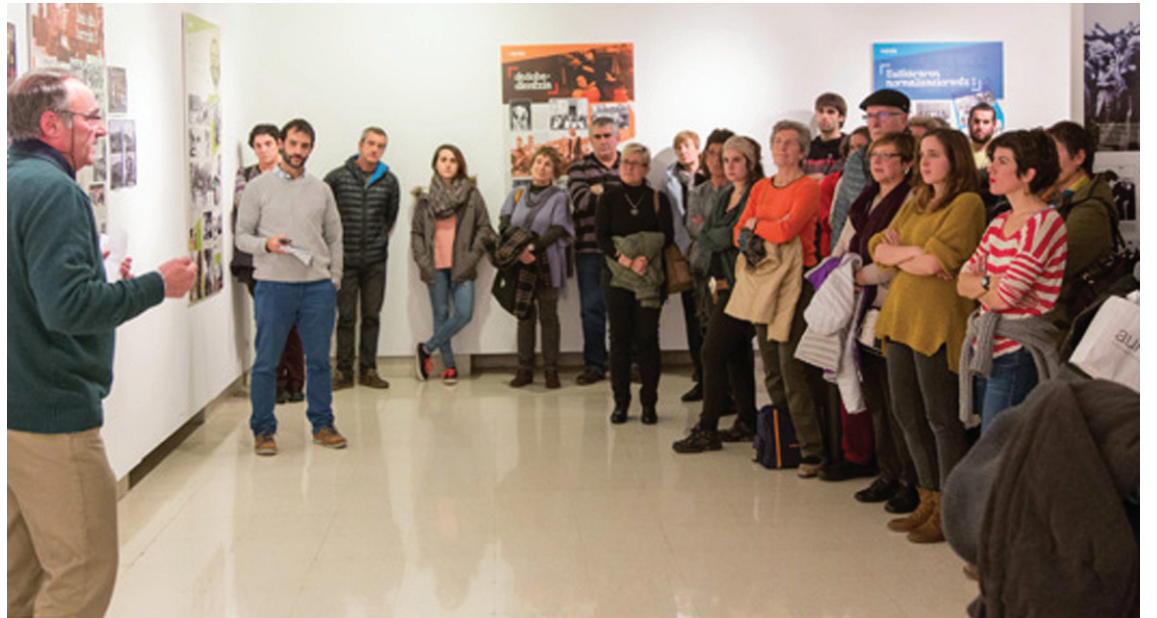
'Trantsizioak' erakusketa ikusteko aukera egongo da, besteak beste.

Trantsizioaren "adiera zabal" erakutsi nahi du erakusketaren izenburuak. Frankoren heriotzatik gaur arte bitzitako aldaketak isladatu