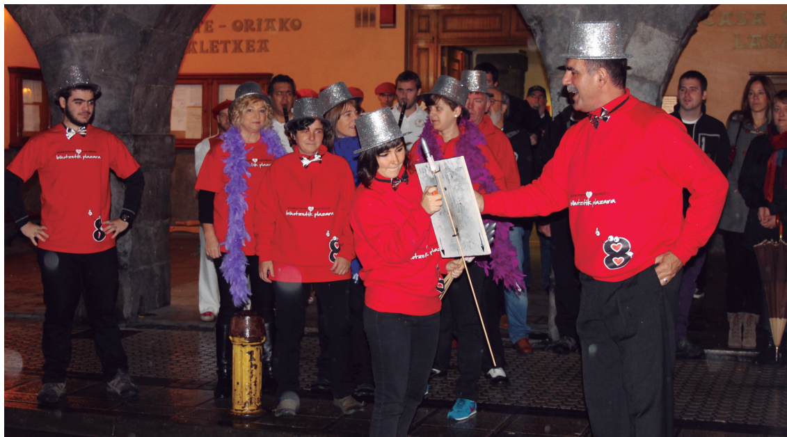
Bost hilabete falta dira Euskararen Maratoirako, eta, hurrengo asteazkeneko aurkezpenaren ostean, atzerako kontaketa hasiko da.

Maratoia zuzenduko duen zortzikotea, leloa eta irudia ezagutzera emateaz gain, agerraldian ezustekoak ere izango direla aurreratu dute antolatzaileek.