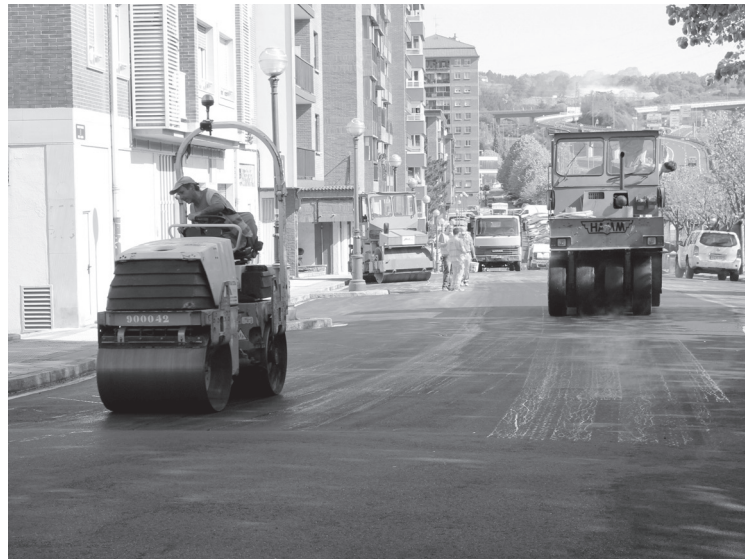
Sasoeta pasealekuko asfaltatze lanak egin dira aste honetan.

Lasarte-Oriako errepideen egoera tamalgarria ikusirik, Lasarte-Oriako Udalak kreditu aldaketa bitartez kaleak asfaltzeko aurrekontua onartu zuen 2015 urtean. Sasoeta auzoan hasi ziren lanak aste hasieran. Hurrengo eremua Iñigo de Loiola eta Pablo Mutiozabal izango da eta gaur dira hastekoak lanak.