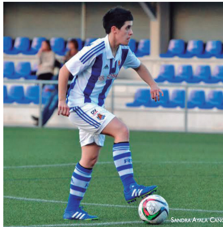
Denboraldia amaitu bitartean minutu gehiago jokatzera du helburu Iraiak.

Pasa den urtean ozta-ozta libratu zen taldea kategoriatik galtzetik, eta, aurtengo laugarren goaz sailkapenean, 49 punturekin. Partida batzuek falta dira oraindik liga bukatzeko, baina Erreginaren Kopa jokatzeko sailkatu gara jada, hainbat urte eta gero. Harrobikoak eta jokalarri euskaldunak kanpotik etorri diren beste hainbatekin uztartzeko apustua egin zuen Realak