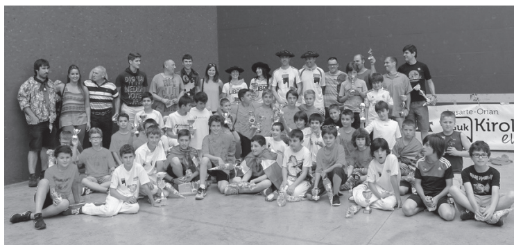
Irudian, iazko txapelketetako parte hartzaile eta antolatzaileak.

Txapelketa horietan apuntatzeko bide bat baino gehiago daukate herritarrek. Pasa daitezke Michelingo pilotalekutik, astearte eta ostegunetan, 18:00etatik 20:00etara bitartean. Bestela, posta elektronikoki bidez ere eman daiteke izena, solanojf@hotmail.com helbidera idatzita. Ohar batzuk ere eman ditu antolatzaileak, Intza KE hain justu: zehaztu du materiala eurek jarriko dutela, eta ez direla txapelketako partidak jokatu