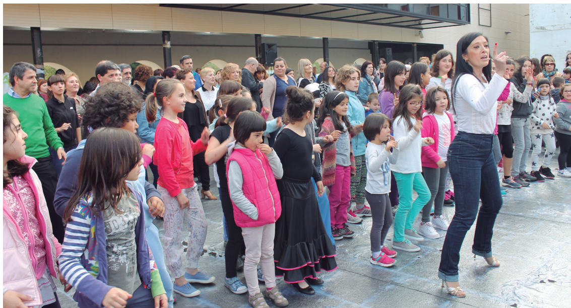
laz erakustaldi txikia eta estilo bakoitzeko pauso batzuk erakutsi zituzten dantza eskolek Okendo plazan egindako saioan,

banakakoa eta funkyaren mugimenduz gozatu ahalko da eta euskal fandangoa eta sevillanak ere dantzatzeko dituzte.