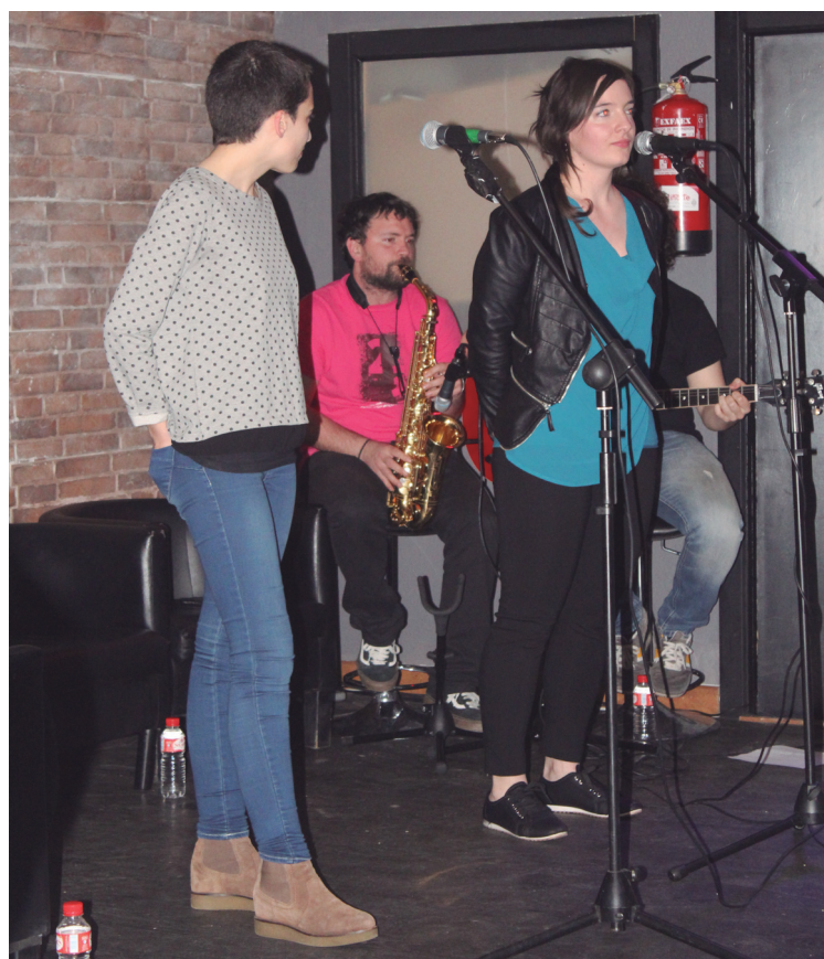
Herritar ugari hurbildu zen igandean "Ez da kasualitatea" bertso saio feminista ikustera.

Saio gehienetan gizonezkoak gehiengoa izatea "kasualitatea ez dela" aldarrikatzen dute, eta horregatik, emakumeek osatutako bertso jaialdia antolatu dute.