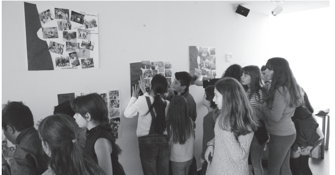
Gazte Klubeko lagunek primerako arratsaldea pasa zuten ostiralean, erakusketako argazkiak ikusten.

Hamaika ekintza, jolas, irteera eta abentura antolatu ditu Ttakun Kultur Elkarteko Aisia sailak 25 urte hauetan. Are handiagoa da horietan ateratako argazki kopurua. Horieta asko bildu ditu pasa den ostiralera arte irekita egon den erakusketak, Antonio Mercero aretoan. Hainbat herritar gerturatu dira bertara hiru asteotan, irudi horiez gozatzera.