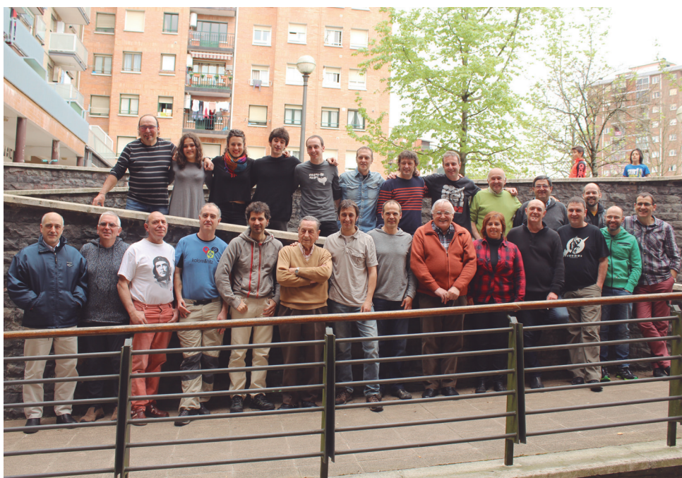
Bertso eskolako kide eta kide ohiek elkarrekin bazkaldtu zuten Xirimiri elkartean