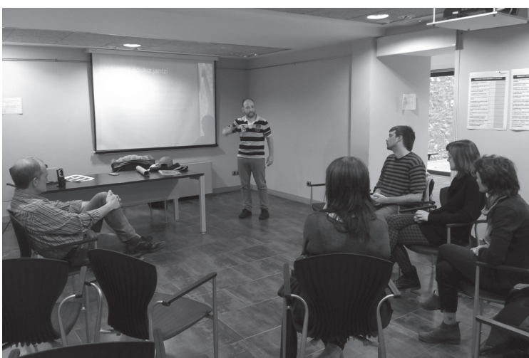
Bilera irekian proposamen berria azaldu zuten Euskal Inauterietako konpartsako kideek.