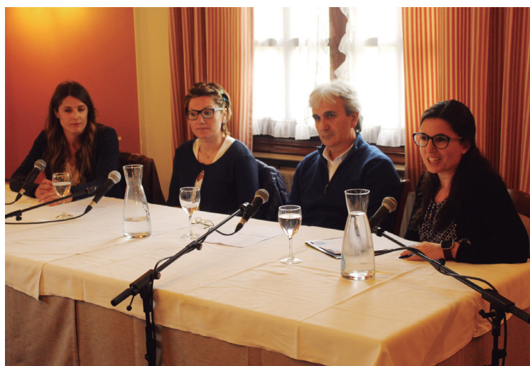
Mahai inguruak izan dira aurtengo topaketen berrikuntza nagusia. Pare bat egin zituzten ostegun arratsaldean, Goiegi jatetxean.