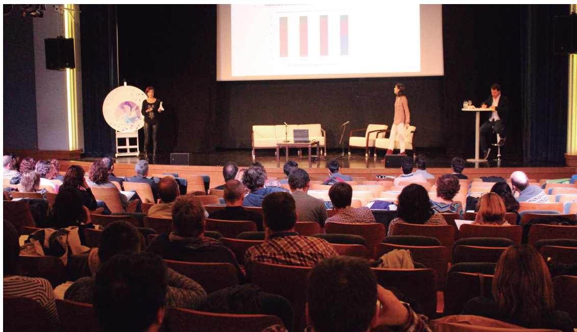
Aurtengo Udaltop jardunaldietan 190 bat pertsona aritu dira hausnarketak egiten: hizlariak, euskara teknikariak, eta beste asko.