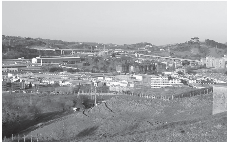
Baloratuko duten Lasarte-Oriako paisaietako bat.

Eusko Jaurlaritzak Donostialdeako eta Bidasoa Beheko paisaien katalogoa egiteko asmoa adierazi du. Horretarako, eskualdetako herritarrek gonbidatu dituzte euren proposamenak eta iritziak partekatzen. Mota askotako paisaiak hartuko dituzte kontuan, ez bakarrik naturgune eta landagune "aipagarriak".