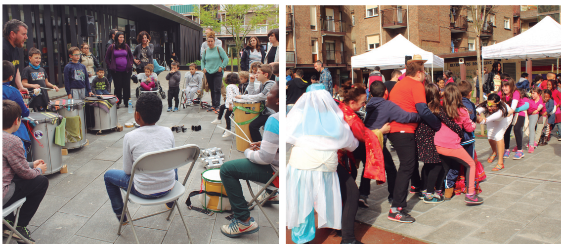
Ostirala arratsaldean, perkusio edo dantza tailerra eta haurrentzako jokoak izan ziren Jaizkibel plazan.