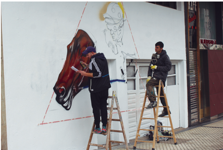
Forma abstraktuak eta irudiak nahasten dira hainbat lanetan.