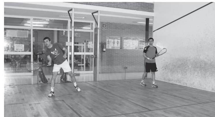
Hamalau jokalarik eman dute izena aurtengo edizioan aritzeko.

Aipatu parte hartzaile horiek ligaxka jokatuko dute maiatzaren 5era arte. Ondoren, emaitzen arabera, txapel-dunen fasera sailkatuko dira batzuk eta kontsolaziora besteak. Lehenengo fase horretako partidak Udal Kiroldegiko kantxan jokatzen ari dira, astelehenean ostiralerara, 19:00etatik 21:00etara bitartean.