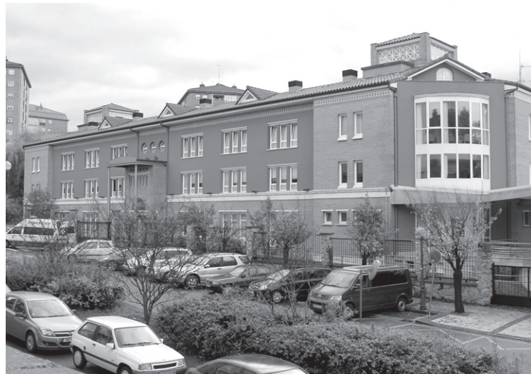
Atsobakar egoitzean hutsik zeuden plazak bete ahalko dira.

Gipuzkoako Foru Aldundiak Atsobakar zahar-etxearen kudeaketa beregain hartzeko pausoak ematen ari da. Lehengo astelehenean Kontseiluak Lasarte-Oriako Udalarekin duen hitzarmena zabaltzea onartu zuen. Honi esker, egoitzan eta eguneko zentroan hutsik zeuden plazak bete ahalko dira.