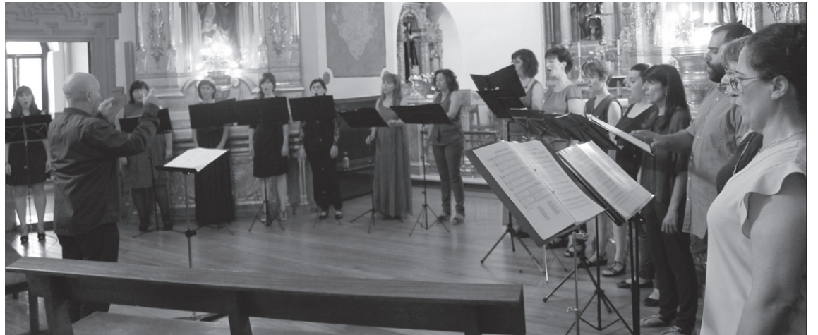
Aqua Lauda lehengo urteko Brigitarren komentuan egindako emanaldian.