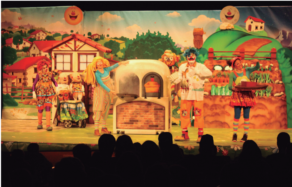
'Amalur' ikuskizunaren bi saio izan ziren Lasarte-Orian. Pirritx, Porrotx, Pupu eta Lorek baserriarren bizitza ezagutu zuten.