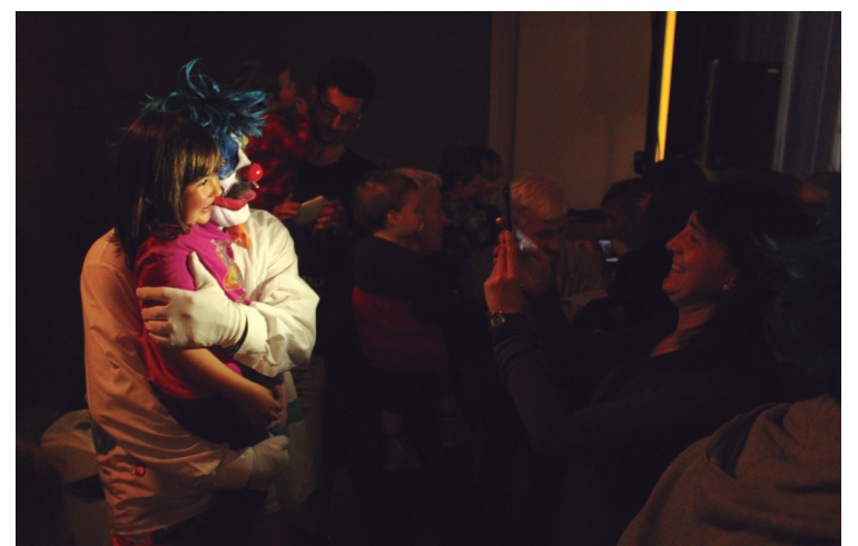
Haur eta helduek pailazoei dieten maitasuna erakutsi zuten saioak amaitzean.