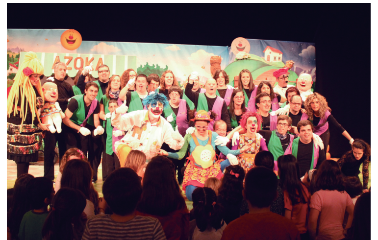
Jalguneko lagunak izan ziren pailazoekin dantzan eta amaieran argazkia atera zuten.