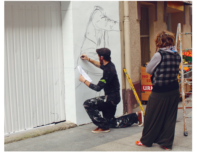
Margoak, arkatzak, ikatz-ziriak, espraiak... beharrezko material guztia ekarri zuten Guztion Lasarte-Oria! mural lehiaketako finalistek egokitutako hormetan haien lanak irudikatzen.