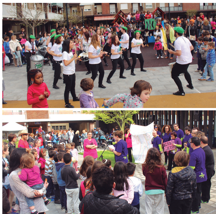
Dinbi Banda eta Jalgune elkarteko lagunak ere izan ziren jaialdian parte hartzen.