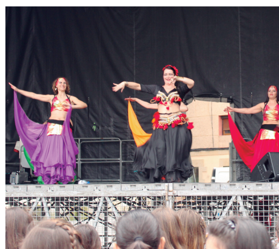
Okendo plazan musika eta dantza emanaldiak izan ziren nagusi arratsaldean. Tebal elkartearen haima ere izan zen bertan.