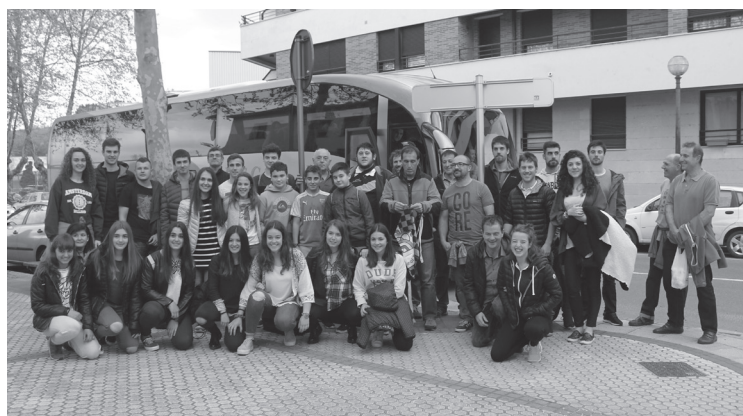
Ostadar SKTko kideak, Gasteizera autobusa hartu aurretik.

Sekulako partidaz gozatu zuten; 82-78 irabazi zuten Baskoniak, luzapenean. 2-0 aurreratu dira seriean; partida bat gehiago irabazi behar dute