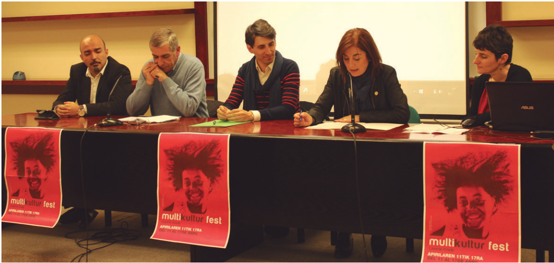
Astelehenean Multikultur Fest-en hasiera ofiziala egin zen Manuel Lekuona kultur etxeko hitzaldi aretoan.