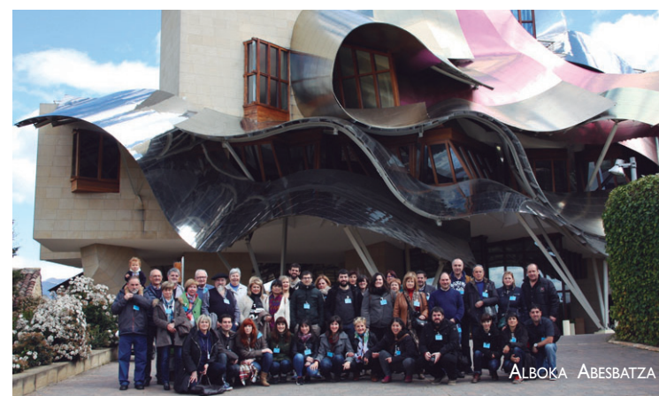
Abesbatza kideek eta bazkideek Elciegoko 'Marques de Riscal' upeltegia bisitatu zuten.

Abesbatzako zuzendari-tzak irakurketa oso positiboa