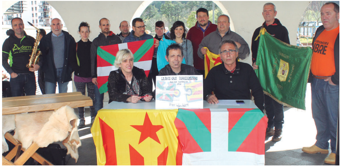
Lasarte-Oria eta Torredembarra herrien arteko kultura topaketa antolatu duten elkarte eta taldeetako kideak aurkezpenean.

17:00etan, Okendotik irten gozoko kalejira. Horretan Ball de diables, Ball de Serralonga, Ball de Bastons, Ball de Pastonets, Colla casteller de la torre taldeak, herriko Oaintxe in deu txaranga eta rezibatukadak hartuko dute parte.