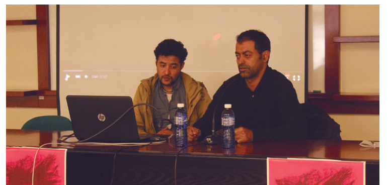
Esteriotipoak, zurrumurrak, islama... izan dira hitzaldietan jorratu diren gaiak.