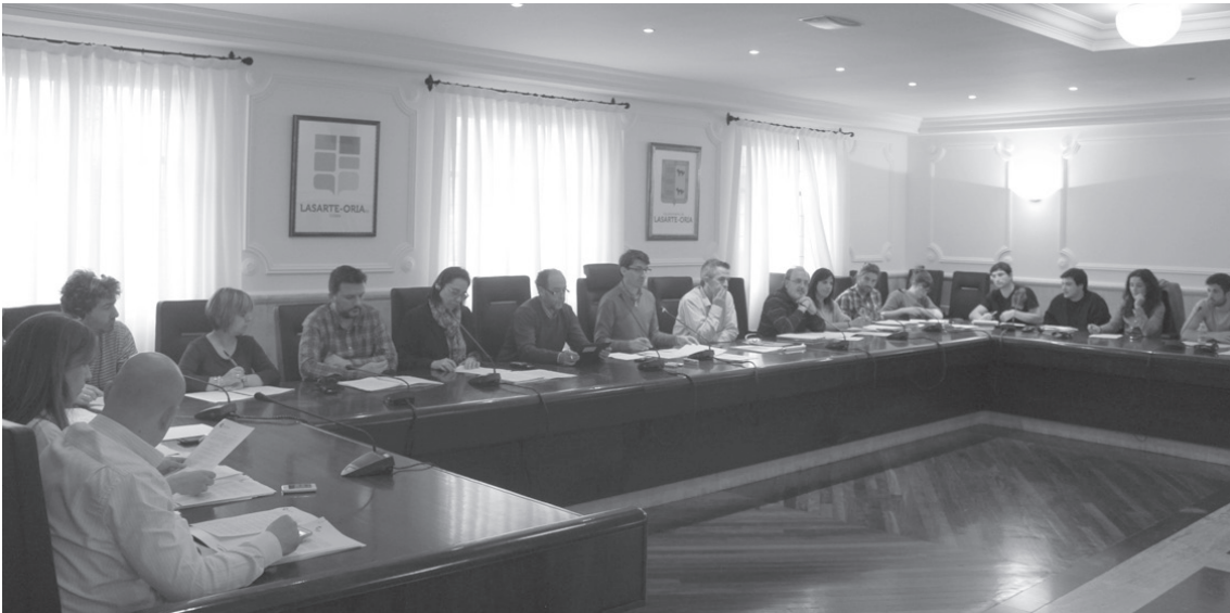
Adierazpen instituzional ugari eztabaidatu zituzten ordezkariak.