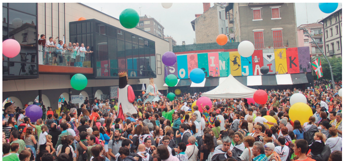
Guztira 9.000 euro banatuko dituzte diru laguntza eskatzen duten norbanakoek eta elkarteekin artean.

baloratuko dituzten irizpideak. Programaren beraren irizpideek 40 puntu emango dituzte. Horietatik hogeit hamar pertsona onuradunen kopuruak zehaztuko ditu. Jardueraren ibilbideak eta errotze mailak hamar, eta beste taldeekin koordinatzeak beste hamar.