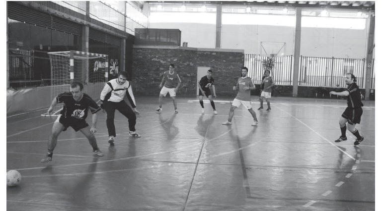
TSSTk eta Trumoik irekiko dute Txapeldunen fasea bihar, 9:15ean, kirol-gunean.

Iritsi da ordua. Liga erregularra bukatuta, gaur arratsaldean hasiko dira herriko areto-futbol txapelketako kanporaketak. Zehazki, kontsolaziokoak. Txapeldunen fasera sailkatu diren taldeen txanda bihar goizean izango da. Michelingo kirol-guneko kantxan jokatuko dira asteburuko partidak.