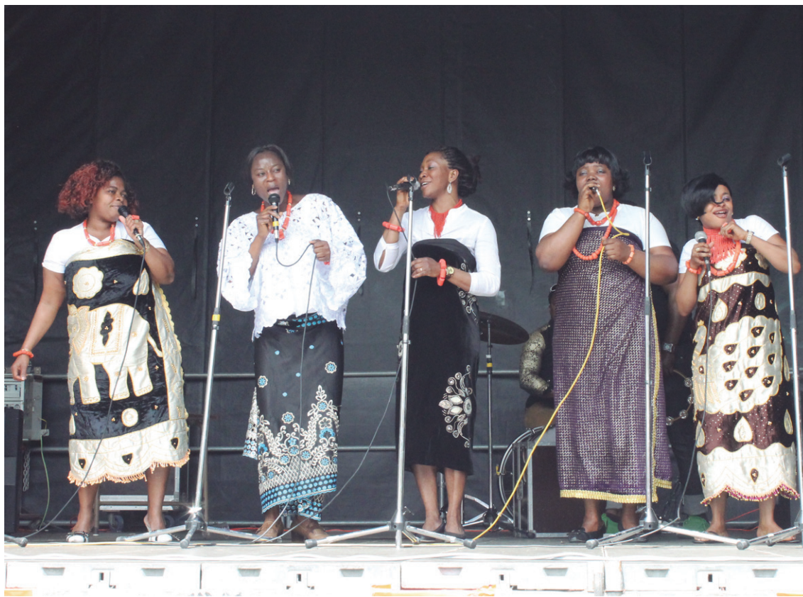
“Nigeria canta” taldea aurten ere taula gainean arituko da larunbat eguerdian.

18:30ean kultur aniztasun ibilbidea hasiko da. ‘Anitzen sarea’ osatzea du helburu eta herriko hainbat elkarte eta