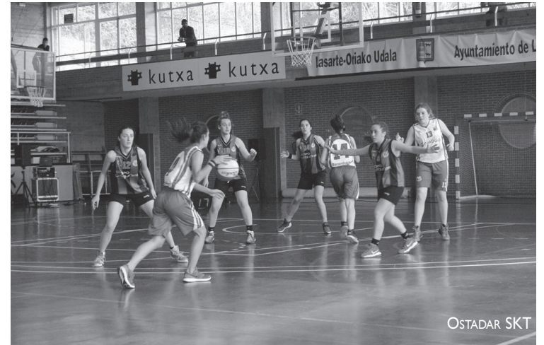
Ordiziari irabazita, Euskal Ligan segitzeko txartela poltsikoan dauka jada Ostadarrek.

Lanak garaiz egiten hasiak, askotan, saria dakar. Ostadarreko junior neskek lortu dute eurena, ligaxka amaitzeko jardunaldi baten faltan: 16/17 denboraldian Euskal Ligan ariko dira berriro ere. Ordiziari irabaztea eta Getxok galtzea ziren horretarako baldintzak. Biak beteta, errealitate bihurtu da ametsa.