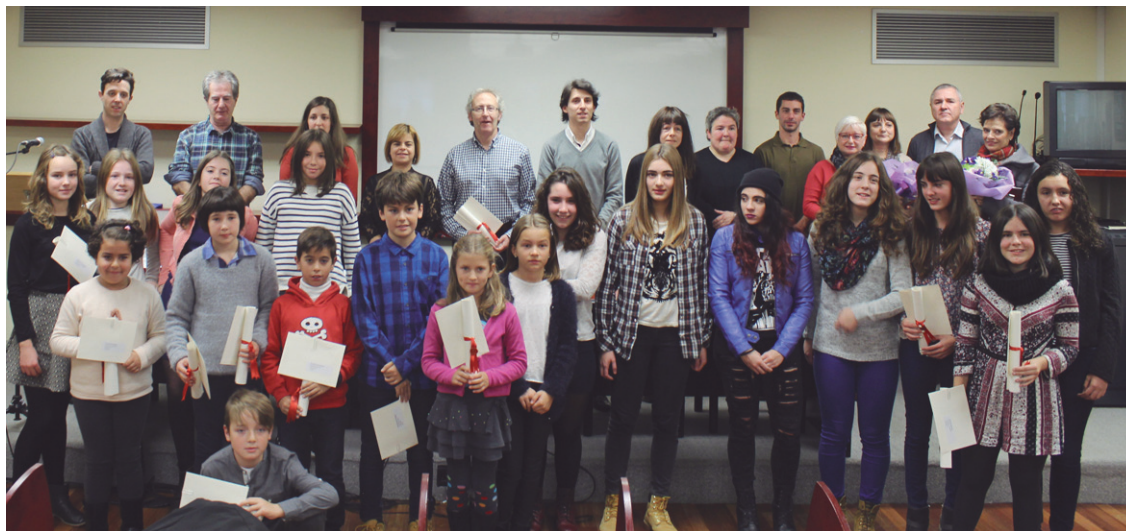
lazko edizioako saritu, antolatzaile eta udal ordezkariak argazkia atera zuten sari-banaketa ekitaldian.

Lasarte-Oriako idazle gazte eta helduak herriko lehiaketan aurkeztu ahal izango dira aurten ere. Maiatzaren 13ko 13:00ak bitartean Manuel Lekuona kultur etxeko bulegoetara eraman ahal izango dituzte euren idazlanak. Gaztetxoek euskarazko eta gaztelaniazko ipuinak idatziko dituzte, eta helduek, poesia eta mikrokontakizunak, bi hizkuntzatan.