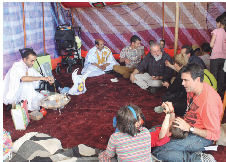
TEBAL elkarteak te dastaketa antolatuko du aurten berriro ere