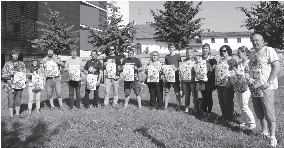
2015 urteko San Pedro Jaiak antolatzen lagundu zuten elkarteetako batzuk jaietako kartel iragarlea eskutan dutela.