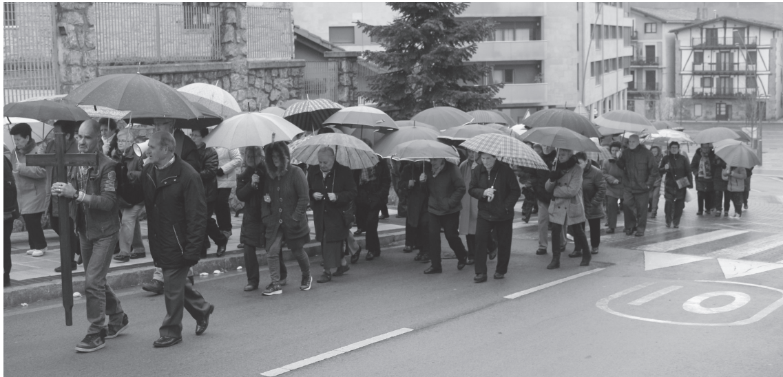
Ostiral goizean hainbat herritarrek irudikatu zuten Jesusen gurutze bidea. San Pedro elizatik Sausta pareko aldarera joan ziren.