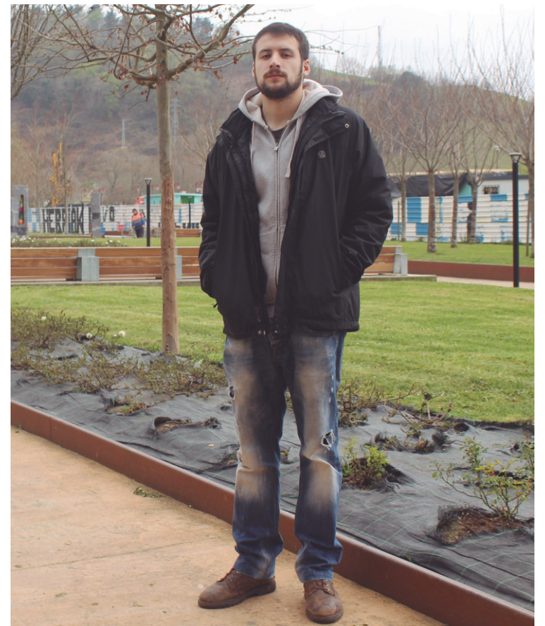
Musika bideoak egin ditu azkenaldian Zarzuelok.

Momentu honetan musika bideotan lanean murgilduta nago gehienbat. Izan ere, film laburra niregandik atera behar