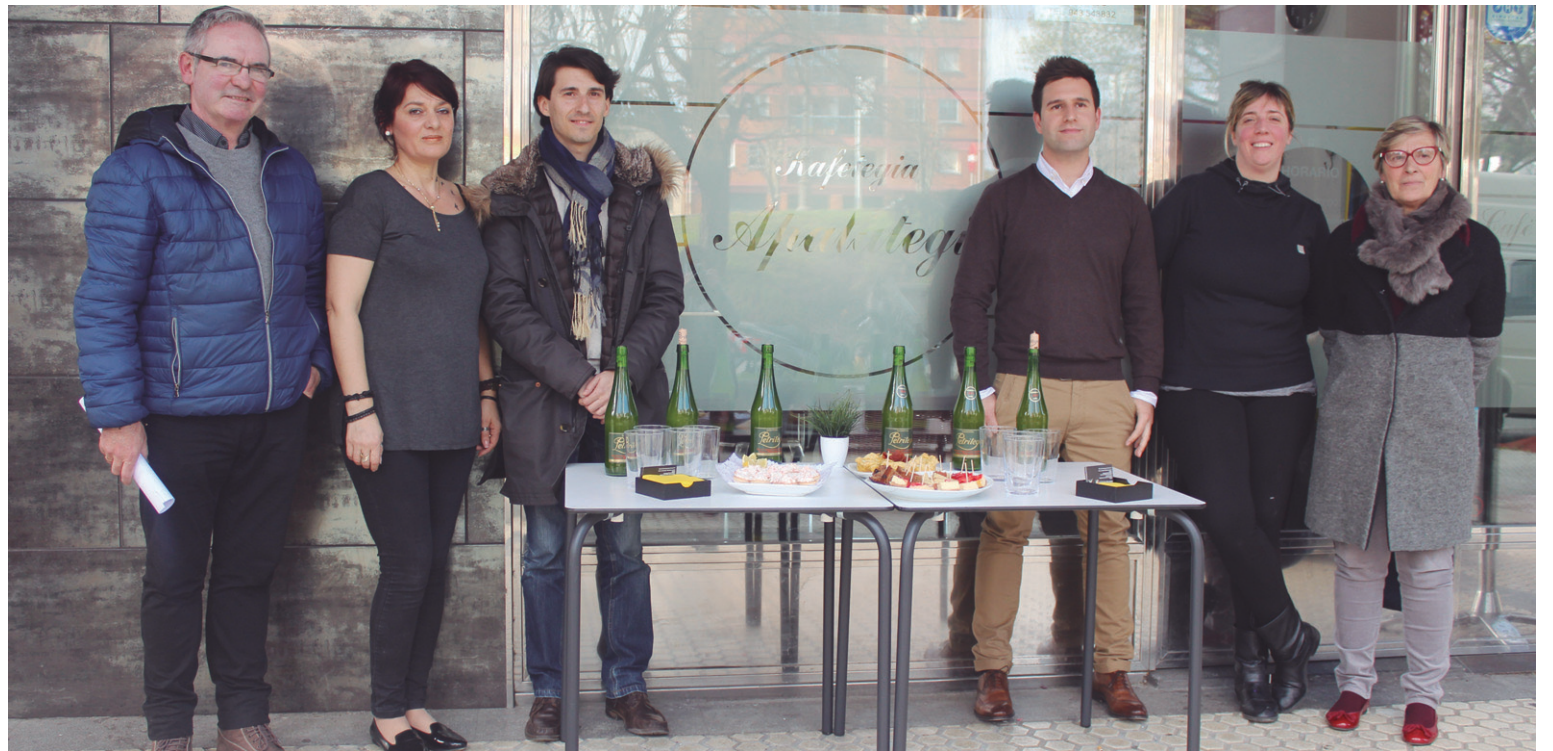
Ekimenaren antolatzaileak Apalategi kafetegian egindako aurkezpenean, sagardo eta pintxoekin batera.