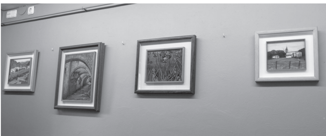
Egur zati margotuekin bolumenak eta perspektiba jokoak ikusi daitezke hainbat lanetan.

Loreto Otaegiren lanak Legongo dira ikusgai apirilean zehar Jalgi Kafe Antzokian.