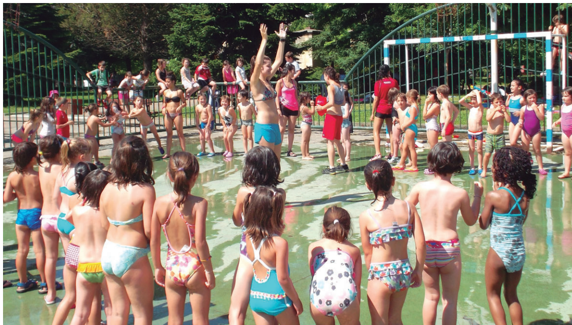
Ur jolasak eta haurren gozamenerako beste hamaika ekintza antolatuko dira Udako Txokoetan zehar.

Bestalde, Donemiliagan uztailearen 16ra arte egon ostean, uztailearen 18tik Udako Txokoetan parte hartzeko aukera ere izango dute LH5 eta LH6 mailakoek.