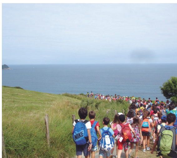
Udako Txokoetako haurrek irteerak ere egingo dituzte. Tailerrak, jokoak, ibilaldiak... denetarik izaten da.