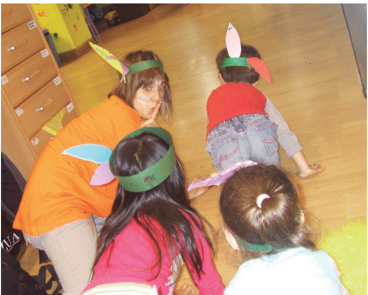
Tailerrak, jokoak, antzerkiak... denetarik egiten da Amaraun Ludotekan.