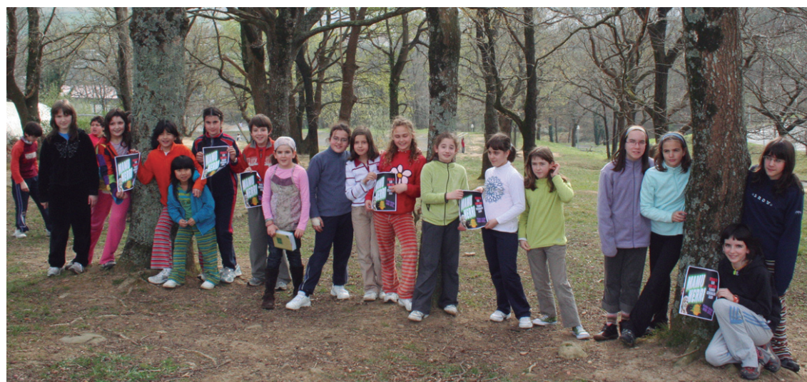
2008. urtean, Gazte Klubeko lagunek 'Mamu herri' filma grabatu zuten eta filmaren emanaldiaren aurkezpena ere egin zuten.