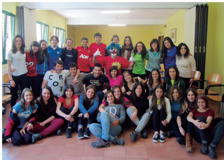
Haurretako asko hazi eta Udako Txoko begirale lanetan daude egun.

Antzerkiari dagokionean, Malas Compañías taldeak 'Letter; eskutiz baten bidaia' eskainiko du, 30ean, kultur etxean, 17:00etatik aurrera.