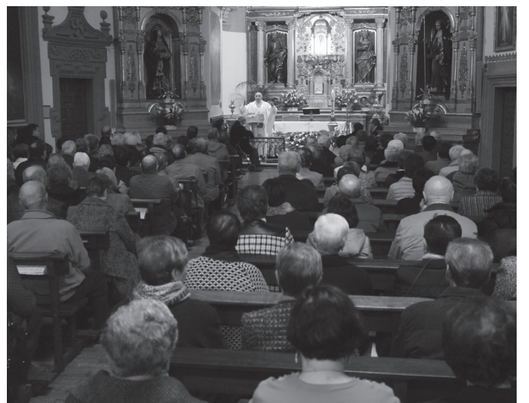
Pazko Igan-dean Jesusen berpizkundea gogoratu zuten Brigitarren komentuan.

Larunbatean Pazko Bijiliak egin zituzten herritarrek. Igan-dean amaitu zituzten ospakizunak elizbarrutiek: mezak egin zituzten hiruetan, goiz eta eguerdian zehar.