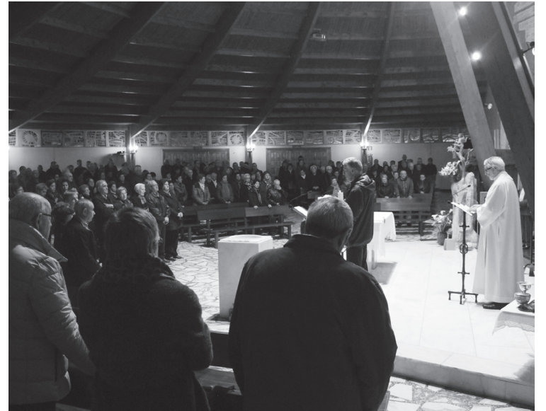
Herritar ugari bertaratu ziren Arantzazuko Ama parrokiara Ostegun Santuan.