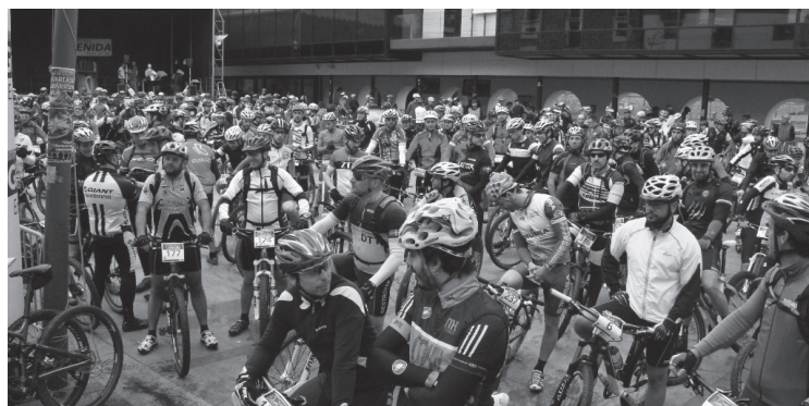
Okendo plazatik ekingo diote probari txirrindulariek, 9:30ean.

Okendo plazatik aterako dira txirrindulariak, igandean, 9:30ean. Neutralizatua izango dira aurreneko sei kilometroak, Txokoalderaino. Andatza mendian barrena egingo dituzte kilometro gehienak. Gune teknikoak egongo dira ibilbidean zehar: bi pinu arteko eta zirkuitu zirkular bat, bi