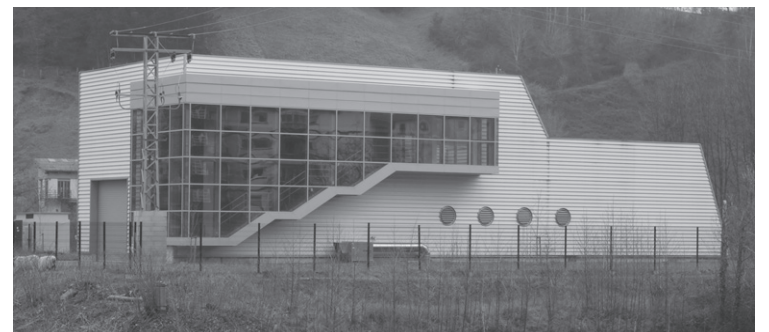
Oria ibai ondoko ponpaketa estazioa; saneamendu lanetako pieza garrantzitsua.

Bi puntu nabarmendu ditu adierazpenak. Lehenik "Euskal Herria bere etorkizuna erabakitze eskubidea duen herria dela", eta bestetik, "euskal herritarrogi dagokigula erabakia hartzea". 2017an erabakitze eskubidearen aldeko herri kontsulta egiteko asmoa dute. Herritar guztiak gonbidatu dituzte Loidibarrenen egingo duten talde argazkira.