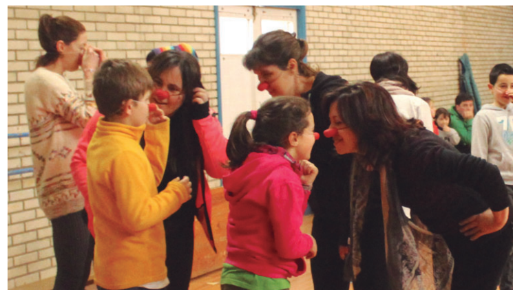
Goizean, antzerki tailerra izan zen eta ederki pasa zuten haur, zein helduek.