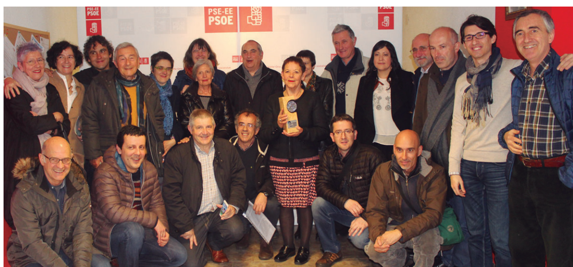
Gesto por la Paz elkarteko kideak izan dira aurtengo saria jasotzen, baina familiari bueltatu zioten omenaldia maitasun handiz,