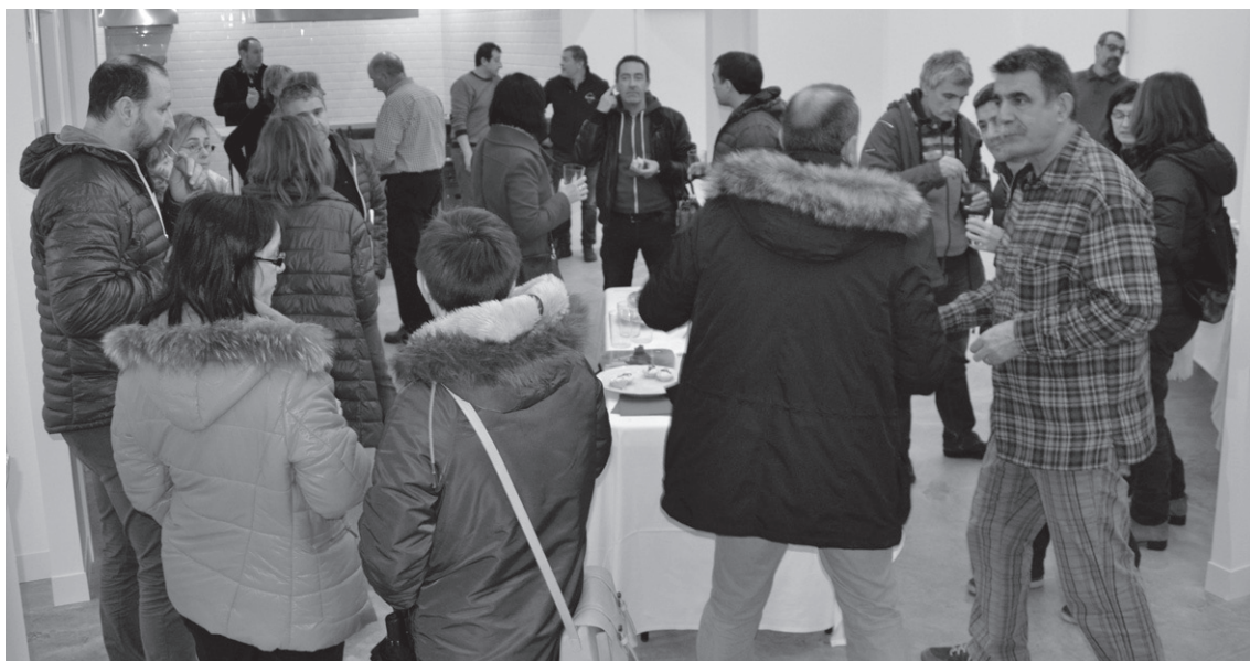
Lokala barrutik ikusteko aukera izan zuten bertaratutako bazkideek.

Ttakun kultur elkarteak Iñigo de Loyolan duen lokalerako asmoak azaldu zituen bertaratutako 40 bazkide ingururen aurrean. Hiru helburu nagusi identifikatu zituzten lokalari begira. "Euskaldunentzako amasgune" izan nahi du, hasteko. Hau da, Ttakuneko bazkide eta herriko euskaltzaleentzako txokoa.