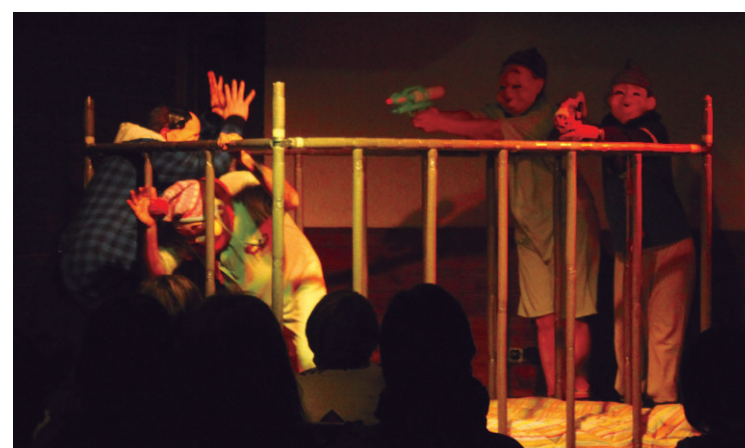
Kukuka Antzerki eta Dantza eskolako taldeak eman zion hasiera antzerki maratoniari.