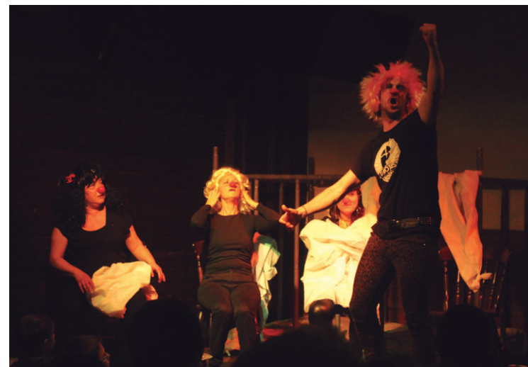
Katramila taldeak eroetxeko lau lagunen istorioa eraman zuten Abend-era.