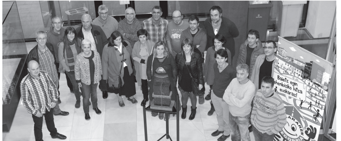
Bilera hasi baino lehen, urteurrena ospatzen duten talde eta bestelako eragileek argazkia atera zuten Maratoiko ikurrarekin.

Batzuk dagoeneko ospakizunekin hasiak dira. Xumela