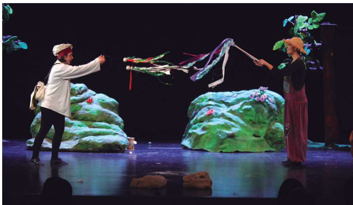
Naturaren legeak, elkar banatzea... balore ezberdinak ikasi ahal izan zituzten haurrek 'Kondaira baten truke' antzerkiari esker.