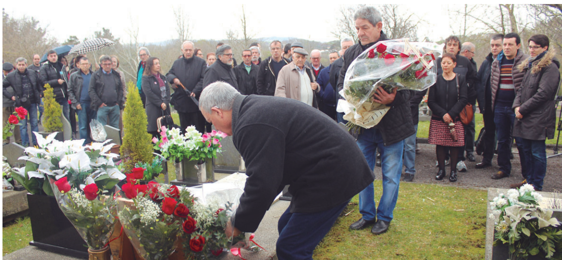
Gipuzkoako eta Lasarte-Oriako PSE-EEko kideek lore sorta bana jarri zuten hilobian,

Honetaz gain, Lasarte-Orian PSE-EEK berriro ere alkatetza lortu izana Elesperi poza emango ziola adierazi zuen.