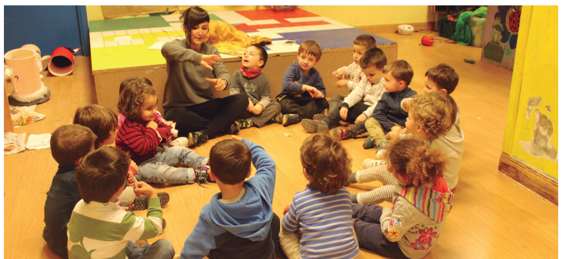
Ipuinaren ostean, joko eta eskulanen bitartez gaia lantzen dute Amaraun klubeko lagunek.

Tailer hau martxoaren 8rako zegoen aurreikusia,