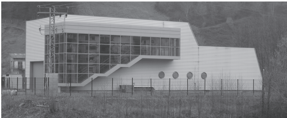
Lasarte-Oria eta Zubieta artean kokatutako ponpaketa estazioa.