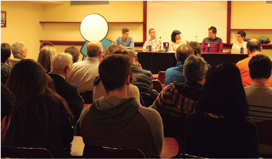
Herritar ugari hurbildu zen Manuel Lekuonako hitzaldi aretora kirolarien iritzia ezagutzeko.