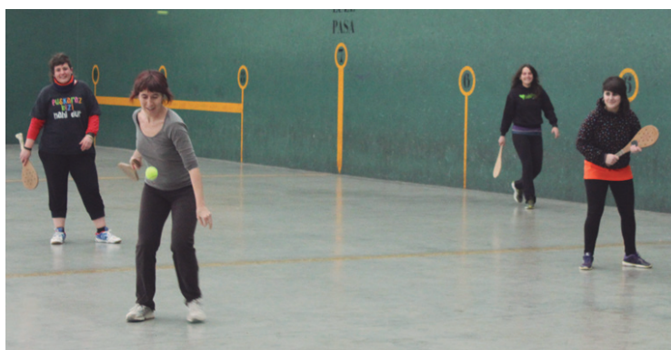
Hitzaldi eta kirol ekitaldiak egin zituzten ostiralean.