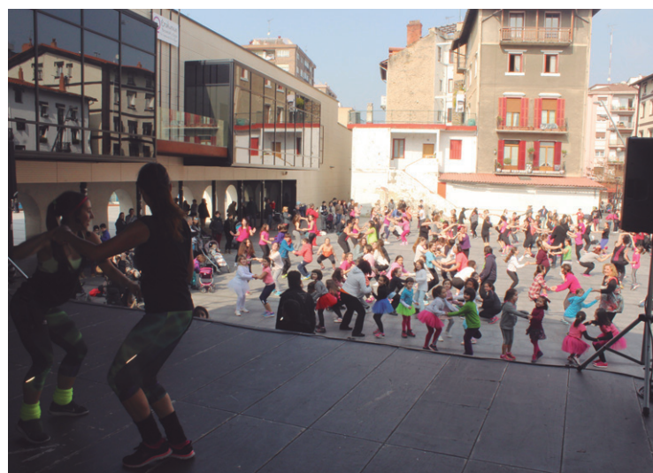
Zunba maratokiak astindu zuen igande goiza.