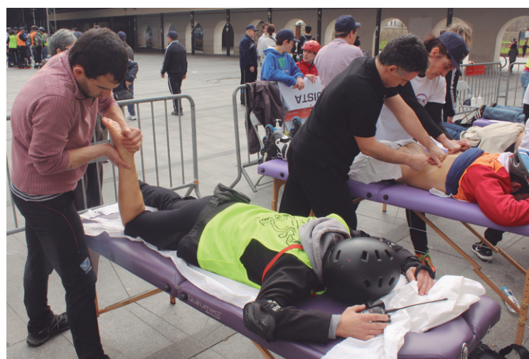
Bost kilometro ibili ostean masajea jasotzeko aukera izan zuten.