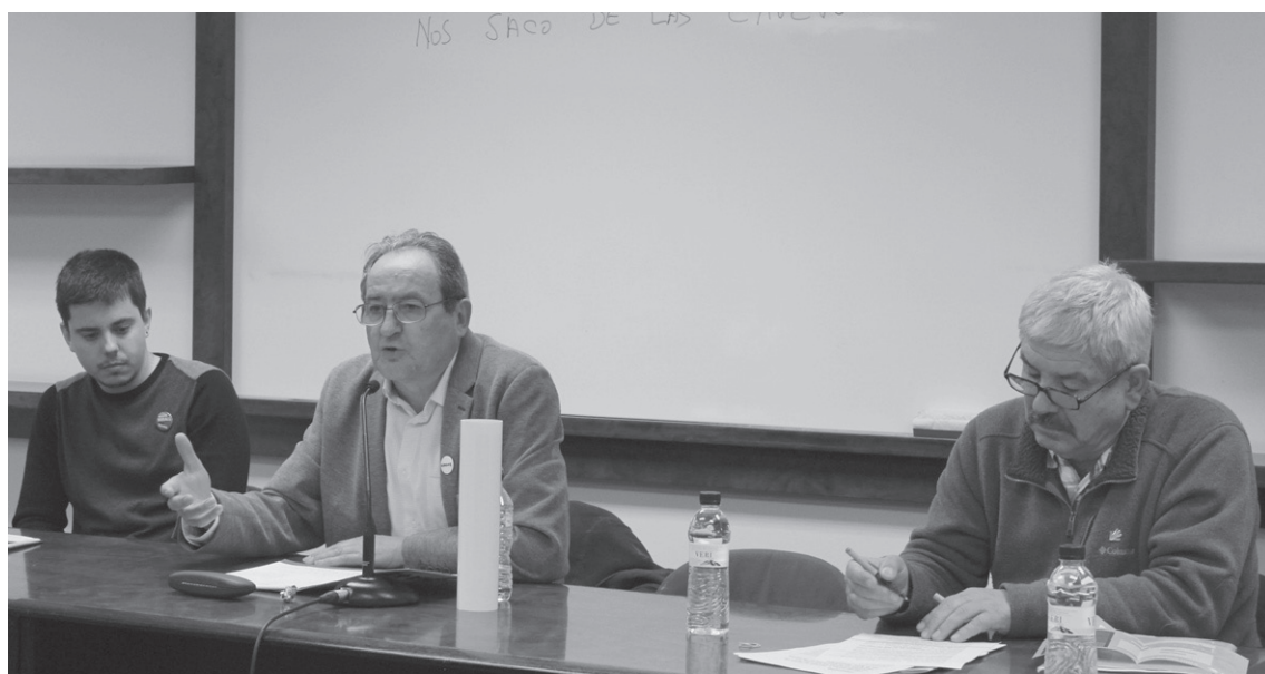
Kataluniako prozesuaren aldeko etorkinek osatzen dute Sumate elkartea.

G ure Esku Dagok 2016an antolatutako lehenengo Topagunea egin zuten ostiral arratsaldean.