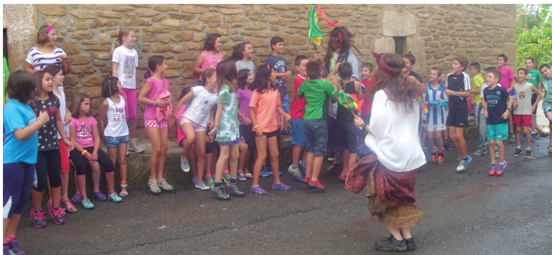
LH3 eta 6 arteko gazteei zuzenduta, natura, kirola eta dibertsioa nahasten dituzten egitarauak izango dira Albeniz eta Donemiliagan.

Zaharrenek DBH3 eta 4 mailakoek Iparraldera egingo dute Mugarik Gabeko kanpal-