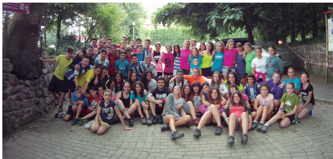
Kanpaldi ibiltarietan Euskal Herria beste era batera ezagutzeko aukera dute parte hartzen duten gazteek.

Aterpetxea edo kanpaldi ibiltaria guztiek primeran izango dituzte oporraldiak.