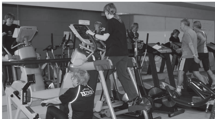
Kiroldegiko kardio gela, artxiboko irudi batean.

Materiala era apropos batean erabiltzen irakasteaz gain, erabiltzaileek hala eskatzen badute, entrenamendu-plan pertsonalizatuak ere prestatzen ditu irakasleak, norberaren beharren arabera. Zerbitzu horri