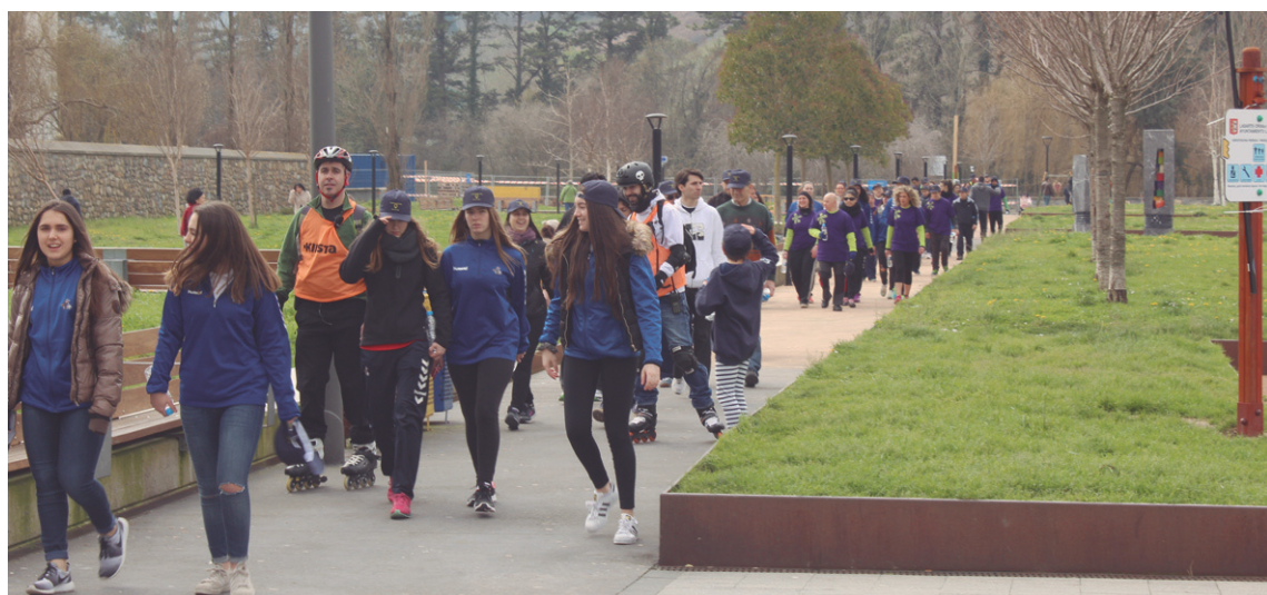
Okendon hasi eta bukatu zen berdintasunaren aldeko martxa.