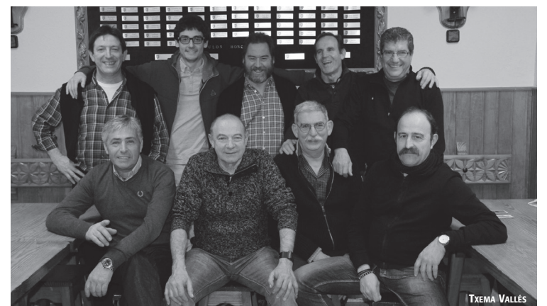
Ostadar SKTko zikloturistak, iazko denboraldi hasierako afarian.

Urriaren 30ean egingo duten irteerarekin itxiko dute zikloturistek aurtengo denboraldia. Lizartzara joango dira orduko horretan, 54 kilometroko bidea eginez. Martxotik urrira bitartean egingo dituzte irteera guztiak, beraz; abuztuaren oporrak hartuko dituzte. 30 hitzordu finkatu dituzte denera: maiatza, uztailea eta urriaren bosna irteera egingo dituzte; launa martxoan, apirilean eta irailan, eta hiru ekainean.