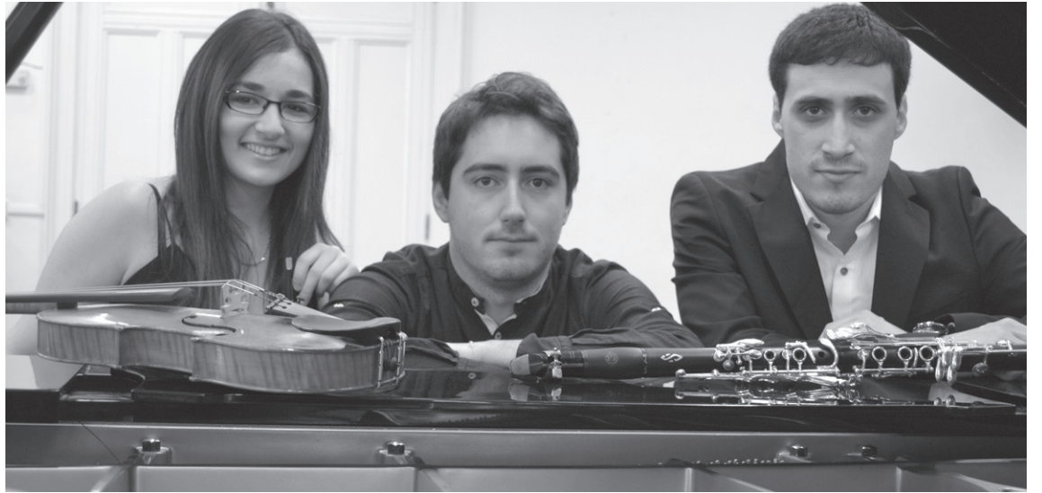
Biolinak, klarineteak eta pianoak osatutako hirukotea da Verushka.

Aram Khathaturiam eta Igor Stravinsky musikarien lanak