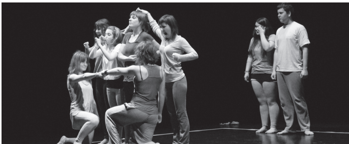
Goizetik gauera arteko ekintzak antolatu dituzte Kukuka antzerki eta dantza eskolako lagunek.