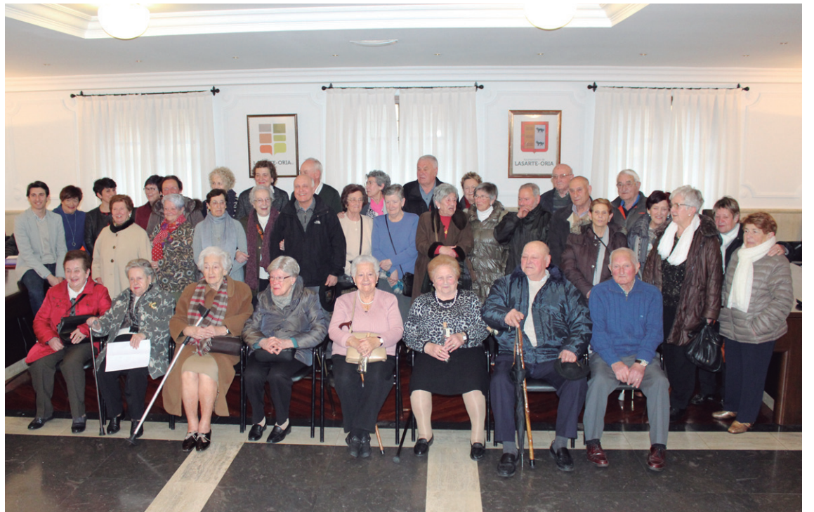
Islada Ezkutatuakek ikerketan daramatzen bost urteetan zehar testigantzak eman dituzten herritarrek argazkia atera zuten atzo.

Horren ostean, mokadutxo bat jan zuten denek, alboko aretoan: patata-tortilla, kroketak, etab. Ekitaldia ez zen hor bukatu, ordea: hainbat argazki zeuden eskegita areto horretako hormetan, eta boligrafoak mahaian. Islada Ezkutatuakeko kideek lanean jarri zituzten herritarrek, irudi-tako hainbat pertsona identifikatu nahian. Hainbat urtez ezkutuan eta isilean egon ondotik, memoria eraikitzeke ordua da orain. Ez dago galtzeko denborarik.