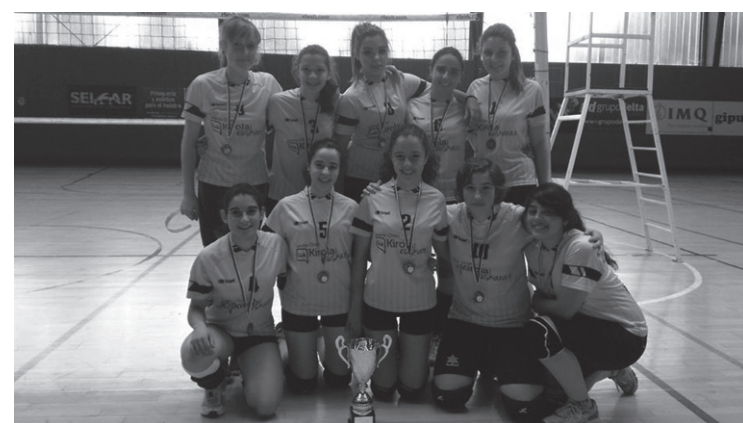
Lauko finalerako sailkatzea du helburu Lasarte-Usurbil BHIk.

Bigarren fase horretako aurreneko lau taldeek lau finala jokatuko lukete. Taldeko kideek adierazi dutenez, "zaila" izango da hori, baina ez dute etsiko, inondik ere. Aurrekariak ezin hobekak dira: Gipuzkoako hirugarrenak izan ziren pasaden denboraldian, eta azpitxapeladunak 13/14 sasoian. Jubenil mailan lehiatzen dira.