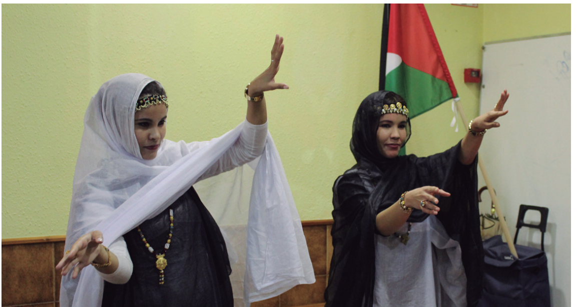
Fatu eta Mailima Abahai sahararrek bertako dantza tradizional bat eskaini zuten.

zituzten familien zenbakiak, eta denbora dexentez itxaron behar izan zuten, haraino eramane zituen txoferrarekin. "Goizeko bostak aldera iritsi ginen familiarengana", gogoratu zuen.