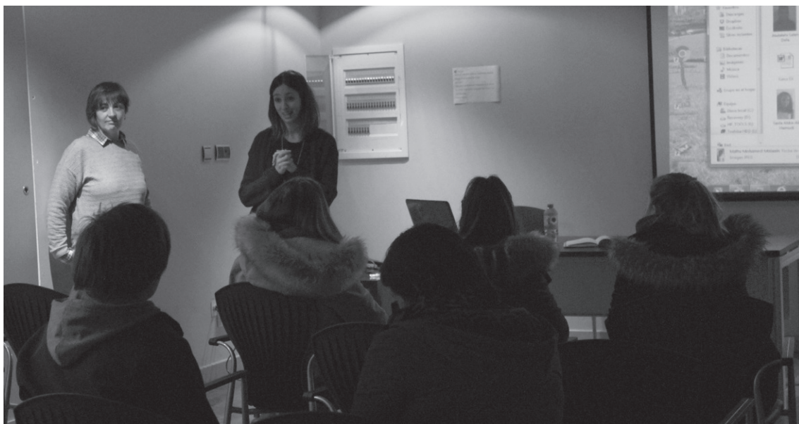
'Oporrak bakean' egitasmoan parte hartzen duten harrera familiek programaren berri eman zuten ostegunean.

Ostegunean 'Oporrak Bakean' ekimeneko harrera familiek udan saharar haurren bat hartu nahi dituzten herritarrekin bildu eta programaren berri eman zieten.