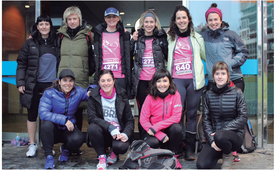
Goizean goizetik, trenez joan ziren Donostiarantz hainbat herriko korrikalari.

Lasterkarietako animoak ematera joandakoen kopuru ofi-