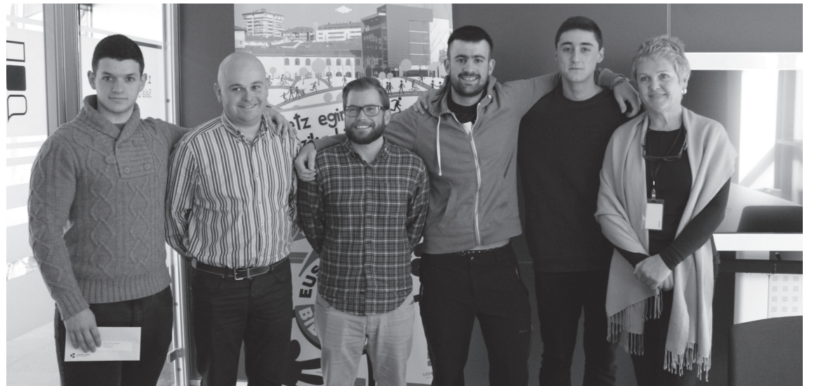
Lasarte-Oriako autoeskoletako hiru ikasle jaso dituzte aurten sariak, gidabaimenaren atal teorikoa euskaraz ateratzeagatik.

2010ean sortu zuten egitasmoa euskara zerbitzuek. 34 ikasle atera zuten urte horretan gidabaimenaren atal