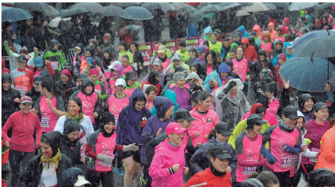
Eguraldi baldintza kaskarrak ez ziren oztopo izan atzoko Lilatoian lasterka egin zuten 5.000 emakumeentzat.

Lasarteko Talde feministak eta ‘Palan Prest’ emakume taldeak erreibindikazioa eta kirola uztartzen dituen jardura bat prestatu dute ostiralerako: emakumezkoen pala txapelketa. Zehaztu dutenez, Loidibarraren frontoian elkartuko dira, 18:00etan. Bikoteak zozketa bidez egingo dituzte. Pilota astintzen aritu ostean, emakumeen afaria egingo dute, Xirimirin, 21:00etan. Hamar euro balio dute txartelek; ohiko tabernetan egongo dira salgai.