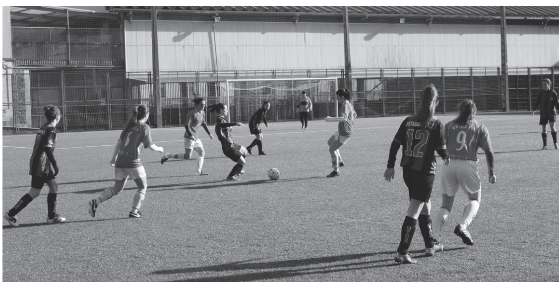
Partidu borrokatua izan zen Ostadar eta Urnietaren artekoa. Etxekoentzat izan ziren hiru puntuak.

Norgehiagoka berriro ere orerkatzeko asmoz atera ziren urnietarrak Michelingo zelaira, eta haiek izan ziren nagusi aurreneko 15-20 minutuetan. Dena den, kanpoko taldeak ezin izan zuten berdinketaren