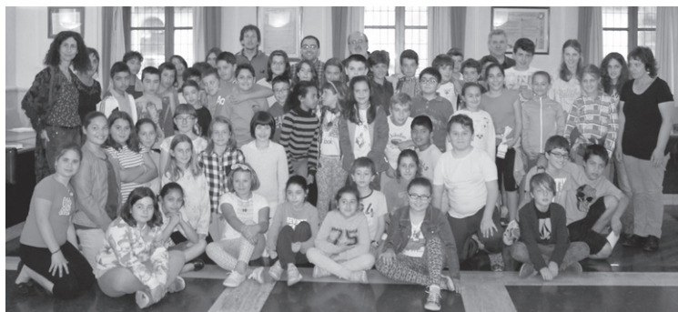
2015ean Udaltzarrekin entzunaldia egin zuten herriko ikastetxeetako ikasleak.

Azken urteetan egin duten bezala, Udaltzarrean aurrean aurkezteko aukera