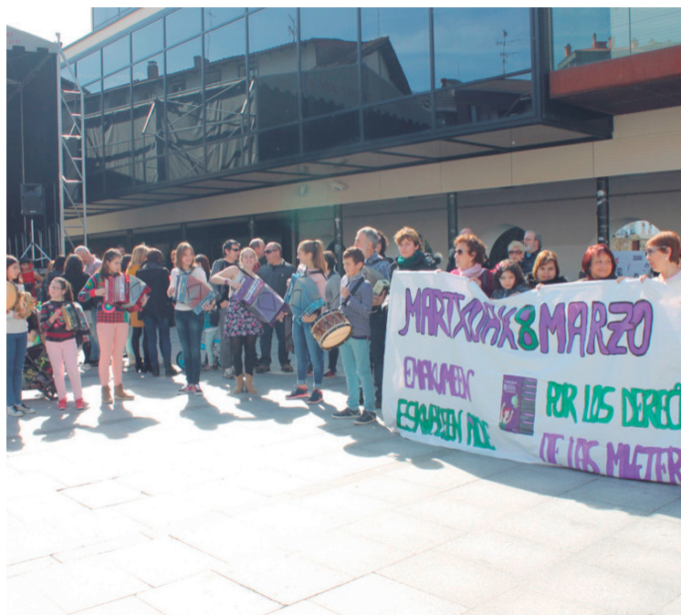
Lehenengo urteko martxoaren 8an Okendo plazan egin zuten elkarretaratzeari Emakumearen Nazioarteko Eguna ospatzeko. Lasarte-ko Talde Feministak egitarau berezia antolatu du.

Ondoren, 21:00etatik aurrera, afaria egingo dute elkarte-ko bertan. Indarra hartu ostean dantzari ere tartea utzi-ko diote.