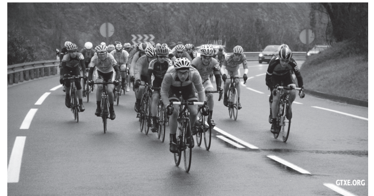
Pasa den asteburuan hasi zen errepideko denboraldia.

Kadete mailakoek Donostian hasi zuten errepideko denboraldia: Ibaeta saria jokatu