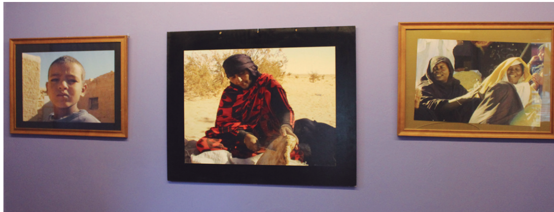
Tindoufeko kanpamentuetako egoera islatzen duten irudiak ikusgai daude dagoeneko Jalgi Kafe-antzikian.

Mujikaren familiak urte asko daramatza harrera familia gisa saharako haurrak hartzen. Hori dela eta, abenduan kanpamentuetara egin zuen bisita azalduko du.