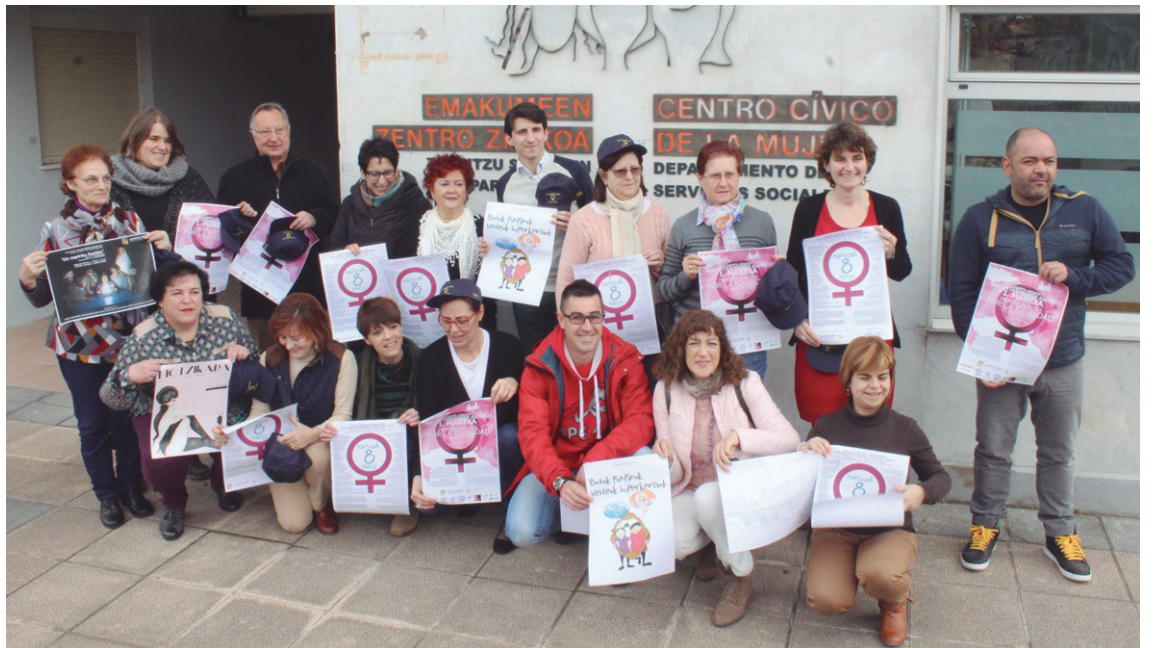
Hainbat eragileren artean prestatu dute Emakumearen Nazioarteko eguna ospatzeko egitaraua.

Sarrerak hiru euroko kostua izango du, eta antzerki taldearentzat izango da bildutako