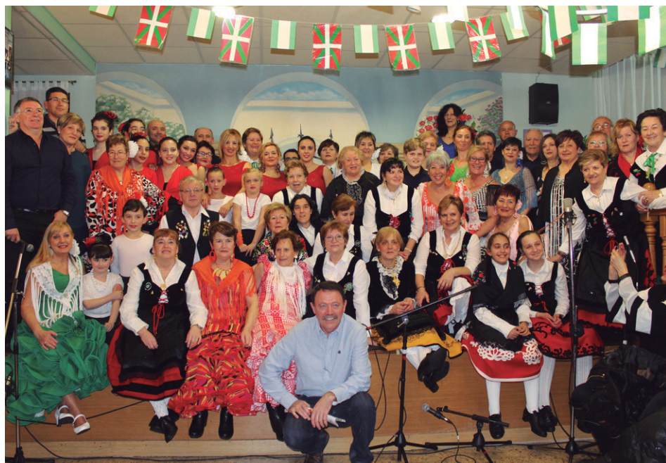
Larunbat arratsaldean parte hartu zuten taldeek talde argazkia atera zuten.