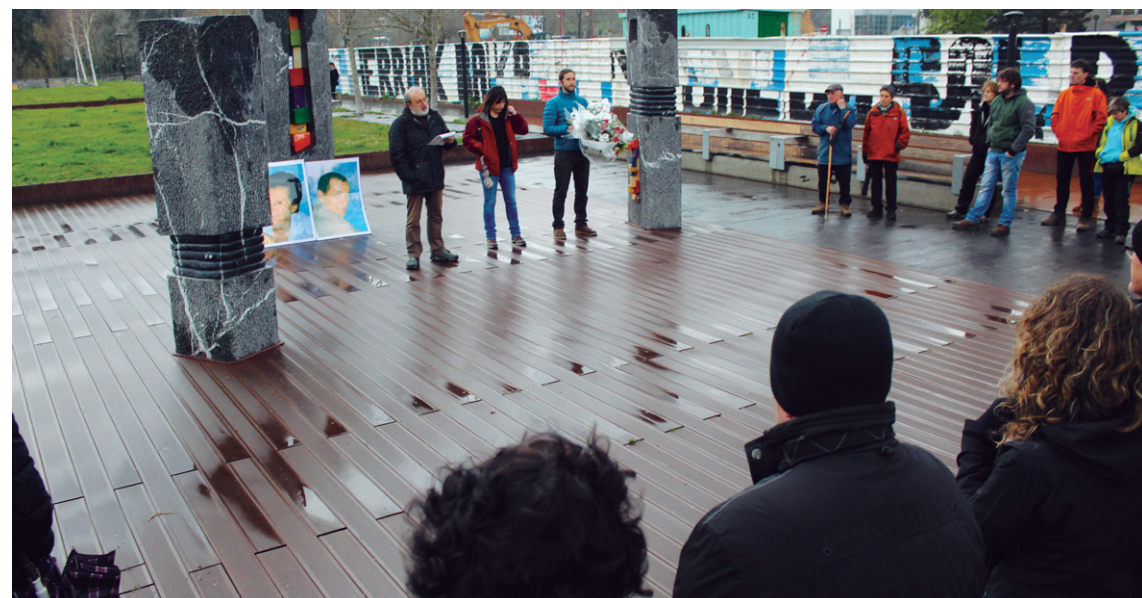
Hainbat herritarrek EHBilduk Argi eta Iñakiri egindako omenaldi xumearekin bat egin zuten.