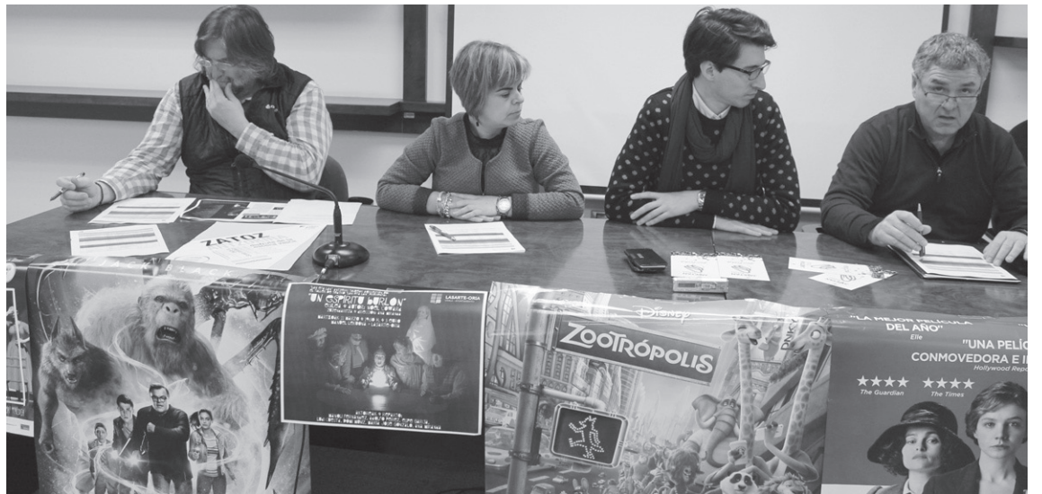
Udal ordezkariak eta kultura teknikariak martxoko egitaraua aurkezten.

Bestalde Kukukak 18an antzerki topaketak antolatu