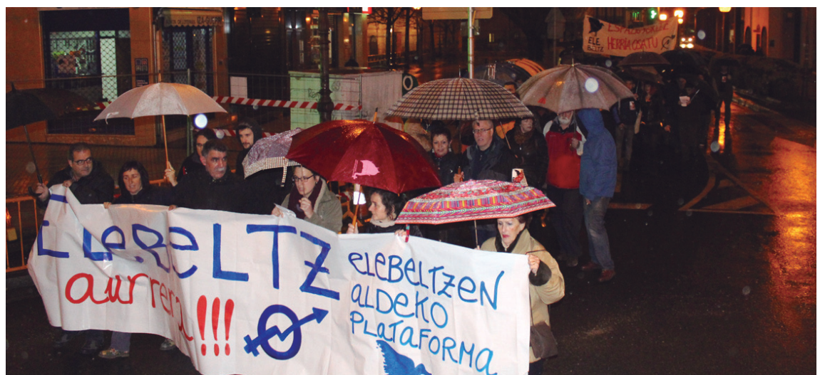
Elebeltzen aldeko plataformak eta hainbat herritarrak manifestazioa egin zuten Topagunearen alde.

Honetaz gain, Alkateak Madrid Arenarekin alderatu zuen Elebeltz. Topagunea irabazi asmorik gabeko proiektua dela azpimarratu eta kritikotasuna bultzatu eta "kultura negoziario baina, oxigeno gisa planteatzen" duela