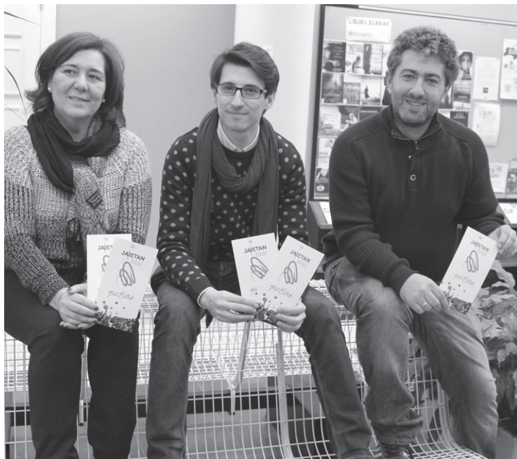
Jaietako teknikariak eta Udal ordezkariak aurkeztu zituzten neurriak.

Martxoaren 10a baino lehen herrian zehar dauden Udalaren postontzietan sartu beharko dituzte eskuorriak.