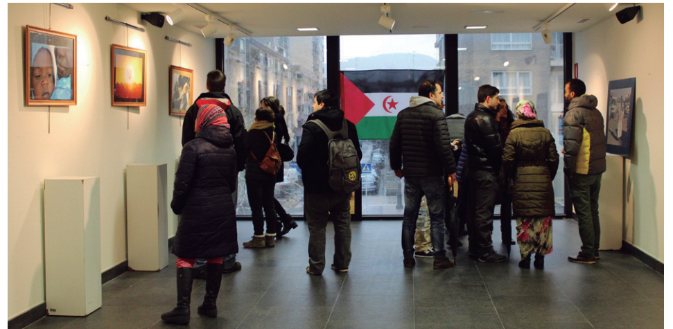
Antonio Mercero aretoan kanpamentuetako argazki erakusketa izan zen ikusgai.