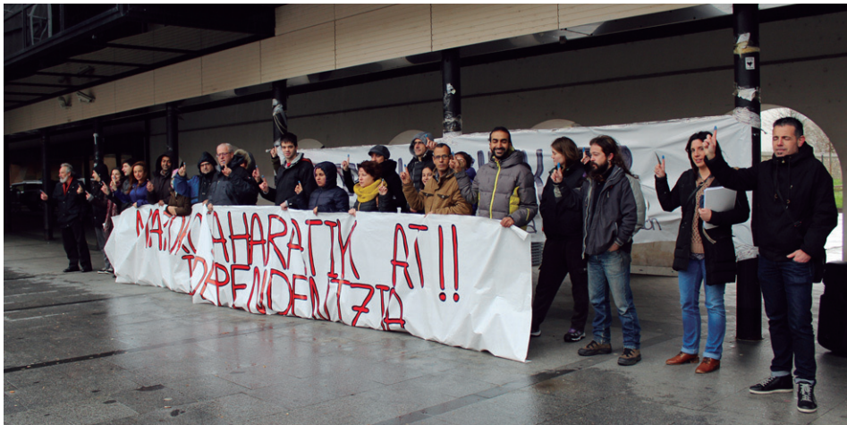
Larunbata eguerdian Saharako Lagunak taldeko kideak, herritarrak eta udal ordezkariak elkarretaratzean.