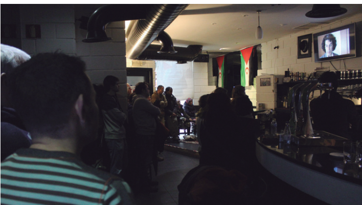
Elurtzan Saharari buruzko dokumentalak eta teaz gozatu zuten herritarrak.