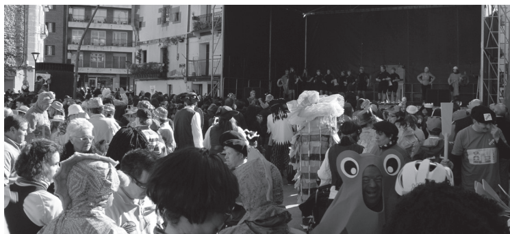
Aurten itsaso izan da protagonista gure herriko kaleetan.

Honetaz gain, Udalak azpimarratu duenez porposamenen artean gai bat modu harrigarrian gailendu da, "lanbideak" gaia. Honek 250 lagun baino gehiagoren babesa izan du.