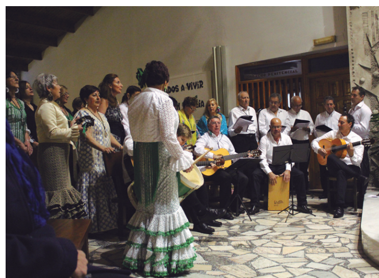
Semblante Rociero taldeak meza rozieroa eskaini zuen atzo goizean.

Hau amaitzean, 21:30ak aldera, ospakizunei amaiera eman zizkieten.