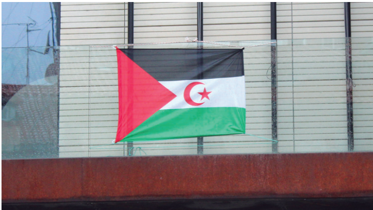
Saharar Errepublika Arabiar Demokratikoaren bandera Udaletxeko balkoian.