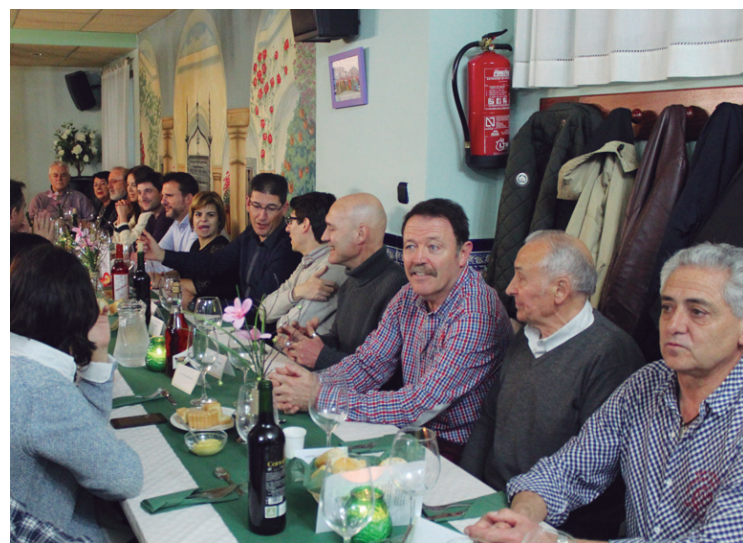
Udal ordezkari eta talde gonbidatuetako mahaiaren giro ona izan zen.