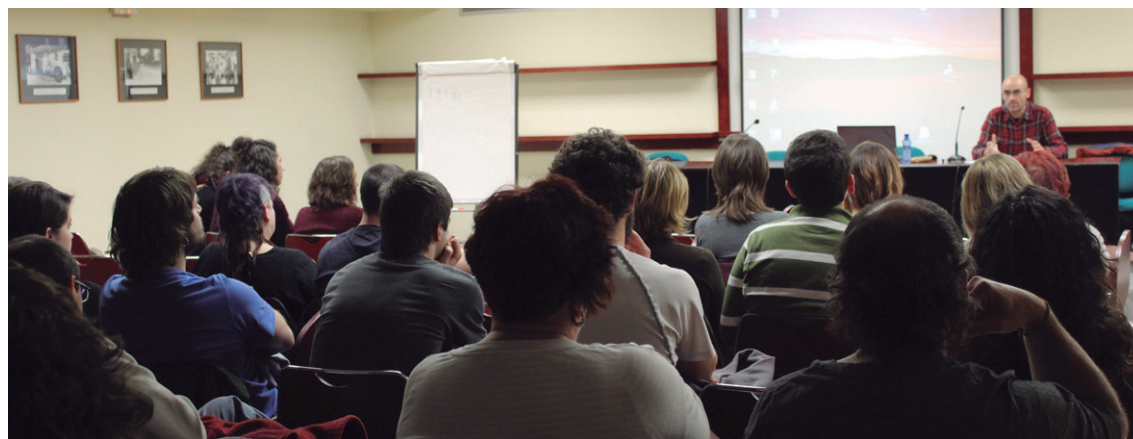
Luisi Uhartek Kubako egoerari buruzko hausnarketa egin zuen iaz irlan egin zuen ikerketa batean oinarrituta.

Uhartek azaldu zuenez, 2010 eta 2012 urte artean eztabaida bat ireki zen eta eredu aldatzeko neurri batzuk ezarri ziren. Hainbat