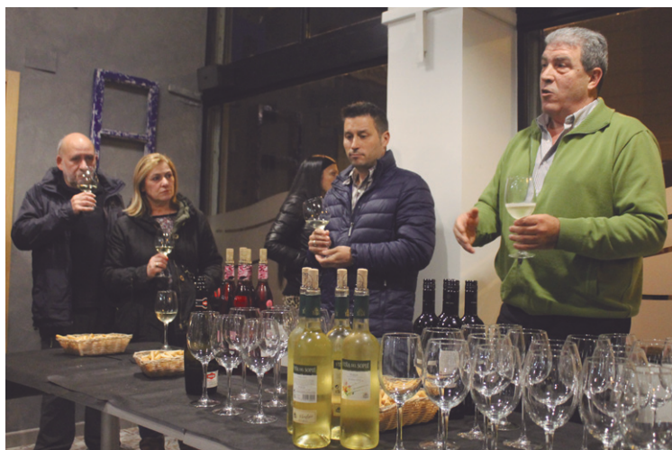
Buenetxean Leringo Alconde upeltegikoek eman zituzten azalpenak; Arkupen, berriz, Oliteko Marco Real-ekoek.