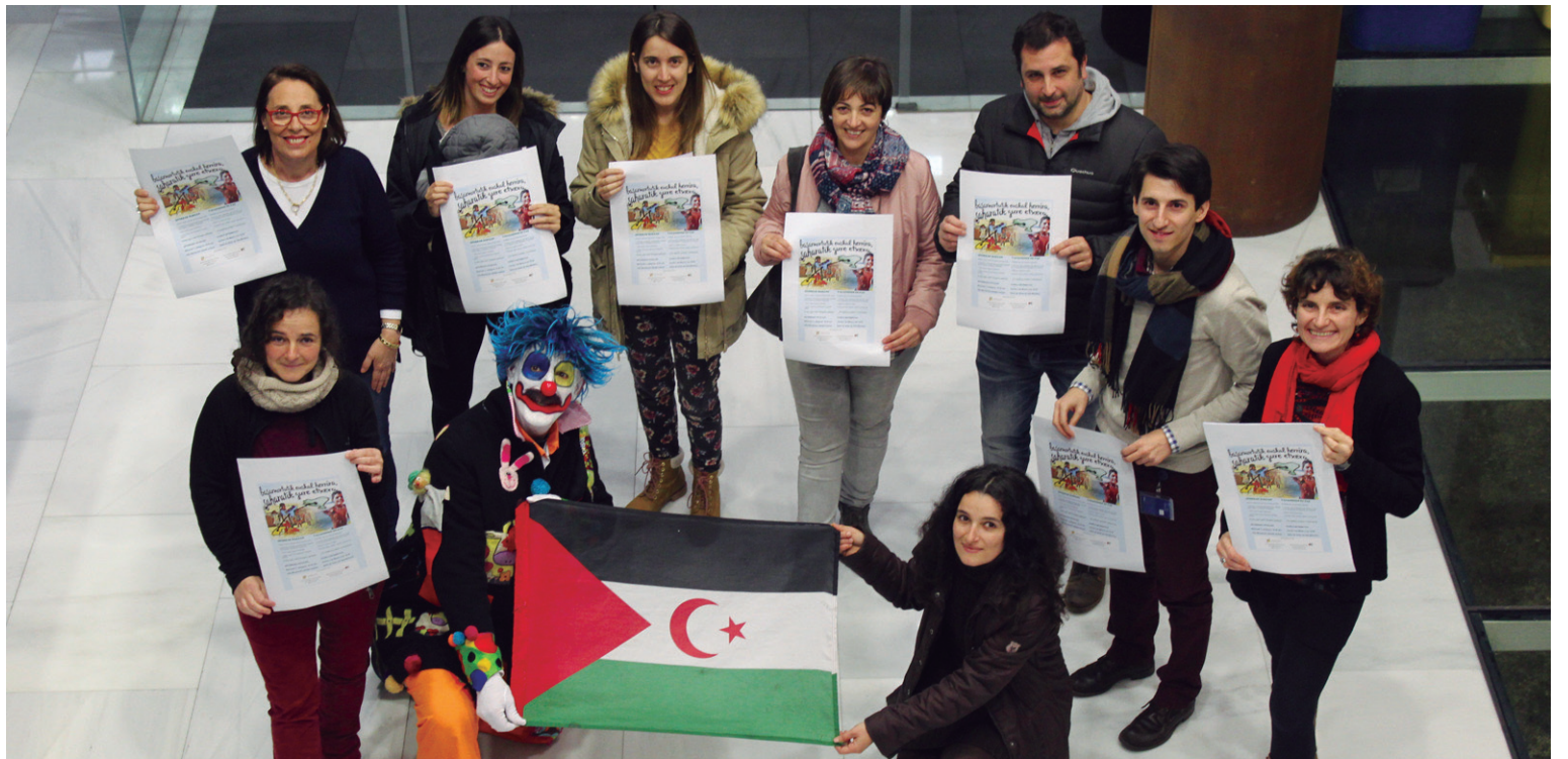
Lasarte-Oriako Saharako lagunak taldeko kideak, harrera familiak, udal ordezkariak eta lagun bereziak izan ziren Oporrak bakean egitasmoaren aurkezpenean.

Lasarte-Oriako Udalak herriko merkatariei nagusiek atsedean hartu dezaten ahulkiak jarri ditzaten gonbidatu die. Proposamen honekin bat egin duen lehena Balerdi harategia izan da. Zerbitzua eskaintzen duela jakina arzteko pegatina batzuk ezariko ditu dendan. Ekimena Tratu on bat markaren baitakoa da eta herriko merkataritza zerbitzua hobetzeko pauso berri bat da.