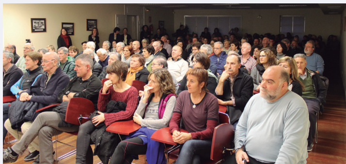
Kultur etxeko hitzaldi aretoa lepo egon zen asteazken arratsaldeko ekitaldian.

Eskualdeko hainbat herritako errausketaren kontrako mugimenduek ere egingo dute martxa. Hortaz, edonondik abiatzen direla ere, eguerdiko hamabiak aldera iritsiko dira denak Letabidera. ‘Burua duenak ez du errauste plantarik nahi bere herrian, eta bihotza duenak ez du beste inoren