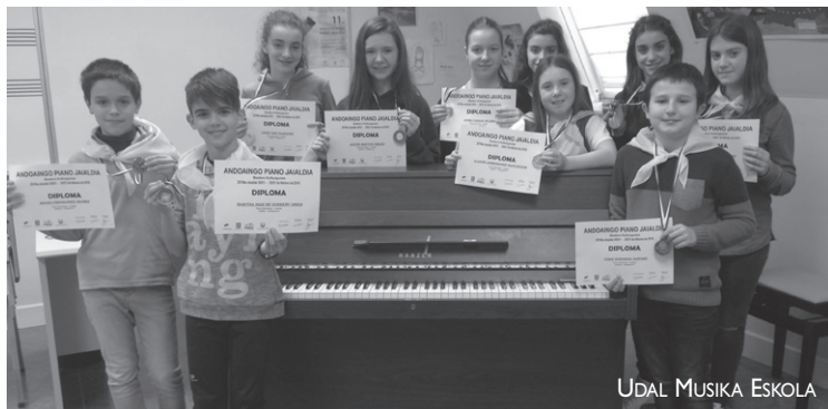
10 gaztetxo lasarteoriatarrek hartu zuten parte Andoaingo piano jaialdian.