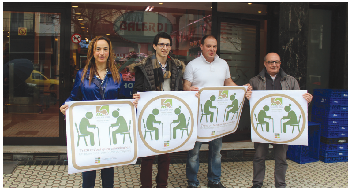
Balderdi harategia izan da egitasmoarekin bat egin duen lehen saltokia.

Hurrengo egunetan Lasarte-Oriako merkataritza gune guztiei luzatuko zaie proiektuan parte hartzeko gonbidapena.