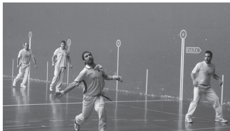
Finalerdietan Hernani eta Antiguaren arteko garailearen aurka arituko dira.

kanpo lortu beharko dute finalerako txartela. Izan ere, zozketan hala egokitu da.