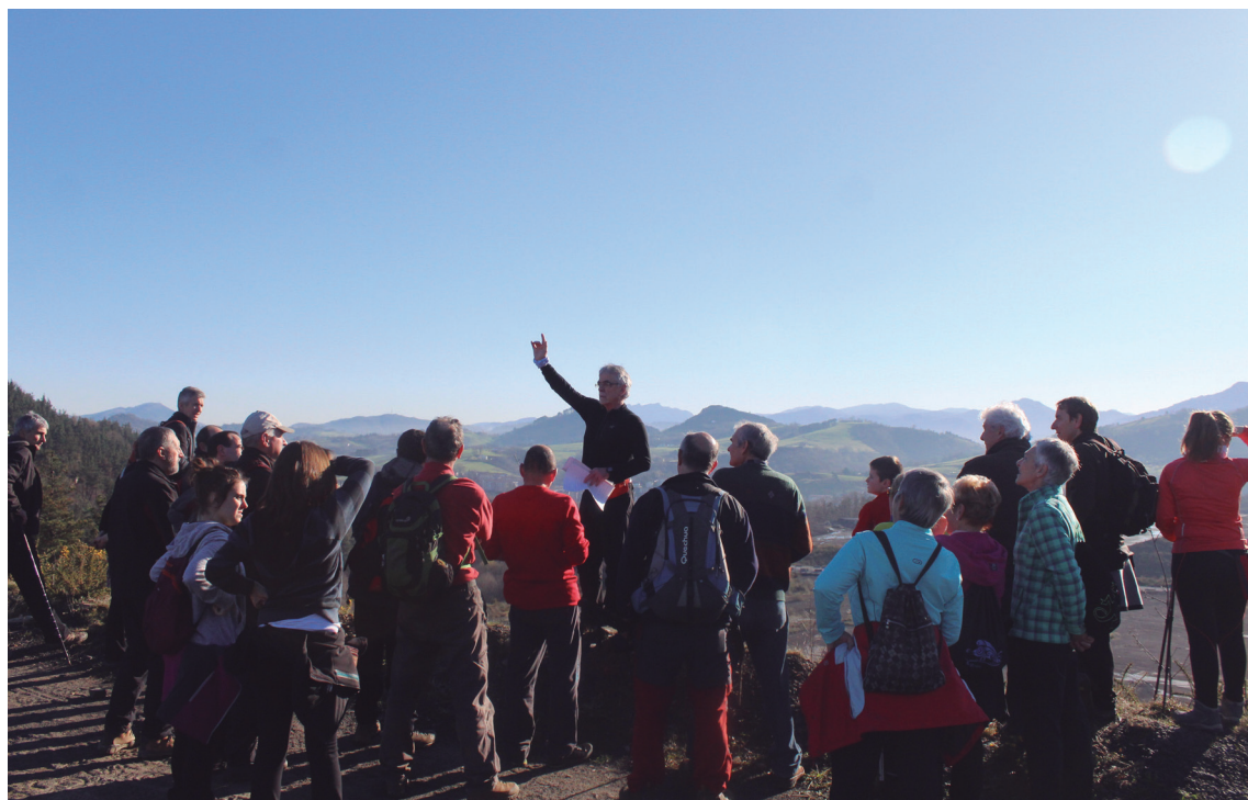
Basotxotik inguruko mendietan Gerraren garapena azaldu zuen Muguruzak.

2015ean lagundu duten kideek oroigarri bana jasoko dute.