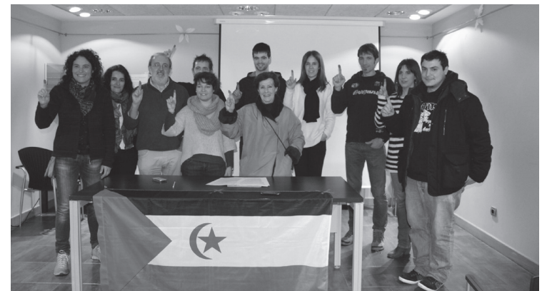
Otsailaren 11ko agerraldian iragarri zituzten aste honetarako ekintzak.

Suitzako talde batek bul-tzatuta, firmak bilduko dituzte, 2017. urtea amaitu aurretik galdeketa egitea posible izan dadin. Egitasmoari babes simbolikoa emate aldera, hatzak