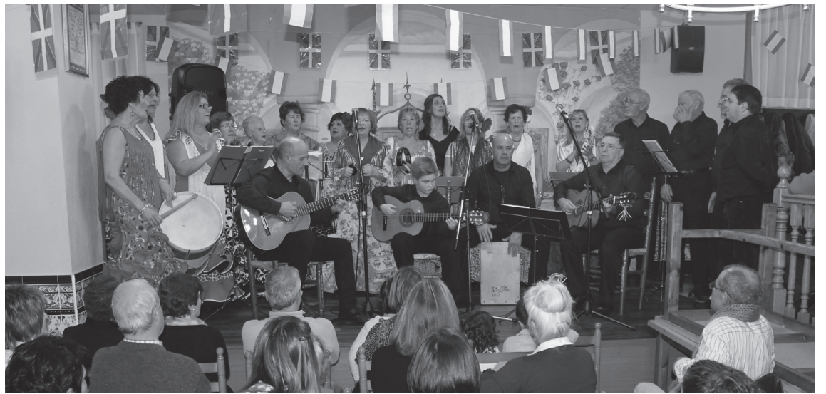
Andaluziar musika eta abestiak izango dira protagonista asteburuan zehar, Semblante Andaluz taldearen elkarteetan.

Igandean, goiz eta arratsalde Andaluziaren XXIII. eguna ospatuko dute igandean. Hori dela eta, egun horretan egingo dira egitarauan jasotako ekintza gehienak. Meza rozierorrek ekingo diote asteko azken egunari. Arantzazuko