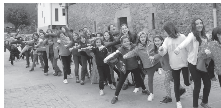
Lehenago urtean Larraulen izan ziren Gazte Klubeko gaztetxoak.

Ondoren, izen emate orria eta diru-sarreraren ordainagiria