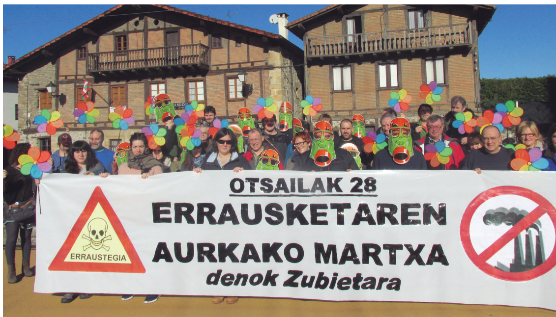
Errausketaren kontrako Mugimenduko kideek otsailaren 13an, Errausketaren aurkako martxa aurkeztu zuten Zubietan.

Lelo nagusia edo ekimen honen oinarrian dagoen filosofia 'Burua duenak ez du erraustegirik nahi bere herrian, eta bihotza duenak ez du beste inoren herrian nahi' da. Lasarte-Oriako Aire