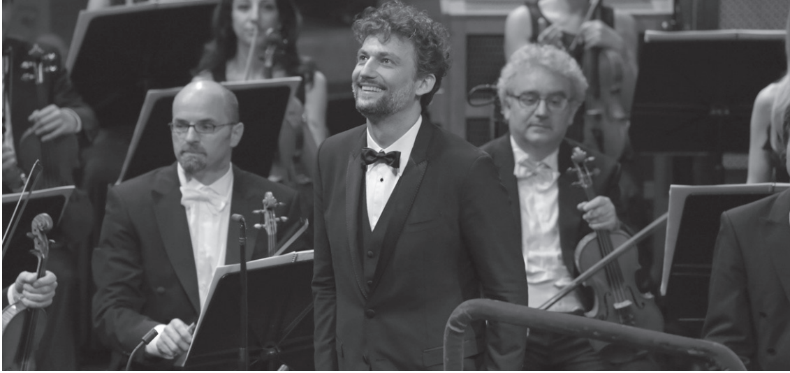
Kaufmann Scala Antzokian.