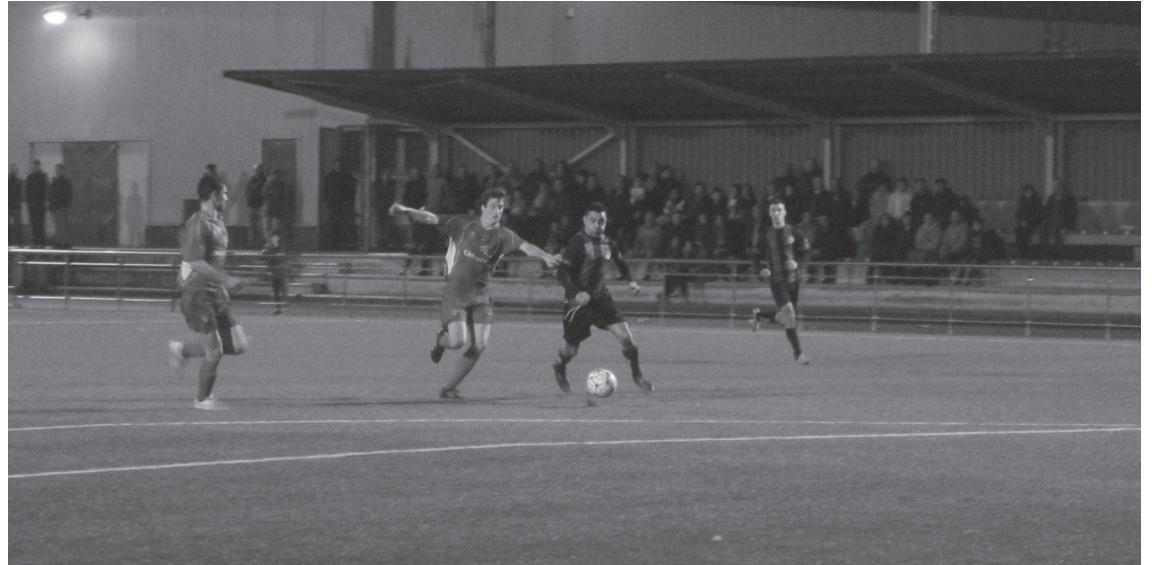
Britek egin zuen garaipenaren gola.

dua Ostadarri, nahiz eta hamarren aurka aritu. Handik gutxira etorri ziren andoaindarren beste bi kaleratzeak.