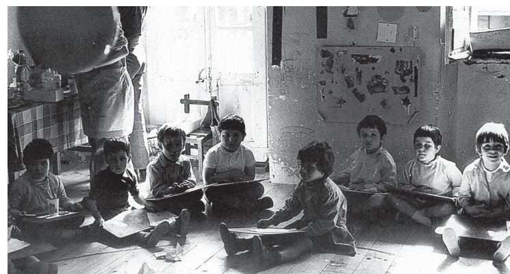
Landaberri ikastolaren lehen urratsak Aizpurua-Enea etxean eman ziren. A.E.

Beraz, oraindik izena eman nahi dutenek aukera dute, elkarteko bulegora astelehenean ostiralera 10:30etik 12:30era bitartean hurbilduz gero.