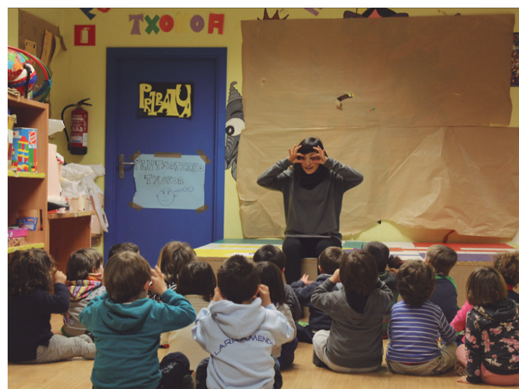
Ilargiari buruzko ipuina entzun zuten asteartean.

Hilabeteko iraupena izango du, aldiz, eskuak trebatzeko tailerrak. Hau da, martxoaren 17ra eta 18ra arte arituko dira asteazken eta ostegunero.