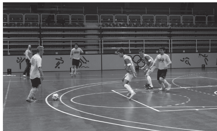
Bolada onean da ISU Leihoak taldea; azkeneko hiru partiduak irabazi ditu jarraian.