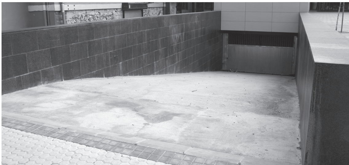
Okendo plazan 124 marra dira esleitu direnak. Horietatik 106 alokairuan eskainiko dira eta 18 kontzesioan.