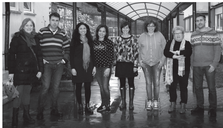
Burunzpe elkarteak, Koldo Mitxelena ikastolako eta BAIKARAko ordezkaria. BURUNZPE

eta 2014 urteetan, guraso elkarteak eskuratu duen Euskal Herriko Ikasleen Gurasoen Elkarteak erkidego mailan antolatzen duen Guraso Elkartearen hezkuntza-jarduera onen saria.