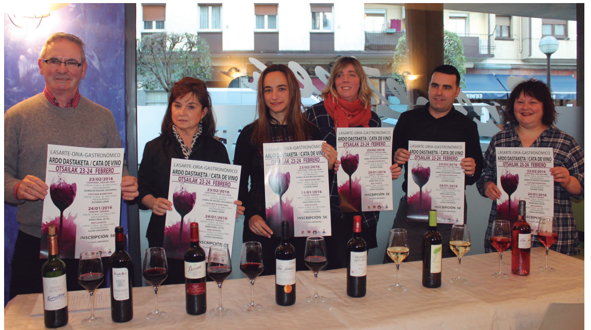
Aterpeko lehendakaria, ardo dastaketan parte hartuko duten tabernetako kideak eta udal ordezkaria aurkezpenean.

Marco Real upeldegia 1989an sortu zen eta Oliten