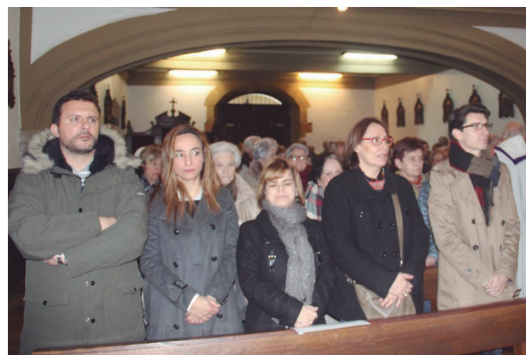
Eraketa bilkura egin zen Brigitarren komentuan meza ospatu zuten. TXEMA VALLÉS