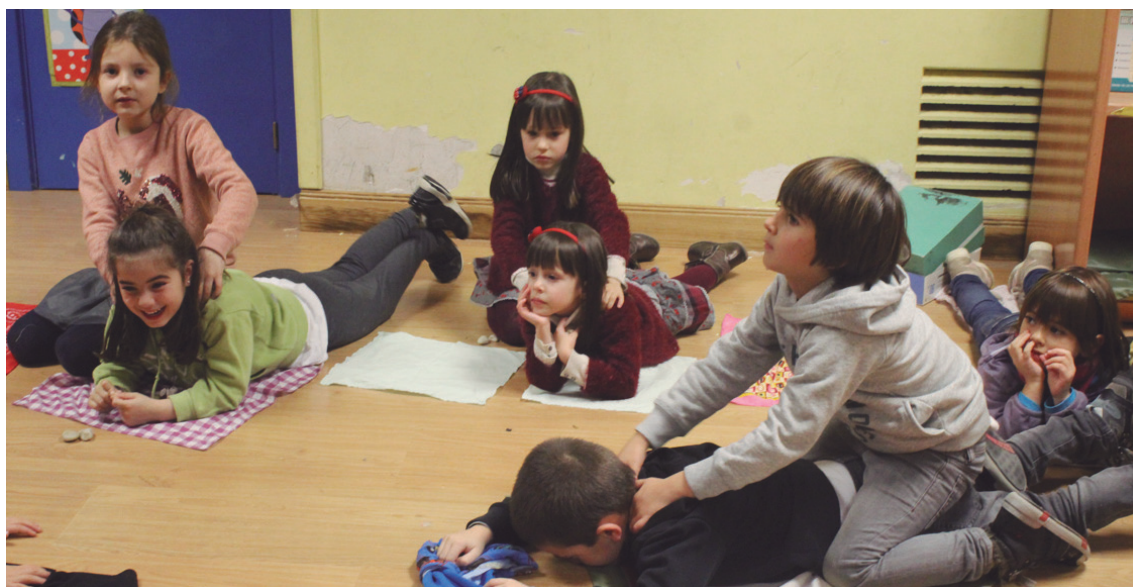
Masajeak egin dizkiote elkarri eskuak lantzeko tailerrean.

Tailerrak erantzun egokia jaso du. Izan ere, bai asteazkenetako baita ostegunetako saioak ere betetzear egon dira, eta oso plaza gutxi geratu dira libre. Gainera txikiak "oso gustora" aritu direla