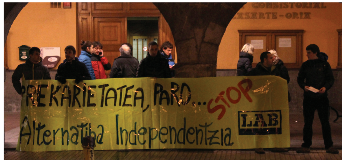
LAB sindikatuko kideek gure herrian dagoen langabezia eta prekarietatea salatzen hainbat ekintza egingo dituzte hurrengo hilabeteetan.

"Badirudi, langabezia eta prekarietatea euskal herritarrok ekidin ezin ditugun fenomeno naturalak direla. Baina ez da hala. Estatu espainiar-