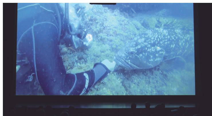
"El Mero Calimero" filmeko irudiak ikusten Manuel Lekuona kultur etxean.

Euskaraz proiektatu zuten "Ruta Molucas". Indonesiako Molucas Uharteetatik Lembah-ko itsasarteko arrezife arteko