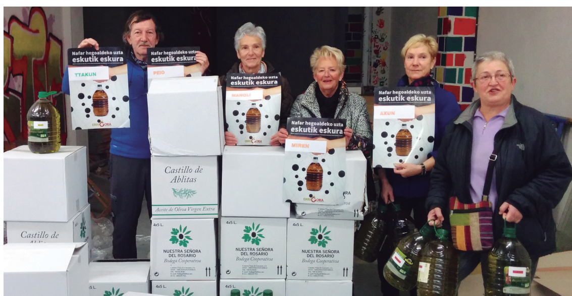
Iaz Errigora ekimenari 1.500 litro erosi zizkioten Lasarte-Oriako herritarrek.

Oliba olio eskaera egin nahi duenak errigora.eus orrialdean edo herriko hainbat lekuetan egin ahalko du: Ttakun kultur elkarte, Muntteri-AEK euskaltegia edo