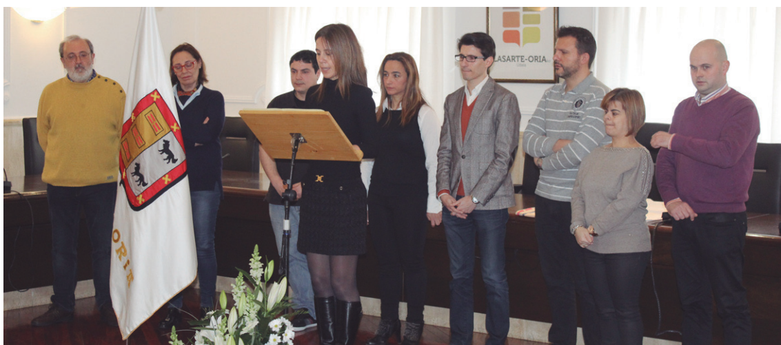
Egungo alderdietako ordezkariak udalerrriaren eraketa akta irakurri zuten.